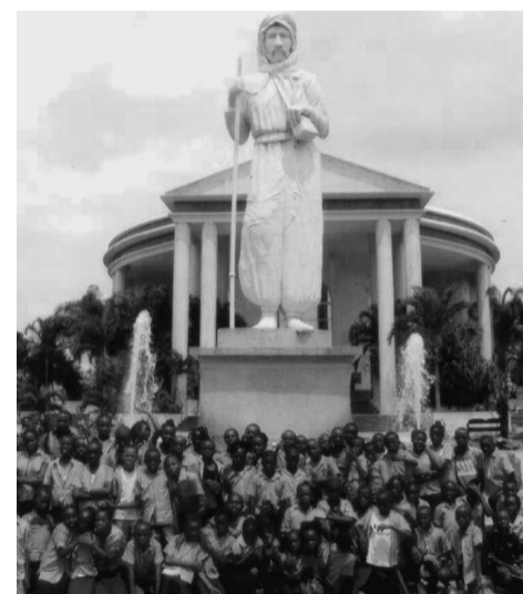
Les élèves à l'entrée du mémorial