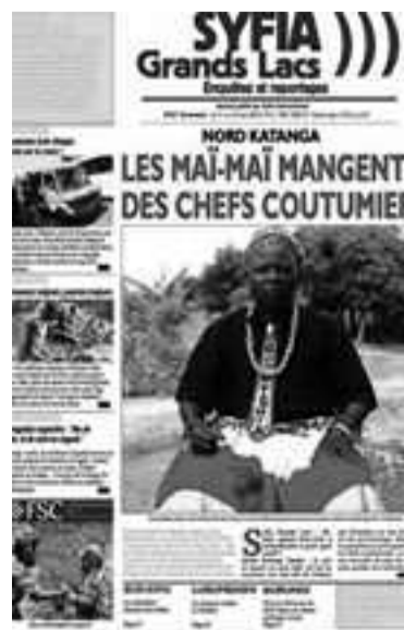
Un exemplaire du bimensuel Syfia Grands Lacs

Bukavu est le premier lieu où Syfia Grands Lacs s'est mis à l'ouvrage. La cible du bimensuel, rapporte Radiookapi.net, sont « les élèves du degré terminal du secondaire ». Cette initiative partie du constat des enquêteurs et reporters du journal sur la faiblesse de la pratique de cette activité dans ce milieu entend renverser la vapeur ou, tout au moins, susciter un nouveau comportement. Car cette prise « en main » du problème via « Une école, un journal », souligne la radio tient au fait « que la jeunesse a presque totalement abandonné la lecture ».