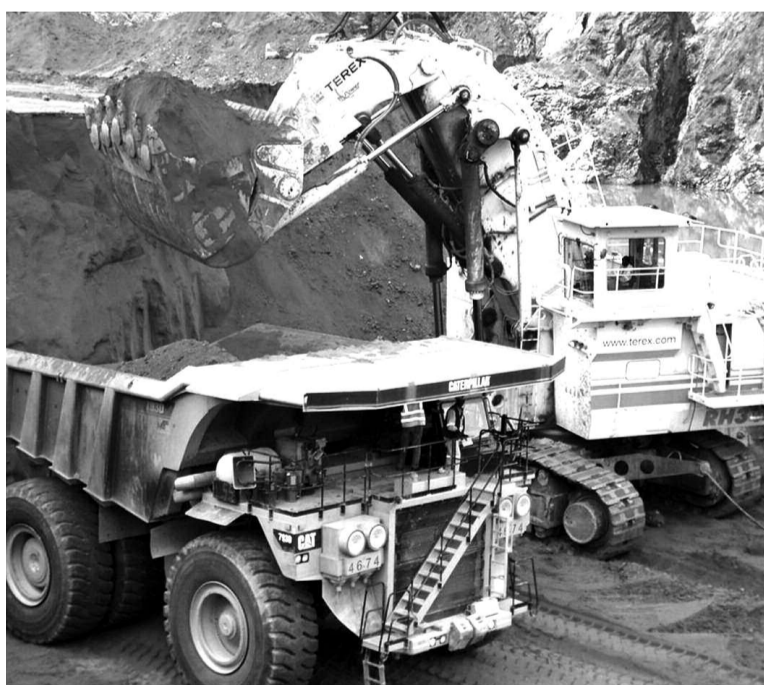
Une mine dans le Katanga

Ces organisations estiment, par contre, que ce temps doit être mis à profit pour améliorer la mise en œuvre du processus et revisiter les rôles des organes de sa mise en œuvre. L'objectif étant, selon ces ONG, d'amener chacun d'eux à accomplir effectivement les attributions qui lui sont reconnues par les textes régissant l'Itie en RDC. Dans cette optique, ces organisations ont relevé l'urgence de l'évaluation de la mise en œuvre de l'Itie pour que les parties prenantes puissent identifier les forces et les faiblesses de la mise en œuvre et du fonctionnement