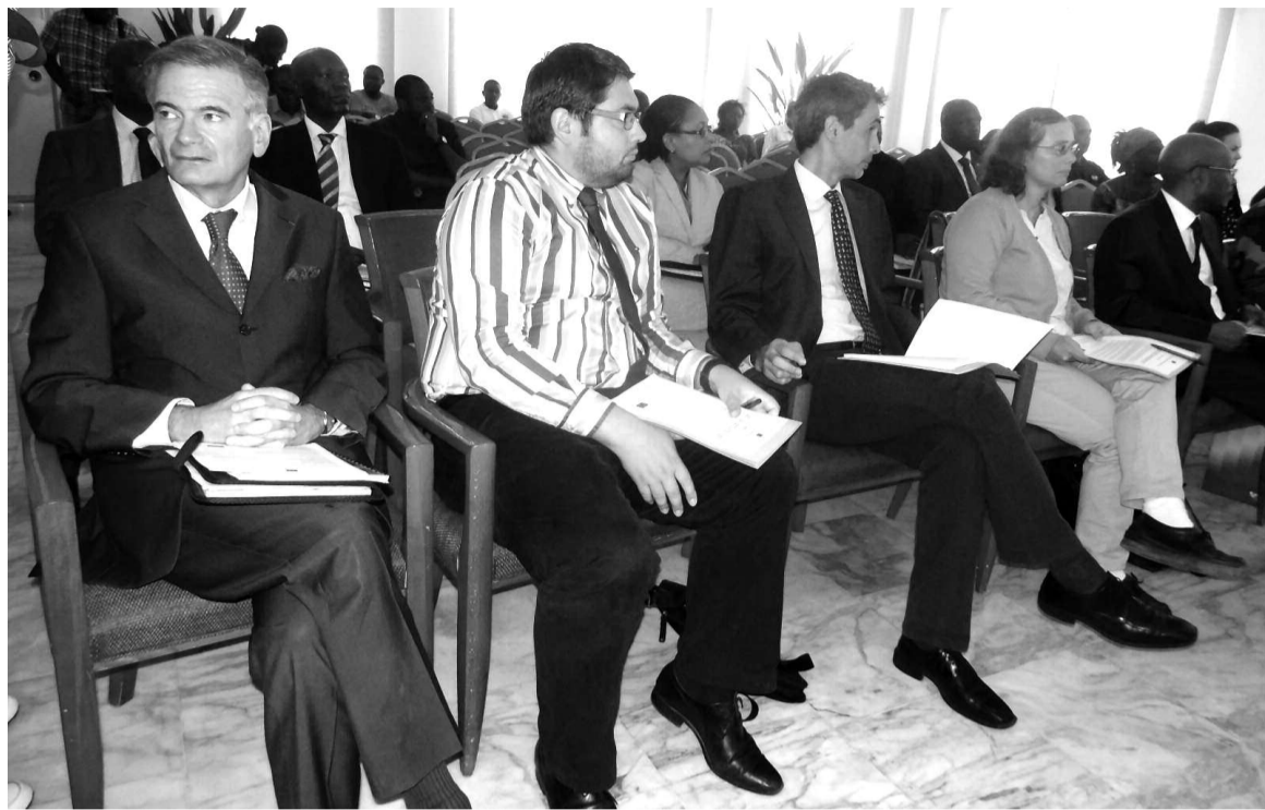
Le public présent à la restitution

Le document poursuit en invitant le Gouvernement du Congo à procéder à une réévaluation des risques qui subsistent en vue de déterminer et exécuter les actions de déminage et de dépollution susceptibles de lever ces risques. « Malgré des résultats jugés positifs, la Délégation de l'Union européenne voudrait attirer l'attention des autorités publiques et de la société civile sur la nécessité de poursuivre les actions de dépollution