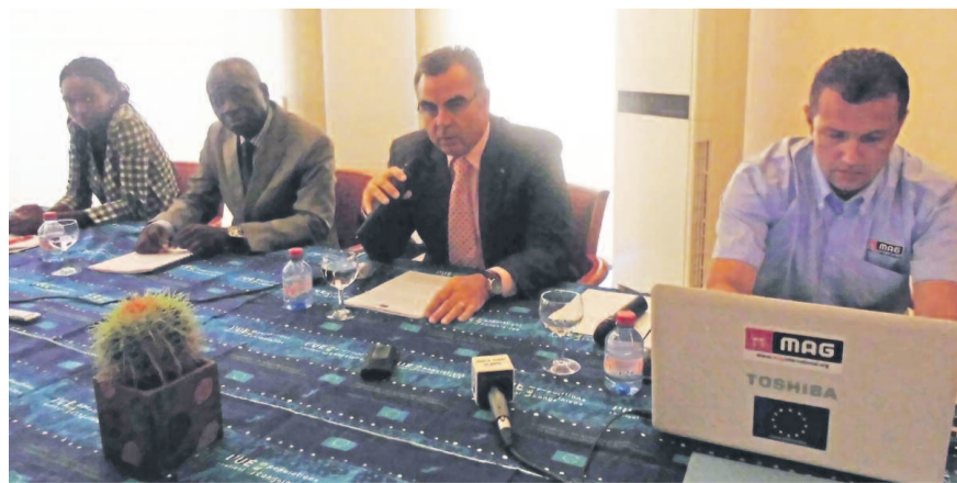
Une vue des conférenciers

La Délégation de l'Union européenne, principal soutien financier de l'opération, vient de publier un rapport sur la dépollution menée dans la zone des explosions de dépôts de munitions, le 4 mars 2012 au quartier Mpila à Brazzaville. « Malgré l'important travail des partenaires, des munitions subsistent encore en profondeur. Ces munitions pourraient représenter un danger compte tenu notamment du projet de construction de bâtiments nécessitant des fondations en profon-