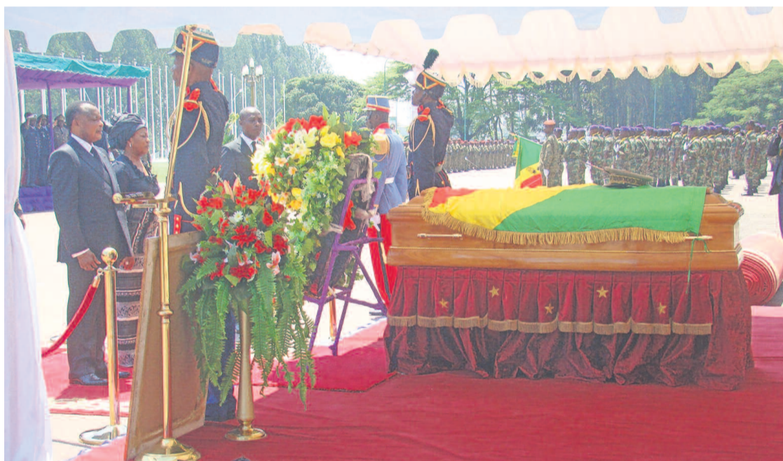
Le chef de l'État déposant la gerbe de fleur