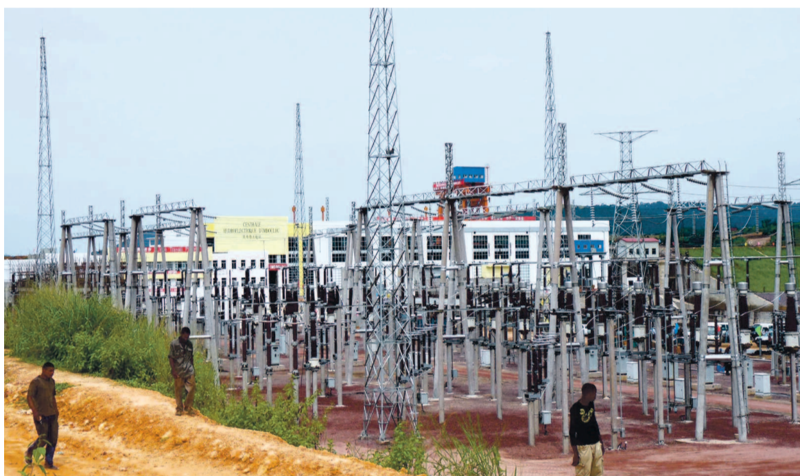
Les installations électriques du barrage d'Imbolou