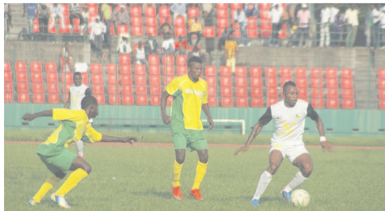
Une offensive menée par un attaquant des Diabes noirs

match nul face à Jeunesse Sportive de Talangaï (JST) 2-2. Poba ouvrait le score à la 7 e minute pour JST. Mboubaleka égalisait à la 13 e