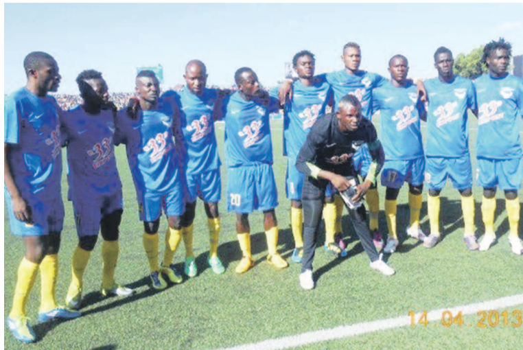
Le FC Saint-Éloi Lupopo, tombeur du DCMP à Kinshasa

Ce but suscite une vive réaction des joueurs de V.Club qui se sont précipités tous vers l'arbitre Martin Mukala du Kasai oriental pour lui signifier que le gardien Lomboto a été bousculé par un joueur de Mazembe à la retombée du ballon. Les policiers montent sur l'aire de jeu pour calmer les esprits et protéger l'arbitre visiblement très menacé. Après pratiquement cinq minutes d'arrêt de jeu, la partie a repris et les joueurs de Florent Ibenge ont tenté de revenir au score, sans succès, l'image de la dernière balle arrêtée