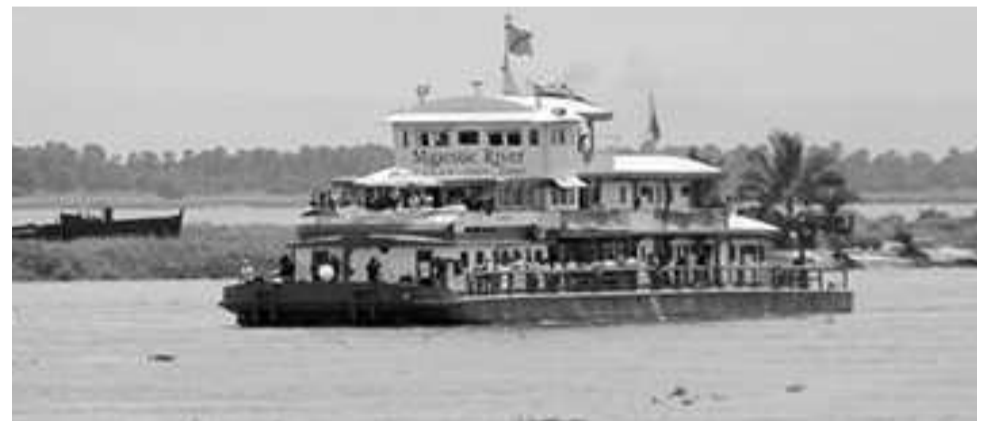
Un bateau sur le fleuve Congo, entre Kin et Brazza

Le débarcadère et le ponton, faits pour des grands bateaux et barges à destination de l'arrière pays, présenteraient des risques d'accidents aussi bien pour les bacs que pour les passagers.