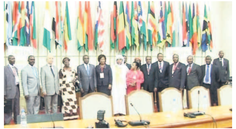
Photo de famille des ministres du Codepa

En effet, un certain nombre de résolutions ont été prises. On ci-