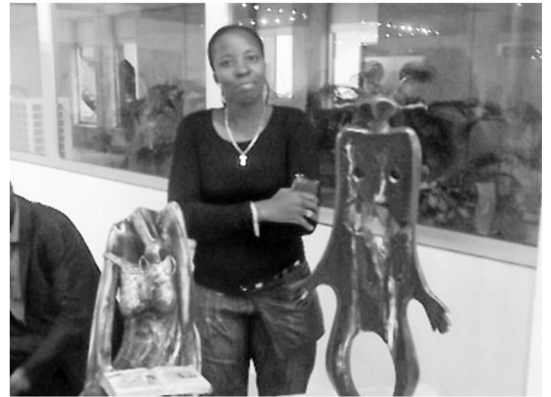
Licence et Victime, sculptures de Mode Mpane

Depuis l'exposition Échos de la femme du 26 avril jusqu'au 25 mai, le centre culturel de la Trust merchant bank offre à ses hôtes un visa d'entrée dans l'univers de Mafolo, Mbemba, Mukendi, Mpane et Tezo.