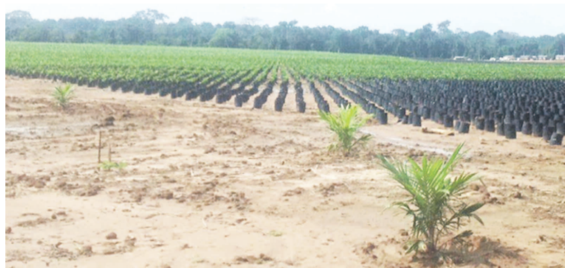
Pépinière de la palmeraie

Le président de la République, Denis Sassou N'Gusso a lancé officiellement, hier, le projet de plantation d'une palmeraie développé par la société malaisienne Atama Plantation. Situé entre la localité de Yengo, dans