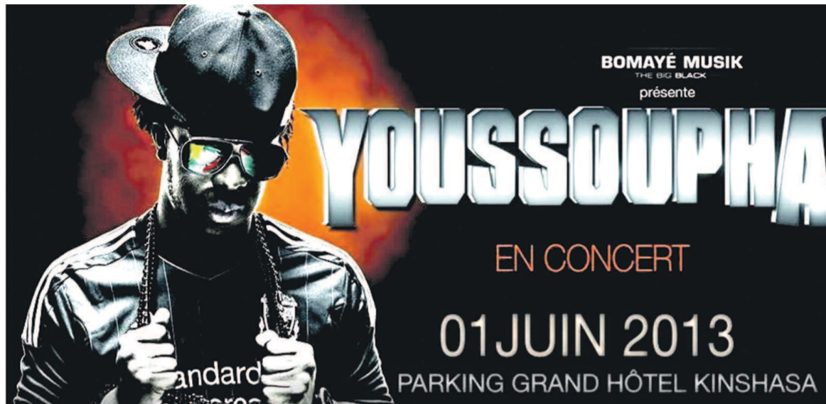
L'affiche du concert