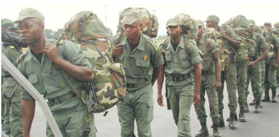
Les soldats congolais montant dans l'avion