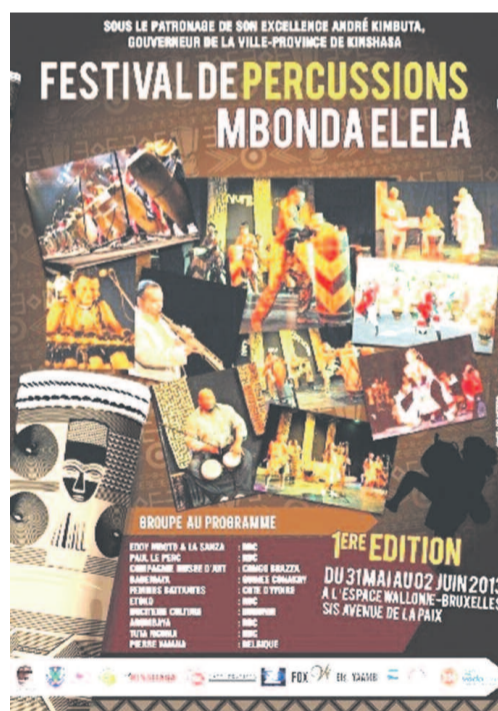
L'affiche du Festival des percussions Mbonda Elela

Il va y avoir de l'animation ce week-end sur l'avenue de la Paix avec les dix groupes tenus d'y prester à dater de ce vendredi jusqu'à dimanche.