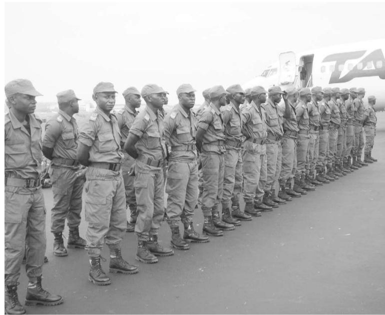
Les soldats congolais reçoivent les dernières consignes

Ce premier module du contingent congolais en renfort pour la Mission de consolidation de la paix en Centrafrique (MICOPAX) prendra part à une mission opérationnelle de maintien d'ordre placée sous l'autorité de la Communauté économique des États de l'Afrique Centrale (CÉÉAC)