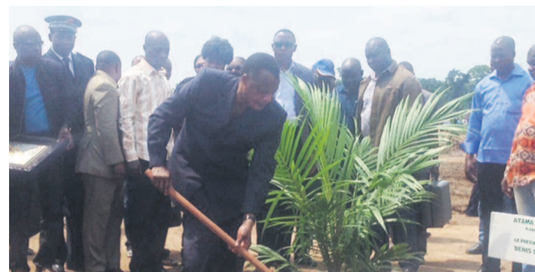
Le chef de l'État lançant le planting sur le site de Yengo