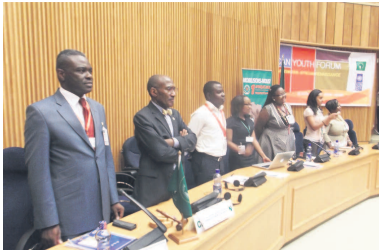
Anatole Collinet Makosso, Martial De-Paul Ikounga et les jeunes

La rencontre a servi de plateforme de dialogue entre certains chefs d'État africains et les jeunes. Elle était axée sur les principales initiatives politiques africaines, relatives à l'implication des jeunes dans la sphère de prise de décision ainsi que dans le processus de la renaissance panafricaine. Ces politiques sont destinées à préparer les nouvelles générations à un leadership responsable. « Avec plus de 41 % de jeunes de moins de 15 ans et environ 70 % de 0 à 35 ans contre 30 % de plus de 60 ans, l'Afrique est le continent le plus jeune du monde. Ceci, comparativement à l'Europe dont les moins de 15 ans rivalisent avec les