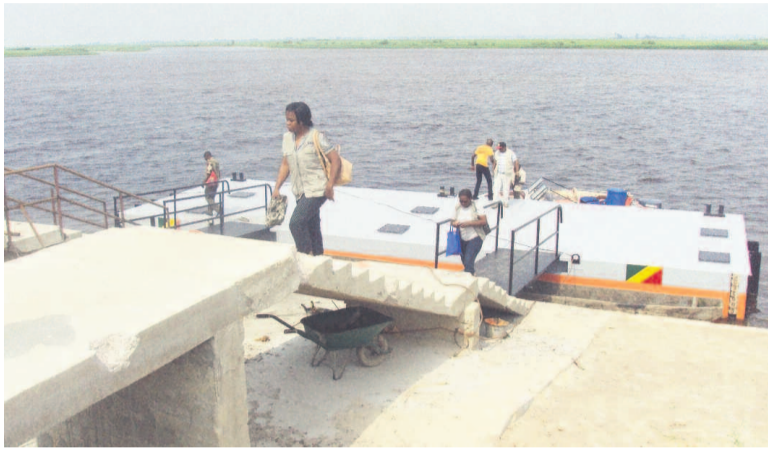
Le débarcadère de Makotipoko presque achevé

Réceptionné provisoirement en fin d'année dernière, cet ouvrage pourrait être ouvert au public avant le 8 juin prochain. La mission de supervision de la Banque mondiale (BM) est allée constater l'état d'avancement des travaux démarrés en 2011.