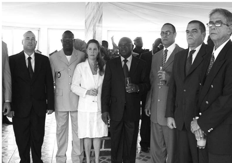
Le ministre et les experts

tion des flux migratoires ; d'adapter des méthodes et techniques de travail aux exigences nées de la complexité des flux migratoires dans le monde et d'assimiler l'expérience cubaine à la