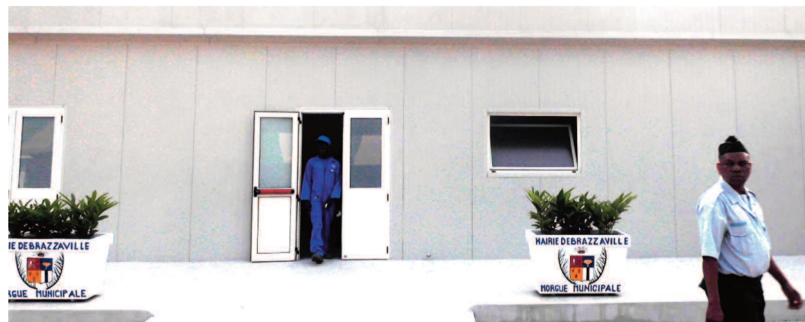
Une vue du bâtiment de la nouvelle morgue

Le député maire de la ville de Brazzaville, Hugues Ngouelondélé a supervisé hier la réception officielle du premier module de la nouvelle morgue municipale. Ce compartiment porte la capacité d'accueil à 240 casiers. Le second module d'une capacité similaire est en cours d'achèvement. Dans