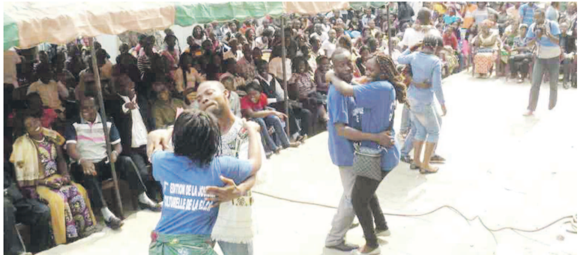
Les étudiants exécutant des danses

C'est sur le thème « Université, une vision pour le développement » que s'est tenue, devant une pléiade d'étudiants, la quatrième journée culturelle de Bayardelle, le 15 juin dans l'enceinte de la faculté des lettres et des sciences humaines (FLSH).