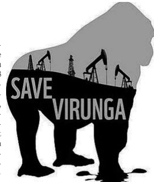
Une affiche de la lutte contre l'exploration forestière dans les Virunga

Ces ONG ont aussi noté que « la conservation de ce parc est un enjeu mondial, Il apporte aussi des moyens de subsistance essentiels aux communautés locales ». Il serait donc, selon elles, nécessaire d'élaborer un scénario alternatif de développement, qui soit durable sur le long terme, et qui apporte