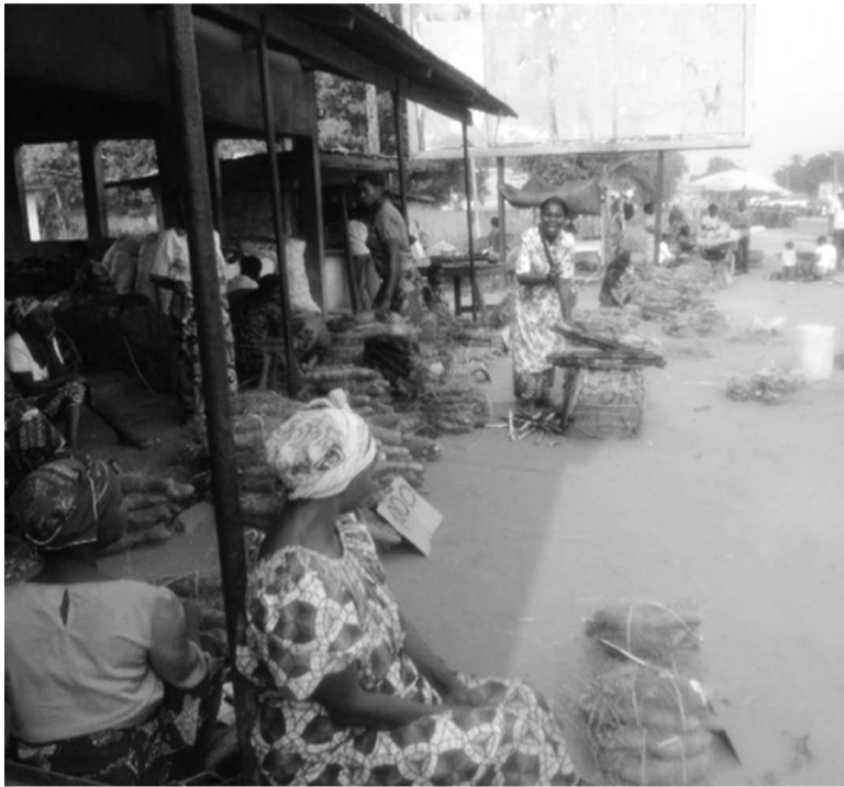
Des vendeuses de Gamboma le long de la Nationale 2

Devant la place du marché qui tient lieu de gare routière au cœur de la cité de Gamboma, sur la route nationale numéro 2, l'ambiance est très commerçante. De fait, l'essentiel des échoppes, en majorité tenues par des ressortissants ouest-africains, se trouve ici. La vie elle-même, dans le chef-lieu du plus grand district du département des Plateaux, a pour point de mire cette station et le long du bitume qui le traverse, éclairé de nuit grâce à Imboulou.