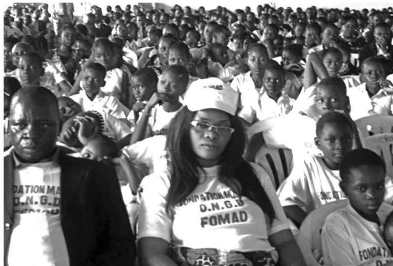
Les encadreurs et les enfants lors de la commémoration de la Journée de l'enfant africain

fastes, la RDC dénonce la mutilation génitale faites aux filles, la remise forcée de la petite fille enceinte dans la famille de l'auteur de la grossesse, le mariage précoce allant jusqu'à la dot du fœtus, le mariage prédestiné où la fille est d'office réservée à l'homme, l'inceste où les oncles, les pères, les frères et les cousins violent leurs nièces, sœurs ou cousines,