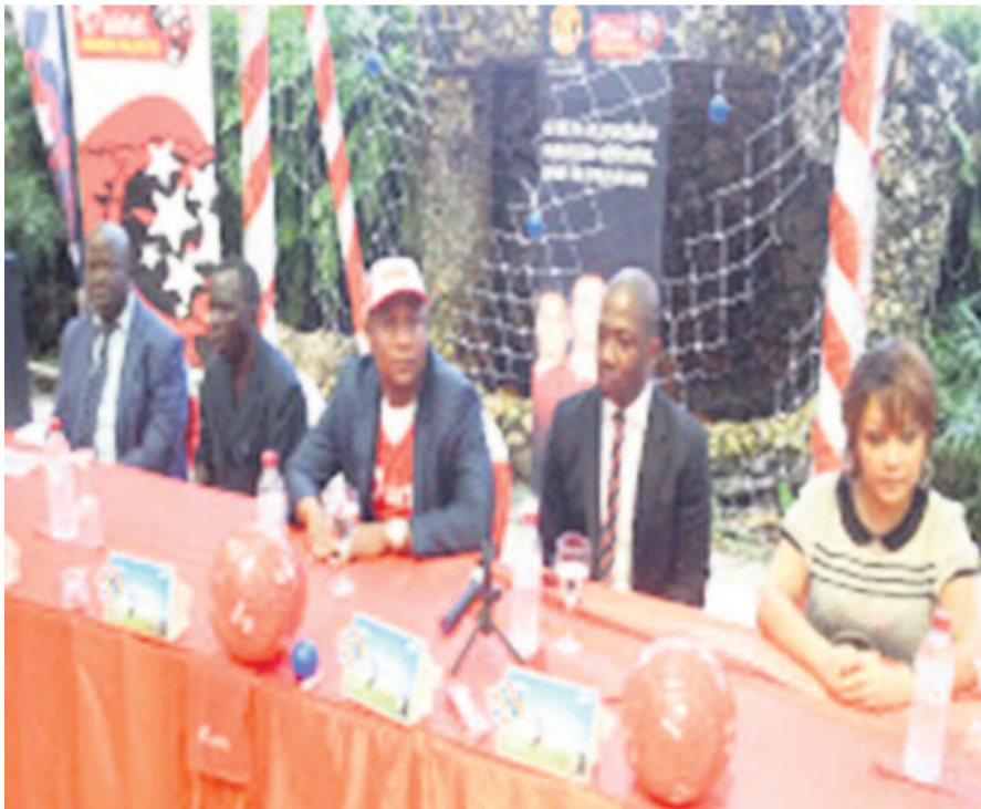
Une vue d'ensemble des participants

Airtel prône l'égalité des chances : le tournoi permet donc aux filles et aux garçons de participer. Afin de s'assurer que les fans à travers le continent aient la possibilité de voir les dribbles éblouissants des jeunes talents africains, Airtel a signé des contrats de diffusion avec SuperSport et Canal Plus. Pour plus d'informations, consultez notre site web ( www.airtel-football.com )