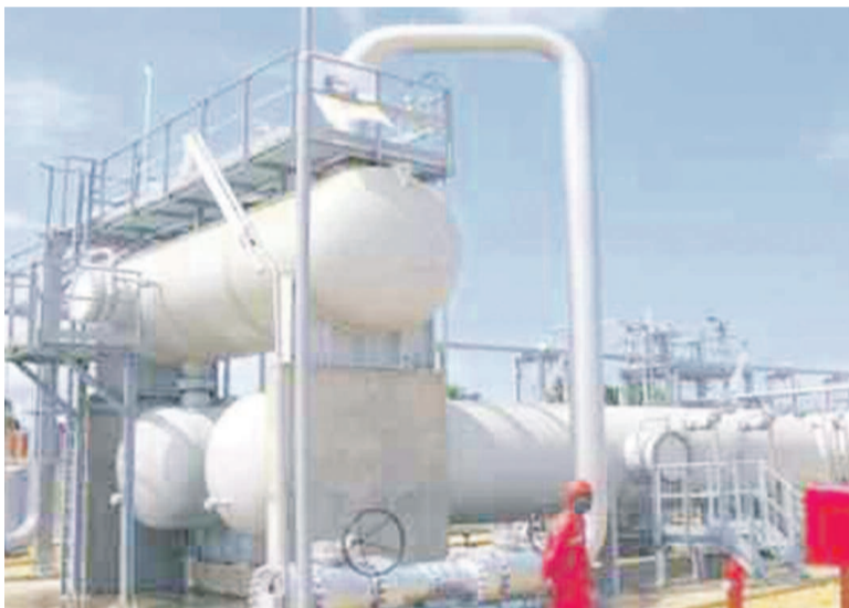
La centrale à gaz de Djeno