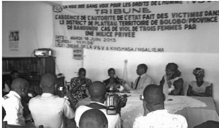
Les victimes et les responsables de la VSV devant la presse

Dans leur récit, ils ont tous noté qu'ils ont été appréhendés le 25 mai, alors qu'ils entreprenaient un voyage à pieds pour des soins médicaux vers la localité de Nko. Arrivés à la hauteur de la rivière Mbali, ils ont été interceptés par un groupe d'une trentaine de personnes déguisées et armées de machettes, couteaux, lance flèches, fu-