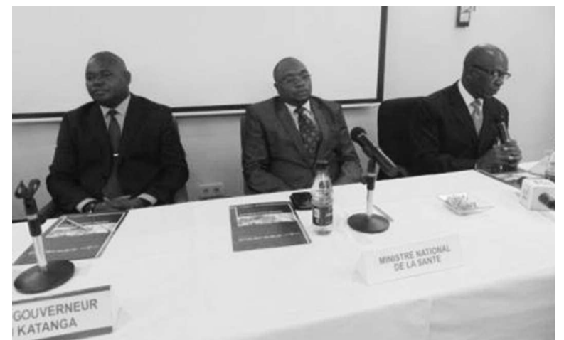
Le ministre de la Santé, Dr Félix Kabange Numbi, (au milieu) lors de l'ouverture de la conférence nationale sur le sida et les IST

Dans la lutte contre le sida, Dr Félix Kabange Numbi pense que le public doit être pris en compte. Pour ce faire, il demande aux participants de s'appesantir sur le public, car l'atteinte de l'ob-