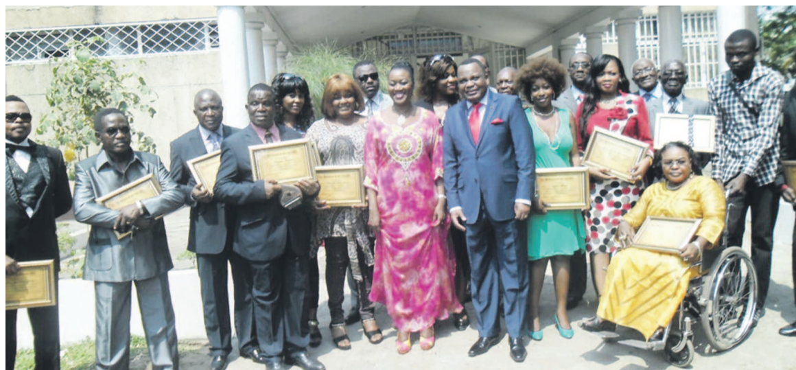
Photo de famille avec les artistes primés

Il a reconnu en tant que mélomane que le travail des artistes, des écrivains et des intellectuels a été déterminant dans la prise de conscience historique et politique des peuples d'Afrique noire. Il a pris pour illustration des chansons célèbres comme : Indépendance chacha ; Bato ya Congo ; Tongo étani ; Mokili eko tourner mal ;