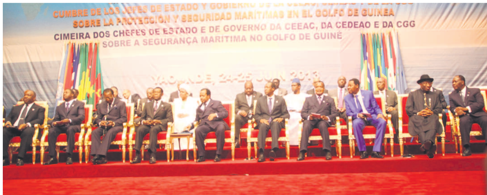
Les chefs d'États à l'ouverture du sommet

Plusieurs chefs d'État d'Afrique de l'ouest et du centre, dont Denis Sassou N'Guesso du Congo, prennent part depuis hier, à Yaoundé au Cameroun, à un sommet sur la piraterie et les vols à main armée