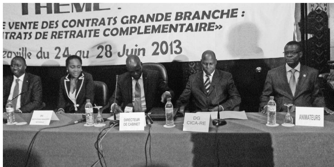
La tribune du séminaire sur le système de retraite complémentaire

Appelée retraite complémentaire, celle-ci est à souscrire auprès des compagnies d'assurance. Elle est ouverte aux salariés issus du secteur public ou privé. La problématique est au centre d'un séminaire ouvert le 24 juin à Brazzaville.