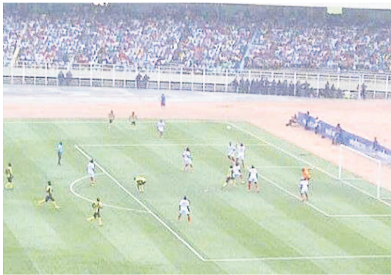
Vue du match V.Club-DCMP du 23 juin