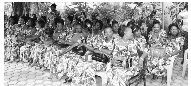
Le personnel féminin de la Maison militaire lors de la cérémonie de retrait de deuil

Pour l'ensemble du personnel, le deuil porté en mémoire de leur ancien chef est l'expression d'une reconnaissance