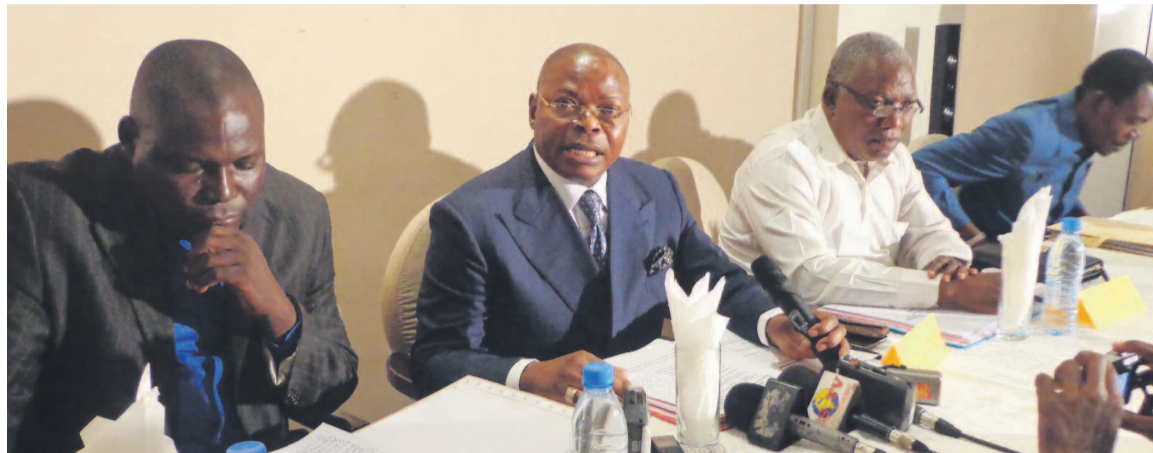
Le président de la Fécoka-Ama donnant des orientations.