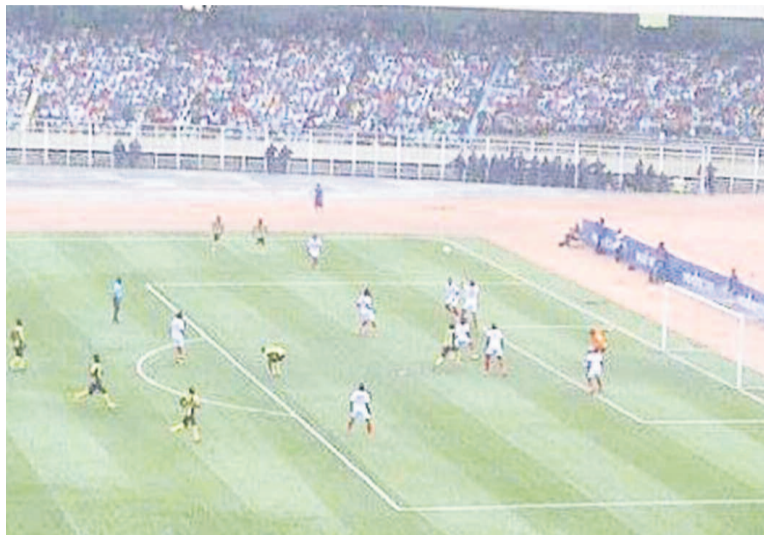
Vue du match V.Club-DCMP du 23 juin