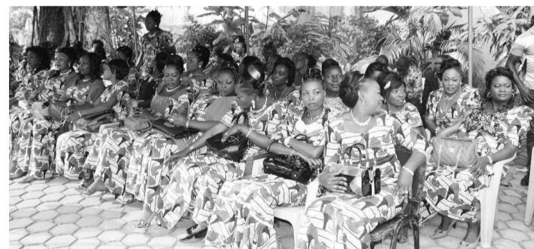
Le personnel féminin de la Maison militaire lors de la cérémonie de retrait de deuil

Pour l'ensemble du personnel, le deuil porté en mémoire de leur ancien chef est l'expression d'une reconnaissance