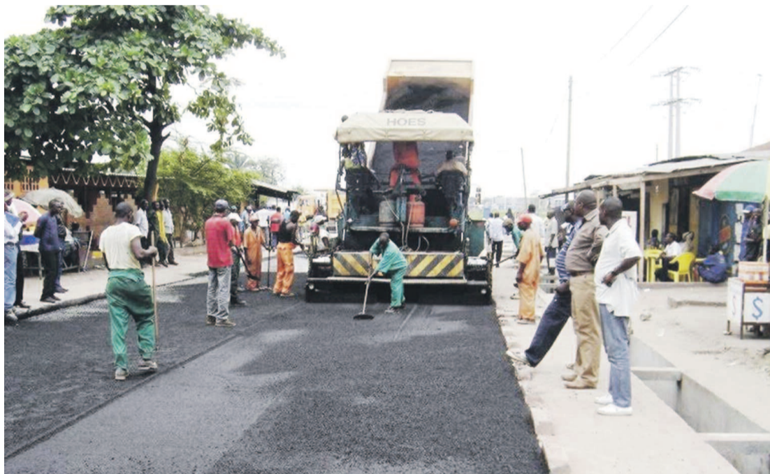
Travaux de réhabilitation d'une route à Kinshasa