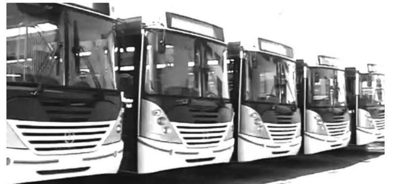
Les bus achetés par le gouvernement

Aussi pour maintenir la tendance ainsi que le satisfecit général, le gouvernement via le ministère des transports a décidé de conclure un partenariat avec des exploitants privés œuvrant dans le domaine de transport en commun. Un partenariat public-privé assorti des clauses claires à respecter est censé désormais soutenir la collaboration entre parties. Huit cents exploitants privés remplissant des critères préalablement définis sont concernés par ce nouveau type de collaboration au travers duquel le gouverne-