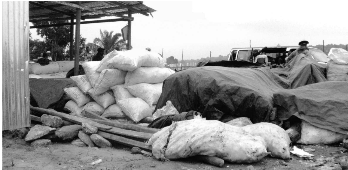
Des sacs de fofou sur le nouveau site du pont de Mikalou

Certains vendeurs avouent n'avoir pas été avertis sur le transfert du site. « Je suis surprise que nous soyons installés ici près du pont pour vendre. Je savais que le contrat devait expirer le 4 juillet, mais ce que je demande au propriétaire c'est de garder nos produits en bon état en cas de pluies », a confié une vendeuse.