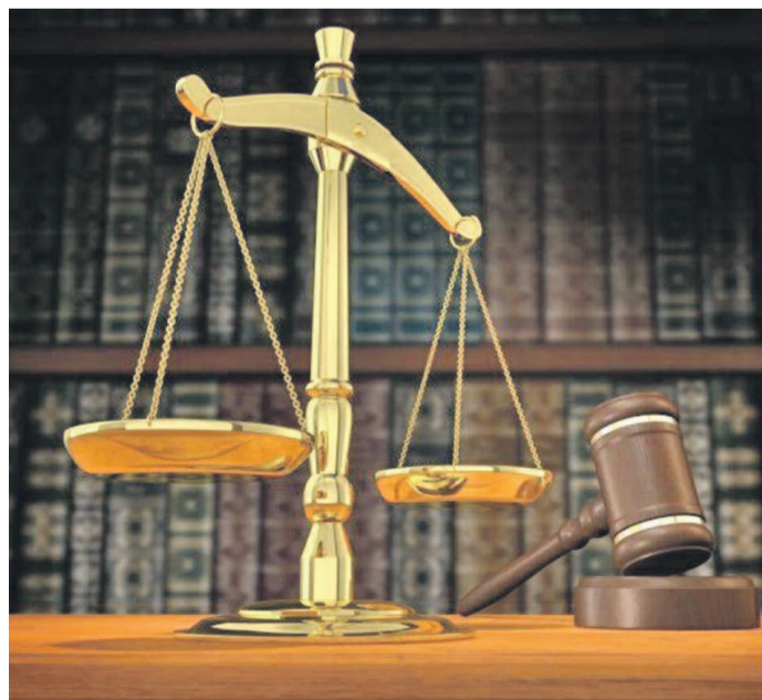
Symbole universel de la justice