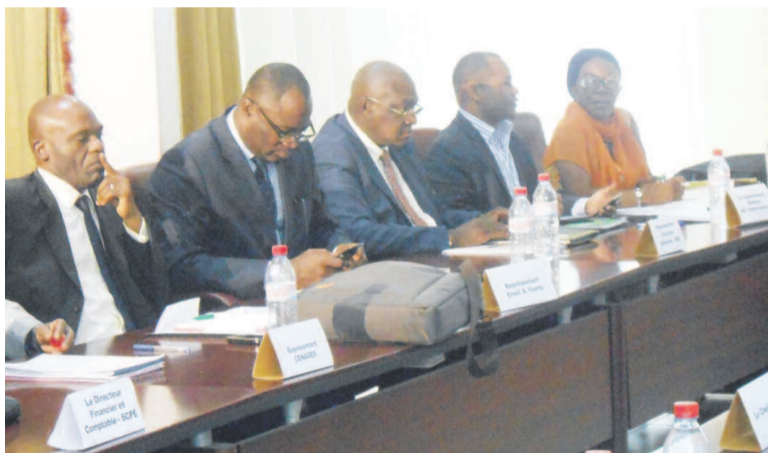
Vue partielle du personnel de la SCPE