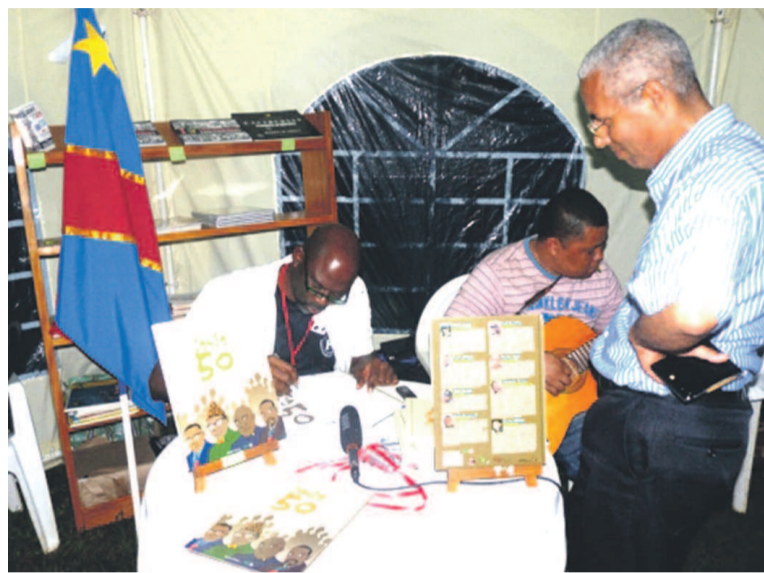
Séance de dédicace de la BD « Congo 50 »

Par ailleurs, le bédéiste affirme s'être également réjoui d'avoir vu les couleurs nationales flotter allègrement au « côté de celles d'autres pays invités, notamment la France, les États-Unis, le Gabon, la Tanzanie, le Nigeria, la Tunisie, l'Ile Maurice, l'Afrique du Sud