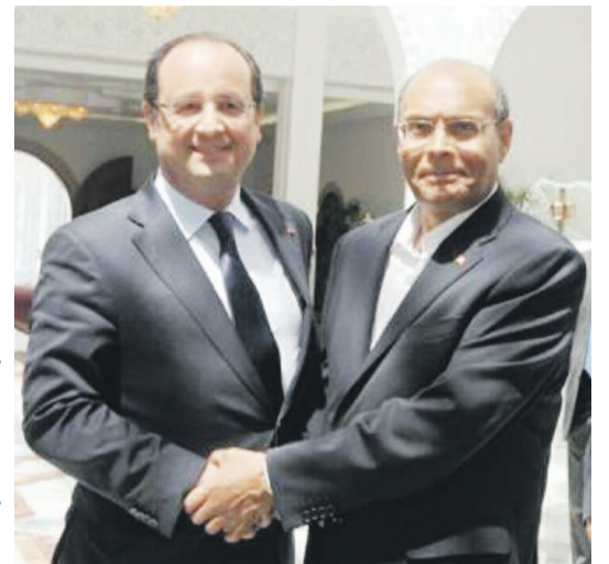
François Hollande et son homologue tunisien

« Le meilleur service que l'on puisse rendre à la Tunisie, sans ingérence, c'est de dire que quand on veut faire une révolution, la transition vers la démocratie, quand on veut une Constitution qui sera une référence pour l'ensemble de la région et du monde arabe, alors il convient d'anticiper », a déclaré le président français. Il s'agit