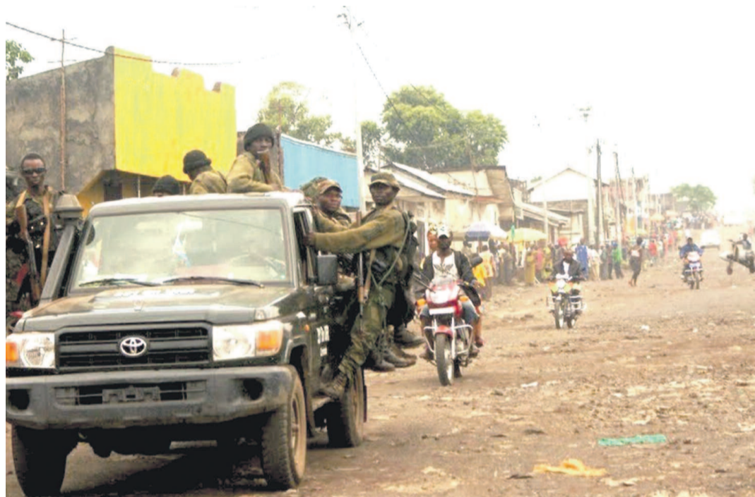
Le M23 après la prise de Goma en novembre 2012

Kibati, un des groupements du territoire de Nyiragongo situé à 11 km au nord de Goma, a été le théâtre d'affrontements entre des jeunes surexcités et les rebelles du M23 dans la matinée de samedi, apprend-on. Venus de Kanyaruchinya et munis d'armes blanches, les assaillants dont le nombre n'a pas été déterminé ont assiégé les positions rebelles. Ils ont franchi la ligne de démarcation entre les Fardc et le M23 pris de court par cette attaque-surprise. Il s'en est suivi, d'après des sources, un accrochage qui a dégénéré au point de contraindre la population à se déplacer vers les localités environnantes.