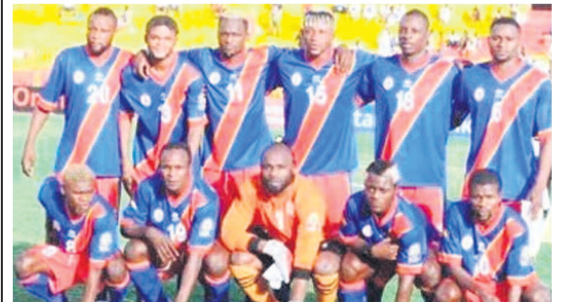
Les Léopards locaux de la RDC