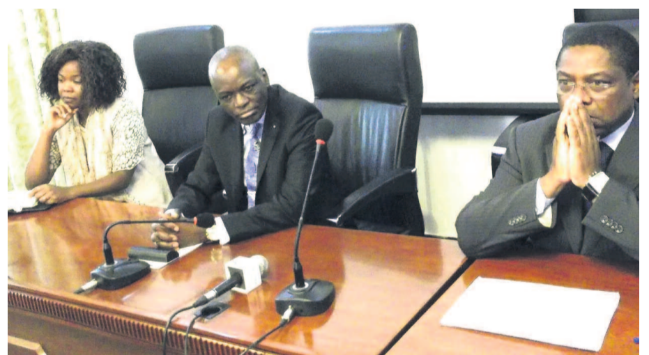
Le présidium au cours de l'atelier technique

politiques publiques. À cet effet, l'Organisation des experts comptables africains conduira durant deux semaines une mission conjointe pour la pérennisation de cette action. « La Cémac a mis en place des directives relatives aux lois de finances. Chaque État membre doit mettre en place les politiques publiques. Pour rendre effective cette opération, tous les départements ministériels doivent s'im-