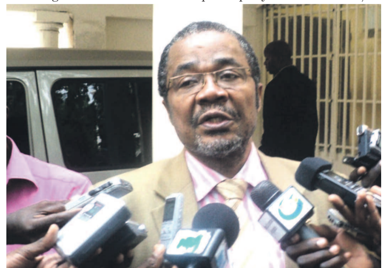
L'ancien secrétaire général adjoint de l'OUA répondant à la presse

***Les compétences et connaissances pratiques en anglais et en informatique seront testées.*** Pour de plus amples informations, concernant cette offre d'emploi, prière de visiter notre site internet: http://brazzaville.usembassy.gov/job-opportunities.html . Ou de contacter le Bureau des Ressources Humaines aux numéros suivants: 06-612-2000/06-612-2073/06-612-2133 ou par courrier électronique (E-mail) à l'adresse suivante : BrazzavilleHR@state.gov Veuillez adresser vos candidatures en Anglais uniquement. AU: Management Officer U.S Embassy – Brazzaville, Boulevard Denis Sassou N'Guesso N°70-83 Section D (Face Maternité Blanche Gomez) Baongo, Centre-Ville. Brazzaville, Republic of Congo Merci pour votre intérêt et Bonne chance!