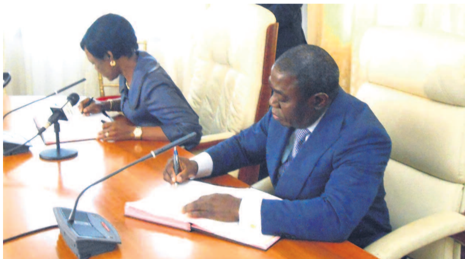
Signature de l'accord par les deux ministres