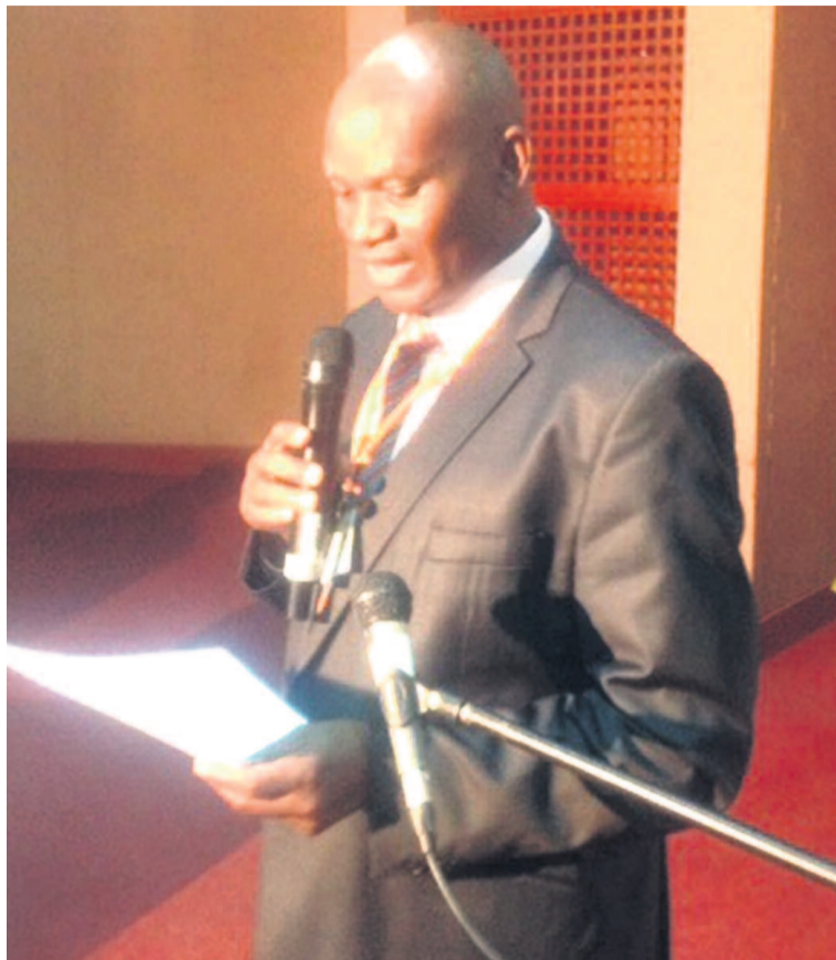
Lecture de la déclaration de Bujumbura par un participant

sûre du développement des médias ». En d'autres termes, en assurant une formation de qualité à leurs employés, en garantissant la continuité de l'entreprise par la