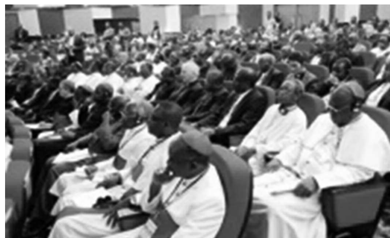
Une vue du SCEAM de Kinshasa