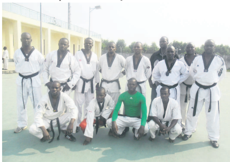
Les entraîneurs nationaux nommés.

quelles ils participeront, dont les Jeux africains de 2015 constituent le point culminant.