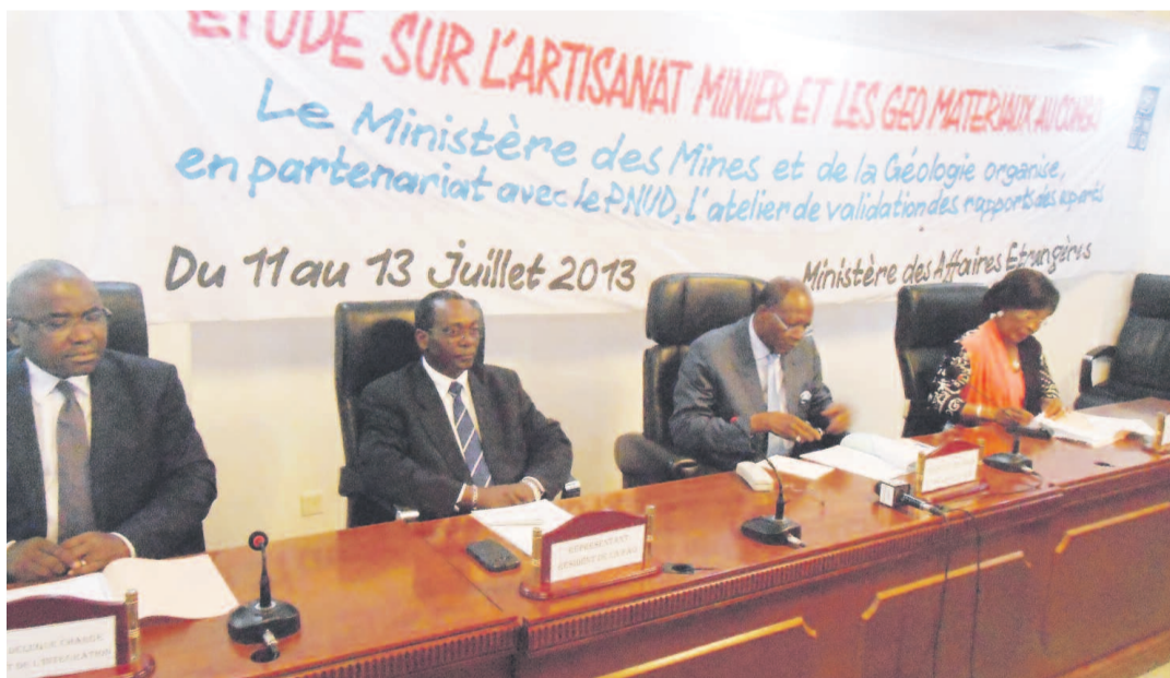
Le ministre Pierre Oba ( 3e à partir de la gauche) et les autres membres du présidium

Réalisées sur demande du gouvernement, les études menées dans ce sens, durant deux ans sur l'ensemble du territoire national, ont été validées le 15 juillet à Brazzaville.