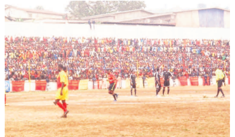
Vue d'un match d'Élima au stade Socol de Boma

Le club de Matadi, accompagné par la Ligue provinciale de football du Bas-Congo, est allé à l'instance nationale du football pour contester la décision de la Ligue nationale de football de lui avoir collé treize forfaits.