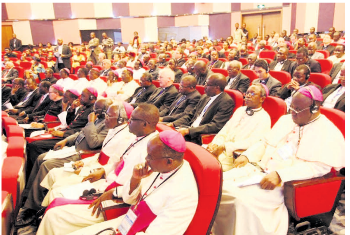
Les évêques au Symposium de Kinshasa

Aussi ont-ils exhorté le peuple africain à « s'engager dans le combat pour un ordre juste où chacun peut jouir des droits liés à sa dignité humaine dans tous les domaines de la vie ». Ils ont aussi stigmatisé l'appropriation du pouvoir dont se prévalent les dirigeants africains faisant ainsi fi de la misère de leurs peuples.