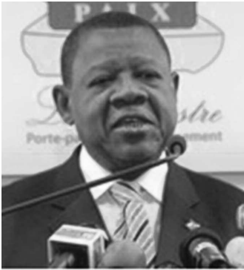
Lambert Mende Omalanga, porte-parole du gouvernement

Faisant l'économie des affrontements qui en ont résulté du fait de la réplique des Fardc réservée aux assaillants, Lambert Mende a indiqué que « 120 éléments des forces négatives assaillantes ont été tués et une douzaine d'entre eux capturés par les forces loyalistes ». Et le ministre d'ajouter que dans leur progression, les Fardc ont également pu reconquérir quelques positions de l'ennemi qui a fui vers Kilimanyoka à proximité de Kibati. Pour Lambert Mende, ce nouveau développement atteste de la volonté des rebelles du M23 et de leurs parrains à saper tous les ef-