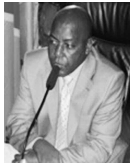
Le ministre des Mines, Martin Kabwelulu

avril, un décret du ministre des Mines avait donné un sursis de quatre-vingt-dix jours aux compagnies minières pour écouler leur stock.