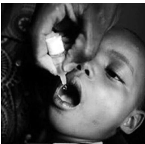
Un enfant recevant deux gouttes de vaccin polio oral

Mais les résultats de la première journée, dans la zone de santé de la Gombe, n'ont pas été fameux. Les vaccinateurs n'ont pas atteint le nombre d'enfants escompté, qui était de deux cents enfants au moins. En outre, la supervision des activités sur le terrain n'a pas été optimale. La plupart des superviseurs n'ont pas été formés, d'où les nombreux dysfonctionnements dans cette campagne de vaccination. Certains superviseurs ne savaient pas remplir des fiches, d'au-