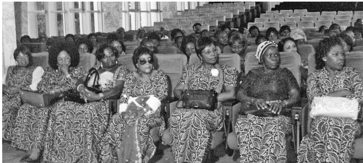
Les membres du bureau

L'Union des femmes des Plateaux (UFP) a fait sa sortie officielle, le 13 juillet à l'hôtel de ville de Brazzaville. Elle est présidée par la sénatrice Joséphine Mountou-Bayonne.