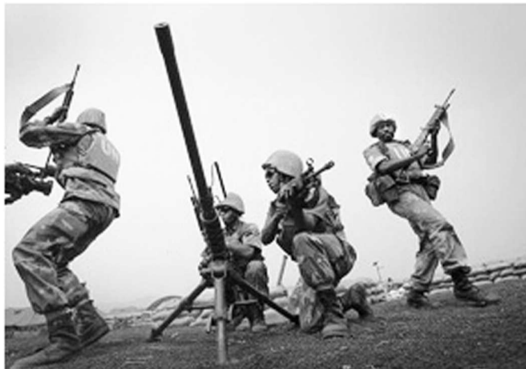
Les casques bleus de la Monusco en pleine exhibition

Les rebelles du M23 poursuivent allègrement leurs rackets contre la population civile plus que jamais assujettie à leurs fantasmes. Pendant que l'ultimatum de la Monusco courait, le M23 imposait une collecte de fonds spéciale auprès des habitants de Rutshuru et des territoires sous occupation à titre d'efforts de guerre, apprend-on. En même temps, des rumeurs persistantes faisaient état d'une éventuelle attaque de Goma que préparerait ce mouvement armé en réaction à l'ultimatum lancé par la Monusco. Il appert clairement, d'après des sources locales, que le M23 est décidé d'affronter la Brigade spéciale d'intervention de la Monusco qui, jusqu'au 1er août,