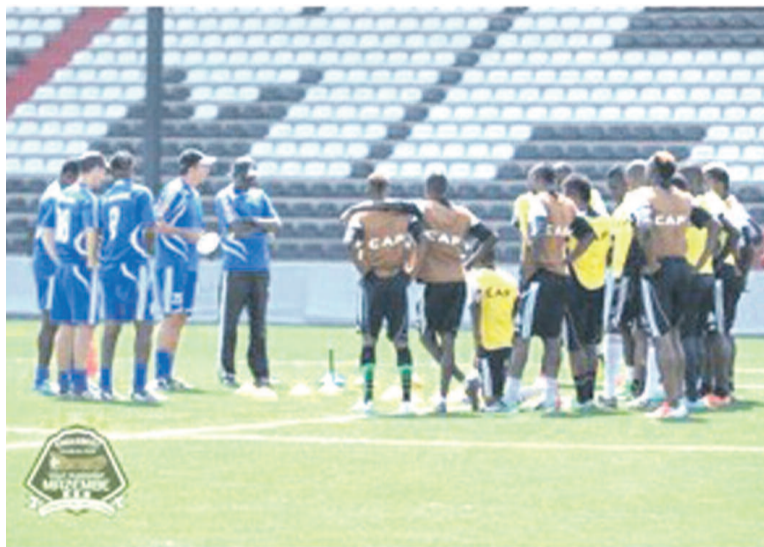
TP Mazembe de Lubumbashi en pleine préparation

Le TP Mazembe accueille, le 3 août, au stade TP Mazembe de Lubumbashi l'équipe de Fath Union Sport -FUS- de Rabat (Maroc) en deuxième journée de la phase des poules de la 10e édition de la Coupe de la Confédération. En première journée, les Corbeaux du Katanga ont tenu en échec l'Entente sportive Sétif d'Algérie par un but partout. Une victoire -en cette deuxième journée- du club dirigé par le gouverneur Moïse Ka-