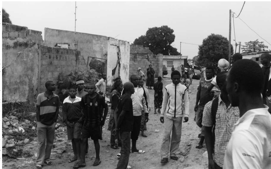
Les manifestants dispersés par la police

D'autres personnes qui ne veulent pas entendre parler d'expropriation demandent ouvertement la reconstruction de leurs maisons. « Les tentes ne répondent plus, nous vivons dans des mauvaises conditions et sommes même obligés de braver le froid. Ce que nous demandons, c'est la re-