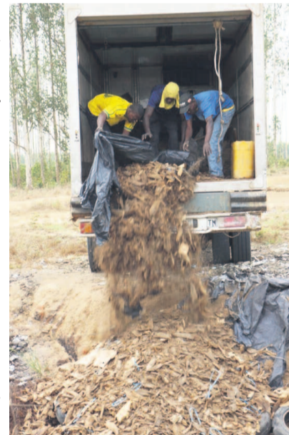
La destruction des poissons avariés.