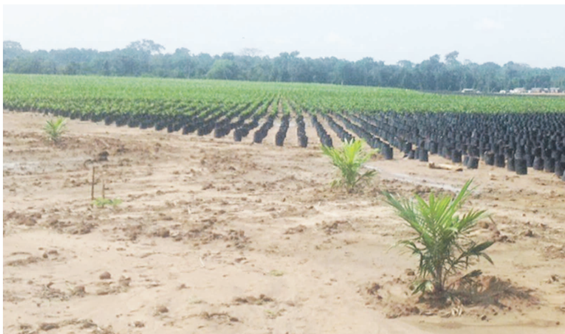
La palmeraie d'Atama plantation à Yengo (Sangha)

D'autres sociétés étrangères installées nouvellement au Congo développent un paquet d'activités allant de palmiers à huile à l'hévéa, en passant par le café, l'agro-industrie et l'industrie. Le café et le palmier à huile en ce qui