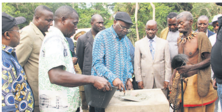
Le ministre Émile Ouosso pose la première pierre de la construction du pont sur la Vouma, le 28 juillet 2013

La construction de ces ponts relève de l'engagement pris, en 2012, par le ministère de l'Équipement et des travaux publics de construire des ouvrages d'affranchissement viables en remplacement des ponts en bois et éventuellement des bacs. C'est d'ailleurs dans cette optique que s'est inscrit le lancement des travaux de construction des ponts sur la Ngoko (Cuvette) et la Lékona (Cuvette-Ouest).