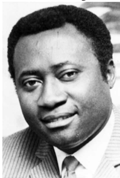
Joseph Kabasele, alias Grand Kallé