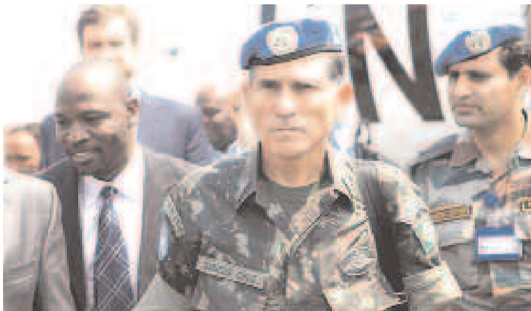
Le chef militaire de la Monusco, le général Alberto Dos Santos Cruz en avant-plan