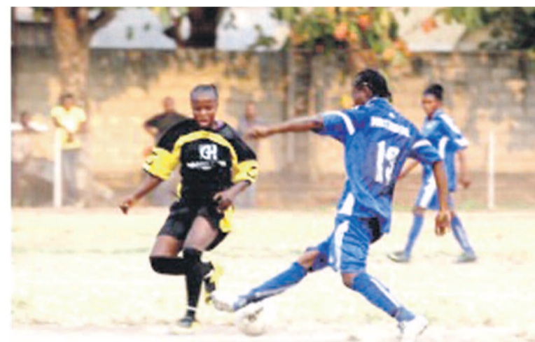
Vue d'un match de football féminin

Le club a, dans une finale totalement katangaise, conservé son titre de champion du Congo face à la formation de Bafana Bafana, au terme d'une compétition organisée à Bandundu et qui a connu la grande absence des clubs de Kinshasa.