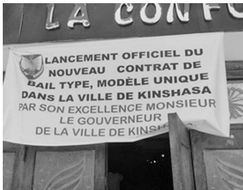
Une banderole placée à l'entrée de la salle La Conforta

L'exécutif provincial de la ville-province de Kinshasa a lancé, le 16 octobre, en la salle La Conforta, dans la commune de Kasa-Vubu, le nouveau contrat de bail type pour la capitale congolaise. La mise en circulation de ce document rentre dans le cadre de l'action du gouverneur, André Kimbuta Yango, et est parmi les initiatives dont la finalité reste l'amélioration de la gouvernance dans la capitale congolaise. «Aujourd'hui, un instrument important, mais souvent banalisé dans notre vie quotidienne, va devoir recevoir ses lustres. Il s'agit du nouveau contrat de bail type qui sera lancé en circulation ici et maintenant», a noté le vice-gouverneur de la ville, Clément Bafiba Zomba. Soulignant l'importance de ce document, le vice-gouverneur a noté que le contrat de bail devra assumer les rôles social, juridique, fiscal et statistique. De cet avis, ce document, qui traduit une convergence des intérêts parallèles, mais qui consolide des avantages et acquis respectivement défendus et reconnus, devra être le cordon ombilical qui enrichit le sens de compréhension mutuelle et de convivialité