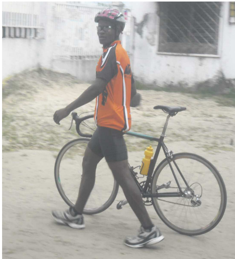
Un athlète à l'entraînement

La compétition, qui mettra aux prises les clubs de Brazzaville, se disputera du 26 au 27 octobre.