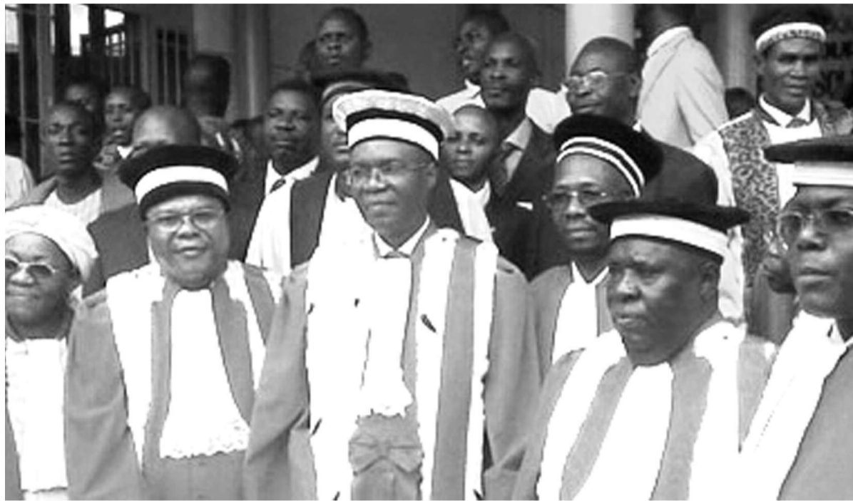
Des hauts magistrats de la République

L'arsenal juridique du pays est en train de se mettre progressivement en marche. La promulgation le 15 octobre par le chef de l'État de la loi portant organisation et fonctionnement de la Cour constitutionnelle est venue pallier un déficit longtemps décrié, à savoir l'absence de cette haute juridiction remplacée dont les fonctions étaient jusque-là exercées par la Cour suprême de justice. Adoptée fin octobre par les deux chambres du Parlement, la Cour constitutionnelle tend à répondre aux exigences de la Constitution du 18 février 2006 adoptée par référendum. Cette dernière, faut-il le rappeler, avait recommandé l'institution de cette Cour sans que cela ne soit suivi d'effet. Aujourd'hui,