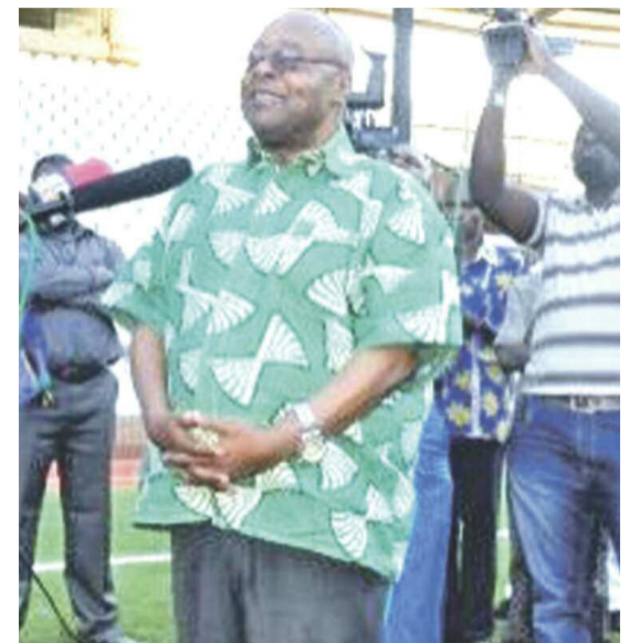
Le ministre des Sports Baudouin Banza Mukalay