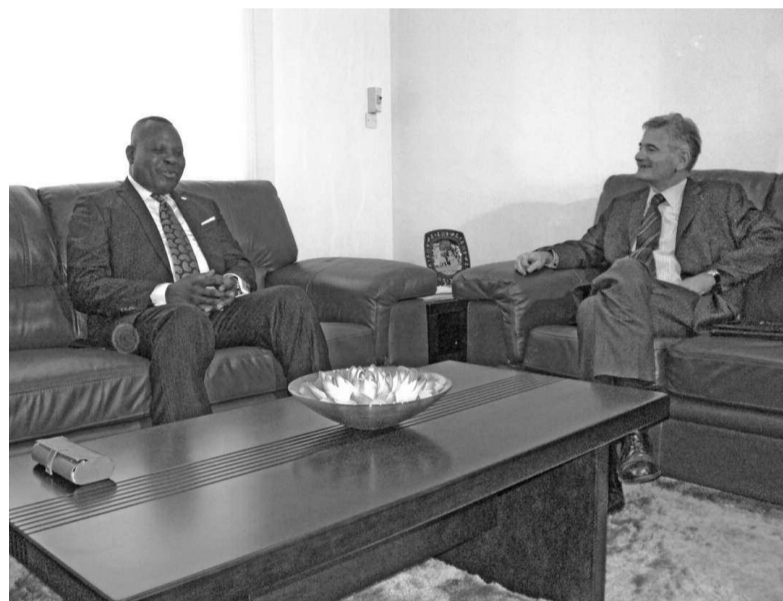
Le ministre Hellot Matson Mampouya avec l'Ambassadeur