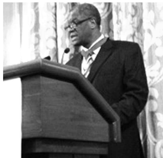
Le Dr Mukwege lors de son discours à la Fondation John Train à New-York

Le prix lui a été décerné suite au travail réalisé à son hôpital de Panzi où il soigne de nombreuses femmes victimes de violences sexuelles. « Rencontrer ces femmes a complètement changé ma vie. Ma profession de médecin a fait de moi le témoin direct d'un crime de masse difficile à comprendre, c'est parce que les violences sexuelles