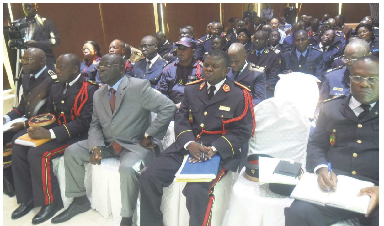
Les responsables des Douanes attentifs à l'exposé de l'expert du FMI

Au regard des résultats obtenus et des défis à relever en vue de