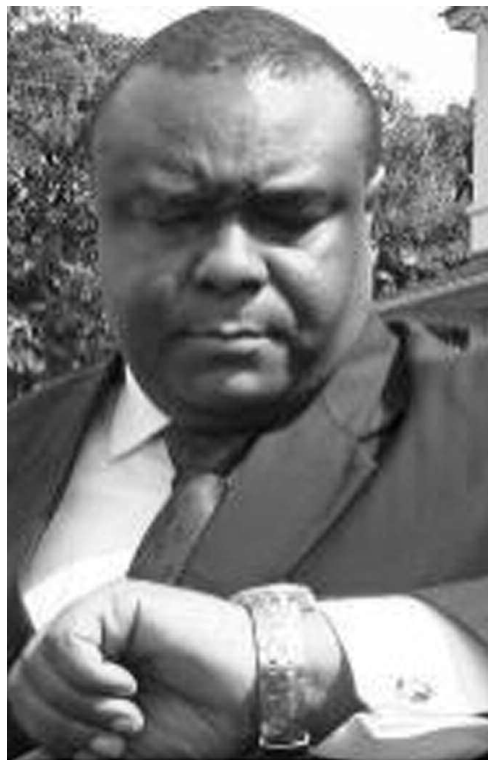
Le sénateur Jean-Pierre Bemba

Il est noté qu'après cette action, le procureur pourra également faire sa déclaration et porter des observations, qui seront, éventuellement, suivies des déclarations finales de la défense et de l'accusé lui-même. Toute cette procédure permet à l'accusé d'user de toutes les prérogatives et moyens de sa défense en vue de prouver son innocence dans les accusations portées contre lui. Alors, de l'autre côté, elle permet aux juges d'avoir suffisamment d'éléments leur permettant de cerner tous les contours de l'affaire jugée en vue de trancher selon ce qu'il paraîtra la vérité. À en croire des sources proches du bureau locale de la CPI à Kinshasa, entre la déclaration attendue dans les tout prochains jours et le verdict, il pourra se passer plusieurs mois. Ce qui signifie que l'on