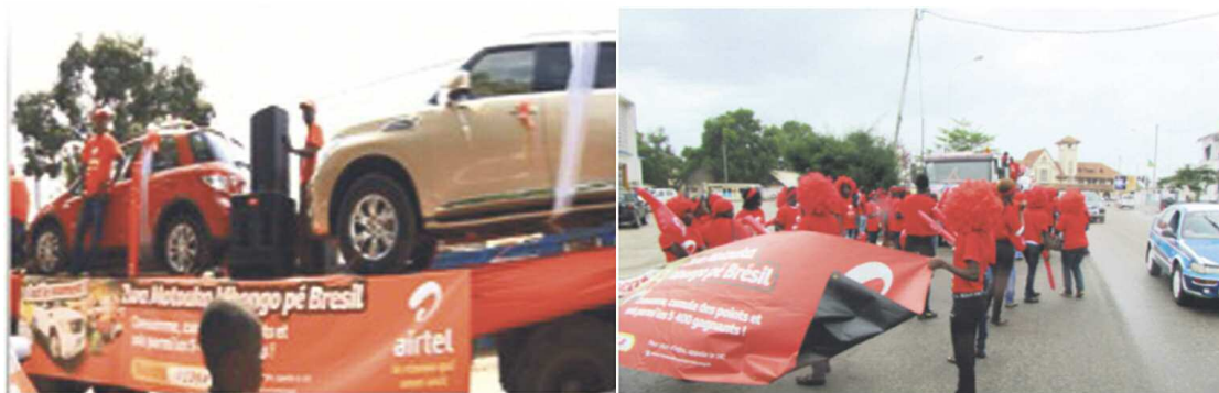
Le grand carnaval « C'est le moment » à Brazzaville et Pointe-Noire