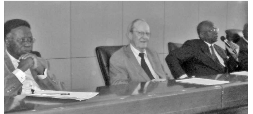
Les intervenants au colloque