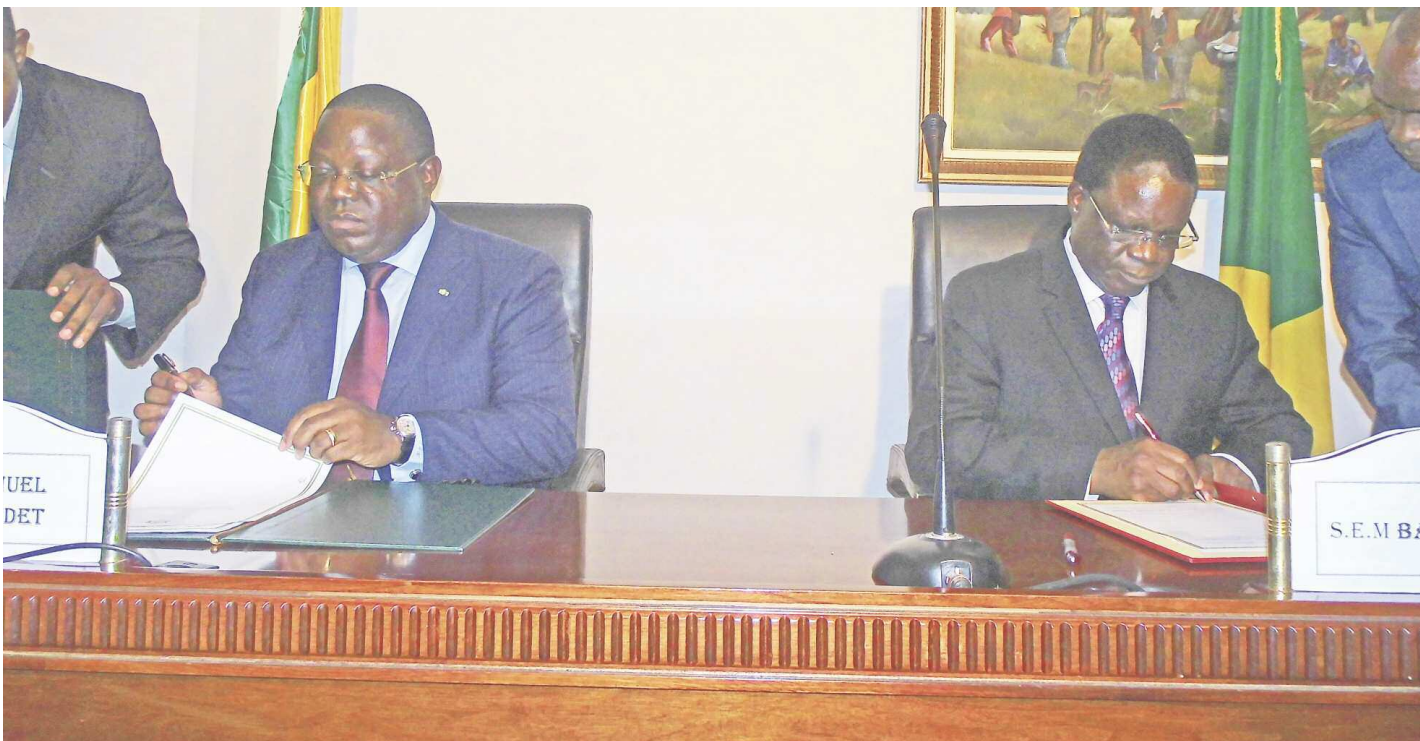
La signature de l'accord entre les deux ministres

Les ministres congolais et gabonais des Affaires étrangères ont évoqué lundi à Brazzaville la nécessité de relancer les échanges, entre les deux pays, sur les litiges nés de l'interprétation des textes, la démarcation et la matérialisation de leurs frontières communes.