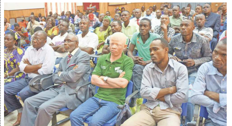
Les ressortissants de la RD-Congo de Pointe-Noire et du Kouilou

Les ressortissants de la RDC rappelés à l'ordre