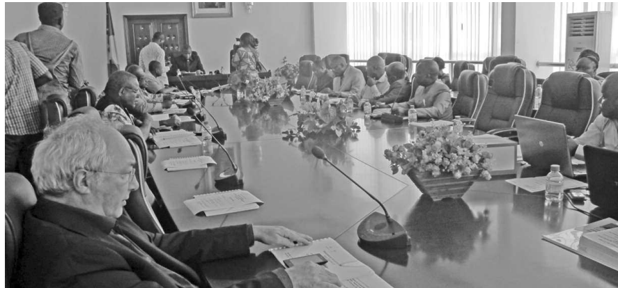
La réunion des experts

cours d'eau et la reconstruction des ouvrages de franchissement, il est utile d'envisager des solutions dites pilotes, touchant au pavage des rues et à la reconstruction des caniveaux dans les artères sensibles pour soulager le plus vite possible les populations », a-t-il indiqué.