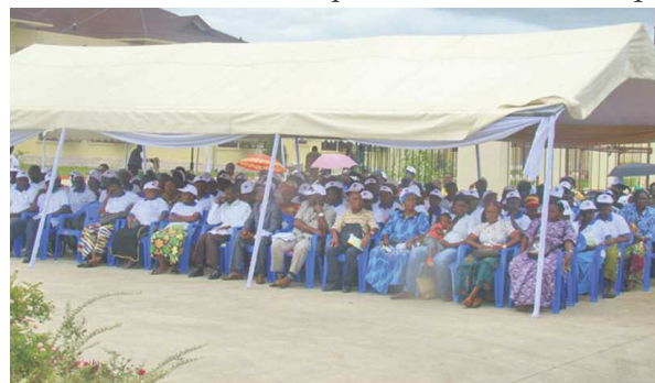
L'assemblée des femmes présentes à la cérémonie