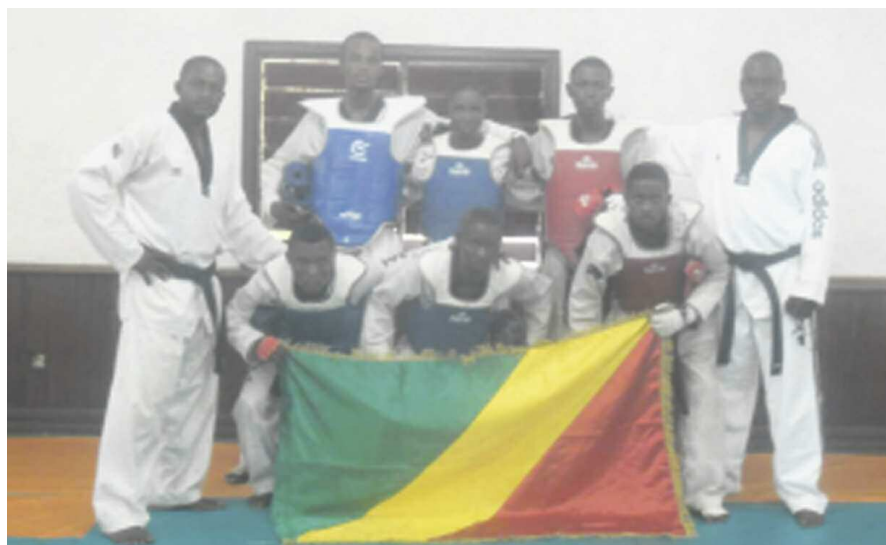
Les athlètes retenus en compagnie de leurs entraîneurs.

ration a fait de son mieux pour réunir toutes les conditions de préparation de ce championnat d'Afrique. (...) Nous nous sentons orphelins. Nous souhaitons donc que l'État nous assiste », a déclaré le secrétaire général adjoint. Pour peaufiner le travail de préparation des Diabes rouges, l'expert franco-congolais Kamba Bouanga sera à Brazzaville le 6 novembre. Il apportera sa touche sur le plan technico-tactique auprès de ces athlètes qui