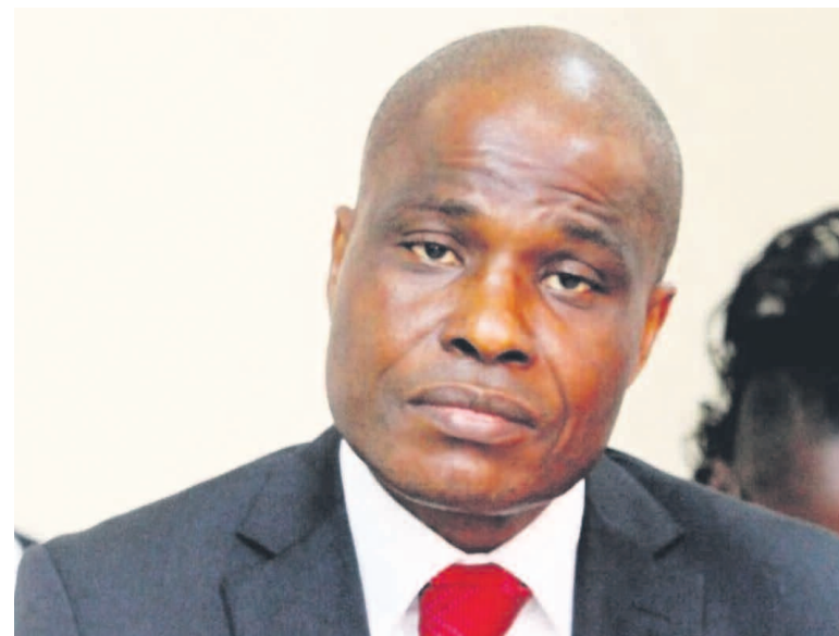
Martin Fayulu, président des FAC

Et contrairement aux affirmations du gouvernement qui s'enthousiasme du fait d'avoir signé séparément une déclaration avec le M23, le député national Martin Fayulu continue pour sa part à soutenir le contraire. La