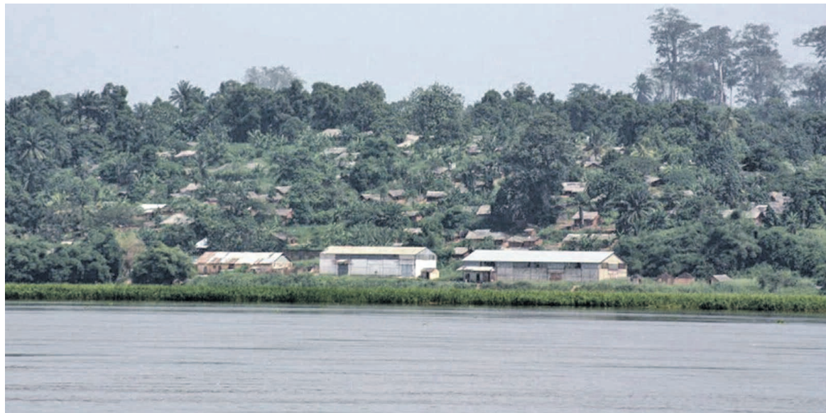
Une vue de la cité de Dongo le long de la rivière Oubanghi dans la province de l'Équateur

Une flambée des prix est signalée dans la cité congolaise de Dongo (frontalière avec Bangui) où les activités économiques tournent actuellement au ralenti sur fond de recrudescence de la violence. La crise qui sévit en République centrafricaine a des implications inquiétantes sur Dongo