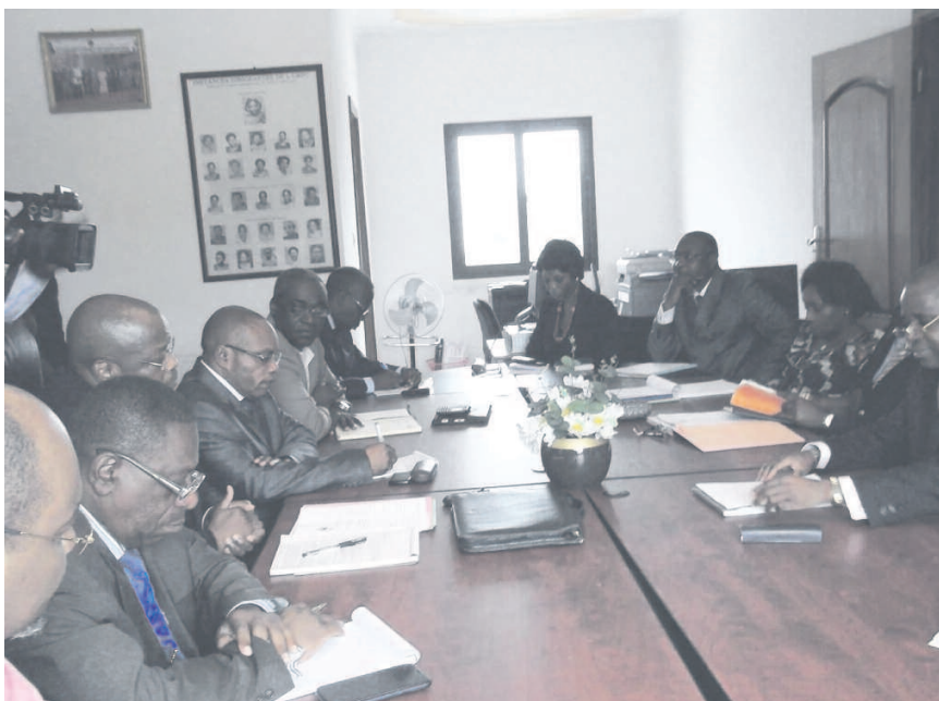
La séance de travail entre les deux formations politiques