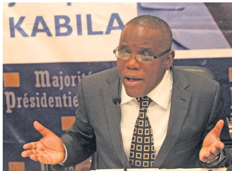
Le président de l'Assemblée nationale, Aubin Minaku.