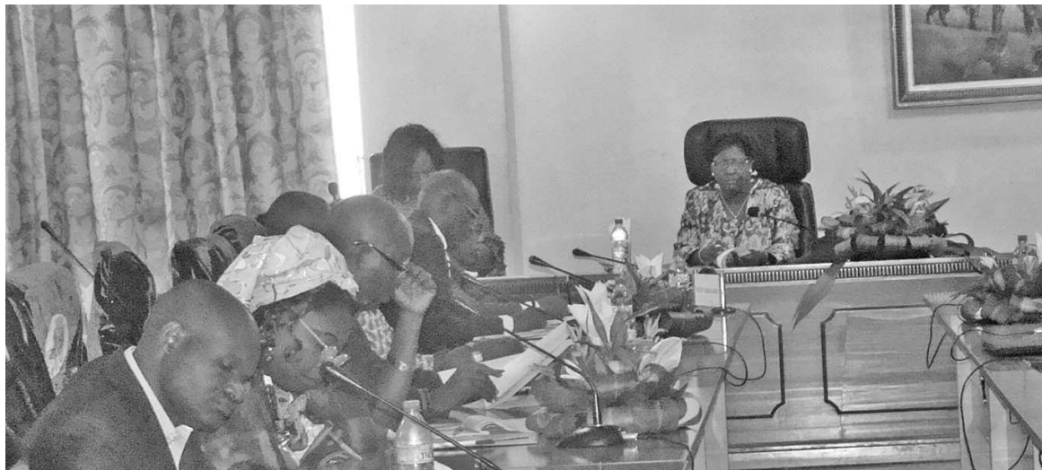
Les deux parties pendant la séance de travail.

Selon les textes de création du centre, chacun des onze pays membres de la région des Grands Lacs doit verser annuellement 68 000