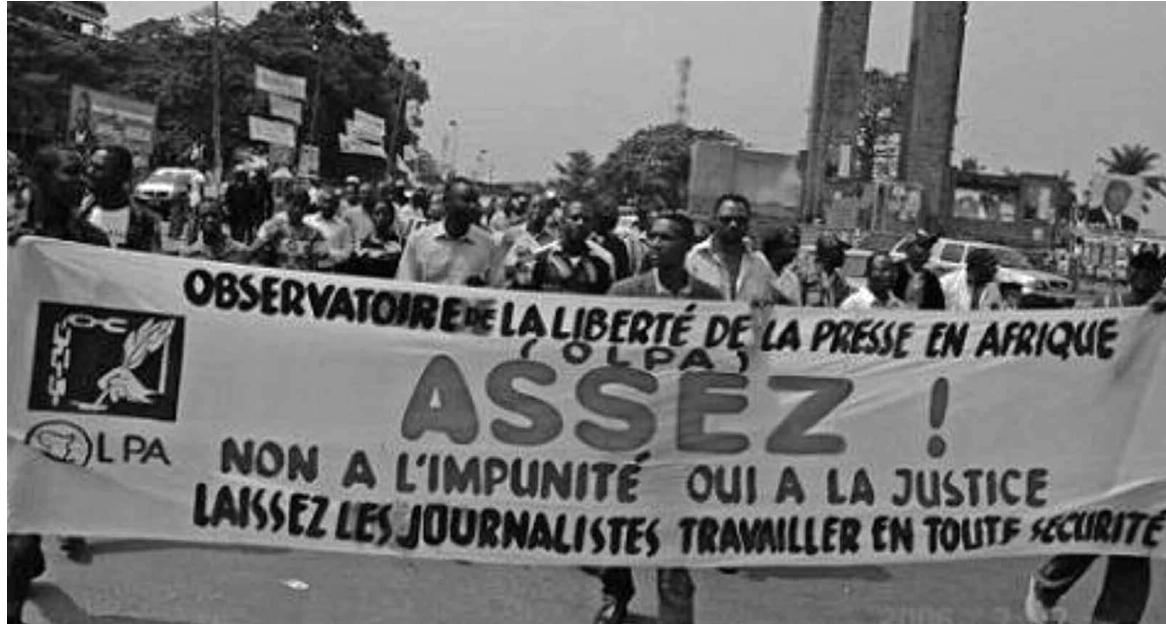
Une banderole arborée lors d'une marche de la presse.

L'ONG relève un lien entre cet acte et l'exercice du métier de journaliste et identifie quelques précédents qui confirment sa crainte.