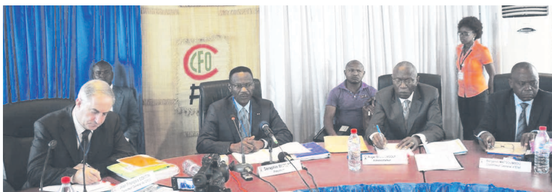
Le présidium des travaux pendant la session

ment du Cfco comme l'exécution de plusieurs recommandations et dispositions basées sur l'intermodalité en partenariat avec le conseil congolais des chargeurs en vue d'améliorer les conditions de fluidité du trafic marchandises et favoriser la compétitivité de la chaîne des transports congolais, la création des conditions de réouverture de l'école supérieure africaine des chemins de fer (ESACC-GT), le financement prioritaire des infrastructures du Cfco, le redémarrage de la commission « bois » par des entités constitutives de la chaîne des transports, la réouverture du centre de formation du km4, l'exécution du programme d'investissement sur fonds de l'Etat, le transport du minerai de fer de Mayoko à Pointe-Noire, l'amortissement de la convention financière de prêt relative à l'acquisition de deux locomotives de ligne, le compte rendu d'activités et de gestion au 31 dé-