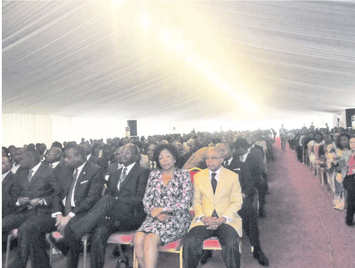
Quelques membres du gouvernement (en avant plan) à la cérémonie d'ouverture

mandations à l'endroit des pouvoirs publics.