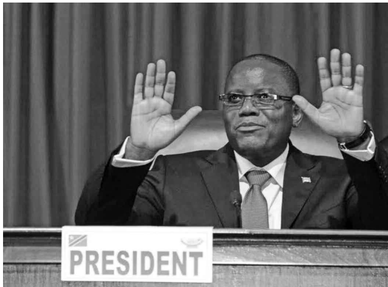
Aubin Minaku, président de l'Assemblée nationale

Les deux chambres du Parlement ont clôturé la session ordinaire de septembre le dimanche 15 décembre. Pourtant essentiellement budgétaire, cette session s'est achevée sans que le projet de budget 2014 ne soit examiné et voté conformément à la Constitution. Ce qui a conduit le gouvernement à solliciter l'ouverture des crédits provisoires chiffrés à 657 500 000 dollars et couvrant la période allant du 1er au 31 janvier 2014. Entretemps, pour éviter de sombrer dans l'impasse à l'expiration de ce délai, la convocation d'une session extraordinaire censée traiter du projet de budget 2014 est inévitable. Cette loi financière sera, en outre, examinée après le vote de la loi sur la red-