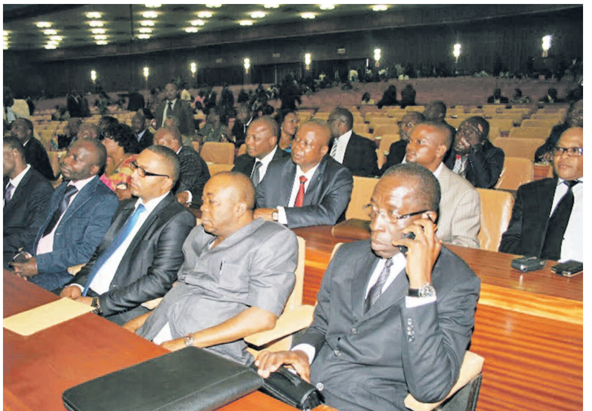
Des députés nationaux en plénière