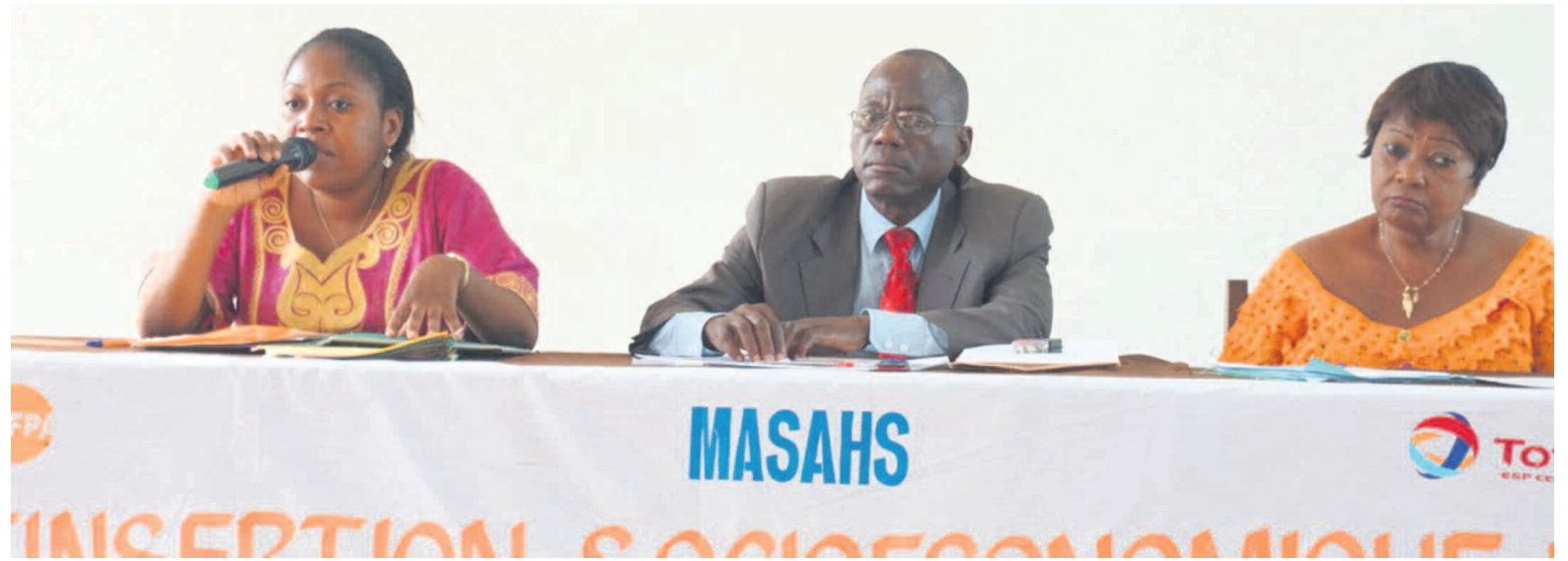
La tribune officielle pendant la réunion.

En effet, selon ce projet, ces différentes rencontres ont pour principaux objectifs la sensibilisation, l'identification aux principes directeurs de la réinsertion socioéconomique des personnes présentant un syndrome post-poliomyélitique définitif datant de 2010 dans les départements de Pointe-Noire et du Kouilou. À travers ces assises avec l'ensemble des chefs de quartier de la ville, le projet vise une plus large sensibilisation et une identification plus facile des personnes présentant un syndrome post-poliomyélitique définitif à Pointe-Noire et au Kouilou, avoir une