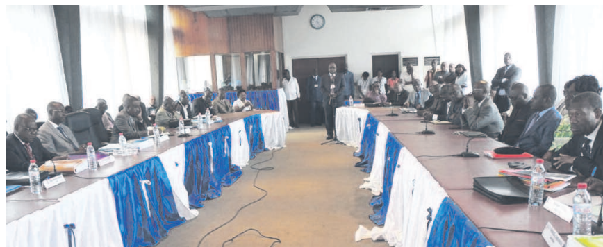
Les participants à la session

Signalons que les travaux de la dite session ont été convoqués par note n°0026/CFCO-PCA du 28 novembre 2013. La fin de ceux-ci était marquée par une motion de remerciement adressée au président de la république pour les efforts déployés dans la restauration et la conservation du Cfco comme outil de production afin de pérenniser la vocation de transit de la république du Congo.