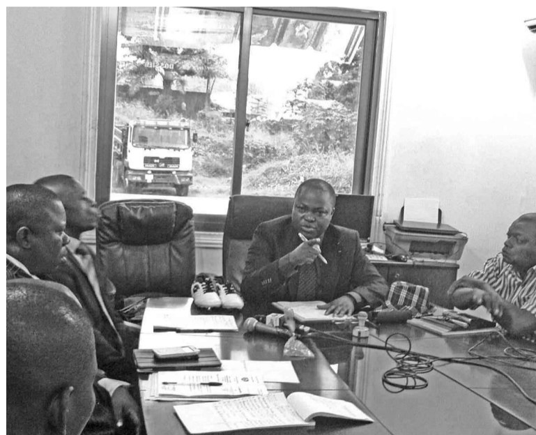
Les participants à l'assemblée générale

Lors de cette assemblée générale, les ins-