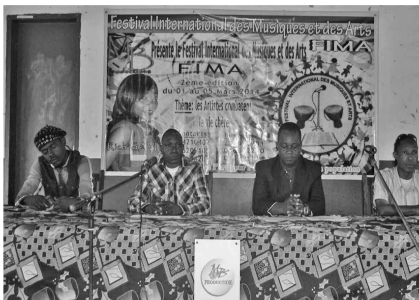
La photo du présidium du Fima.

sélection. Étant donné que le Fima regroupe des groupes de musiques chrétiennes, traditionnelles et profanes ainsi que des groupes de théâtre et des comédiens, le promoteur de cette activité a promis de diversifier la chose afin d'atteindre un public beaucoup plus large.