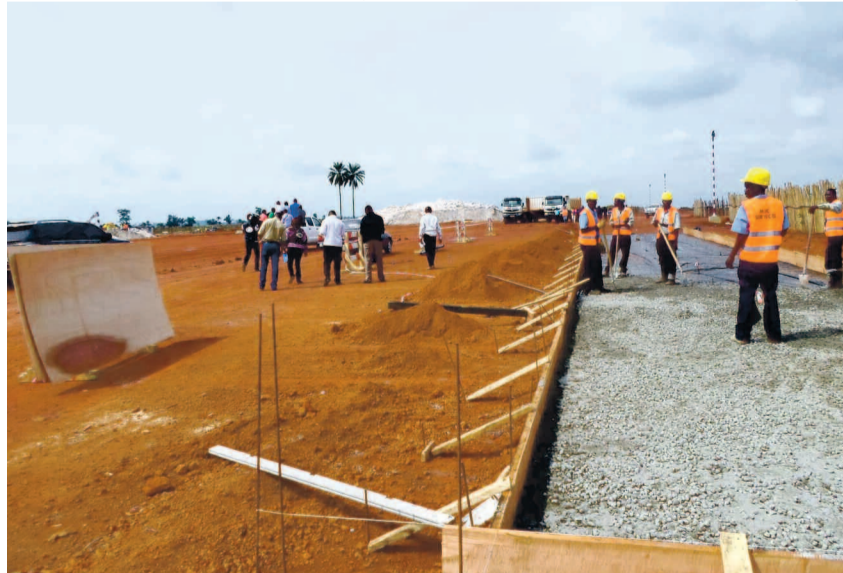
Le chantier de l'aéroport de Sibiti

À Sibiti comme dans les précédentes municipalisations, il n'y aura pas d'éléphants blancs, a-t-il ajouté. « La municipalisation a commencé par un processus géné-