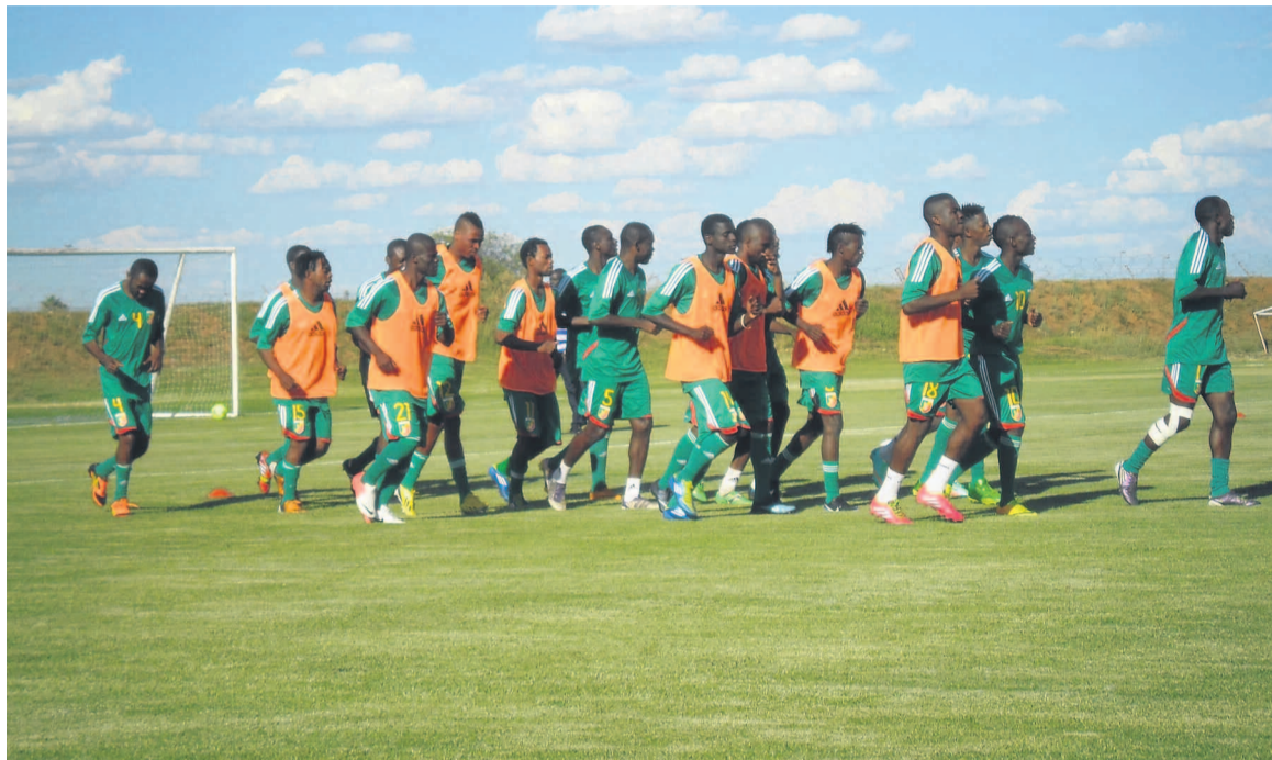
Les Diabes rouges en Afrique du sud

Le premier objectif fixé par le staff technique ne pourrait être atteint que si les Congolais alignent deux victoires d'affilée d'abord contre l'Éthiopie et ensuite contre la Libye, le 21 janvier. Les Diabes rouges, qui retrouvent la compétition de haut niveau après tant d'années d'absence, ont manqué leur premier essai. Ils quittent Free state stadium de Mangaung avec d'énormes regrets. Les Congolais ont courbé l'échine 0-1 lors du premier match du groupe C de la troisième édition du championnat d'Afrique des nations (Chan) alors qu'un match nul pourrait être tout à fait logique. Leur équation se complique à la 34e minute. Sur une contre favorable aux Ghanéens, les Diabes rouges concèdent un but. Le gardien Gildas Mouyabi légèrement avancé s'est fait lober sur un dégagement de Kevin Léonce Andzouana contré par