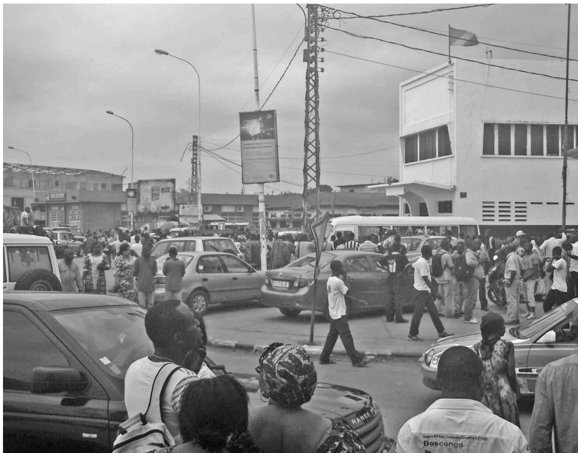
L'attroupement devant le commissariat de police du premier arrondissement E.P.Lumumba.

Il semblerait que le jeune criminel aidait chaque matin la victime pour le transport du charbon du dépôt jusqu'au lieu de vente. Certains parlent d'un différend qui les aurait opposés la veille du crime au sujet d'une dette de 50.000 FCFA. Mais qui devait exactement à l'autre ? telle est question. On parle aussi d'acte prémédité, sachant toutefois que le jeune homme n'a apparemment pas toutes ses facultés mentales. Cet acte a créé une véritable pa-