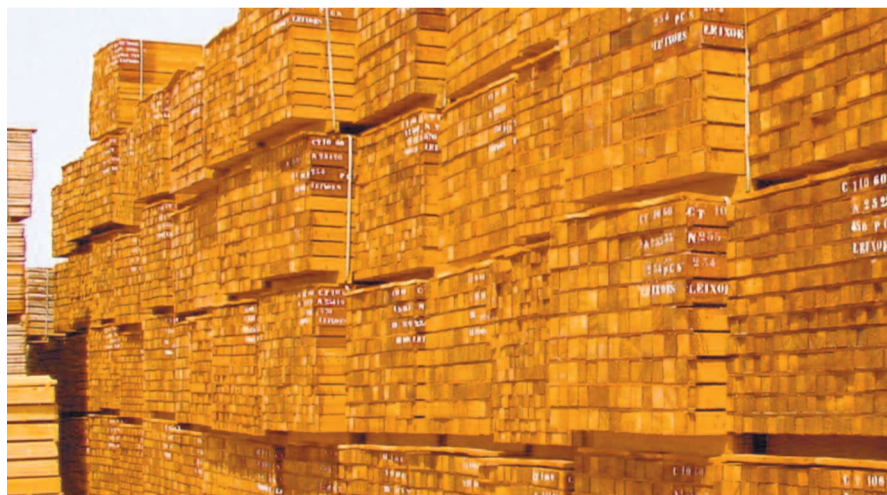
Un stock de débités au nord Congo

Ce montant qui représente 72,4% du budget annuel de ce département est consécutif aux nou-