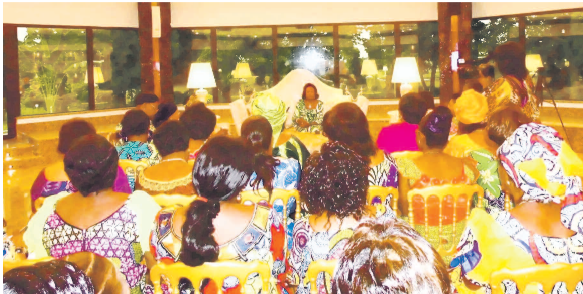
Les femmes de la Lékoumou reçoivent par Antoinette Sassou N'Guesso

Au cours de ce face-à-face, l'épouse du chef de l'État a reçu de ses interlocutrices le soutien nécessaire pour la réussite des