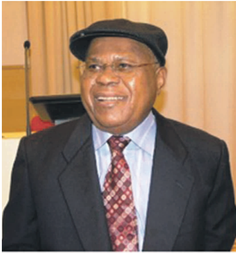
Étienne Tshisekedi wa Mulumba

Des manifestations de rue en guise de protestation à cette arrestation ne se comptent plus au chef-lieu de la province du Kasai Oriental en proie à une instabilité récurrente. Les forces de l'ordre sont constamment aux prises avec des jeunes hystériques de ce parti qui tiennent à faire entendre leur voix. C'est dans ce contexte qu'il faut situer les échauffourées ayant caractérisé l'interdiction de la marche initiée par l'UDPS le 9 janvier.