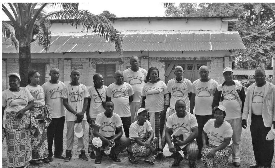
Les membres du bureau exécutif et la CCV

mettre en œuvre pour pallier le problème récurrent de manque de sang au niveau des trois postes de transfusion sanguine de Brazzaville, notamment à Talangaï, Makélékélé et au Centre hospitalier universitaire. « Nous avons