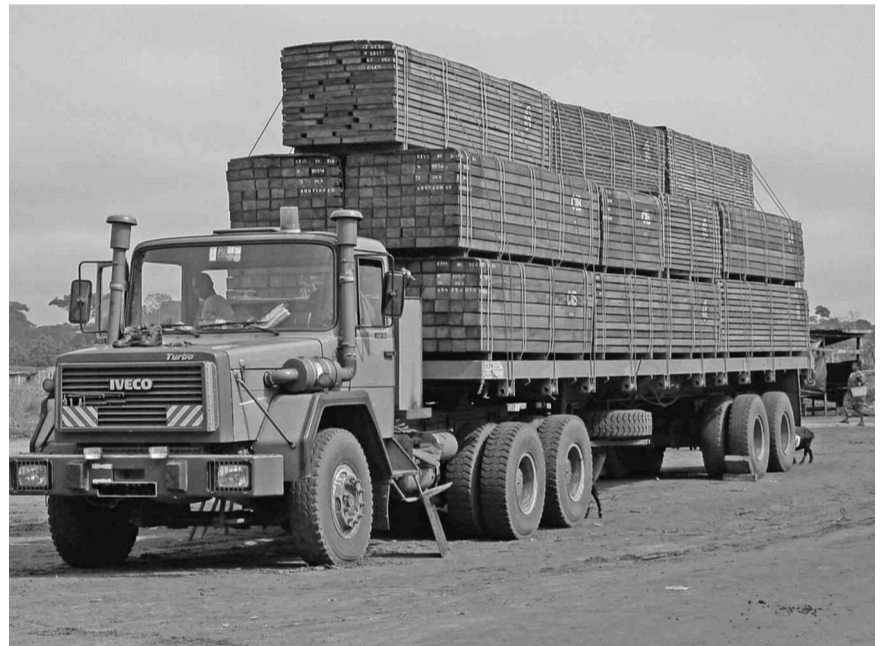
Camions de débités (Pokola dec 2002)

La Société générale de surveillance (SGS) a été retenue en remplacement de la société Helveta pour réaliser le projet du système national de vérification de la légalité. Le démarrage de sa presta-