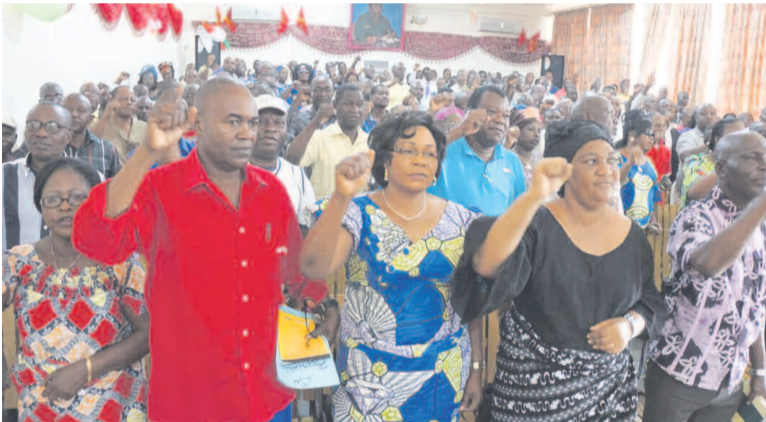
Les membres et militants du PCT Pointe-Noire lors des retrouvailles de restitution des travaux.