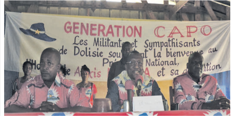
Le présidium de la génération Capo

Créée l'année dernière, la génération Capo de Dolisie vient de mettre en place une équipe chargée de conduire les destinées de cette association au niveau de la troisième ville du pays. L'activité a eu lieu le samedi 11 janvier en présence d'Alexis Ndinga, président national de cette structure.