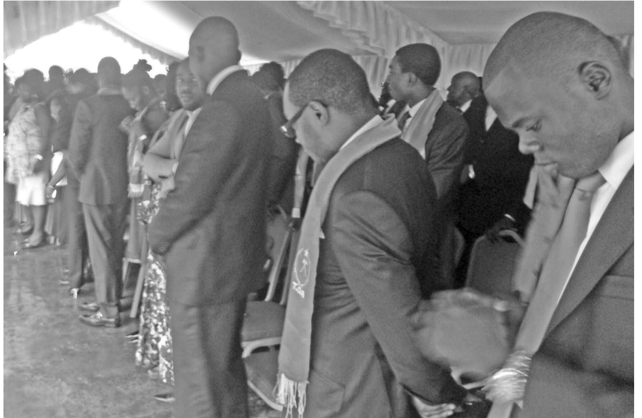
Une vue des militants

« Sur la base de sa revitalisation, le Parti congolais du travail entend se déployer en Europe occidentale », a annoncé le secrétaire général du parti, Pierre Ngolo, le 13 janvier à Brazzaville, lors de la cérémonie d'échanges de vœux avec les cadres, militants et sympathisants du parti.