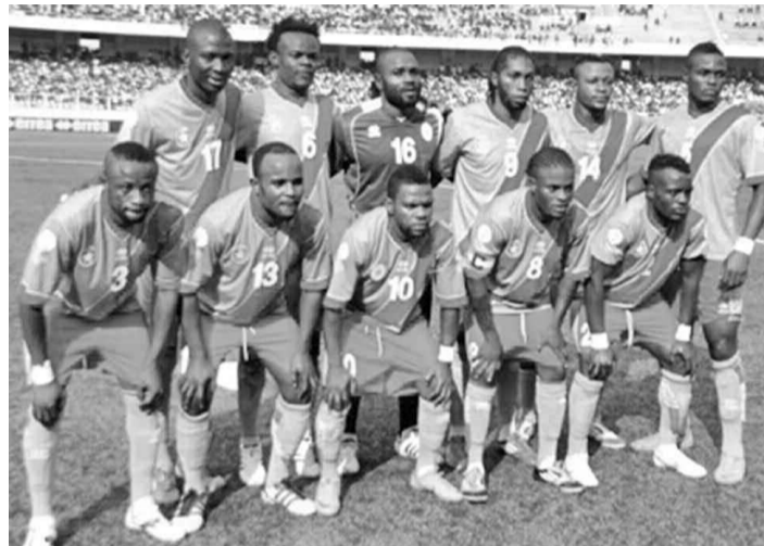
Les Léopards de la RDC

L'équipe de Mauritanie s'est inclinée, le 14 janvier, 1-0 face aux Léopards de la RDC pour son tout premier match en Championnat d'Afrique des Nations (Chan 2014), qui se déroule en Afrique Sud.