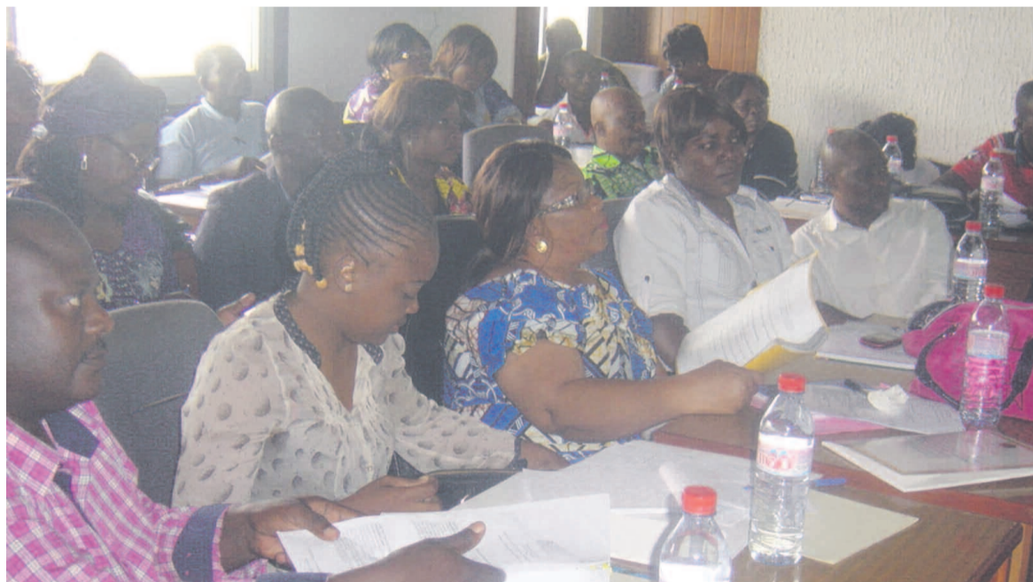
Les participants au séminaire-atelier.

C'est en prélude à leur prestation de serment que la direction départementale de la concurrence et de la répression des fraudes commerciales (DDCRFC) de Pointe-Noire a mis en œuvre une formation de renforcement des capacités des stagiaires. Lancée le 10 janvier, elle s'étalera sur deux mois environ.