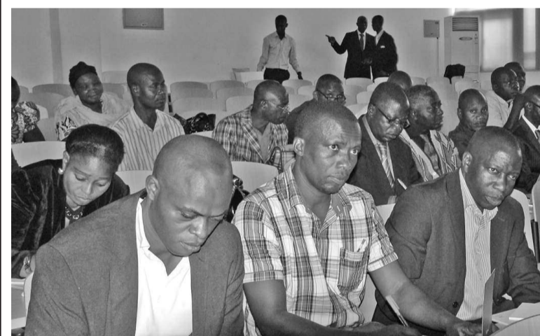
Les participants au séminaire.