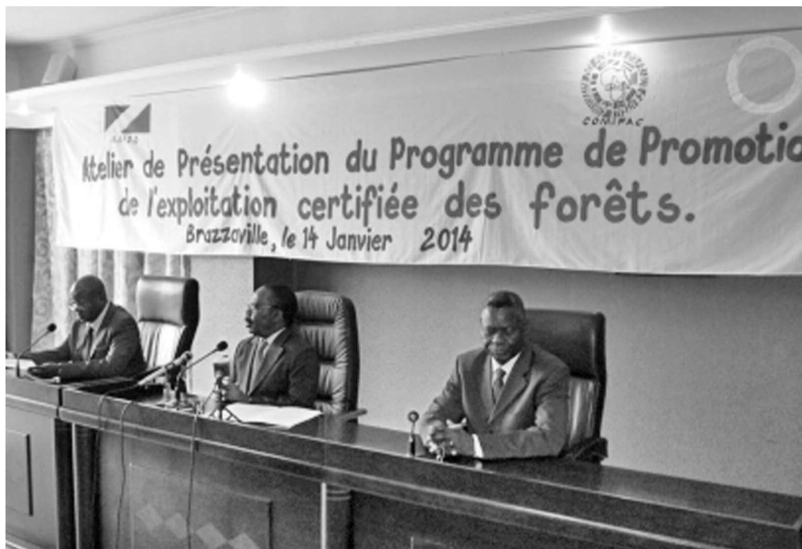
Le présidium de l'atelier.

« Au moment où la certification forestière est à la croisée des chemins, avec l'entrée en vigueur du nouveau règlement bois européen et la mise en place des APV-Flegt, nous avons besoin de ce type d'appui (...) Les produits certifiés FSC ne représentent malheureusement qu'environ 1% de bois exportés par le Bassin du Congo annuellement », a circonscrit le représen-