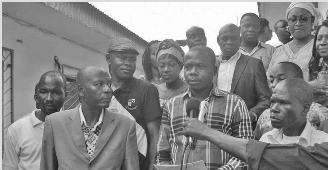
Le secrétaire général de la Fétrasseic par intérim, lit la déclaration.

Réunis en assemblée générale, le 13 janvier 2014, à la Maison de la Radio sur convocation de l'intersyndicale (Fétrasseic et CSTC), les travailleurs de Radio-Congo Pointe-Noire ont passé en revue toutes les situations qui minent le fonctionnement normal des programmes de leur structure.