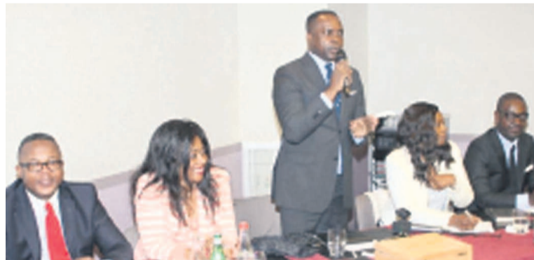
Réunion de l'APC à l'hôtel Concorde Montparnasse lors de la rencontre avec les Congolais de l'étranger

sitions phares du programme intitulé « le Pays franc » prévu sur dix ans : « Entre autres, ouvrir des droits à un revenu moyen d'insertion pour les populations démunies ; attribuer aux hommes politiques un statut spécifique à inscrire à la constitution. »