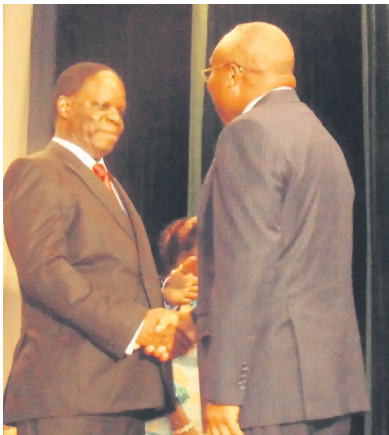
L'échange de vœux entre le ministre et le secrétaire général

Au nombre des projets à mettre en œuvre en 2014, figure en bonne place la poursuite de la politique d'élargissement du réseau diplomatique congolais. Dans ce cadre, le Congo ouvrira au cours de cette année une ambassade à Abidjan en Côte d'Ivoire et un Consulat général à Kigali au Rwanda. En 2014, a annoncé Basile Ikouébé, l'État congolais s'em-