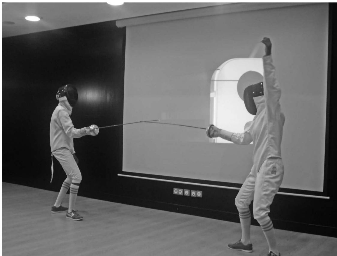
Un combat d'escrime.

Pour vaincre un adversaire dans ce sport de combat, l'escrimeur ou le tireur doit inscrire le plus de points comme dans d'autres disciplines sportives. Mais ici, la réalité change selon les catégories, les armes utilisées et selon que l'on soit en phase de poule ou en éliminatoire. Décryptage.