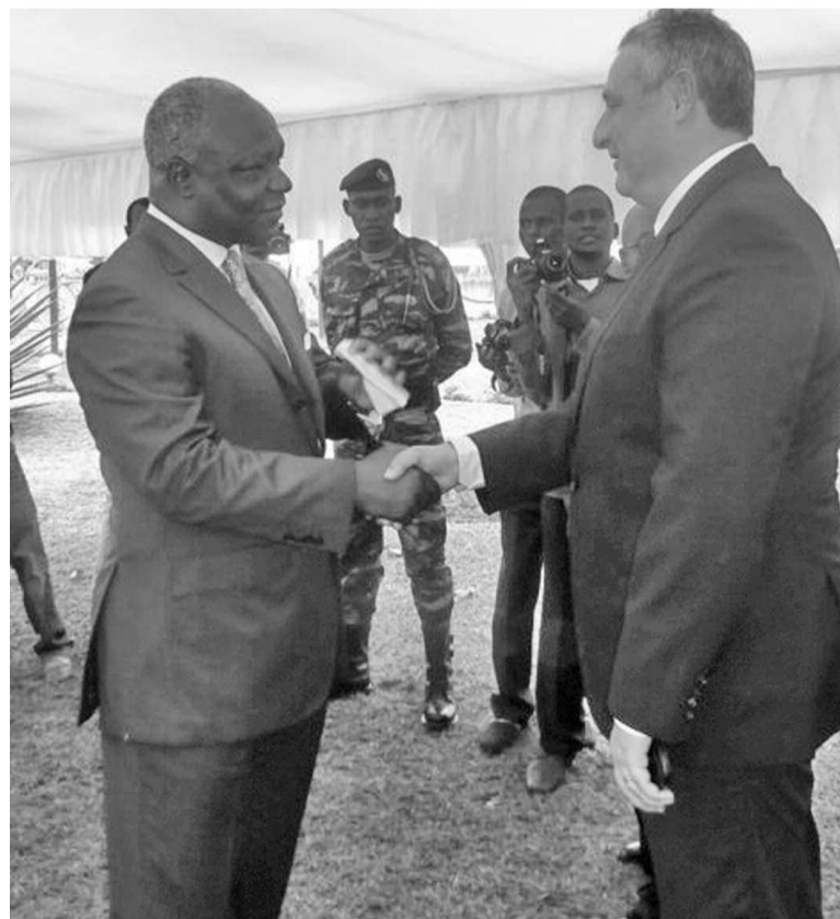
Poignée de main entre Henri Ossebi et un des partenaires du ministère

Profitant de la cérémonie d'échange de vœux avec ses collaborateurs, le 14 janvier à Brazzaville, le ministre de l'Énergie et de l'Hydraulique, Henri Ossebi, a saisi l'occasion pour dévoiler la feuille de route de son département, laquelle devra guider l'action de son ministère courant 2014. Le ministre a annoncé à cet effet, sept défis à relever en urgence, visant le bien-être des populations. Il s'agira de renforcer et consolider les réalisations structurantes nationales, dans une synergie constante avec la délégation générale des grands travaux ; donner la visibilité sur le terrain des résultats des partenaires publics-