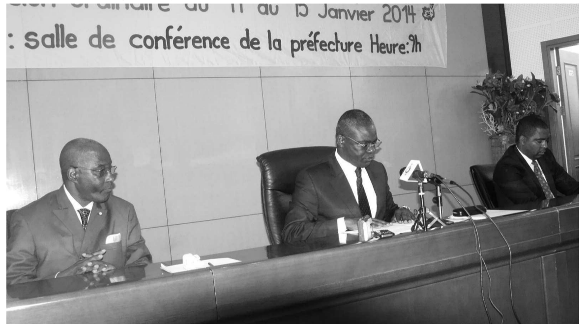
Le ministre Anatole Collinet Makosso entouré du directeur général de la jeunesse et du président du CNJ-Congo

rendre des comptes sur son action. Mais pour que ce moment de vérité soit vécu dans la sérénité, je me dois de vous dire par expérience qu'aucune œuvre humaine n'est parfaite sur cette terre. Encore moins celle du CNJ, âgée d'à peine trois ans », a précisé le ministre. Il a, par ailleurs, demandé aux participants de faire preuve de dépassement de soi, de ressaisissement et de grandeur afin que cette session se tienne dans la paix et la quiétude sous le triptyque : unité, critique, unité. Pour lui, le temps est arrivé de corriger les mécanismes qui ne leur ont pas permis d'aller vers le franc succès de l'action du CNJ. « Nous ferons ensemble ce travail de correction afin d'améliorer dans le temps, l'action du CNJ et lui donner les moyens de la mise en place d'une véritable politique de rassemblement des jeunes dans un élan visant la construction et la modernisation de notre pays, le renforcement de ses appuis en ma-