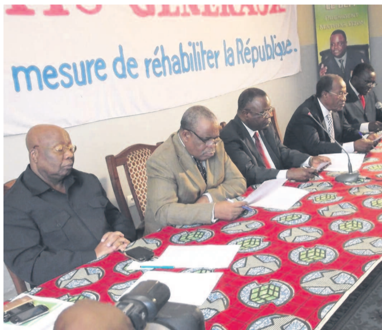
Les membres du collectif lors des vœux à la presse nationale et internationale

Le 11 janvier, lors de la présentation des vœux à la presse nationale et internationale, le collectif des partis de l'opposition congolaise, signataire de la déclaration du 17 août 2012, a appelé le peuple congolais à « redoubler de vigilance » afin de « barrer la voie » à ce qu'elle qualifie de « dérive dictatoriale du pouvoir ».