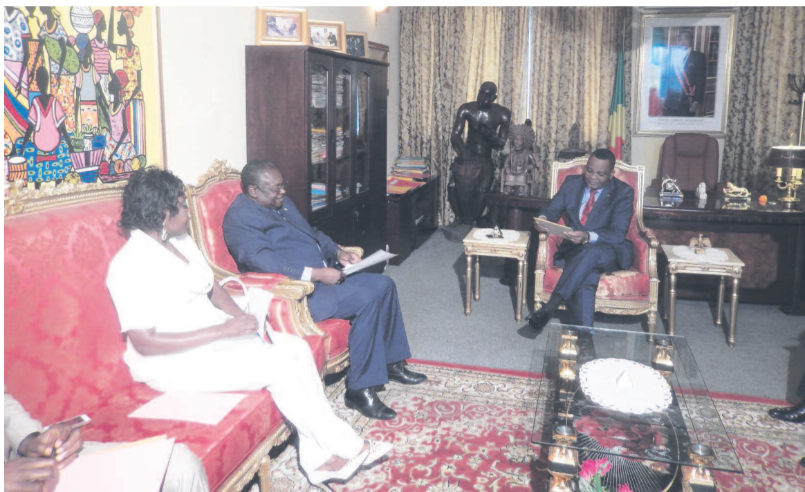
Le ministre Jean-Claude Gakosso lors de ses entretiens avec les diplomates photo 3 : L'ambassadeur camerounais

Brazzaville, nommée par l'Unesco ville créative de Musique, est depuis le mois de juin le siège du Conseil africain de la musique (CAM) et la représentation nationale du Conseil international de la musique. Mbuyamba Lupwichi qui préside le CAM a