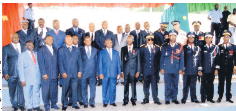
Des personnalités présentes à la cérémonie

Dressant le bilan de l'année écoulée, le ministère a retenu : l'organisation à Ouesso et Pokola (département de la Sangha) du 17 au 19 janvier, de la conférence des préfets qui avaient débattu de la place et du rôle des autorités locales dans la mise en œuvre du plan national de développement 2012-2013, dont les différentes articulations furent examinées ainsi que les responsabilités qui revenaient à chacune des autorités ; la tenue de la concertation politique de Dolisie qui avait pour enjeu de dégager le