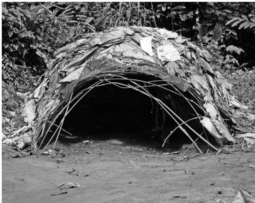
Un habitat autochtone

«Le Cameroun regorge d'autochtones, c'est donc une responsabilité partagée entre le Congo, le Cameroun et tous ceux qui sont impliqués dans le processus. Il n'y a aucun doute sur l'implication du Cameroun. Le Fipac at-