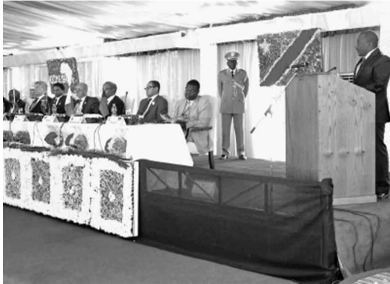
Joseph Kabila prononçant son allocution de clôture

Il a égrené pour ce faire quatre conditions essentielles sur lesquelles il faudra miser pour atteindre le développement escompté. Il s'agit, primo, de la formation des hommes pour maîtriser la science, la technologie et l'innova-