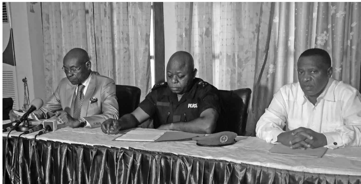
Le colonel Jules Moukala Tsoumou, au centre

Le diagnostic institutionnel révèle qu'un grand nombre de véhicules qui utilisent les routes congolaises sont de véritables cercueils roulants. Interpellé, l'État congolais a décidé d'assainir le secteur en instituant le certificat de capacité pour chauffeur.