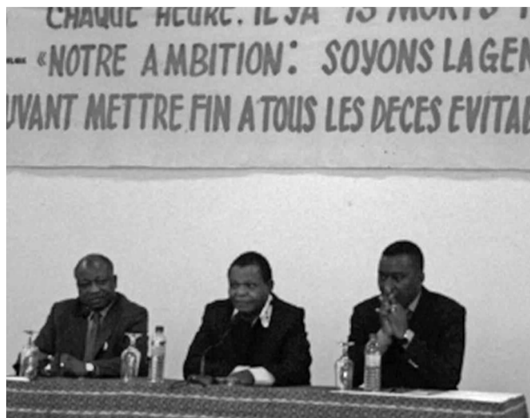
Le panel des orateurs

Le tour d'horizon édifiant qu'a fourni la synthèse du Rapport