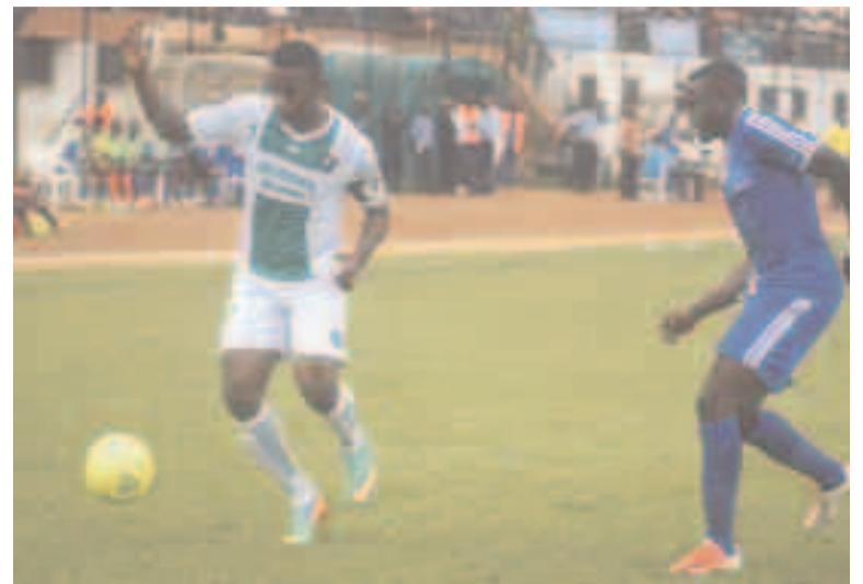
Le capitaine des Léopards de Dolisie signe son retour par un doublé

L'Athlétic club Léopards a dominé, le 26 février dans son fief à Dolisie, l'Association sportive Ponténégrine 3-0 en match avancé de la troisième journée du championnat national d'Élite 1.