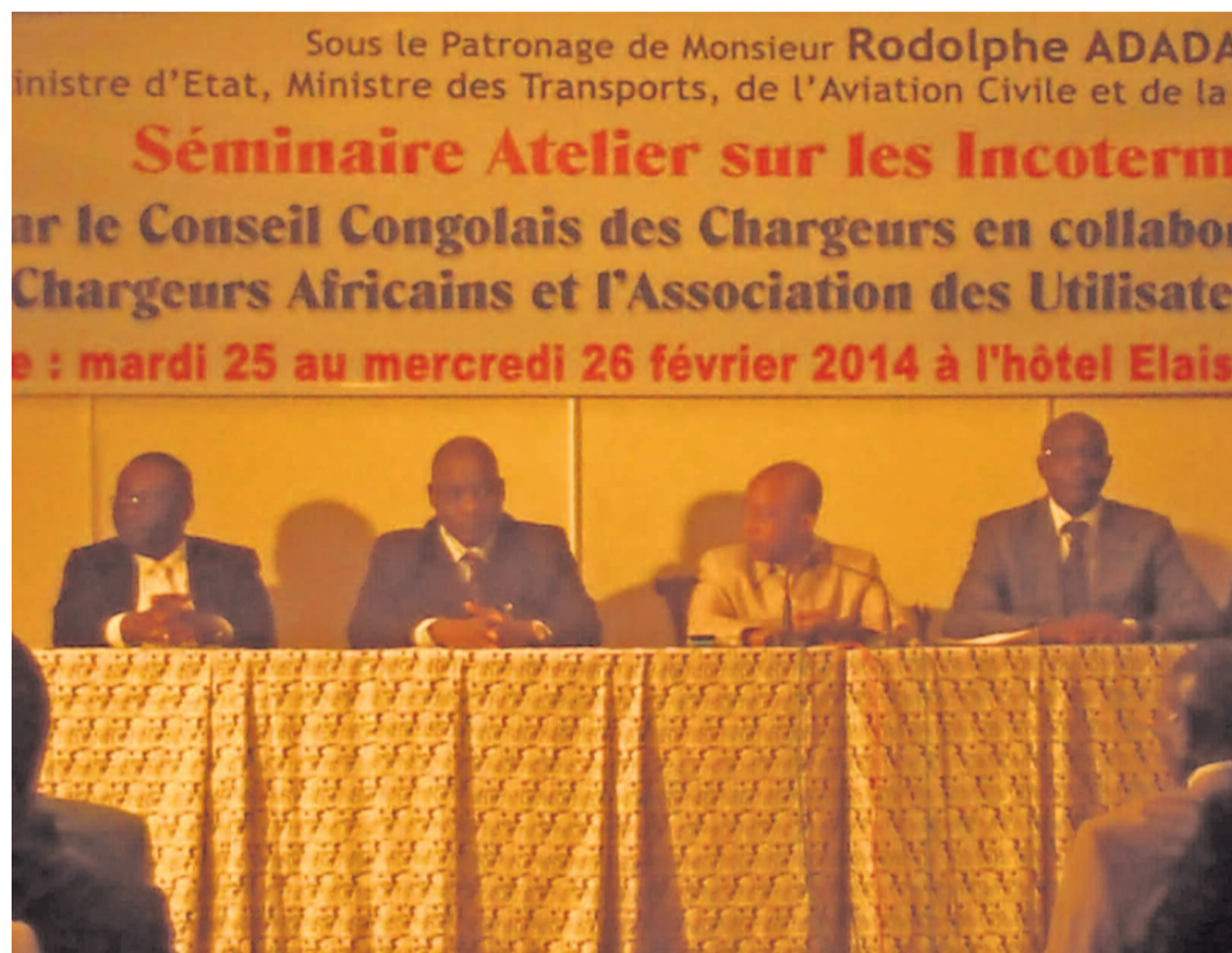
La tribune officielle à la clôture du séminaire sur les Incoterms

Notion importante dans la vente internationale des marchandises, les International Commercial Terms (Incoterms) sont