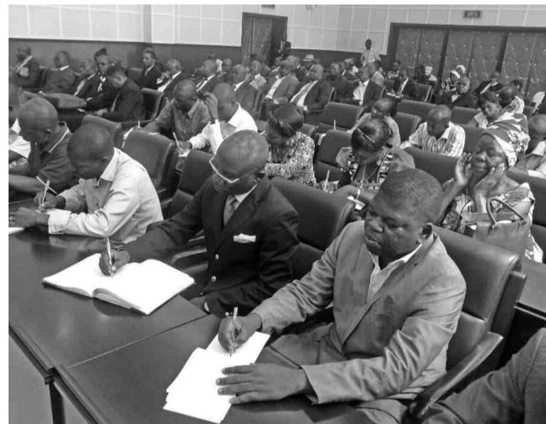
Les journalistes lors de la conférence de presse

Enfin, il a appelé les professionnels à utiliser la charte des professionnels des médias, avant d'insister sur les missions de son institution. Il s'agit, entre autres, de : garantir au citoyen le libre accès à l'information et à la communication ; suivre les médias et assurer leur protection contre les menaces et les entraves dans l'exercice de leur fonction ; favoriser la libre concurrence et l'expression plu-