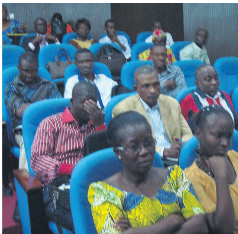
Une vue des participants

«La nécessité d'intensifier le renforcement de leurs compétences a été retenue comme l'une des clefs déterminantes à la facilitation de