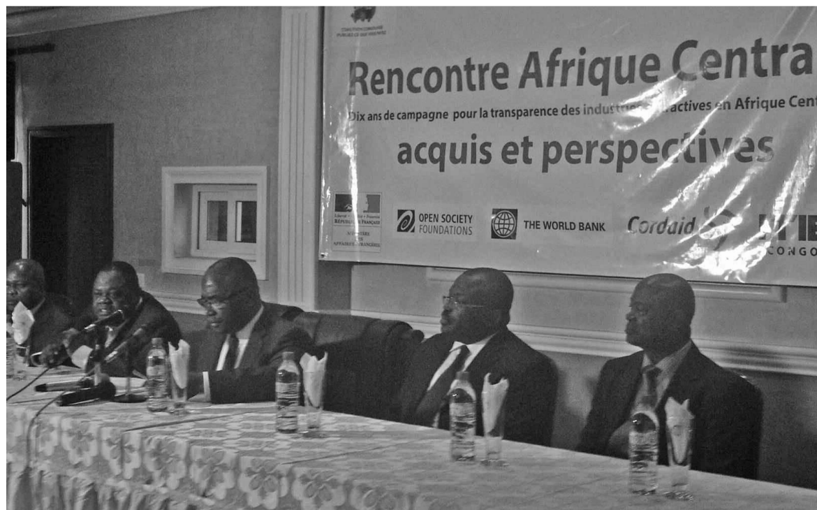
La tribune officielle à l'ouverture de la Rencontre Afrique centrale de la campagne Publiez ce que vous payez.