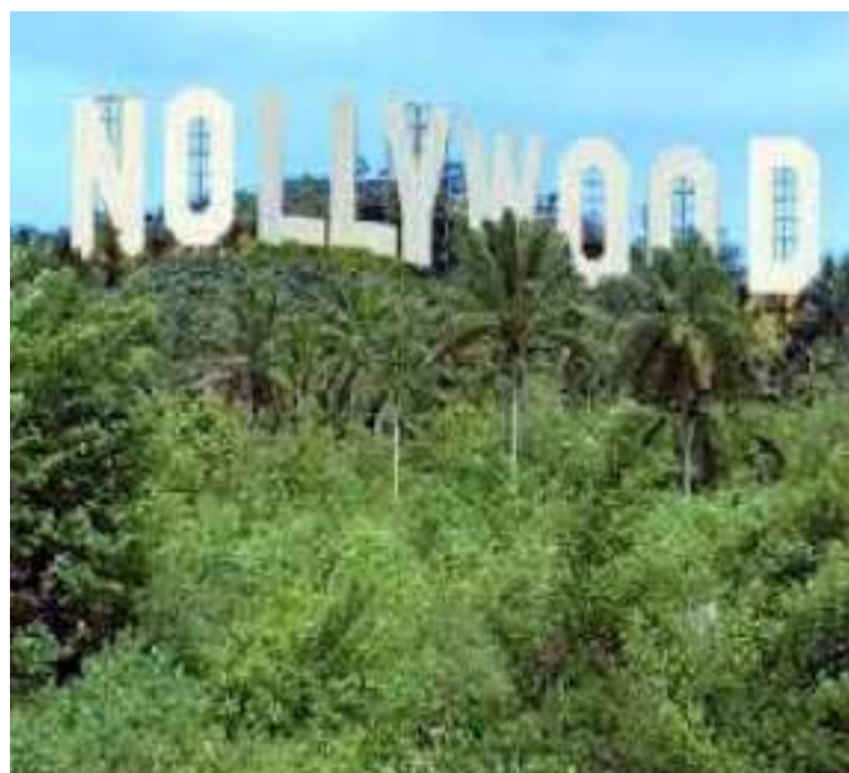
L'emblème Nollywood.

Un autre fait recueilli montre madame bien scotchée devant sa télé après avoir mis au feu une marmite de saka-saka certainement pour la dégustation du week-end. Mais la série était passionnante et le jeu des acteurs très prenant, et la traduction de l'anglais ou du yoruba en lingala des plus envoûtantes. Et le film durait, durait. Le saka-saka cuisait, cuisait dans sa marmite sans couvercle... La fin de cette cuisson et du film ? Donnons plutôt la fin du plat de saka-saka cuit à