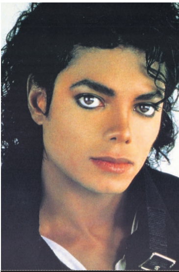
MICHAEL JACKSON - CHANTEUR