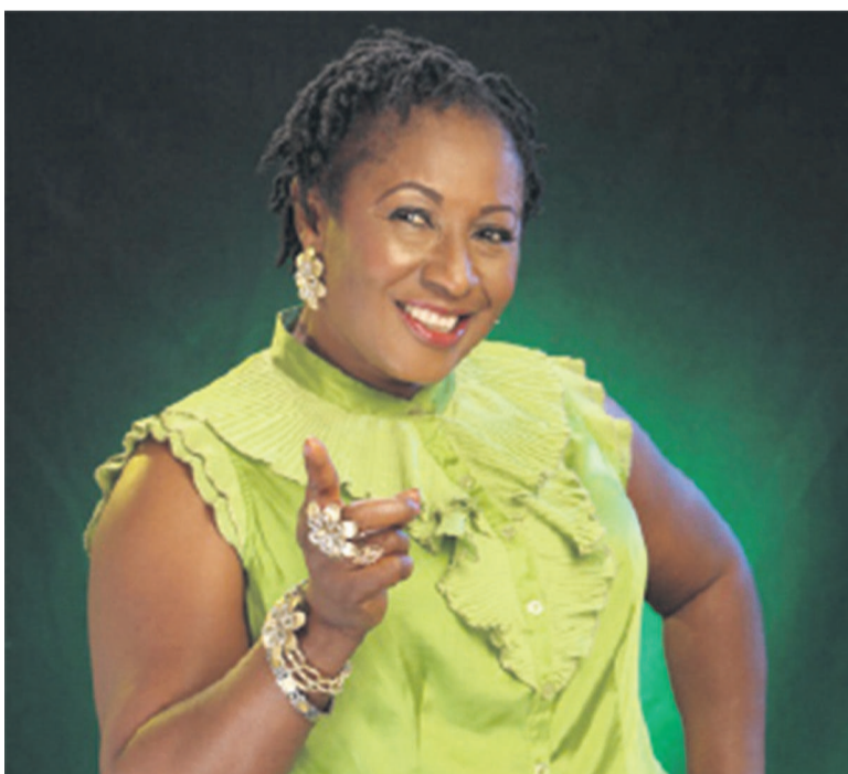
Un cinéma à faible budget et un succès omniprésent

Sixième exportateur mondial de pétrole, le Nigeria est aussi le foyer d'une industrie cinématographique et musicale dont l'essor ne cesse d'étonner plus d'un francophone. La popularité de son cinéma et de sa musique a fait de ce pays un incontournable géant culturel du continent