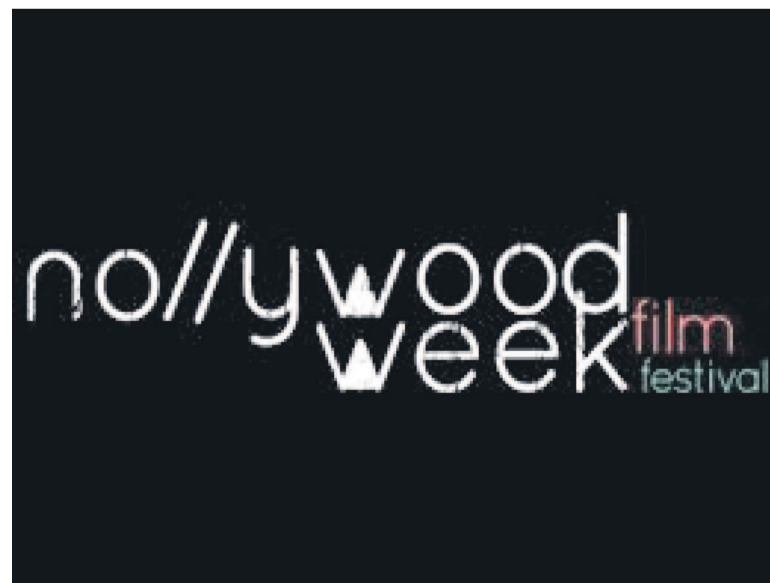
L'affiche de la Nollywood Week.