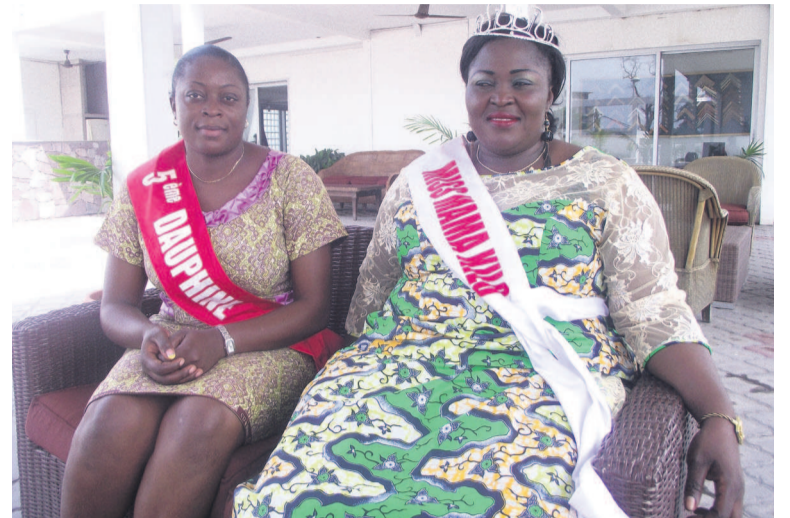
La Miss et sa dauphine lors de l'entretien aux « Dépêches de Brazzaville ».

Ce qui a changé, c'est que je suis très sollicitée de part et d'autre par les gens. Beaucoup de femmes comme moi m'envient maintenant. Elles disent qu'avant nous étions complexées par notre poids, mais à travers toi, nous avons compris que la femme grosse aussi à sa place dans la société (Miss). Il y a eu un changement, déjà la diaspora camerounaise nous a