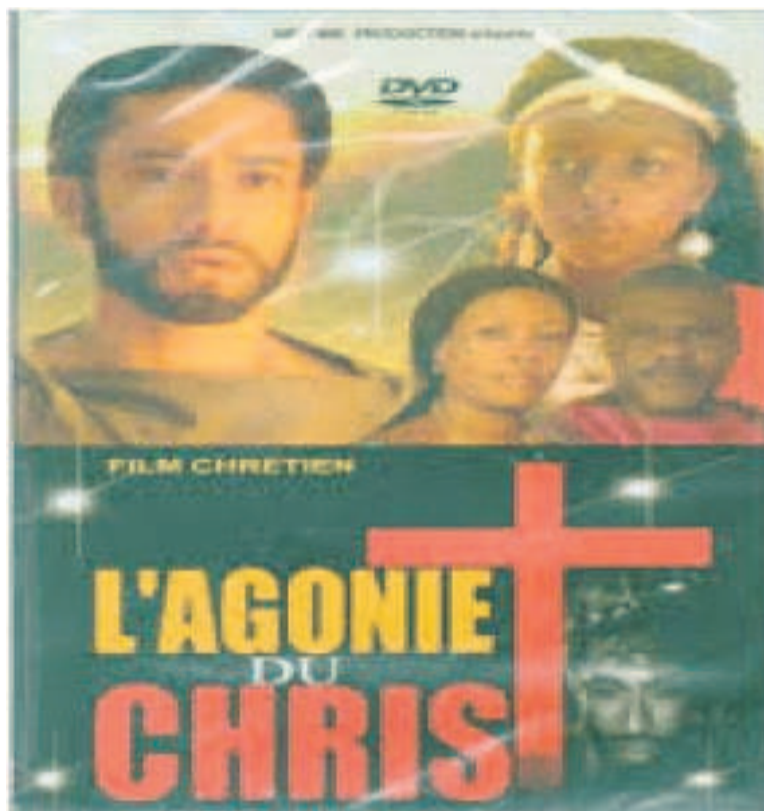
Un film karachika en vogue à Brazzaville.

suivre une partie de foot très importante. Alors madame déboule très visiblement déterminée à envoyer paître tous les maris s'arrogeant les télécommandes de la création. Mais son air menaçant n'a pas eu raison de l'intrépide footballeur de salon, bien calé dans son fauteuil et encouragé dans son « droit » par les voisins