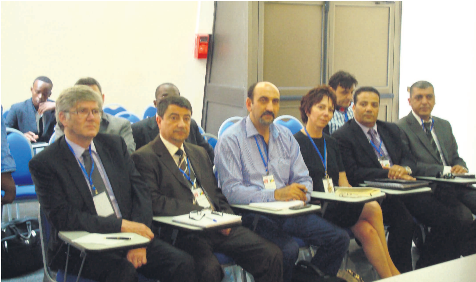
Les hommes d'affaires