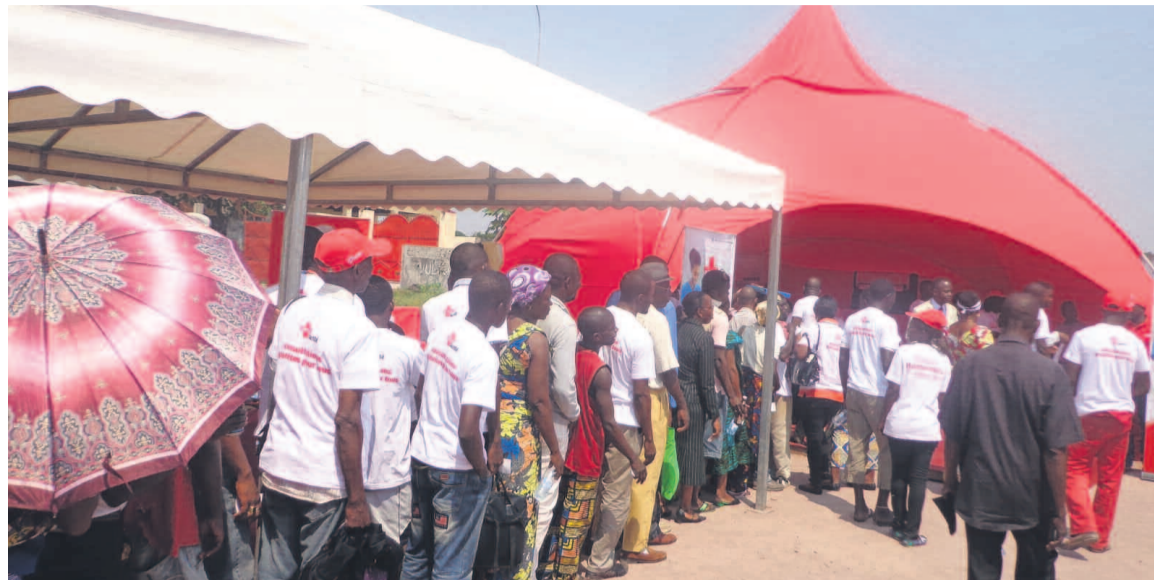
La population venue nombreuse aux consultations gratuites.

Soucieux du bien-être des populations congolaises, Airtel Congo s'est engagé, en partenariat avec l'ONG Depaget Medical Center, dans la lutte contre ces maladies. Intitulée «Airtel Santé», cette campagne consiste aux dépistages et aux consultations gratuites dans les quatre stands mobiles dont deux à Brazzaville et