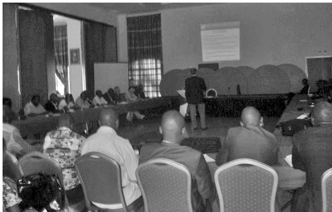
Les agents de la Marine marchande et ceux de la Douane congolaise pendant la réunion à Pointe-Noire

La CSC détermine des critères de sécurité, mais elle détermine aussi que ces critères de sécurité ne doivent pas être appliqués sans compréhension de la bonne nécessité des opérations commerciales. D'où l'importance de cette