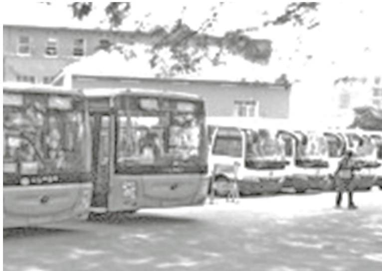
Des bus de l'hôtel de ville de Kinshasa

La ministre a souligné qu'un rappel est adressé à ceux se trouvant dans cette situation de pouvoir procéder aux réparations nécessaires, avant de se présenter de nouveau au contrôle pour obtenir