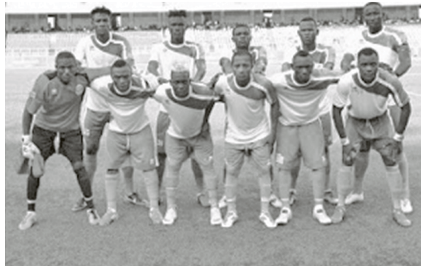
DCMP de Kinshasa

La deuxième journée du tour final de la Coupe du Congo de football 2014 est programmée pour ce 27 mai, avec les oppositions entre Lubumbashi sport et le FC MK de Kinshasa dans le groupe A, et entre AS Nika de Kisangani (Province Orientale) et Nyuki dans le groupe B. La troisième journée est prévue le 29 mai avec les rencontres DCMP contre FC MK dans un duel totalement kinois dans le groupe A, et Nika contre Lupopo dans le groupe B. Les deux premiers de chaque groupes s'affronteront en finale de la Coupe du Congo le 31 mai.