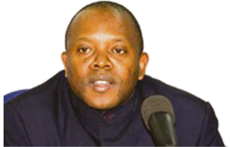
Abbé Apollinaire Malumalu

Le président de la Commission électorale nationale indépendante (Céni), l'abbé Apollinaire Malumalu, a publié le 26 mai le calendrier des élections urbaines, municipales, locales. Ce calendrier prévoit les municipales et locales à la date du 14 juin 2015, les élections des conseillers urbains, bourgmestres et chefs de secteur le 29 août 2015 ainsi que les élections des maires et maires adjoints le 15 octobre de la même année. L'un des préalables à ces échéances électorales est l'examen par le Parlement de l'annexe à la loi électorale portant répartition des sièges.