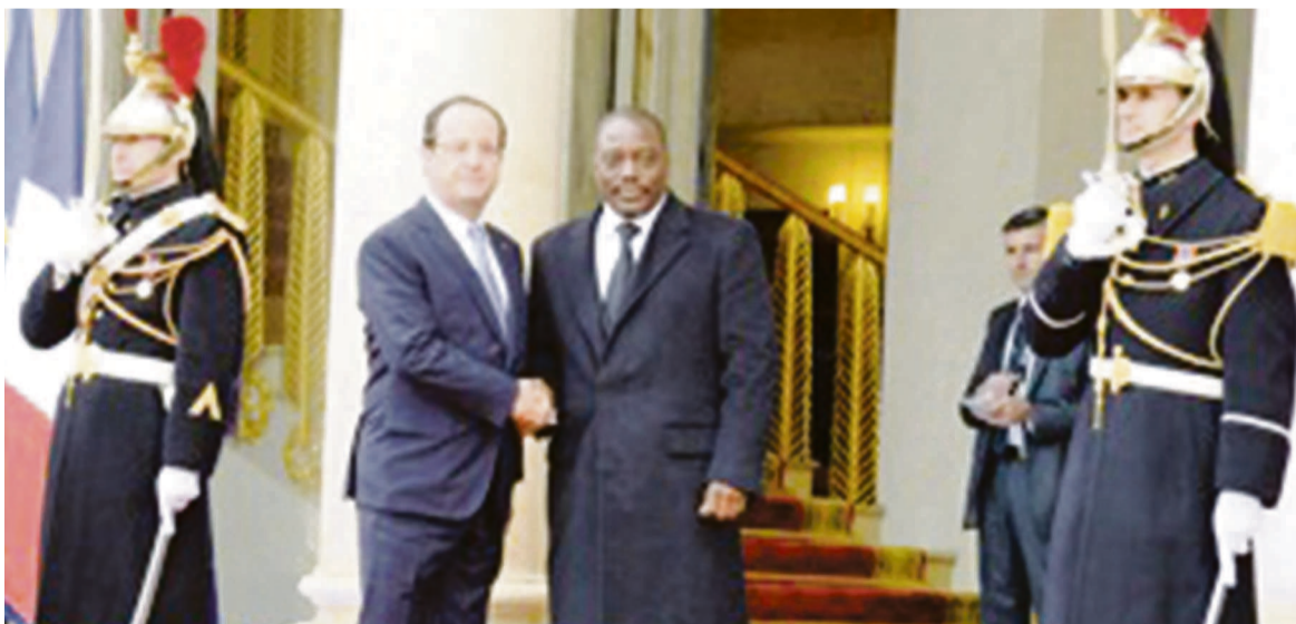
Poignée de main entre François Hollande et Joseph Kabila

Le Premier ministre Matata Ponyo invite les entreprises et investisseurs français à participer à l'essor économique de la République démocratique du Congo (RDC) qui offre d'énormes opportunités d'investissement.