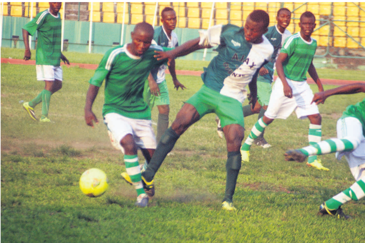
Devant Ajax de Ouenzé, les joueurs de JSP ont été plus réalistes.