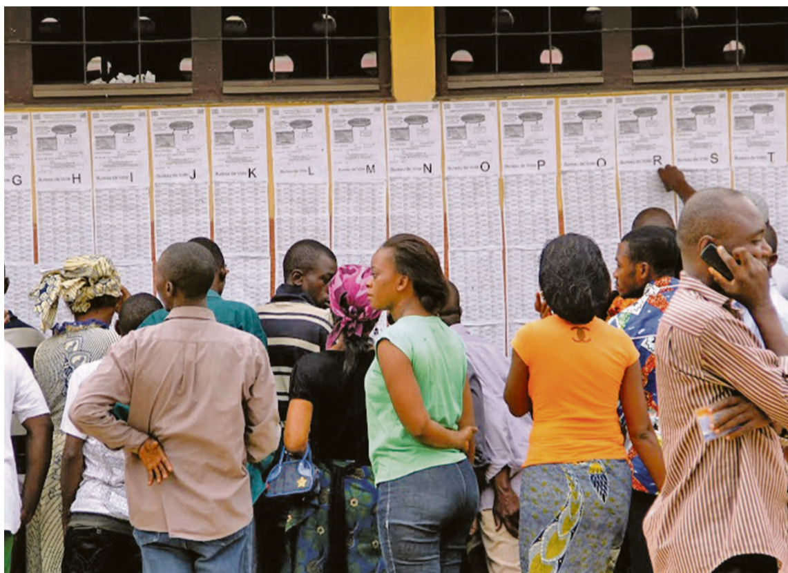
Des électeurs devant un bureau de vote à Kinshasa

En préférant commencer par l'organisation des élections urbaines, municipales et locales pendant que la tendance des parlementaires penche pour la tenue en liminaire des élections provinciales et sénatoriales, le président de la Céni serait tenté de les mettre devant le fait accompli. Page 11