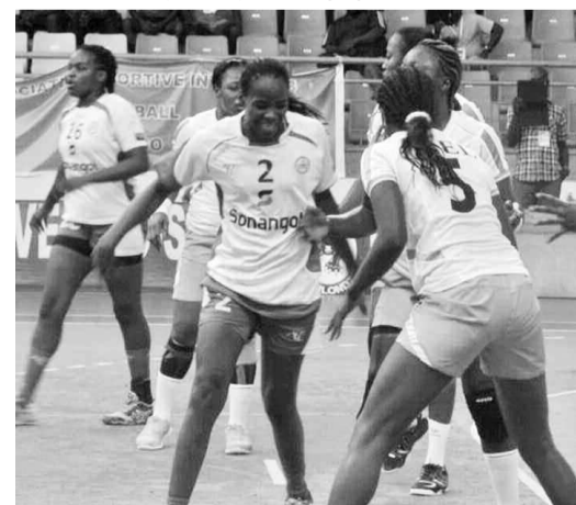
Un extrait du duel Asel/Petro.

Chez les messieurs, Patronage a réalisé sa deuxième victoire en battant Volcan du Cameroun, 36-33. Lundi, trois matchs se sont joués : Salinas du Gabon s'est imposé face à Volcan du Cameroun, 28-27 ; Espérance sportive de Tunis a écrasé Aspac du Bénin, 43-25 ; et Al Ahly a battu FAP du Cameroun, 28-18.