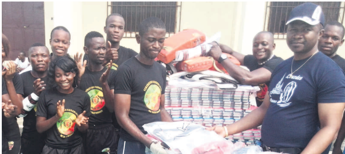
Remise officielle du matériel de compétition neuf.

Les équipements permettront d'améliorer les performances des athlètes, d'après le capitaine de l'équipe nationale de la discipline, Néhémie Moutsemo