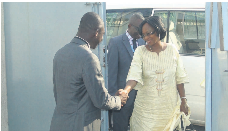
La représentante de l'OMS au Congo reçoit par le vice-pdt de l'ACA