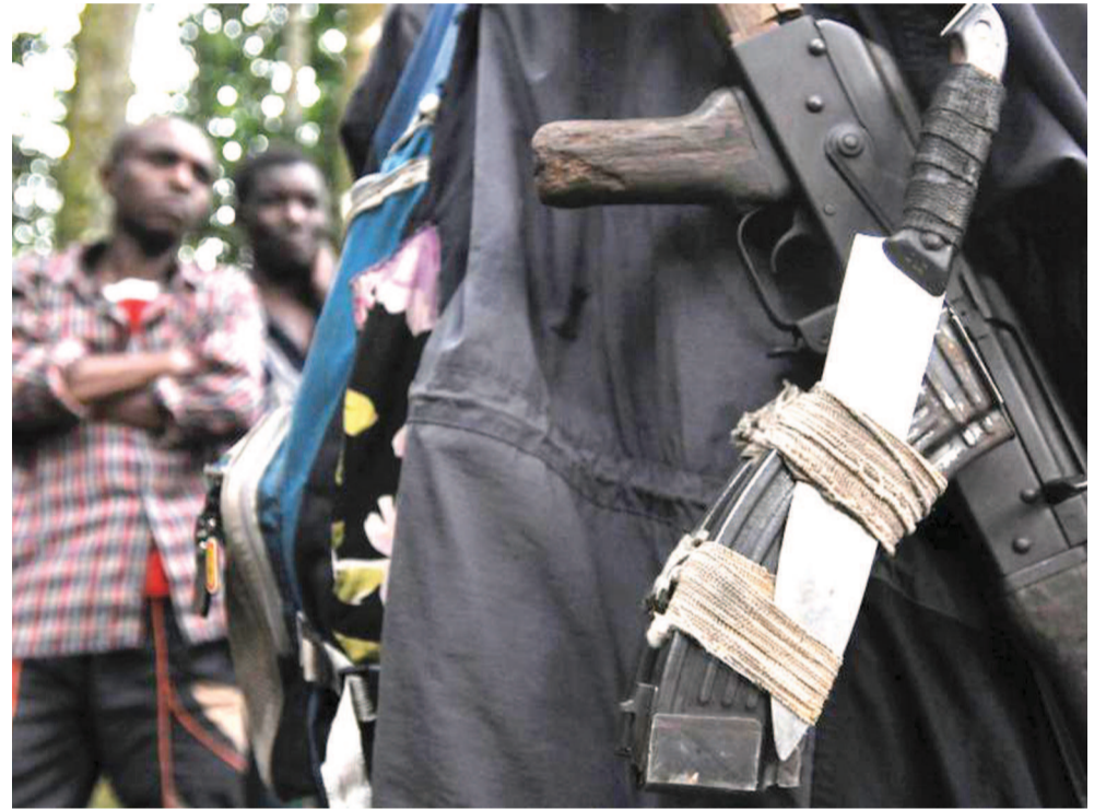
Les armes d'un rebelle hutu rwandais des FDLR dans la forêt autour de Pinga

Après près de vingt années de tentatives de redditions infructueuses, l'on croit savoir que cette fois-ci sera la bonne. Cette démarche devrait, de l'avis de la direction de ce groupe armé, conduire à la pacification de l'est de la RDC tout en poussant vers « l'organisation d'un dialogue franc, sincère pour un règlement pacifique et définitif du problème rwandais ». Page 20