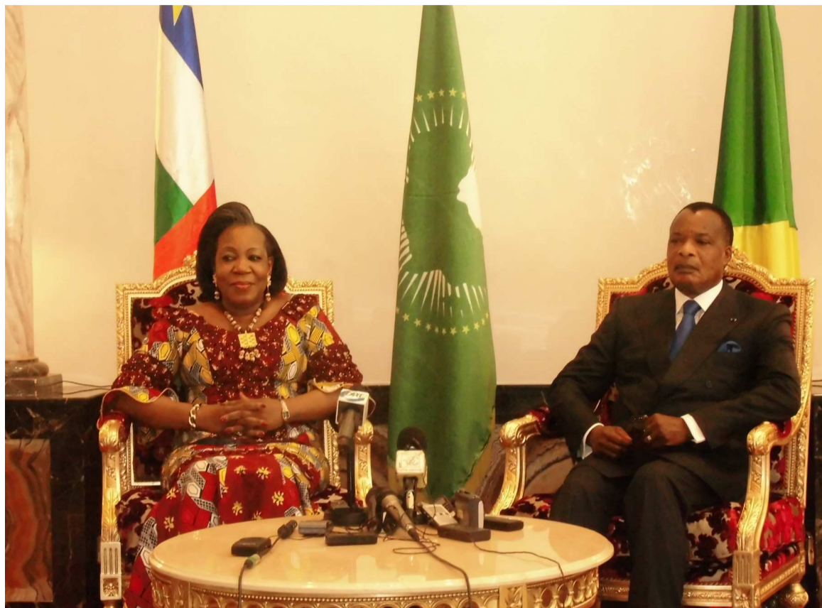
Les deux Chefs d'Etat répondant à la presse

La présidente de la transition centrafricaine, Catherine Samba-Panza, a séjourné à Brazzaville. Arrivée le 28 mai, pour une visite de travail de deux jours, elle a fait le point de la situation sécuritaire et humanitaire de son pays avec le médiateur de la crise, Denis Sassou N'Guesso.