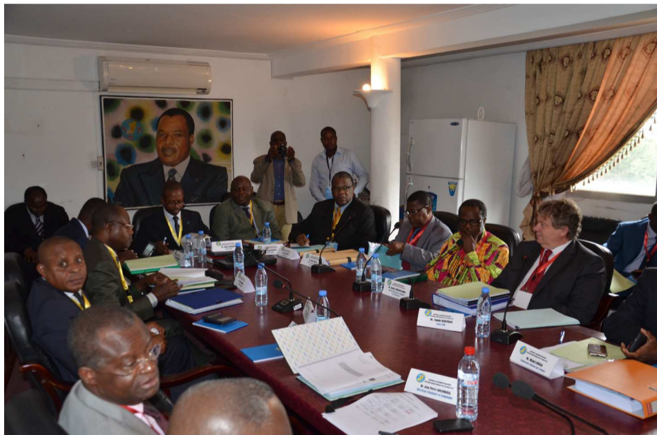
La session inaugurale du conseil d'administration de la SNE Quelques recommandations formulées

ce document. Le règlement intérieur du directoire a été amendé avec des réserves à cause des questions financières encore en suspens. S'agissant de la convention collective et du règlement intérieur de cette société, l'administration du travail et les syndicats poursuivent les contacts amorcés. Le but est de déboucher sur la signature d'un nouvel accord d'établissement. Le conseil d'administration a également adopté la note relative au traitement salarial des anciens directeurs en position de détachement dans les institutions de la République. « Ces textes permettront de conforter la marche vers la mise en œuvre des réformes et l'amélioration des performances de la société », a déclaré le président du