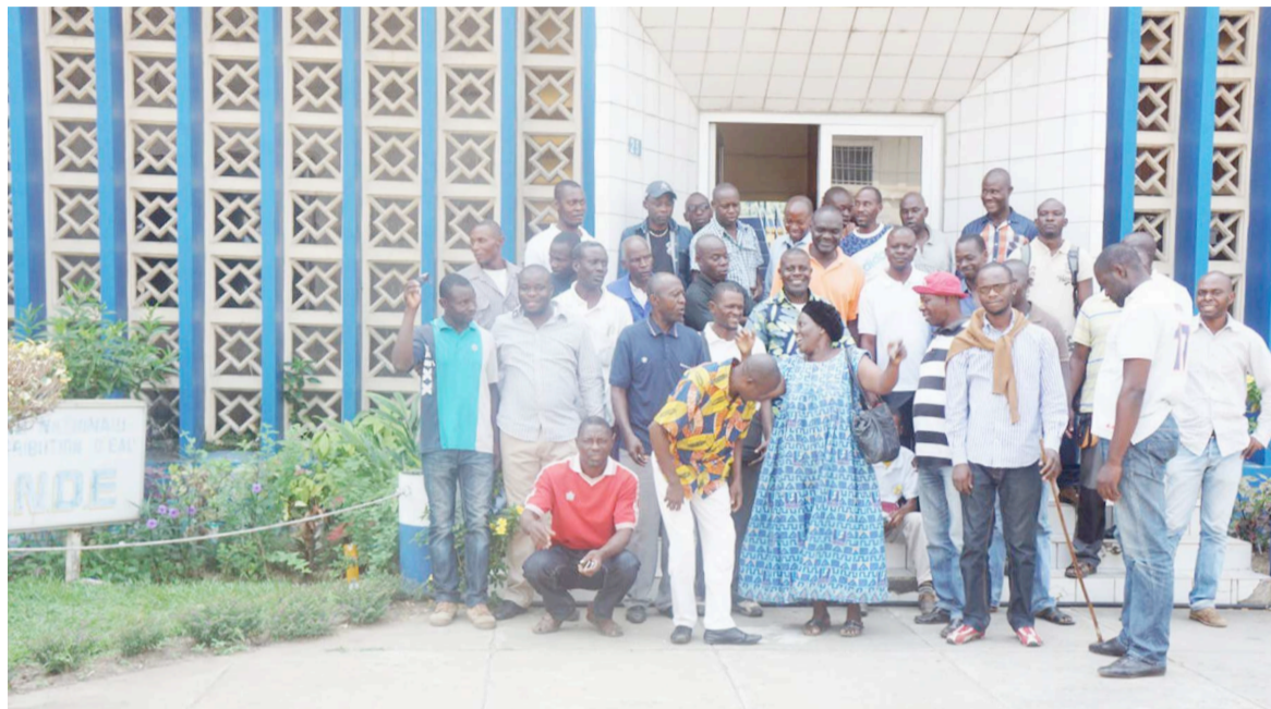
Un échantillon des grévistes à la direction départementale de la SNDE

Depuis le 9 mai, les agents de la direction départementale de la Société nationale de distribution d'eau (SNDE) du département de Pointe-Noire observent un arrêt de travail entraînant un dysfonctionnement dans l'approvisionnement en eau des différents quartiers de la capitale économique.