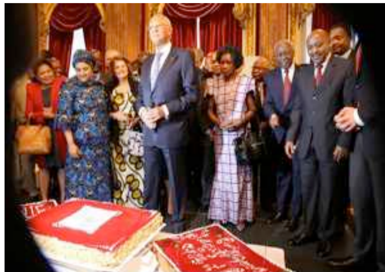
Des ambassadeurs africains lors de la cérémonie en France

Henri Lopes, ambassadeur du Congo en France et doyen du groupe des ambassadeurs africains accrédités dans l'Hexagone, a brossé le tableau d'une Afrique devenue un relai de croissance pour le reste du monde, avec des investissements directs étrangers en hausse même dans les secteurs des industries non extractives, l'émergence d'une classe moyenne et une population qui représentera d'ici 2050 un quart de la population mondiale avec 2,5 milliards d'habitants. « La page de l'afro-pessimisme et de la fatigue des donateurs est terminée, a asséné le représentant du Congo, le temps est venu pour nos partenaires de s'associer à nous dans la marche vers la prospérité. » L'ambassadeur n'a cependant pas nié les défis auxquels reste confronté le continent dans de nombreux domaines : intégration régionale, recherche scientifique, appui à la création, formation, parité, éducation, santé et assistance sociale. Avec des mots de solidarité touchants envers le peuple de Centrafrique, Henri Lopes a également évoqué les