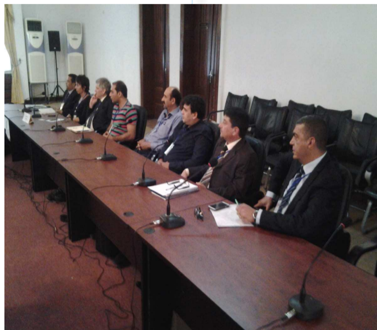
Une vue des chefs d'entreprises

Des arguments qui ne l'empêchent pas d'interpeller le gouvernement : «Nous sommes encore en retard sur de nombreux sujets, tels que le centre de formation des entreprises, par