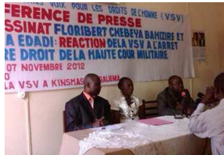
Des responsables de la VSV lors d'une conférence de presse sur l'affaire Chebeya

L'ONG, qui n'est pas convaincue que les élections telles que prévues dans le chronogramme élaboré par la Commission électorale nationale indépendante (Céni) et publié par son président, l'abbé Malu-Malu, aient lieu, appelle cette institution à changer son fusil d'épaule.