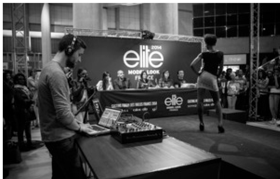
Le passage des candidates présélectionnées

Ce concours qu'Elite lance en Afrique veut donc promouvoir la beauté noire, la beauté africaine. Au programme, trois castings sont prévus : deux à Brazzaville, qui se dérouleront les 14 et 28 juin au Palais des Congrès, et un à Pointe-Noire qui se tiendra le 11 juin. Elite organise chaque année ce concours. Les candidates doivent être âgées de 14 à 22 ans, et mesurer au moins 1m72. Pour toutes les filles mineures, il faut une autorisation parentale pour se présenter ; la participation se fait gratuitement. L'agence Elite travaille en partenariat avec l'agence de communication Africontact que dirige Solange Samba Toyo, cette agence qui œuvre dans l'événementiel mais aussi dans le conseil en communication auprès d'entreprises et organisations internationales. Elle oriente et aide l'agence Elite dans la préparation et le lancement des castings, étant donné qu'Elite ne