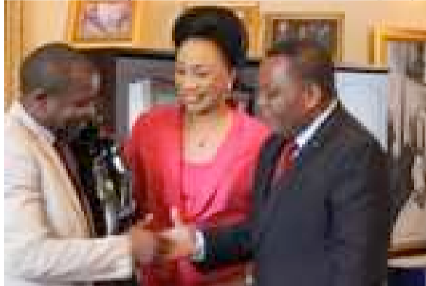
Le ministre de la Culture et des Arts du Congo remettant un présent au directeur général du Centre mémorial du génocide de Kigali