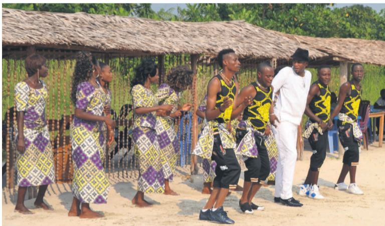
Le groupe Super Nkolo-Mboka et son patron lors de la réalisation du clip « Opaio »

L'enregistrement de ce bonus en version audio et vidéo par Djason Philosophe The Winner « O Vencedor », l'homme de la politique de l'intelligence de la jambe (l'os devant, la chair derrière) est l'émanation non seulement de son public, mais aussi de tous les mélomanes qui le suivent depuis le retour de son périple euro-américain