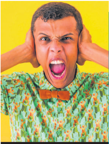
STROMAE - CHANTEUR