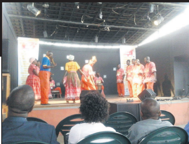
Le groupe traditionnel Limantsi.