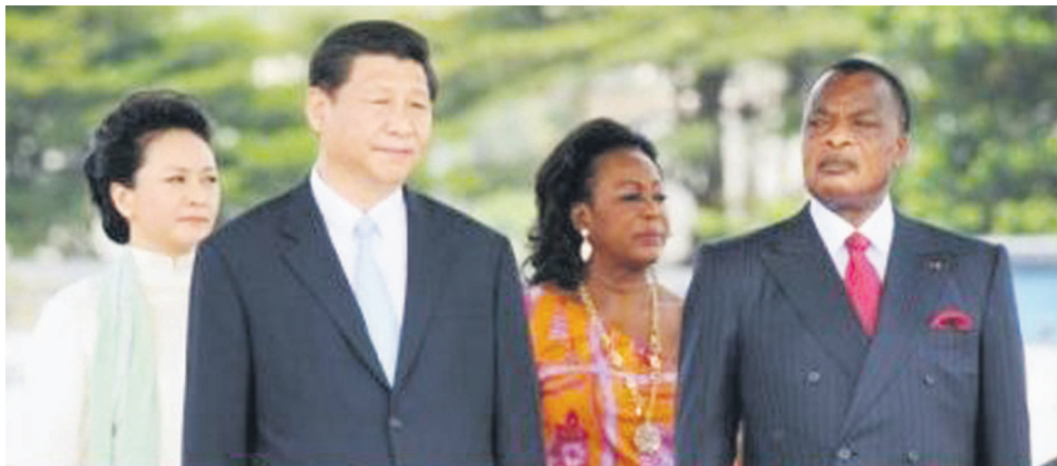
La réception du tout nouveau président chinois, Xi Jinping, les 29 et 30 mars 2013 à Brazzaville, constitue l'un des moments forts des 50 ans de relation entre le Congo et la Chine

« Au cours de cette visite, nous allons sûrement arrêter les nouveaux objectifs pour poursuivre le développement des relations entre nos deux pays. Nous allons, à travers ces visites, étudier l'expérience chinoise dans le développement des zones économiques spéciales, apprendre auprès des amis, passer des accords », a-t-il indiqué peu avant son départ, dans une interview accordée à nos partenaires de l'Agence Chine Nouvelles. Page 11