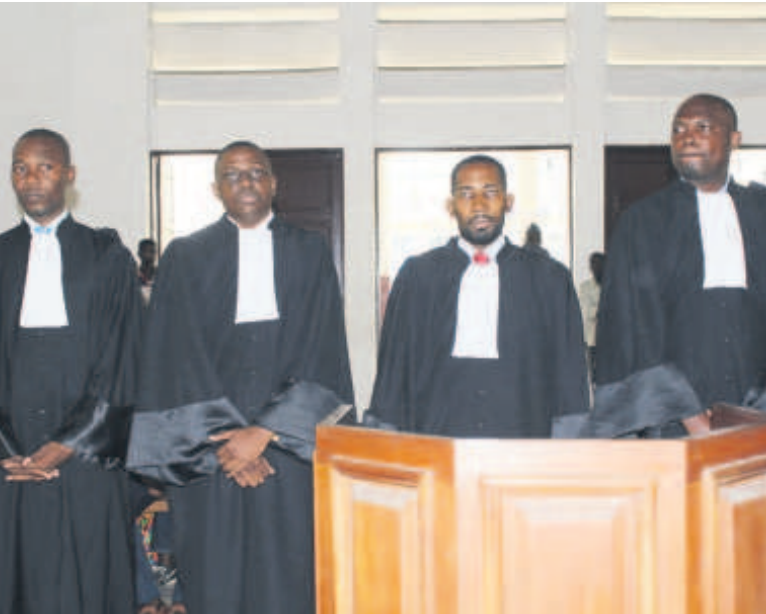
Les avocats stagiaires