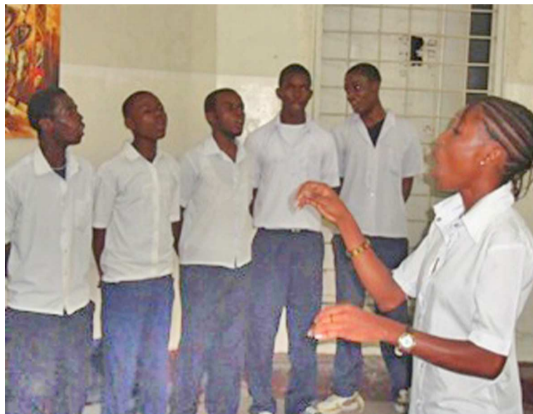
Quelques élèves finalistes chantant un cantique

Des attroupements autour des centres sont prohibés et leurs auteurs passibles des sanctions, indique-t-on au ministère. Dans les districts et territoires du pays, en proie aux menaces des groupes armés, des dispositions sécuritaires ont également été prises pour permettre aux candidats finalistes de passer leurs épreuves en toute quiétude. Plus de mille six cents centres ont été réquisitionnés pour accueillir les six cents mille candidats à cette épreuve, apprend-on. La culture-générale, les branches spécifiques à chaque option, les matières scientifiques ainsi que le