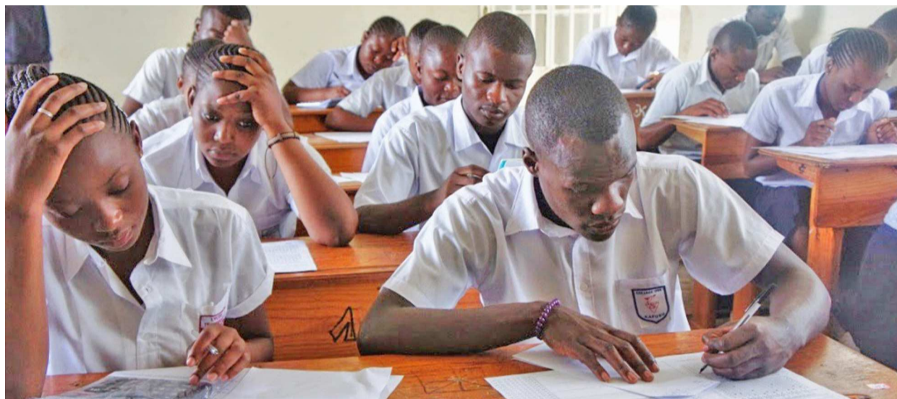
Élèves en pleine session dans une salle de classe

Toutes les dispositions ont été prises pour que les épreuves se déroulent dans les meilleures conditions, y compris dans les écoles consulaires établies dans les pays limitrophes. Ces assurances du ministre de l'Enseignement, primaire, secondaire et professionnel (EPSP) laissent entrevoir un déroulement serein des épreuves surtout dans les zones à trouble, à l'Est, où les forces de l'ordre sont à pied d'œuvre pour sécuriser les centres d'examen. Près de 94.224.000 finalistes du secondaire répartis dans 1.673 centres éparpillés sur toute l'étendue du territoire national sont attendus à cette session ordinaire des examens d'État, indique-t-on. La culture générale, les branches spécifiques à chaque option, les matières scientifiques ainsi que le français et l'anglais seront au menu des dites épreuves censées couronner le cycle secondaire des prochains diplômés d'État. La seule particularité de cette session réside dans la publication au même moment de tous les résultats, qu'il s'agisse des options d'enseignement général ou technique.