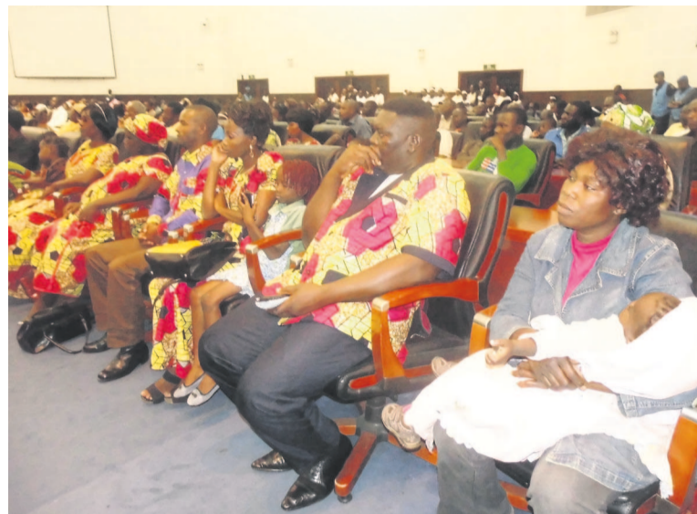
Les réfugiés présents dans la salle.

« Les restrictions dans l'exercice de certaines activités, telles que le petit commerce, par les étrangers ne sont guère de nature à nous faciliter la tâche. Nous ne contestons pas le contrôle d'identité fait par les autorités du pays d'accueil, mais nous regrettons le fait que nos documents de séjour délivrés par les autorités compétentes ne sont pas considérés à leur juste valeur. Votre attention particulière sur ces dossiers mettra nos familles à l'abri de la misère et de diverses tracasseries », a-t-il lancé au