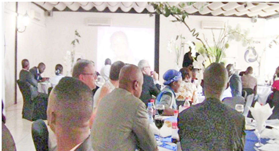
Une vue partielle de l'assistance lors de la projection du documentaire-reportage