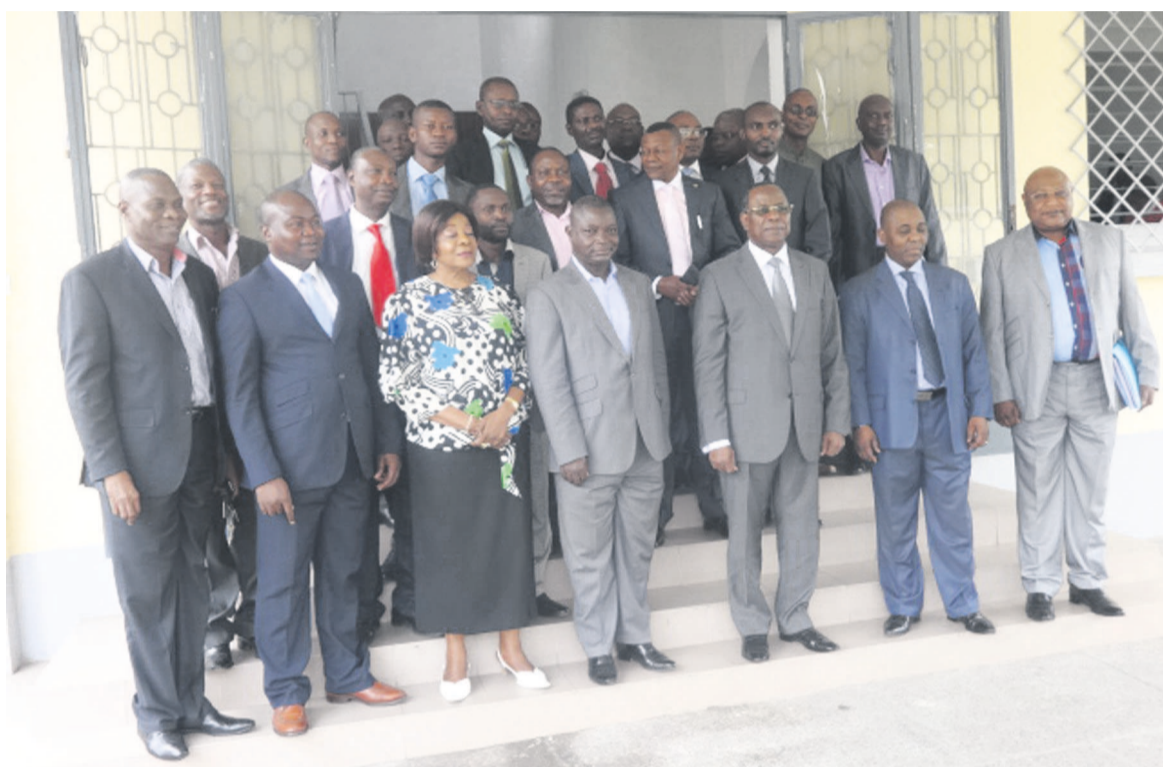
La photo de famille

Pour la quarantaine de participants venus des différentes administrations relevant du ministère du Transport, les acronymes utilisés en matière de marché public n'ont plus de mystère. Ils peuvent aussi différencier une bonne d'une mauvaise soumission et déceler les mauvaises pratiques susceptibles d'engendrer des contentieux.