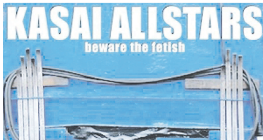
L'album de 12 titres paraît en double CD

L'opus, produit par Crammed Discs, est un double CD qui sera sur le marché à partir de ce lundi 23 juin.