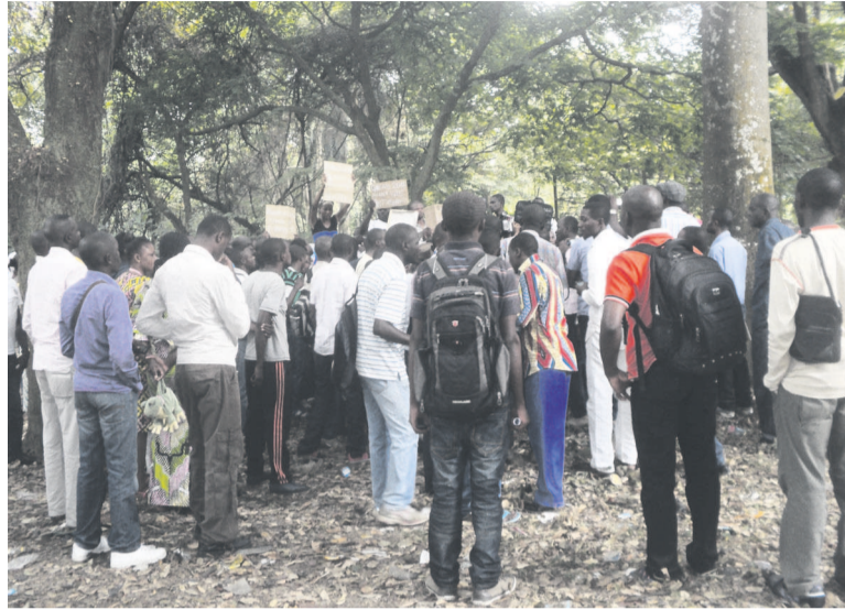
Les diplômés des écoles de formation réclament leur intégration à la Fonction publique.

Selon les responsables de ces deux structures, qui regroupent environ 13 164 diplômés sans emploi sortis, entre autres, de l'École nationale des instituteurs (5 000), de l'École médicale et médico-sociale (3 800), de l'Institut supérieur d'éducation physique et sportive (1 200) et de l'Institut national de la jeunesse et des sports (1 200), leur calvaire a trop duré. « Le budget est à son troisième trimestre d'exécution. Aussi, avons-nous décidé d'organiser des sit-in pacifiques devant les ministères des Finances et de la Fonction publique le mardi 24 juin, si rien n'est fait pour remédier à la situation. De même, nous avons décidé d'animer des espaces médiatiques sur les chaînes nationales pour alerter l'opinion sur notre situation qui