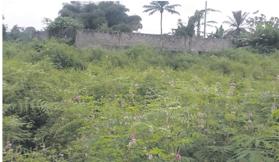
Un bâtiment inachevé

Parmi les ouvrages non achevés ou abandonnés, figure la résidence du sous-préfet, dont les travaux ont été confiés à l'entreprise GECC. Selon les sources locales, le chantier « a été abandonné dès son lancement en 2006, avec un taux de réalisation qui n'atteint que 30 %. L'entrepreneuse en charge dudit chantier serait décédée et aurait été remplacé par l'un de ses frères qui aurait pris la clé des champs ». Actuellement, les lieux sont envahis par les herbes : hérissos, rats palmistes, serpents et autres