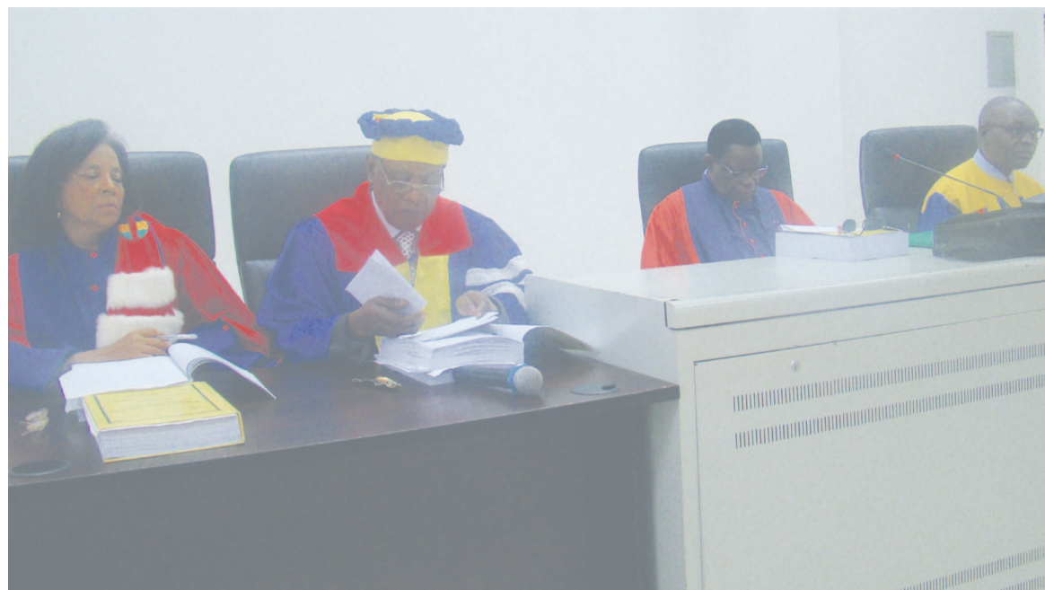
Les membres du jury