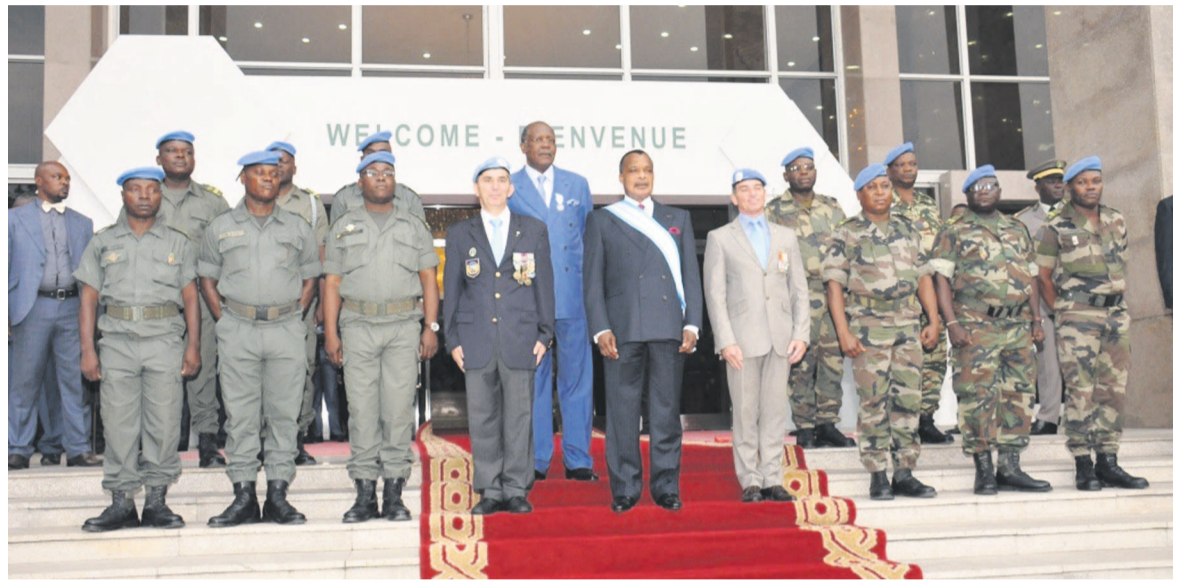
Les soldats de la paix posant avec Denis Sassou N'Guesso

L'Association internationale des soldats de la paix (AISP) a honoré ce 15 juillet à Brazzaville, le président de la République, Denis Sassou N'Guesso, en l'élevant à la dignité de Grand-Croix de la commémoration de la paix.