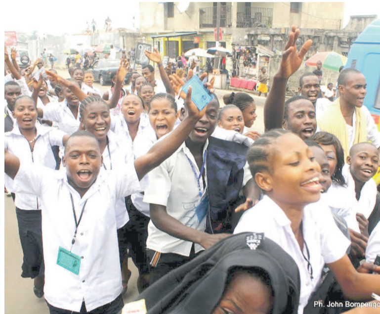
Des élèves en pleine jubilation après la publication des résultats

Chose promise, chose due. Le ministère de l'Enseignement primaire, secondaire et professionnel (EPSP) a débuté le lundi tard dans la soirée la publication des résultats des examens d'État pour l'édition 2014. Tous les résultats de toutes les filières sont, en effet, disponibles sur le site du ministère de l'EPSP. À Kinshasa, des scènes de joie et d'hystérie collective étaient enregistrées un peu partout au point de mettre toute la ville sens dessus-dessous. Avec un total de 120.258 participants à cette épreuve nationale, l'on note un taux de réussite avoisinant les 58%, soit une augmentation de 4% par rapport à l'année passée. Tôt dans la matinée du 15 juillet, des lauréats ont pris d'assaut les différents carrefours de la ville pour extérioriser leur joie. La voie publique a été littéralement inondée par ces jeunes diplômés qui allaient dans tous les sens chantant et dansant à grand renfort gestuel. Visages saupoudrés, ils étaient carrément incontrôlables. Des scènes de débordement étaient enregistrées à certains endroits au grand dam des agents de l'ordre qui avaient du mal à maîtriser la fougue des lauréats. Perchés sur des véhicules réqui-