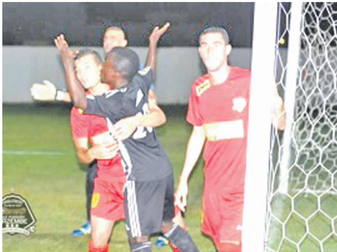
Vue du match amical Hussein Dey d'Algérie vs Mazembe à Tunis