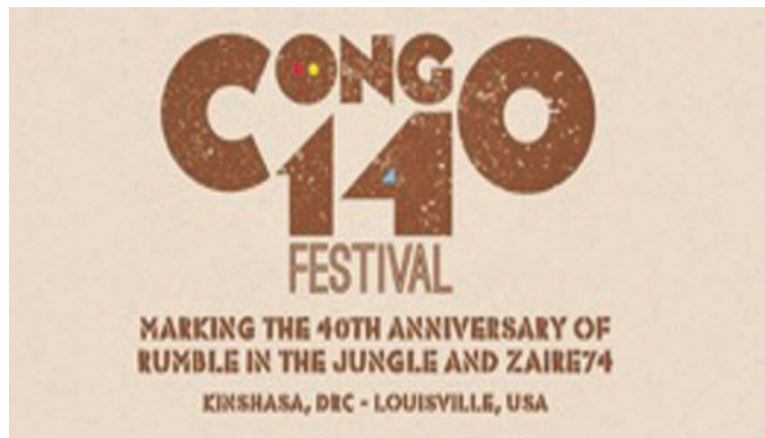
L'affiche-annonce de Congo14

Cette fois, il n'est pas uniquement question de sport car, pour