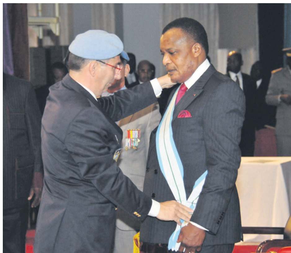
La remise de la décoration par le président de l'AISP