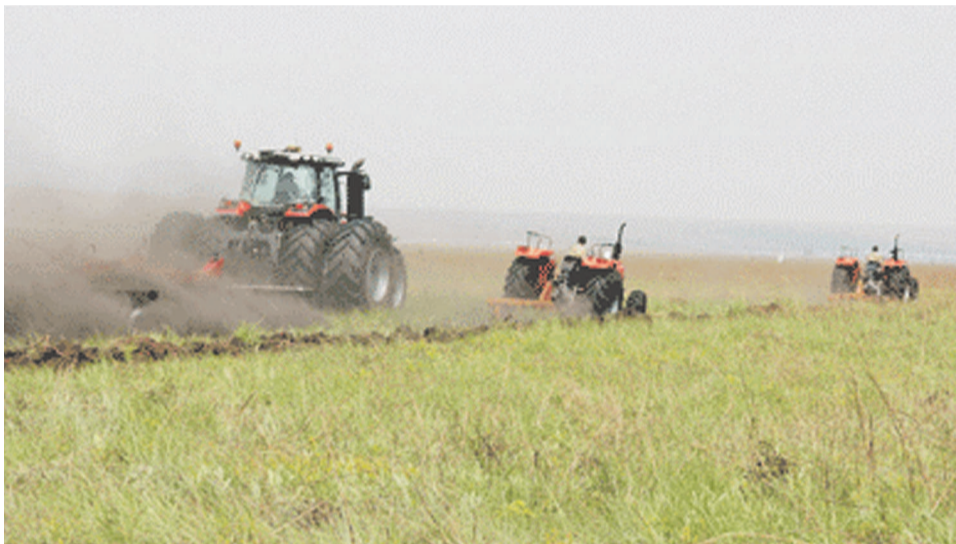
Parc agro-alimentaire de Bukanga-Lonzo