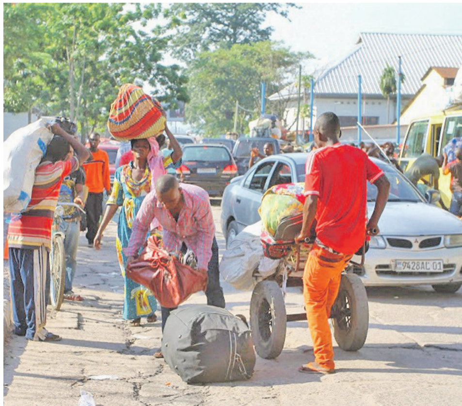
Quelques refoulés de Brazzaville faisant leurs valises

Une opération totalement prise en charge par le gouvernement qui attend, par ailleurs, une autre vague des expulsés dans les prochaines semaines. Les cinquante-six expulsés en instance de réinsertion sociale constituent la première vague d'une série d'arrivées de ces compatriotes attendus au Katanga au moment où le site de Maluku à Kinshasa est en passe de fermer ses portes. Notons qu'environ 130.000 ressortissants de la RDC ont été expulsés du Congo-Brazzaville depuis le début de l'opération « Mbata ya bakolo », à en croire les derniers chiffres avancés en mai dernier par l'ambassadeur de l'Union européenne, Michel Dumont.