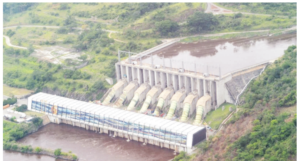
Vue aérienne du Barrage d'Inga

La visite de travail du vice-président pour la région Afrique de la Banque mondiale (BM), Makhtar Diop, a permis de réaffirmer des points de convergence avec la RDC sur les ques-