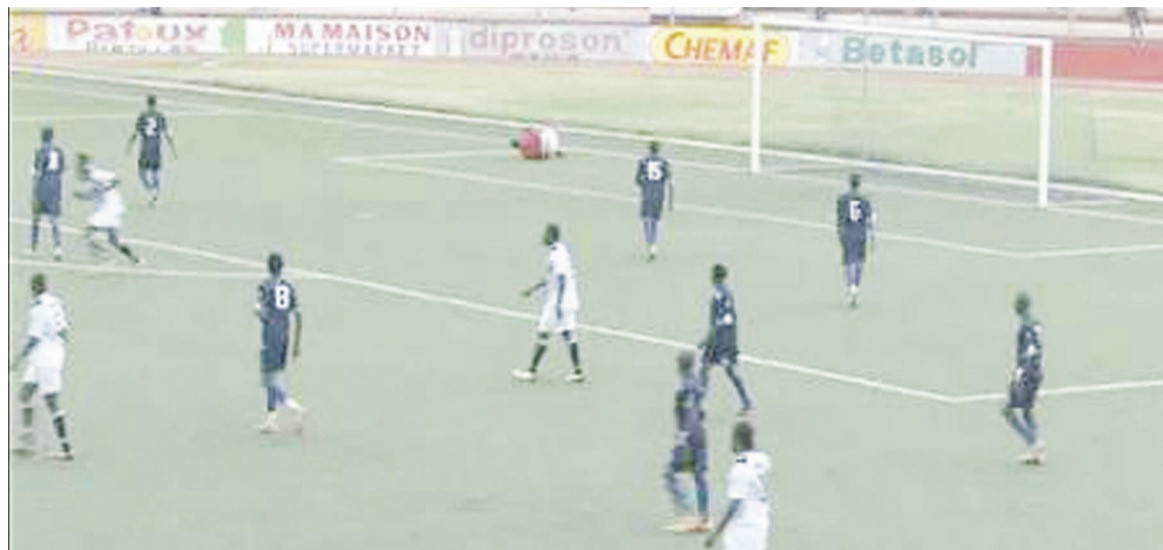
Vue d'un match au stade Frédéric-Kibasa de Lubumbashi