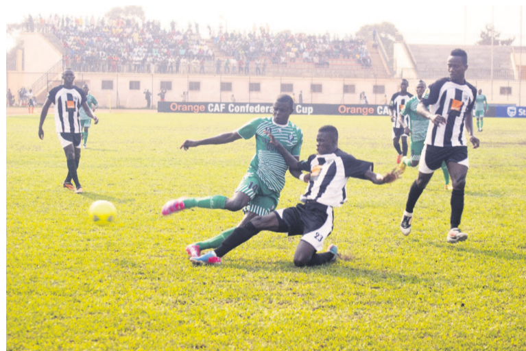
Une des actions témoignant de l'inefficacité devant les buts des Léopards de Dolisie.

l'obligation de remporter leurs deux dernières rencontres pour ne pas dépendre des résultats de l'AS Réal de Bamako, leur concurrent direct. Le club dolisien aura alors onze points et risquera plus gros car rien ne pourra lui arriver. Cela revient à dire que même à Garoua le 10 août, le match nul pourrait ne pas être le bon résultat encore moins la défaite. Car si les Léopards se contentent d'un match nul et le