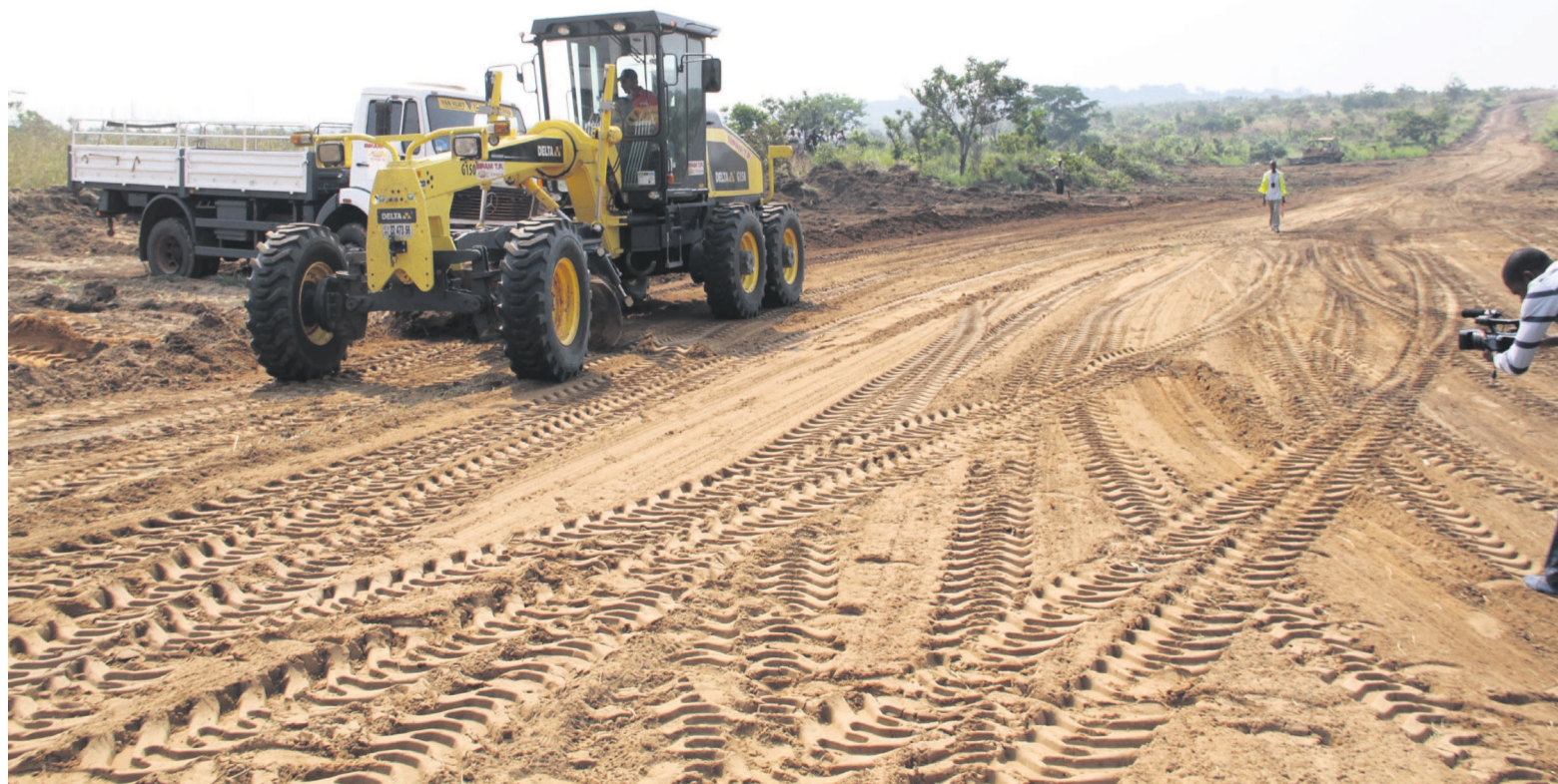
Ouverture d'une route en terre dans les Plateaux.

Propos recueillis par Gankama N'Siah et Guy-Gervais Kitina