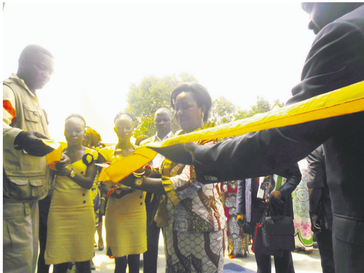
L'épouse du chef de l'État coupant le ruban symbolique.

Le bâtiment comprend une salle de soin totalement équipée ; un espace de réception des patients ; une pharmacie complète ; une salle de gynécologie avec échographe ; un laboratoire équipé en matériel de dernière génération ; deux salles d'observation ; et six lits pour femmes et hommes. Il est doté d'un bâtiment principal de 400 mètres carrés ; d'une large cour