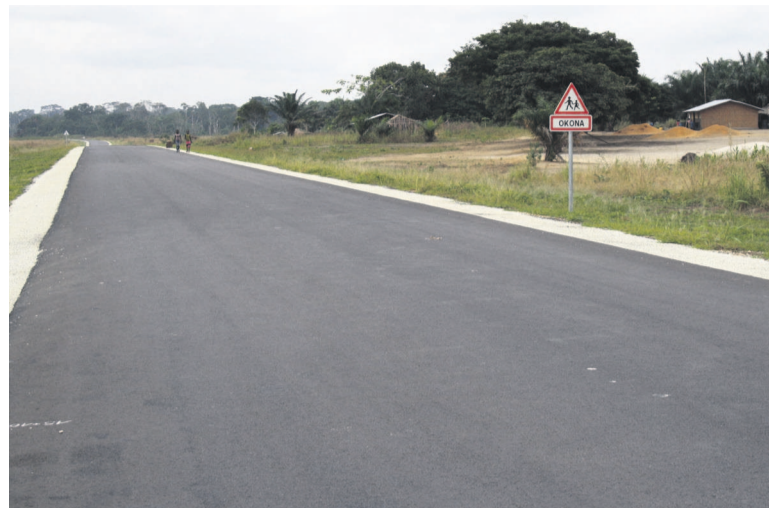
Une route bitumée dans la Cuvette

Le nouveau code qui régit les modalités et procédures d'attribution des marchés publics et autres prestations