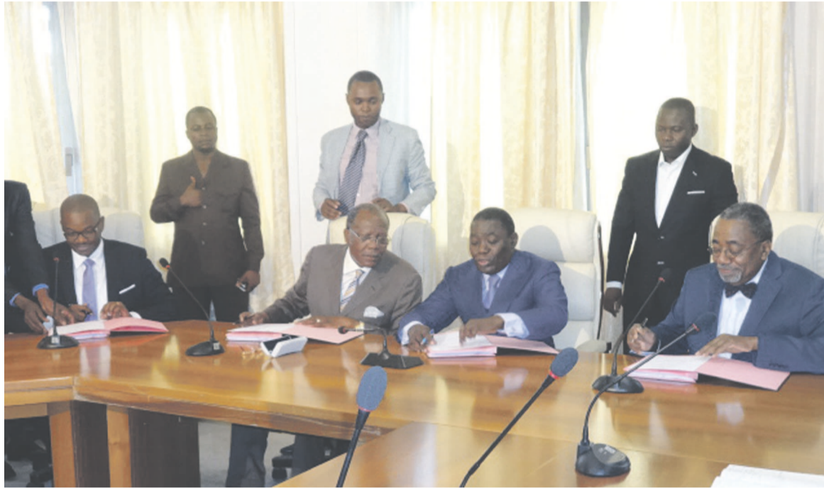
Signature de la convention entre les membres du gouvernement

En termes d'investissement, Congo Iron aspire atteindre les 5 milliards de dollars (plus de 2.000 milliards FCFA). « Avec le temps, il faut prendre en considération l'inflation et le coût des différentes matières premières. Il y a toujours urgence à lever les fonds de manière assez rapide face à la concurrence avec