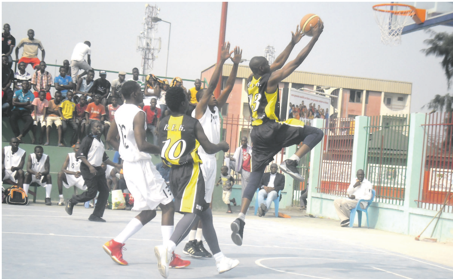
Une phase de jeu de la finale

Pour la finale du championnat départemental, les Diablotins ont abordé la rencontre en dominant. Dans les premières minutes du premier carton, les Noir-et-Jaune étaient maîtres du jeu bien avant que les basketteurs de l'Inter ne renversent la vapeur en emportant la partie 13 contre 9. Le deuxième carton a souri aux Diables noirs : 13 à 9 en leur faveur. À la pause, Inter club menait donc 22 à 20. De retour des vestiaires, Inter club n'a plus lâché prise, contraignant son adversaire à la défaite. Finalement, les militaires l'ont emporté 57 à 46. Une moyenne de buts jugée contre-performante par certains techniciens interrogés à ce sujet. Autant dire que les résultats