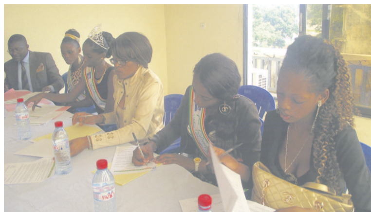
Les lauréates signant les textes d'engagement

nationaux, voyages à l'étranger où à l'intérieur du pays pour lesquels elle serait désignée et devra se conformer aux règlements qui lui seront communiqués, effectuer les formalités nécessaires (passeport, visa, vaccination, examens médicaux). Par ailleurs, le COMICO est seul habilité à décider de sa participation aux différents