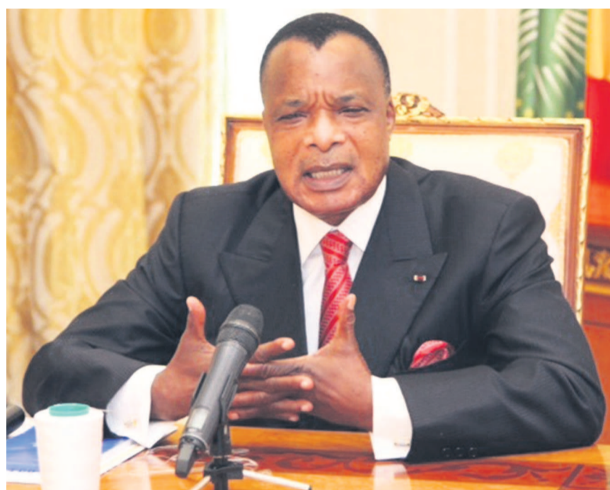
Le chef de l'État donnera une communication ce 1 er août sur les questions de paix et de sécurité