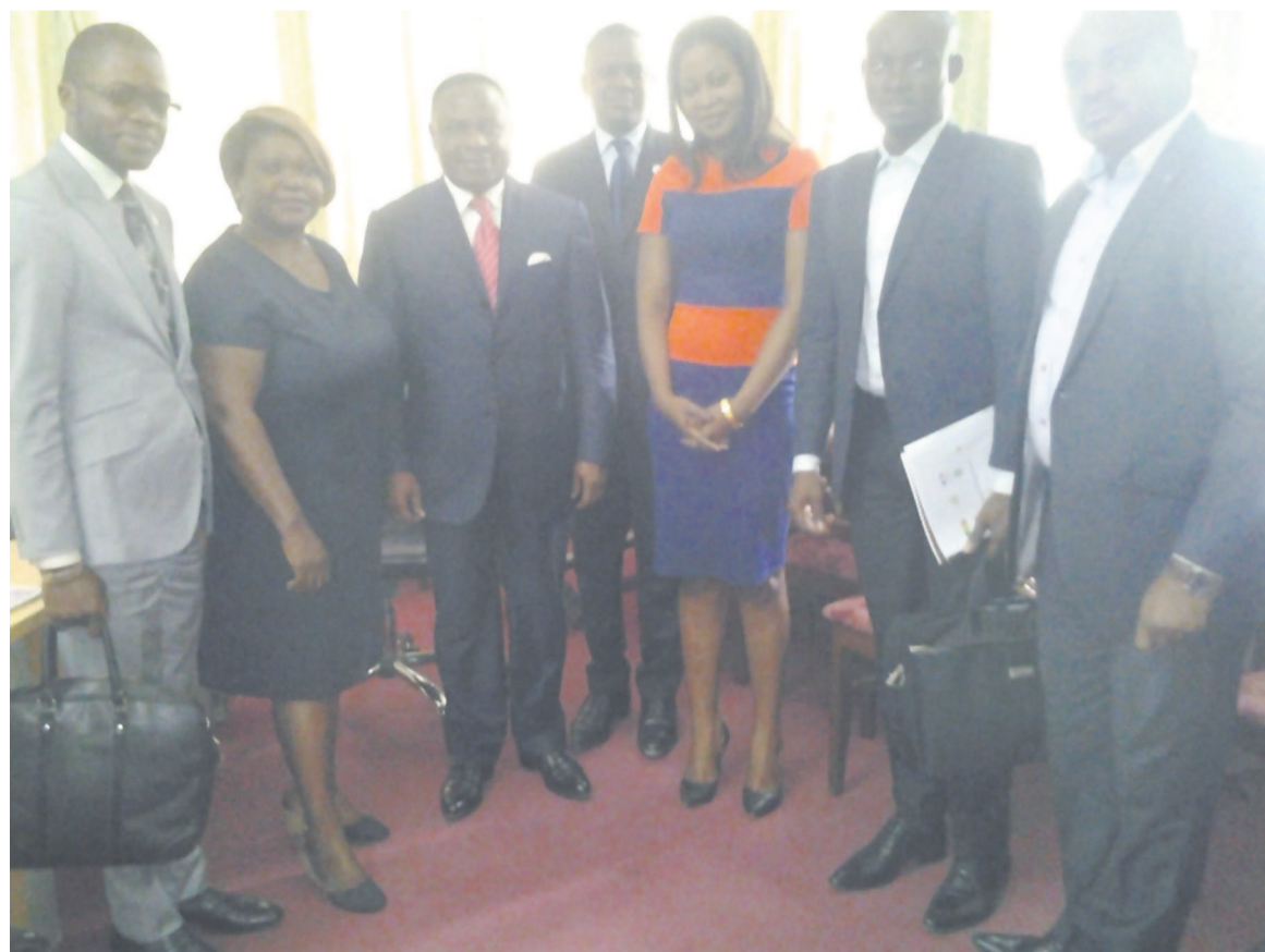
Le ministre de l'Agriculture encadré par les deux femmes de la délégation après la réunion.

« Notre motivation de lancer ce projet vient du constat que nous importons presque tout, alors que nous avons une terre fertile à cultiver. Nous voulons aider principale-