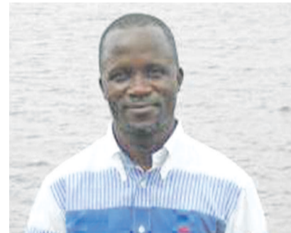
Hugues Eta (© Adiac)

À travers sa poésie avant-gardiste, l'auteur dépeint une jeunesse africaine qui se cherche mais aussi les douleurs d'un peuple laminé par la rudesse du temps. Poète d'avenir à l'écriture sobre et simple, Hugues Eta a une poésie qui coule toute seule comme les eaux douces d'une rivière « En 2012, j'ai lu dans la presse qu'Hugues Eta était lauréat du prix Paul-Eluard de poésie pour son recueil L'Âme des larmes . Ce qui ne me surprend guère tant son premier recueil était une belle promesse. Dans son dernier roman, on ressent l'empreinte de la poésie, parfois de manière heureuse quand la langue est cristalline, parfois trop lyrique quand il abuse de l'image ou d'une formule frappée, mais ces détails n'atténuent ni la force du récit ni la fluidité de la langue de ce texte, où Hugues Eta est tour à tour paysagiste-géographe, lorsqu'il décrit les errances du héros le long du fleuve, chroniqueur lucide, quand il narre les tribulations de Mpiko. Il y a dans ce récit une tendresse manifeste de l'auteur pour sa terre natale et un besoin urgent de participer à la naissance d'une nation plus fraternelle, davantage culturelle, plus humaine, dans la-