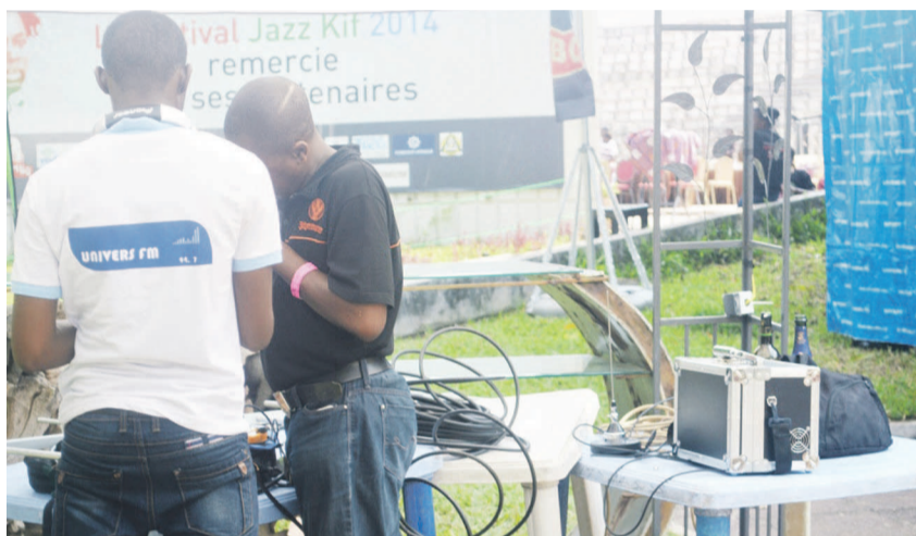
La radio événementielle Univers FM

Positionnée comme première radio événementielle de Kinshasa, Univers FM s'est donné les moyens d'assurer les meilleures couvertures et retransmissions en direct des grands événements culturels et sportifs du pays. À