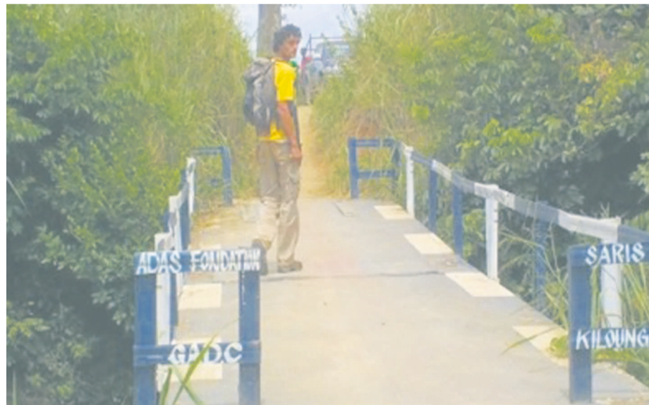
Vue de la passerelle communautaire

Ce projet vise à résoudre un problème de salubrité important, particulièrement, en période de pluies. En effet, ces villages n'étant pas équipés en latrines, les déchets organiques des habitants sont déversés dans la rivière située en aval.