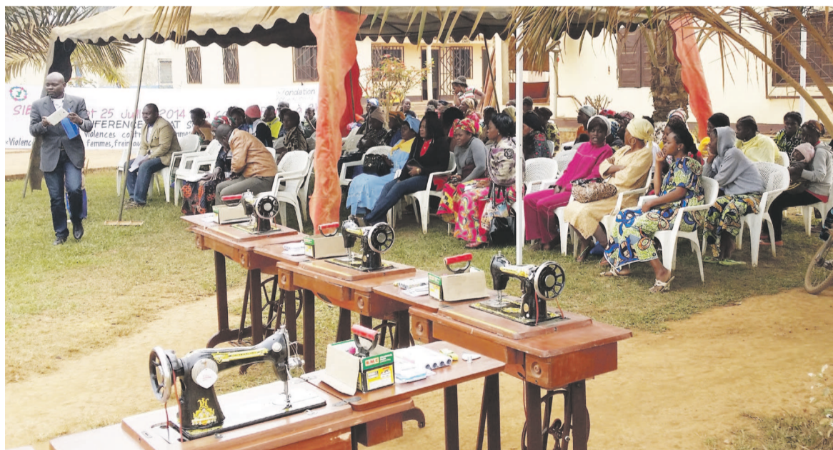
Les kits de couture offerts aux femmes vulnérables de Sibiti

La descente de Sibiti, dans le département de la Lékoumou, qui intervient après celle de Brazzaville, avait pour but de renforcer les capacités des femmes vulnérables et de les doter de certains kits.