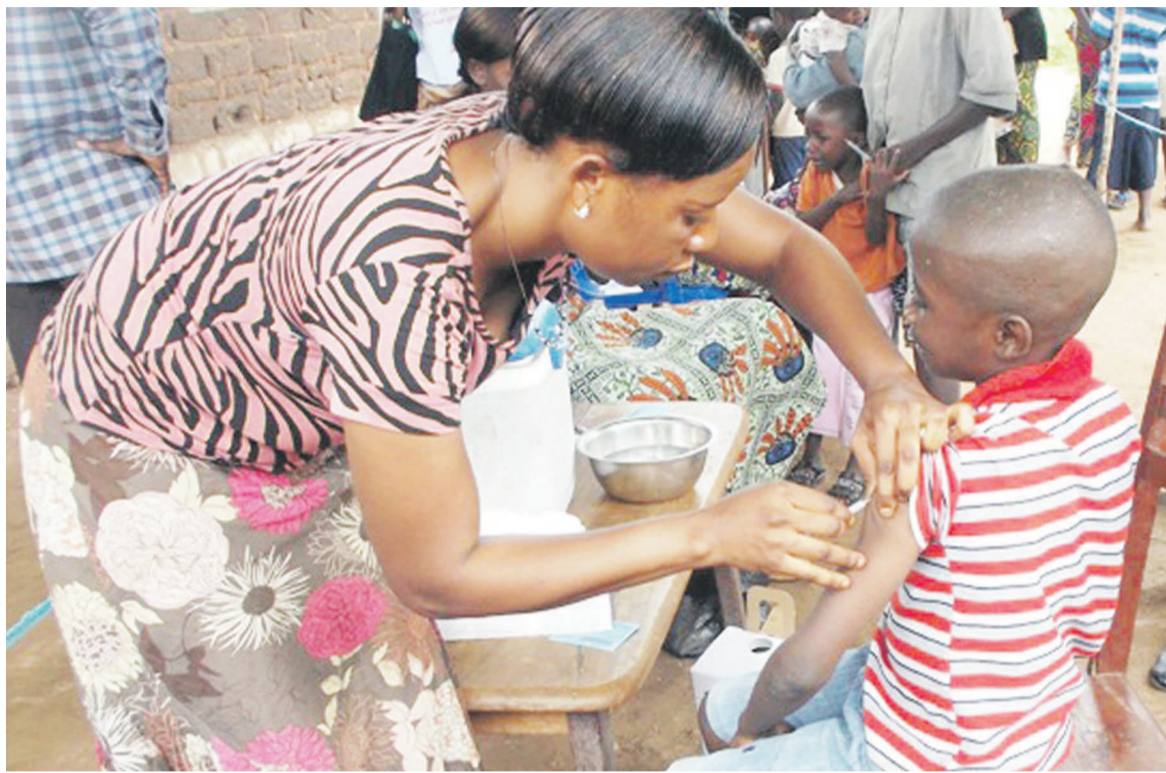
Un enfant se fait vacciner contre la rougeole dans un des sites fixes

DMM : Oui. Dernièrement j'étais appelé quelque part pour représenter l'Église dans le cadre de la vaccination. J'étais parmi les vaccinateurs, nous sommes allés dans les ménages de nos fideles partout où il y avait de résistance. Comme ils me connaissent, ils acceptent de faire vacciner les