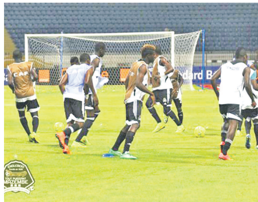
Mazembe à l'échauffement avant le match contre Zamalek à Alexandrie