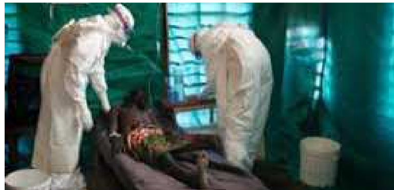
Un patient de la maladie à virus Ébola dans un centre d'isolement

À l'entendre parler, dès l'annonce de cette épidémie, le gouvernement qui s'était déjà préparé en mettant en place un plan de contingence pour lutter contre cette maladie, qui s'était déclarée depuis le mois de juin en Afrique de l'Ouest, a mis en œuvre toutes les interventions dudit plan pour empêcher l'extension de cette maladie dans d'autres provinces du pays. Parmi ces mesures, le Dr Roland Shodu cite la mise en quarantaine du secteur de Djera. « sur place, on a mis sur pied le système de cheking point tenu par les agents de la police aux frontières qui sont dotés de thermomètres laser pour contrôler tout mouvement. Le gouvernement a aussi mis