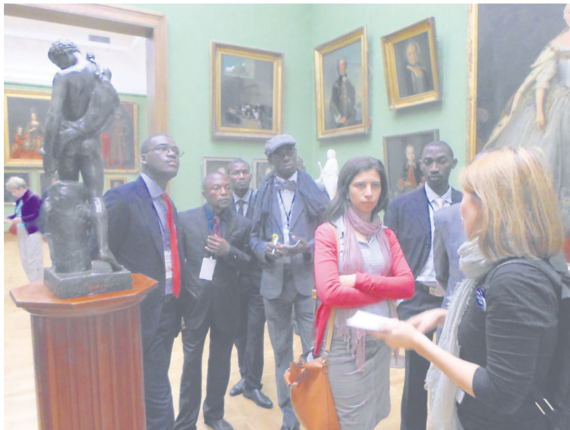
Visite de la galerie nationale Tretyakov

Au Palais des Armures, les membres de la délégation africaine se sont fait une idée de l'opulence dans laquelle vivaient les familles royales. Robes dorées et couronnes qui accentuaient la beauté de Catherine La Grande de Russie, trônes en or massif sur lequel les tsars et les princes calaient leur physique imposant... Pour terminer en beauté cette série de visite des sites culturels, les jeunes leaders devraient se rendre au pied de la tour de Moscou, le mausolée Lénine et bien d'autres. Le temps de sé-