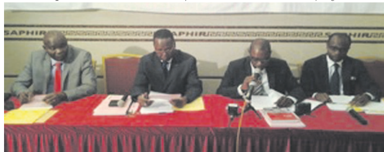
Le coordonnateur du Padé, encadré à droite, lors de l'atelier des PME performantes et dynamiques.

des partenaires économiques étaient représentés. « Notre pays est entré dans la phase de la diversification de l'économie. Au cours de celle-ci, il faut avoir