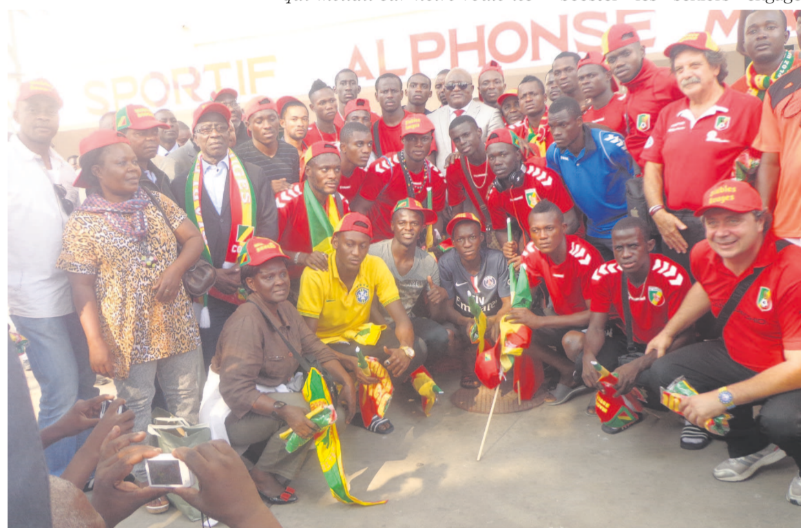
Les Diables rouges juniors après leur réception au Stade Alphonse-Massamba-Débat

CAN 2015 en est une illustration patente de la flamboyance du football congolais. Qui eut parié à la qualification de notre équipe après l'annonce des résultats du tirage au sort qui mettait sur notre route les