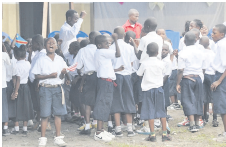
Les élèves d'une école de Kinshasa et leurs encadreurs

L'exhortation faite par le Syndicat des enseignants du Congo (Syeco) a été motivée par une prévision de majoration de salaire dès octobre.