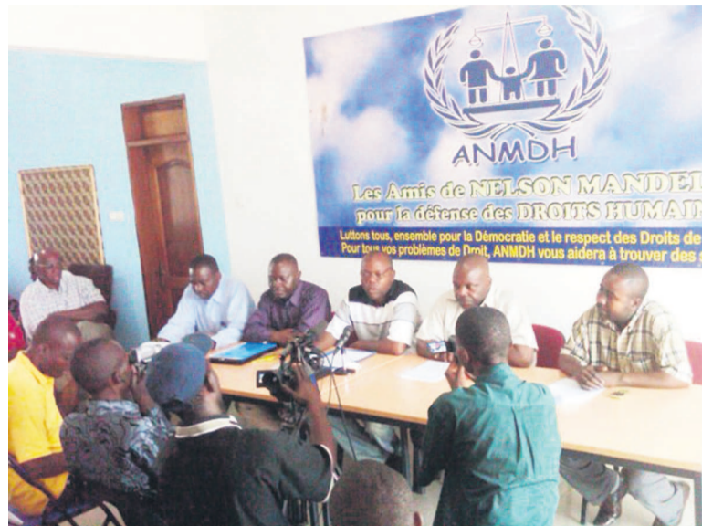
Des responsables des ONG des droits de l'Homme, lors d'une activité commune menée au siège des ANMDH

Les organisateurs entendent, en outre, analyser des raisons révisionnistes avancées par la majorité présidentielle et l'opportunité d'un référendum populaire, son coût par rapport aux élections. Elles formuleront, à l'issue des cogitations, une série de recommandations endossées qui seront adressées à la session parlementaire de septembre 2014. Ces dernières constitueront le renouvellement de la