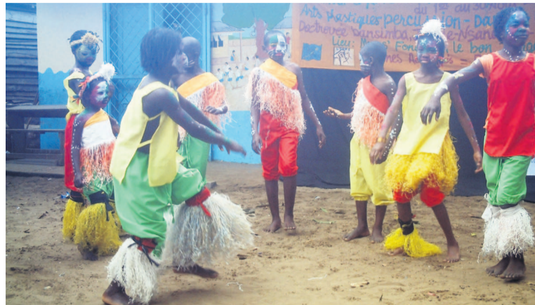
Les enfants exécutant des pas de danse à la clôture d'Anim'Tète Vacances Crédit photo:Adiac»

Lancée le 1er août dernier, la 6e édition du festival d'arts et de loisirs pour enfants et jeunes a été clôturée le 30 août dernier à Nkoukou (Loandjili) à Pointe-Noire. en présence des parents et des responsables de cet établissement scolaire.