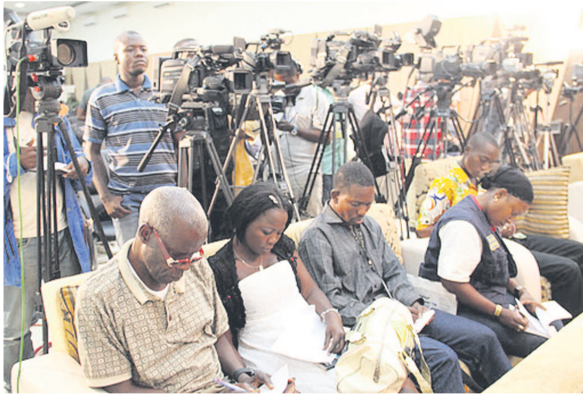
Les professionnels des médias dans une activité de la CeniPhoto John Bompengo

La structure déplore ces actes qui constituent une atteinte à la liberté de la presse pourtant garantie par la Constitution et les instruments juridiques internationaux.