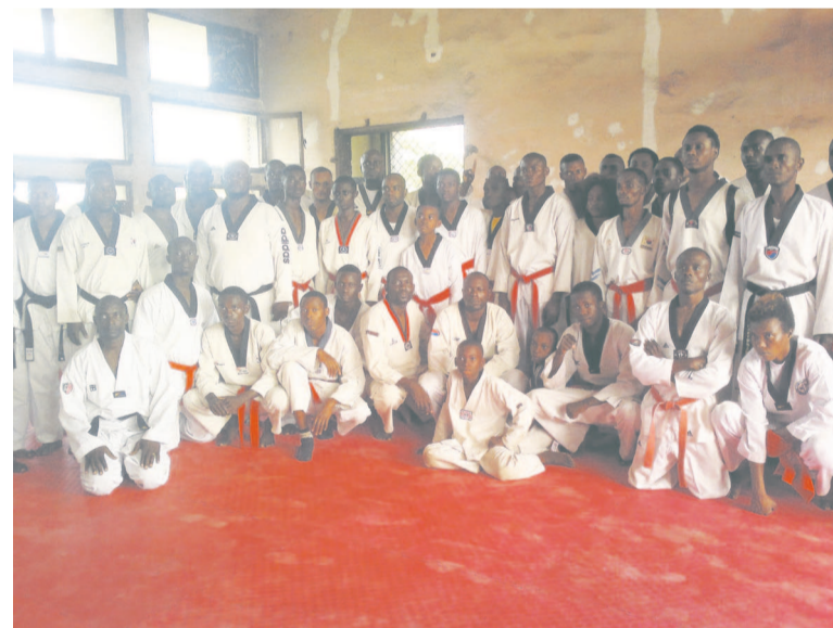
Les candidats au passage de grade

quelle nombre de candidats ne s'attendaient pas, peut recaler certains d'entre eux. Puisque le président du jury qui est par