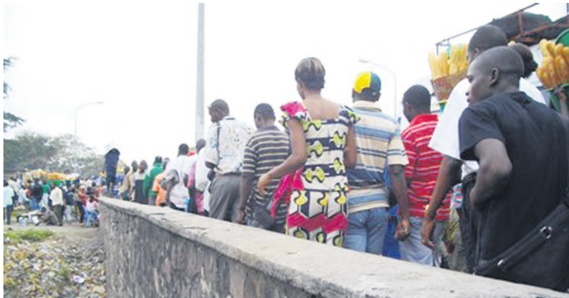
Kinshasa, le plus grand marché de la RDC

Intitulée « les chiffres-clés de la téléphonie mobile », l'étude réalisée par le cabinet Target confirme que les cinq principaux opérateurs de la RDC, en l'occurrence Vodacom, Tigo, Airtel, Africell et Orange, se focalisent tous à Kinshasa, le plus grand marché du pays.