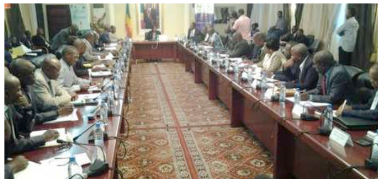
L'API et les points focaux lors de la première réunion

Dans le souci de mettre à la disposition des investisseurs les informations concernant les secteurs porteurs au Congo, les points focaux ont été priés de remonter vers l'API toutes les informations économiques sur les projets et besoins d'investissements de leurs administrations respectives.