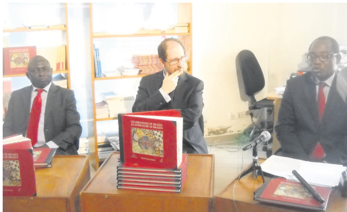
La présentation de l'ouvrage Les Dimanches de Brazza

Paru aux éditions les Manguiers des Dépêches de Brazzaville et Artesampa en Italie, ce livre a une dimension historique datant de l'époque coloniale jusqu'aujourd'hui. C'est un