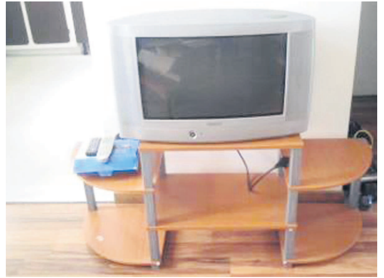
Un poste téléviseur

La firme chinoise qui opérait dans la clandestinité en se dérochant du fisc est désormais interdite d'exercer en RDC.