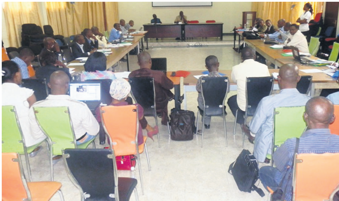
La salle, lors des travaux

De l'avis de ces ONG, le débat sur la révision de la Constitution ne devrait pas être réservé aux seuls parlementaires. Il requiert, selon ces organisations réunis à Kinshasa, l'implication de l'ensemble de la population congo-