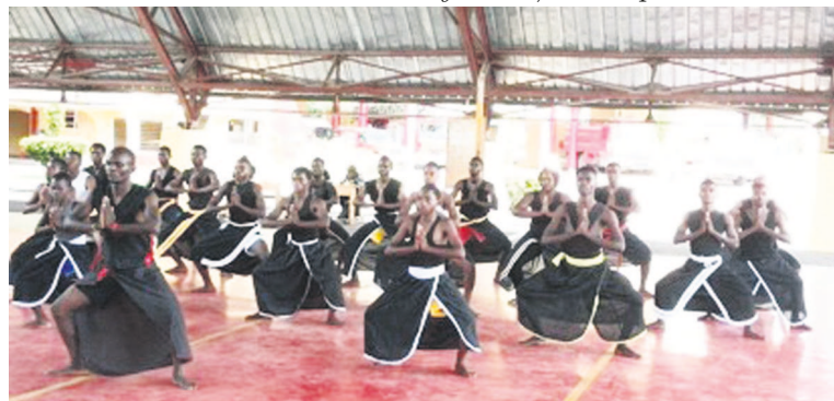
Une démonstration de la boxe des pharaons rénovée

Les journées portes ouvertes de la Fédération congolaise de boxe de pharaons rénovée vont de report en report. Fixées pour le mois de mai passé, elles ont été repoussées à une date ultérieure. « Nous n'avons pas encore reçu les fonds qui nous permettront de réaliser cette activité qui rentre non seulement dans le cadre de la vul-