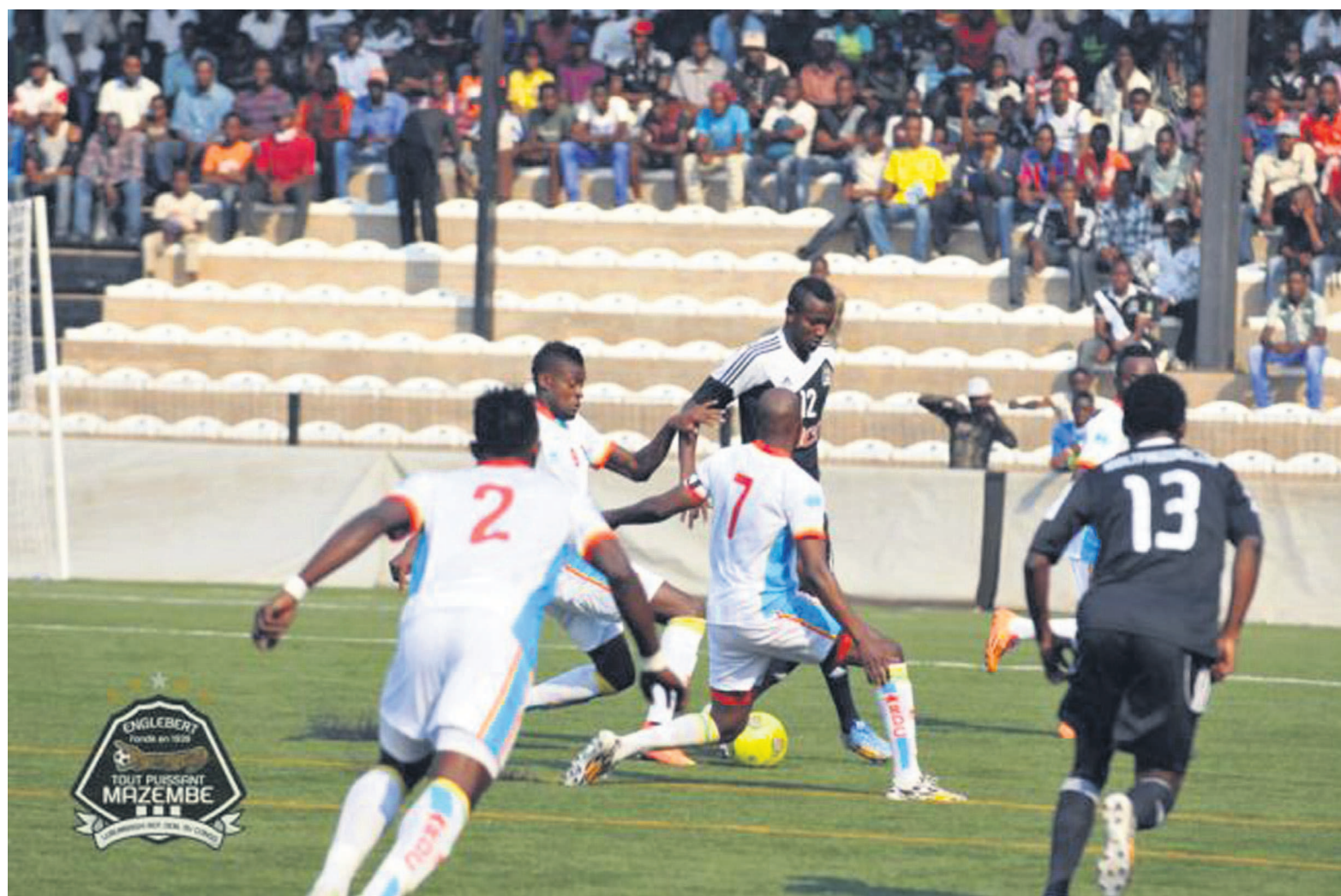
Vue du match amical entre les Léopards et Mazembe à Lubumbashi

En fait, les Léopards qui ont débuté la préparation à Kinshasa par une confrontation contre V.Club (2-2) avec un onze de départ composé des