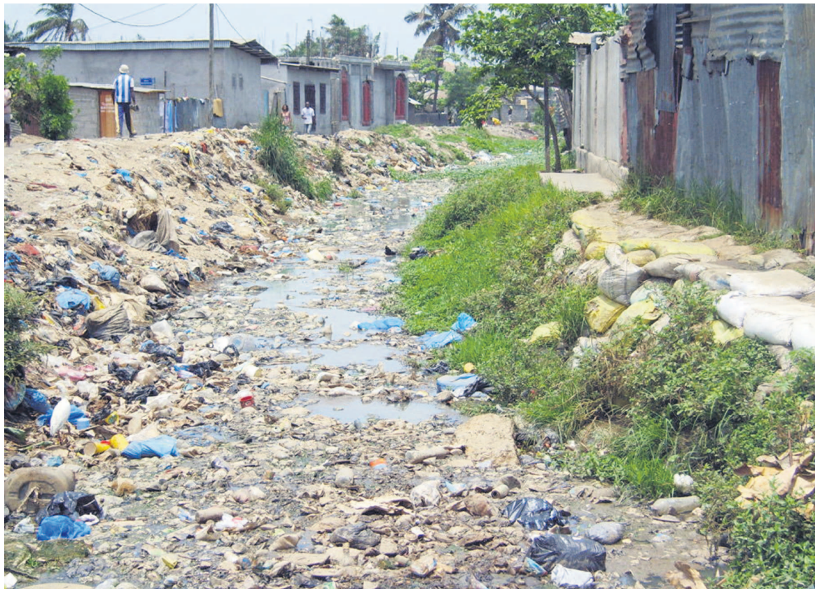
L'état de l'un des ruisseaux de la ville de Pointe-Noire

La prévention étant l'une des meilleures médecines, il est donc nécessaire que les autorités préfectorales et municipales en charge des questions d'assainissement se préoccupent sans plus tarder, car l'état dans lequel se trouvent ces ruisseaux est une porte ouverte vers des épidémies et pandémies lors des moments des pluies. « Lorsqu'arriveront les pluies, toute la saleté qui s'est entassée dans ces rivières va flotter et se propager dans les habitations environnantes, puisque ces ordures ont totalement rétréci les lits de ces rivières et empêchant ainsi l'eau de couler normalement lors de la saison plu-