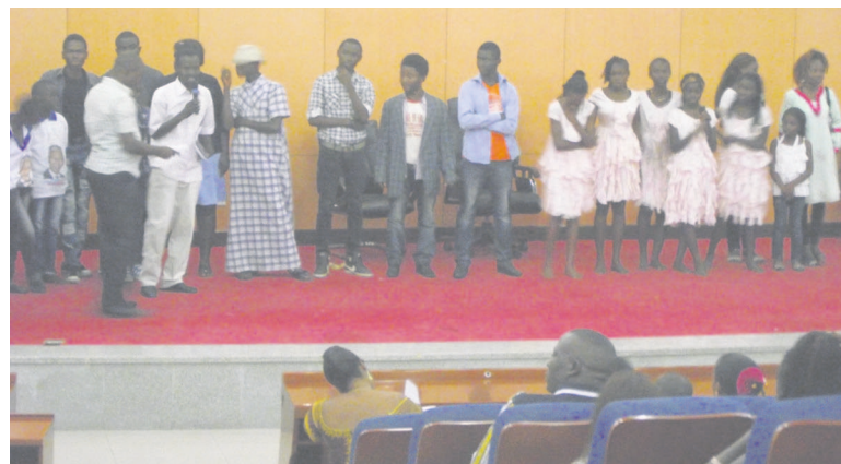
Les acteurs du groupe La Grâce