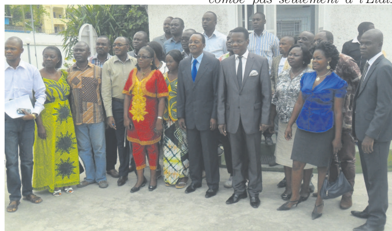
La photo de famille des participants

l'homme dans les activités des entreprises ; et le rôle des différents acteurs dans la prise en compte des droits de l'homme dans les activités des entreprises. Au cours de la deuxième journée, il sera ouvert une session pratique visant le traitement de l'information qui incombe la responsabilité du journaliste. « Les normes internationales ne sauraient contribuer à la prise en compte des droits de l'homme dans l'exploitation des ressources natu-