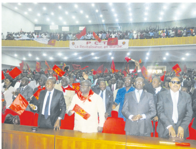
Des militants du PCT

Sur un total de 111 circonscriptions à pourvoir sur l'ensemble du territoire national, le Pct n'envisage aucune combinaison stratégique avec ces alliés. « Pour cette élection, le PCT ne fera pas de combinaisons stratégiques avec ses alliés », a déclaré le porte-parole du Pct, Serge Michel Odzoki, avant de préciser : « Au ni-