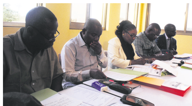
Quelques membres du Conseil d'administration

Le Conseil d'administration a évalué à 480 millions FCFA le budget annuel de cet établissement à vocation africaine qui ouvrira ses portes la rentrée scolaire prochaine.