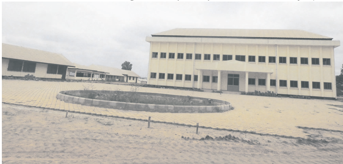
L'Institut de Loudima vue de façade

cains. Depuis 2007, les chefs d'État congolais, Denis Sassou N'Gusso, et namibien, Hifikepunye Pohamba, ont décidé de transformer ce camp en un institut de formation technique et professionnelle. La première pierre a été posée en 2009 et les travaux de construction et de réhabilitation ont débuté en 2011. À ce jour, les tra-