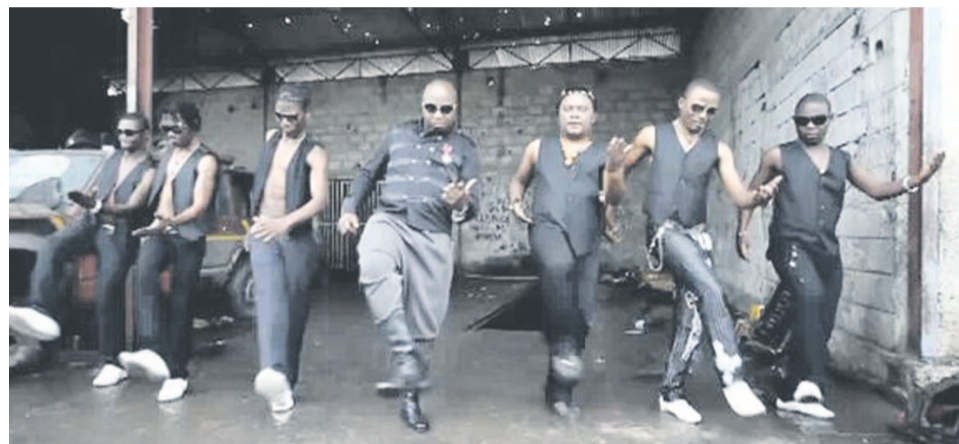
Un extrait du clip du groupe Extra Musica

tion ponténégrine sa discographie musicale. Une discographie bien garnie avec notamment des albums bien stylés tels que, Evolution, Indépendance Day, Echafaudage et Menu.