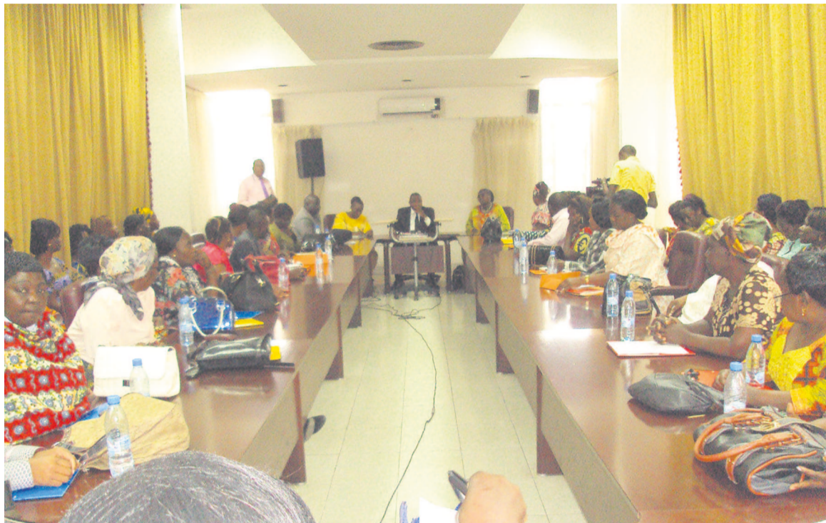
Les participants

dans la prise en charge médico-psychologique dans une unité de prise en charge ainsi que la gestion des données sur les violences sexuelles ainsi qu'élaborer un plan d'action des interventions au