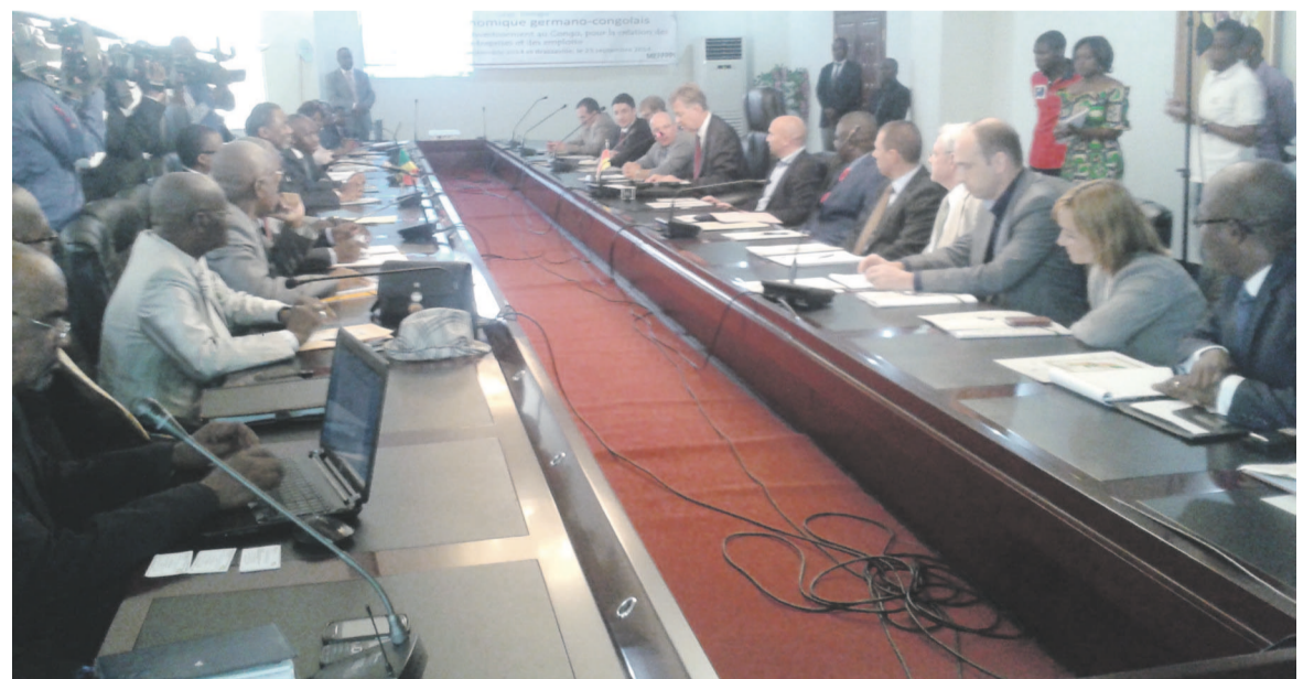
La séance de travail des deux parties

Afin de s'informer sur les opportunités d'affaires qu'offrent leurs pays respectifs, des hommes d'affaires allemands et congolais ont participé hier au forum éco-