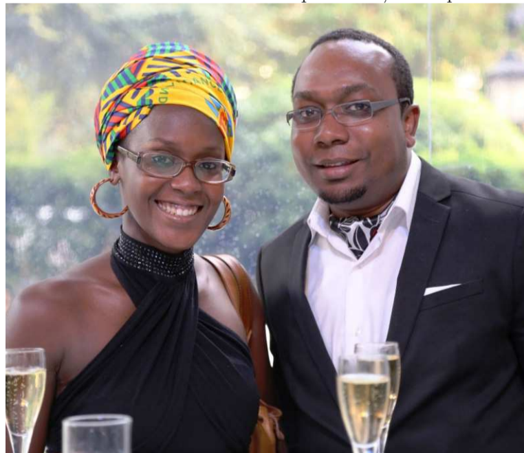
Un couple anonyme à la célébration du 54 e anniversaire de l'indépendance du Congo à Paris / (DR)

Pour cette année, loin de Sibiti, le chef-lieu du département de la Lékoumou, retenu pour la municipalisation accélérée et les festivités de l'indépendance, la diaspora fran-