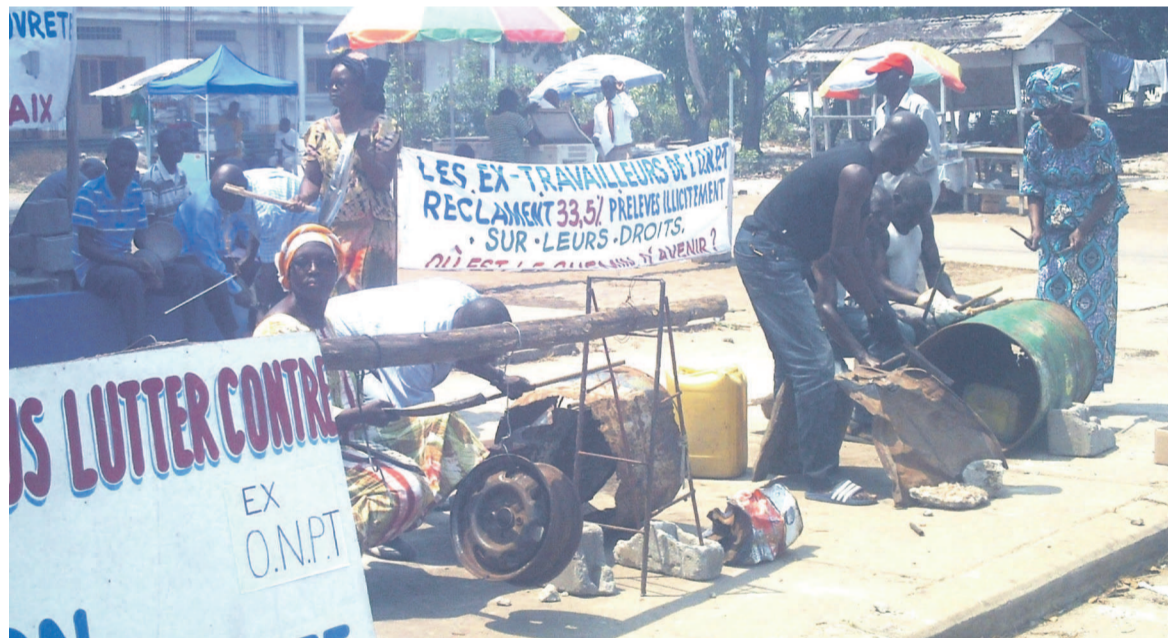
Les ex-travailleurs de l'ONPT protestant devant le siège de la Sopeco

Depuis le 25 septembre, les ex-travailleurs de l'Office national des postes et télécommunications (ONPT) font un sit-in bruyant sur l'esplanade de la Société des postes et épargne du Congo (Sopeco) située en face de la Gare centrale de Pointe-Noire. Ils dénoncent les prélèvements illégaux opérés sur leurs arriérés de salaires.