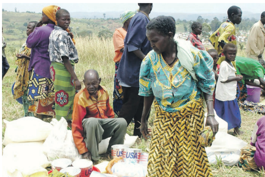
Quelques bénéficiaires de l'assistance du PAM à l'Équateur