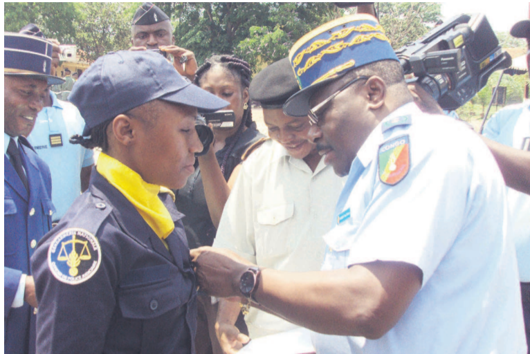
Le général Paul Victor Moigny primant le major des diplômés OPJ

91 maréchaux des logis-chefs et 109 maréchaux des logis ont obtenu respectivement le 1er octobre, les diplômes de qualification supérieure de la gendarmerie 1er degré (DQSG1) et d'Officier de police judiciaire (OPJ).