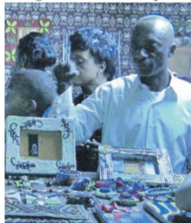
Une vue partielle des articles exposés dans le premier stand