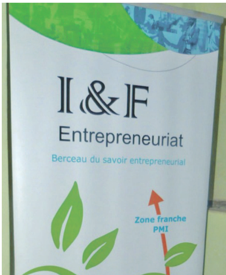
I&F Entrepreneuriat est l'un des rares incubateurs en RDC

au sein d'une structure commune d'incubation et de pépinière, une démarche systématique de détection, d'évaluation, de validation économique et d'accompagnement de projets de création d'entreprises innovantes ou d'entreprises existantes ayant un lien ou pas avec la recherche scientifique. Lancé au mois d'avril dernier à Niamey, Cipmen permet aux entrepreneurs du Niger de démarrer une entreprise prospère ou d'accélérer leur développement. Pour ce faire, l'incubateur cible des start-up résidentielles et virtuelles ainsi que des entreprises déjà existantes. Ainsi, Cipmen joue un rôle important dans les phases de développement et de croissance de chaque cycle de vie des entreprises. L'incubateur accompagne principalement les start-ups de trois secteurs d'activité à fort potentiel de croissance : les technologies de l'information et de la communication (TIC); les énergies renouvelables et l'environnement. Il offre plusieurs services notamment : prestations de diagnostic d'entreprise pour aider à identifier et à corriger les faiblesses spécifiques en gestion d'entreprise du client; assistance informelle et formelle aux entreprises et conseils de coachs qualifiés; jumelage des clients avec des mentors ayant réussi dans les affaires.