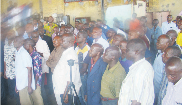
Les ex-agents de l'ATC lors de l'assemblée générale

Ces ex-travailleurs ont annoncé un sit-in devant les ministères des Finances et des Transports. Ceci, si jamais leurs revendications ne sont pas prises en compte par le gouvernement d'ici au 15 octobre prochain.