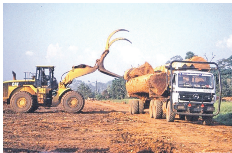
Chargement des grumes sur une remorque.