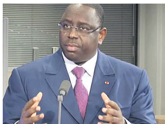
Macky Sall

Les responsables de l'Agence internationale d'images de télévision (AITV) ont adressé une lettre ouverte au président sénégalais, Macky Sall, afin qu'il plaide auprès de ses pairs francophones pour la survie de ce média menacé de fermeture par le groupe France télévisions. Page 7