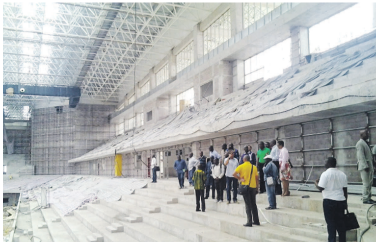
Les experts visitent le chantier du Palais des sports à Kintélé

Les travaux de construction des infrastructures devant abriter les jeux du cinquantenaire sont en avance de quatre semaines. C'est ce qui ressort du rapport de la dernière visite d'inspection effectuée le 8 octobre. Les délégués de l'UA ont respectivement visité le Complexe sportif de Kintélé, (plus de 60 000 places), le palais des sports (10000 places) et le complexe nautique (2000 places) où les ouvriers s'activent pour relever le défi de la livraison des ouvrages dans les délais. Les travaux sont exécutés à plus de 80%. De bons augures pour l'organisation l'année prochaine, des 11 e Jeux africains de Brazzaville en septembre 2015. « Nous avons eu des échanges avec le contrôleur des travaux et nous nous sommes rendus à l'évidence que si tout se passait tel que nous l'avons constaté sur le terrain, il n'y a pas de doute que le Congo pourra être dans les délais. En visitant certaines infrastructures, nous avons remarqué que le Congo était en avance par rapport au temps fixé », a commenté Machacha Shepande, le chef de division sport pour le compte de l'UA. Il a salué l'engagement du Chef de l'État à offrir à la jeunesse africaine, des infrastructures