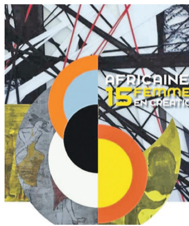
L'affiche de l'exposition