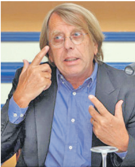
Claude le Roy

quement 14 bonnes années que la République du Congo n'a plus participé à une compétition africaine en l'occurrence la CAN.