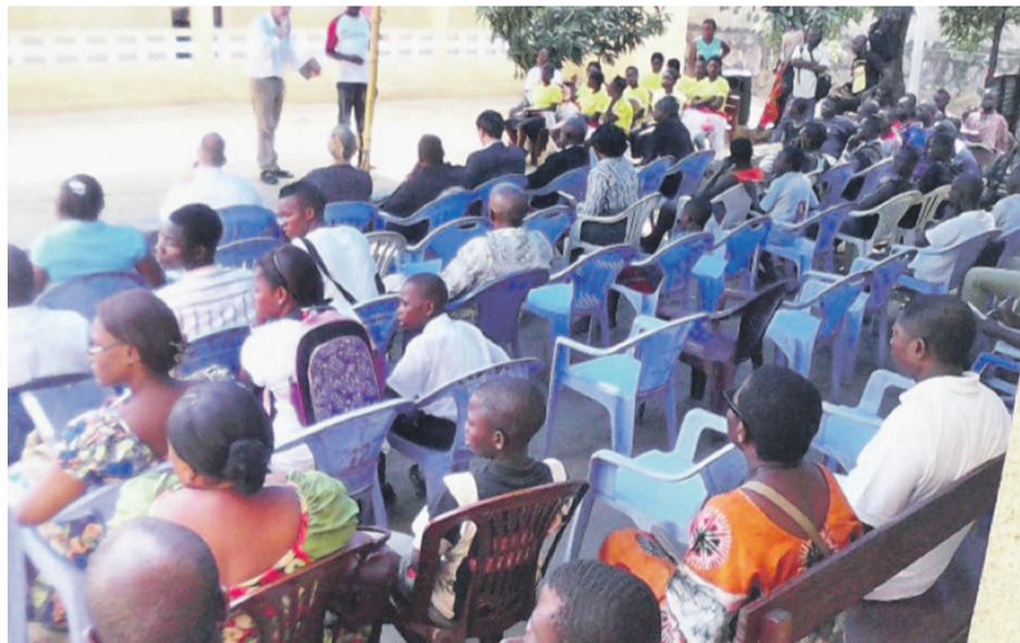
Cérémonie de clôture d'un projet liant la CCNC et l'ambassade de France en RDC

pelle-t-on, est un des outils importants utilisés par la CCN, en vue de stabiliser et autonomiser les jeunes dits de la rue réunifiés dans leur famille. Une méthodologie articulée autour de trois grandes actions est utilisée pour ce faire. Il s'agit, premièrement, de l'élaboration d'un projet de vie par l'animateur avec le jeune avant sa réunification et son inscription dans un centre de formation ou un atelier proche de son quartier. Une convention de formation est signée par le responsable du centre de formation, le parent responsable, Ndako ya Biso et le jeune. Il y a, en second lieu, le suivi régulier du jeune par l'animateur référent dans son lieu de formation. Et, troisièmement, l'appui à la recherche d'un stage et d'une installation professionnelle pour les jeunes qui ont achevé leur formation professionnelle.