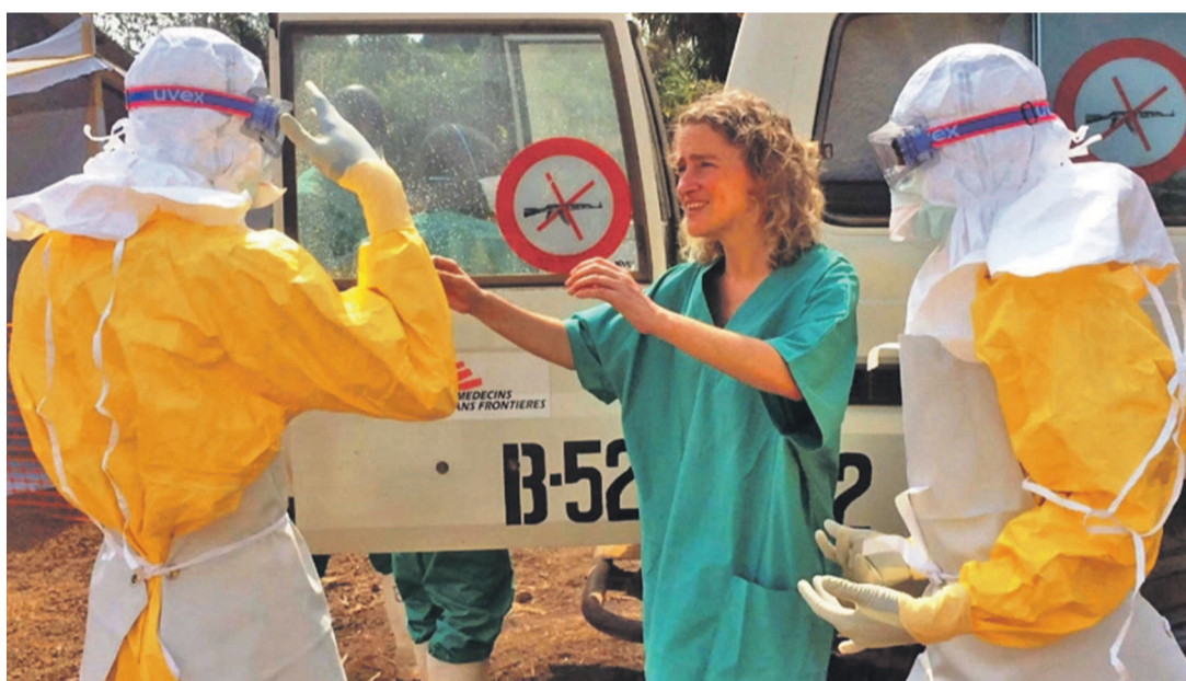
Une équipe de MSF à pied d'oeuvre