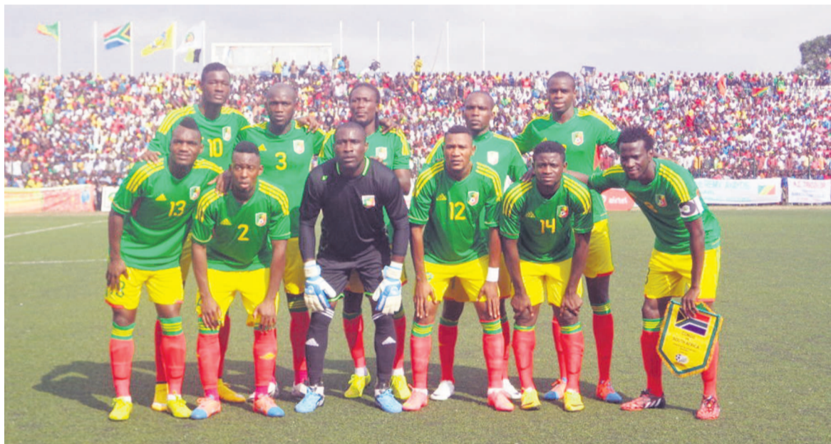
Les Diables rouges ont laissé les points à domicile