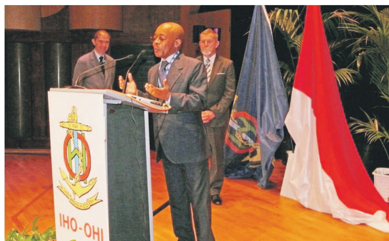
Le ministre Martin Parfait Aimé Coussoud-Mavoungou

À l'occasion de la 5 e Conférence hydrographique internationale extraordinaire de l'organisation hydrographique internationale (OHI) qui a eu lieu du 6 au 10 octobre dans la Principauté de Monaco, la République du Congo représentée par Martin Parfait Aimé Coussoud-Mavoungou, ministre délégué chargé de la Marine marchande a déposé sa candidature pour être membre de cette organisation.