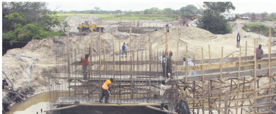
Les ouvriers et techniciens à pied d'œuvre sur le chantier