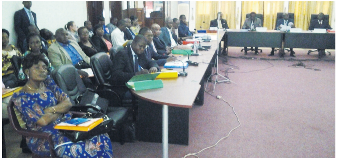
Une vue des chefs d'entreprise lors de la réunion

Afin de sensibiliser la population congolaise contre cette épidémie, les chefs d'entreprises du Congo ont reçu une mission : financer la duplication de 150.000 dépliant conçus à ce sujet. L'objectif étant de les distribuer à travers le territoire national.