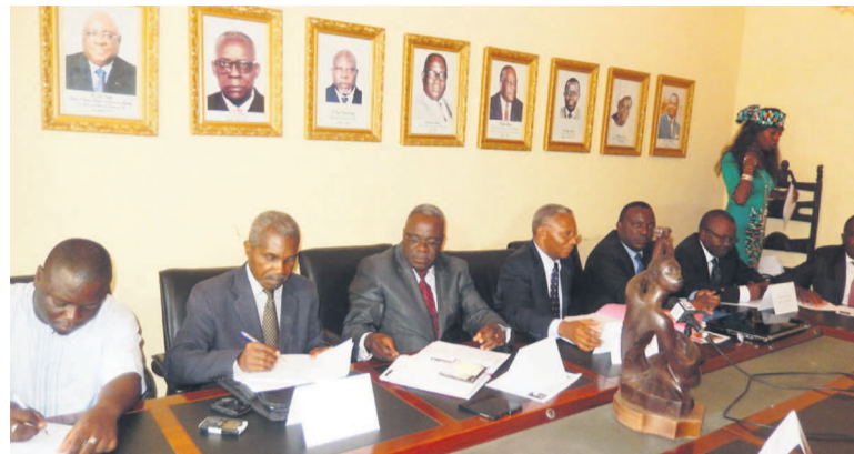
Les écrivains présents à la deuxième édition