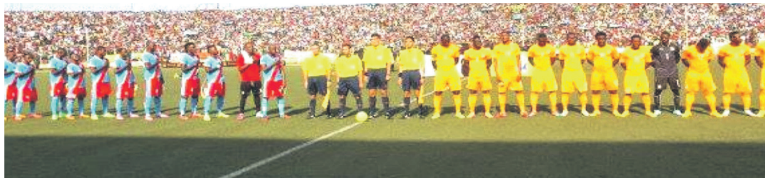
Les Léopards et les Éléphants avant le coup d'envoi à Kinshasa

La RDC a sensiblement hypothéqué ses chances de qualification pour la phase finale de la CAN Maroc 2015. Les Léopards du Congo démocratique ont été battus, le samedi 11 octobre au stade Tata Raphaël de Kinshasa, par les Éléphants de la Côte d'Ivoire, par un but à deux, en troisième journée du groupe D des éliminatoires. L'attaquant Wilfried Bony de Swansea en Angleterre a ou-