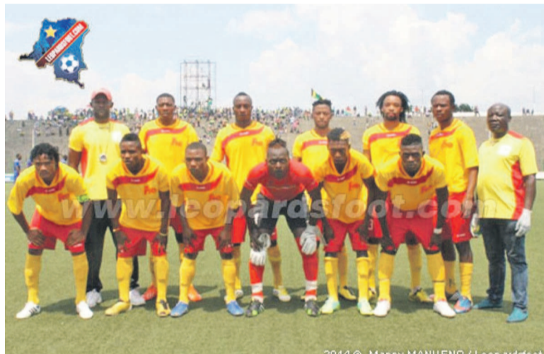
Sanga Balende de Mbuji-Mayi

Quelques matchs de la deuxième journée de la Division 1 se sont déroulés, le dimanche 12 octobre 2014, sur certains stades du pays.