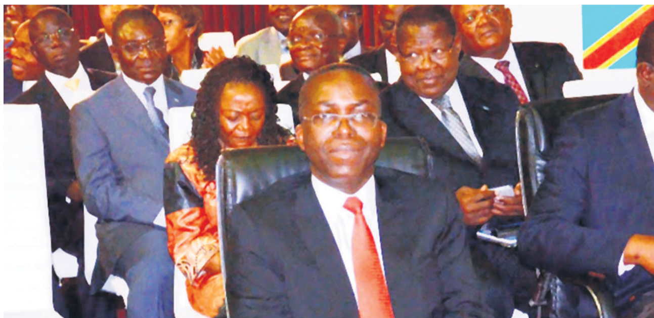
Matata Ponyo et quelques membres de son équipe

L'examen du projet de loi financière pour l'exercice 2015, ce lundi 13 octobre, à la Chambre basse du Parlement a donné lieu à un débat citoyen sur l'élaboration d'une politique incitative en cette matière. De l'accélération des réformes structurelles en cours à la rationalisation des systèmes de mobilisation des ressources en passant par le changement du modèle économique et autres propositions faites, tout a été passé au crible par les députés. Tout en rouspétant sur la modicité des prévisions situées autour de neuf milliards de dollars, les élus du peuple ont dénoncé le déséquilibre du budget 2015 en termes d'affectation de crédits aux différents secteurs d'activités dont certains sont laissés pour compte.