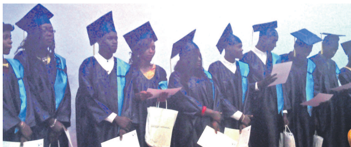
Les étudiants diplômés de la 1 ère promotion de l'option GMAM à l'EST-Littoral

Créée en 2010, la filière Génie management des activités maritimes (GMAM) vient de sortir la première cuvée prête à faire son entrée dans la vie active aussi bien dans les entreprises publiques que privées grâce aux