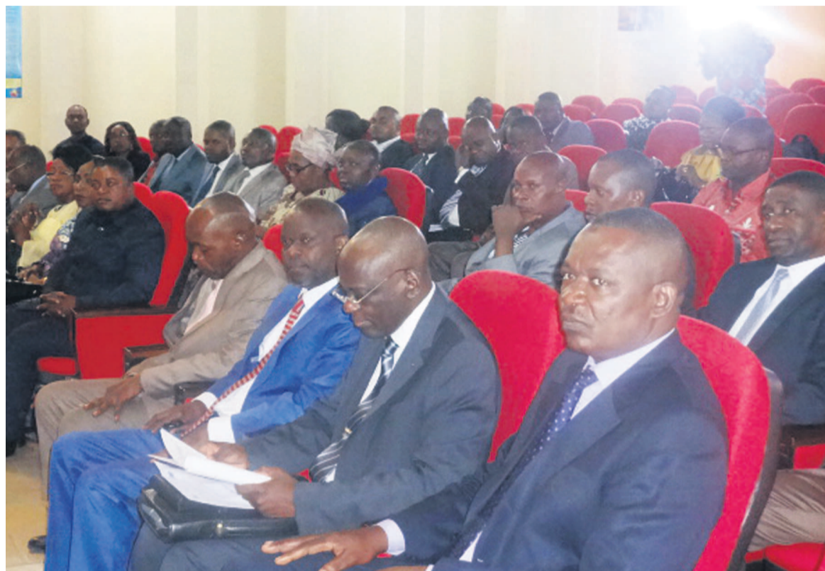
Les bénéficiaires

Les 310 personnes viennent des différentes directions générales et d'autres structures que sont le Budget, le contrôle budgétaire, le Trésor et la comptabilité publique, l'inspection générale des finances et d'État, la Cour des comptes et de discipline budgétaire.