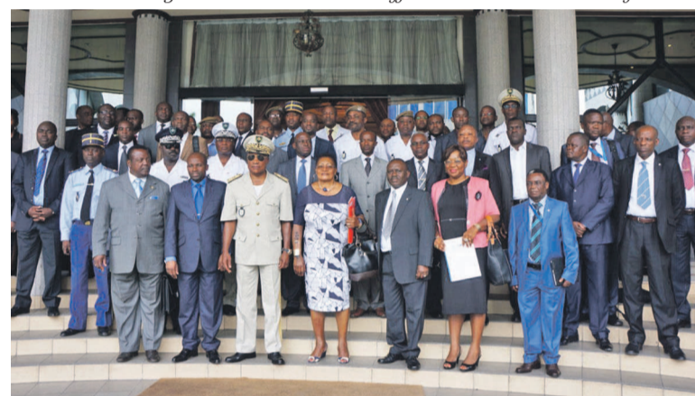
Photo de famille à l'ouverture des travaux

« Le but de ces retrouvailles est d'identifier et de cerner les contours de la criminalité dans la sous région de l'Afrique centrale en vue de bâtir une stratégie commune de lutte efficace contre toutes ses formes.