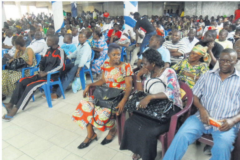
Une vue des mandants du quartier 54

Pour lui, malgré le retard, les habitants de cette partie de la ville doivent rester confiants sans céder à la manipulation car, dit-il, il y a des gens qui exploitent cette situation du 4 mars à des fins politiciennes et en font un