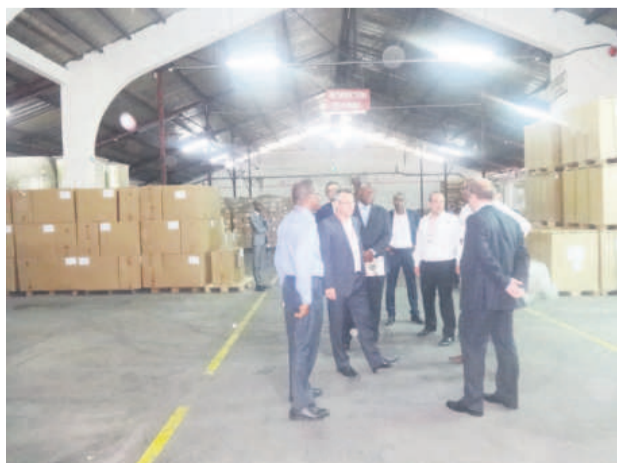
Visite en cours

« Je suis particulièrement fier de constater que nous avons investi cette année dans une nouvelle ligne qui