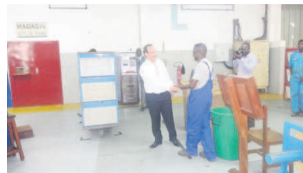
Convivialité patron et travailleur

Les affaires marchent plutôt bien. La SIAT en 2013 a réalisé un chiffre d'affaire d'environ 23 milliards et a contribué pour 12 milliards de recettes fiscales diverses. Lors de ces dernières années, 3 milliards ont été alloués dans la modernisation de l'usine. Son investissement le plus important est celui réalisé dans les ressources humaines, précise la direction. Avec 99% de local content, la SIAT