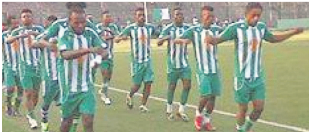
FC Renaissance du Congo

C'est la deuxième victoire de ce club nouvellement promu au championnat de Kinshasa, après avoir surpris en première journée l'AC Dragons, un ogre du football de la capitale. Par ailleurs, AC Rangers a écrasé, le mardi 14 octobre