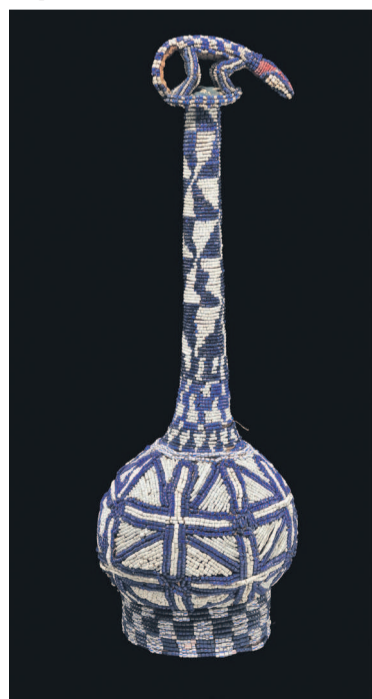
Calebasse à vin de palme du Cameroun

Cent quarante œuvres, rassemblées avec le concours de prestigieuses musées, mettent en lumière des pratiques qui se vivent au quotidien ou à l'occasion de cérémonies.