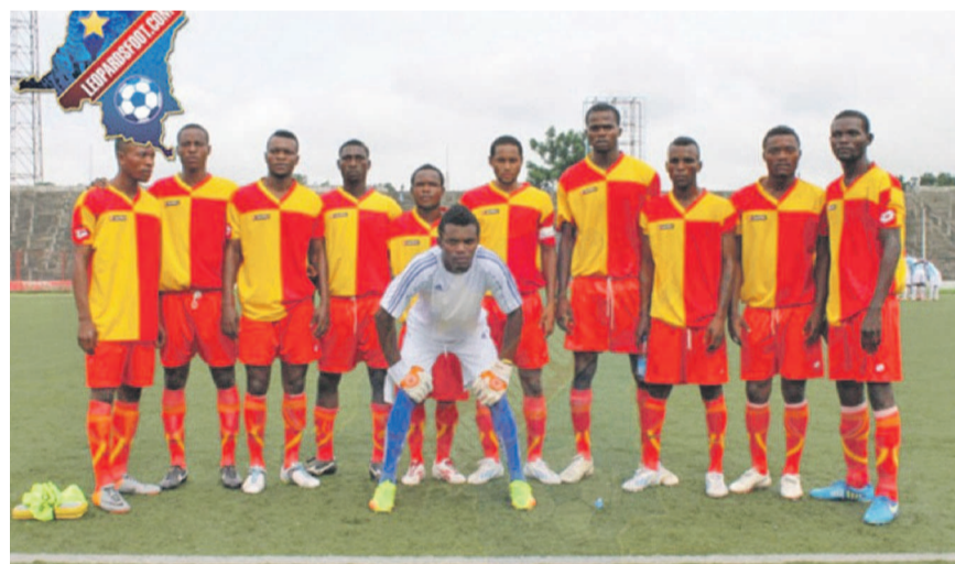
AS Dragons de Kinshasa