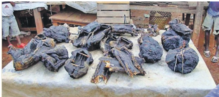
Viande boucanée en vente