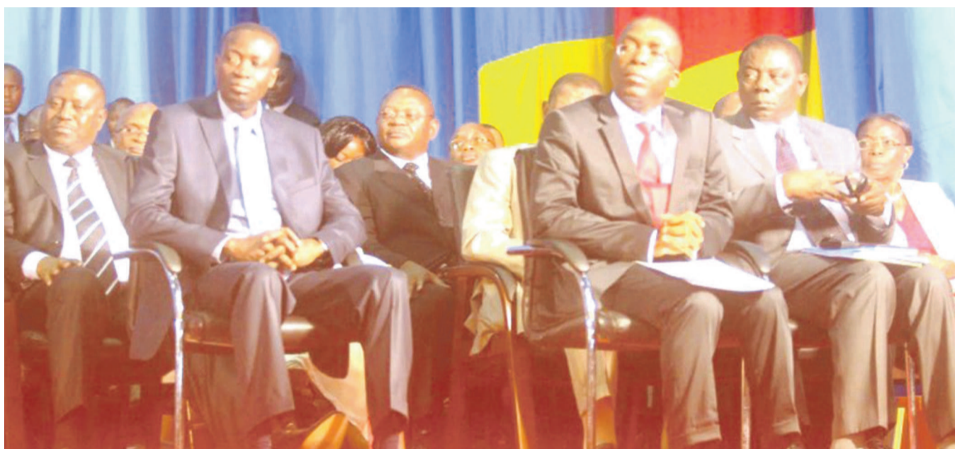
Les membres du gouvernement face aux députés