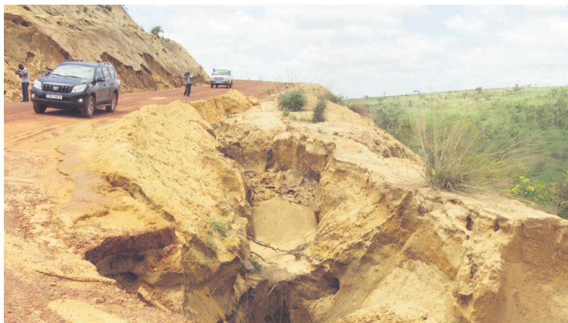
Les érosions menacent la route Mayama-Kindamba

Réhabilitée à peine deux ans, dans le cadre des différents projets de la Municipalisation accélérée du département du Pool, la route en terre reliant les deux districts est prête à se couper, si l'on n'y prend garde. Les grandes pluies qui s'annoncent d'ici à la fin de l'année sont un grand challenge pour les autorités afin de sauver cette infrastructure.