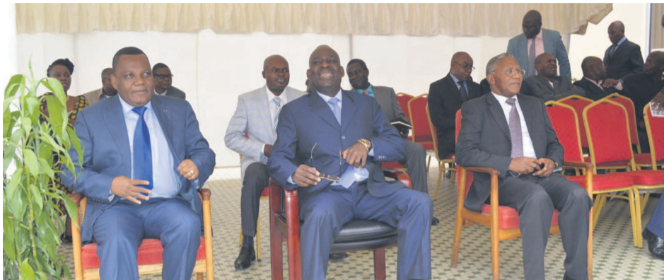
Les officiels à l'ouverture de la 2 e biennale

Le coup d'envoi de ces festivités a été donné par le ministre de la Culture et des Arts, Jean Claude Gakosso, le 15 octobre, en présence de nombreux invités. Parmi lesquels la délégation chinoise dont le pays est à l'honneur cette année.