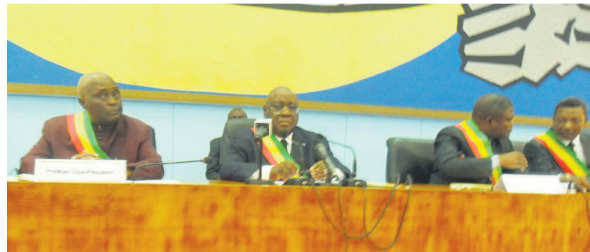
Le présidium lors de la cérémonie d'ouverture de la session budgétaire

C'est dans un climat de tristesse que les élus nationaux ont fait leur rentrée parlementaire. Une