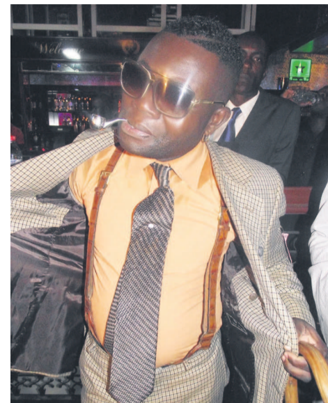
Le champion de la première édition du grand concours de la sape