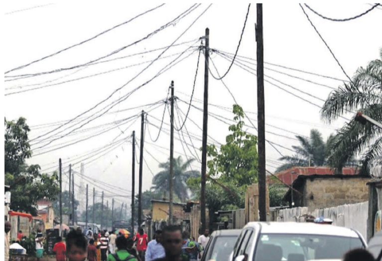
Des câbles électriques de la Snel raccordés le long d'un quartier populaire de Kinshasa.

Les nouvelles venant de la Société nationale d'électricité (Snel) ne sont pas rassurantes pour ses nombreux abonnés, surtout ceux résidant dans la périphérie Est de la ville de Kinshasa. Depuis la chute du pylône numéro 24 à Kibomango dans la commune de la Nsele, cette partie de la ville connaît des sérieuses perturbations dans la fourniture du courant électrique. L'écroulement de ce pylône stratégique vu qu'il alimente, outre la commune de Nsele, celle de Kimbanseke ainsi que l'aéroport international de N'djili à partir du poste électrique de Maluku (à 80 Km de Kinshasa), a entraîné un dysfonctionnement dans la distribution de l'énergie électrique. Le vol de ses cornières par des inciviques serait à la base de cette situation qui tend à priver cette importante agglomération d'électricité. L'on tend inexorablement vers des délestages intensifs dans cette partie de la ville causés essentiellement par les travaux de réhabilitation de la ligne endommagée. Près de cinquante