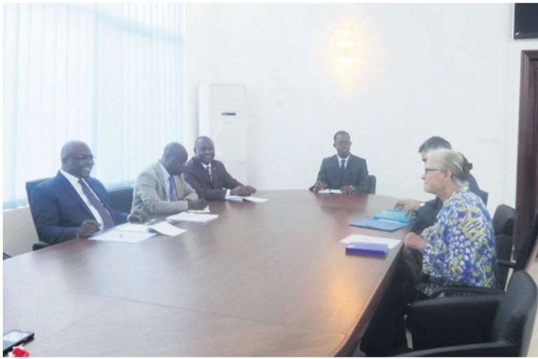
La séance de travail entre les deux parties

Le Congo et l'Union européenne (UE) préparent les projets qui seront financés dans le cadre du 11 e Fonds européen de développement (FED). En matière de gestion du FED, les deux partenaires l'ont toujours exécuté conjointement.