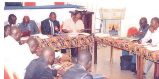
Une vue de l'assemblée

Il est prévu la formation de ces acteurs sur le fonctionnement et la gestion des GIE avant la mise en œuvre effective du projet dont le soutien du FACP est fixé à hauteur de 90% tandis que les bénéficiaires ne contribueront qu'à 10%. Notons que cette action a été précédée par des ateliers de sensibilisation qui ont permis aux acteurs de s'approprier le concept « chaîne de valeurs » et de l'appro-