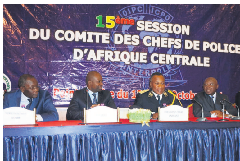
Les responsables de la police et le ministre Raymond Zéphirin Mboulou (à l'extrême droite)

Jean-François Ndenguet aux commandes du comité des chefs de police