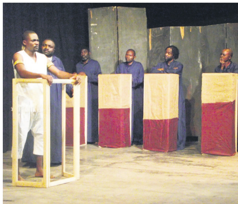
Makaya devant la barre

Cette pièce théâtrale a obtenu le premier prix de la Semaine culturelle de Brazzaville en 1967. Elle a été jouée au Festival des arts africains de Lagos en février 1977.