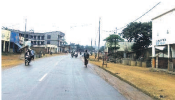
L'avenue principale de la ville de Beni dans le Nord-Kivu

Très affecté par cette recrudescence de la violence à Beni, Oicha et Eringeti, le gouvernement l'a non seulement condamné, mais aussi et surtout, assuré les populations affectées de sa détermination à effacer du sol congolais le terrorisme de la force négative ADF. Le ministre