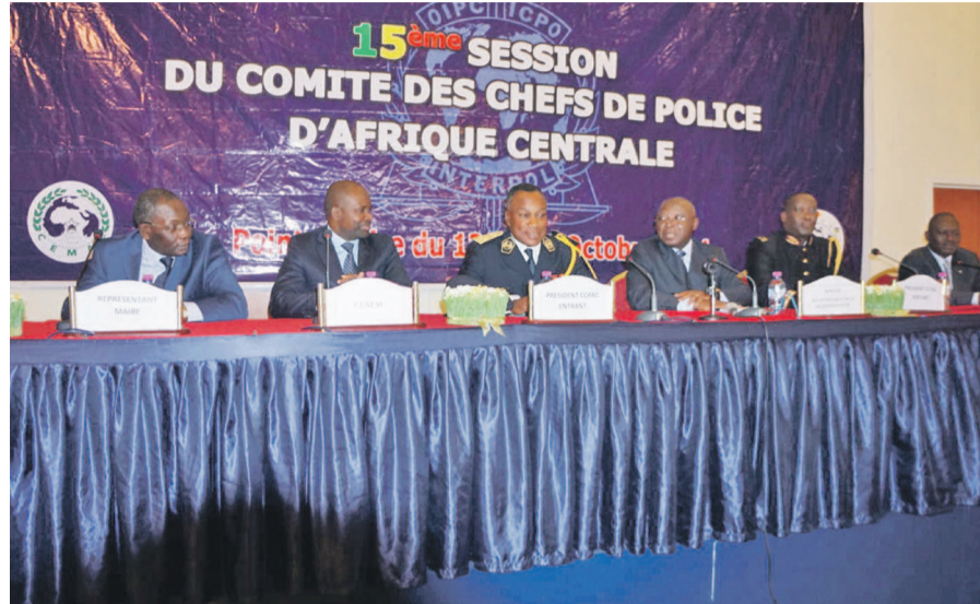
Tribune officielle de la session

Plusieurs décisions et recommandations ont été prises demandant au comité des chefs de police d'Afrique centrale (C.C.P.A.C) de prendre part à toutes les activités organisées par le bureau régional. Il a été souhaité de reformuler l'article 12 à son paragraphe numéro 2 de l'accord de coopération en matière de police criminelle entre les États de l'Afrique centrale. De l'avis des experts, les personnes appréhendées, dans le cadre d'une mission d'enquête, peuvent au terme de celle-ci être remises à