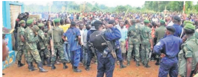
Les habitants de Beni réclament le départ du contingent onusien

Cette situation traduit l'animosité grandissante développée ces derniers jours par la population locale à l'égard de la Monusco dont on réclame le départ. Une revendication qui intervient quelques