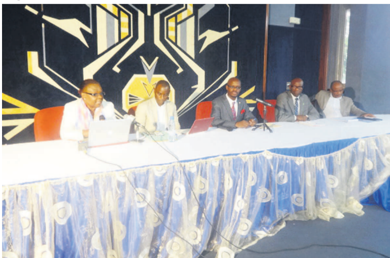
Les initiateurs du GIEC