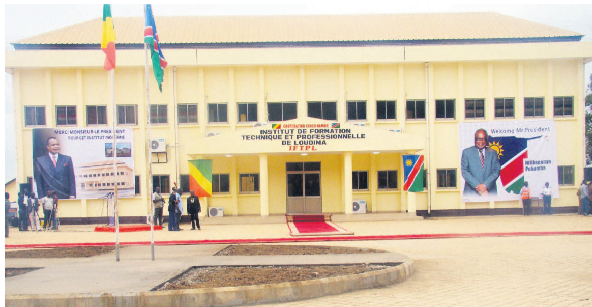
Le bâtiment portant l'emblème de l'institut

C'est en vertu d'une décision prise par les deux présidents qui, en juillet 2007, décidaient de perpétuer le caractère historique de ce site, que d'importants tra-