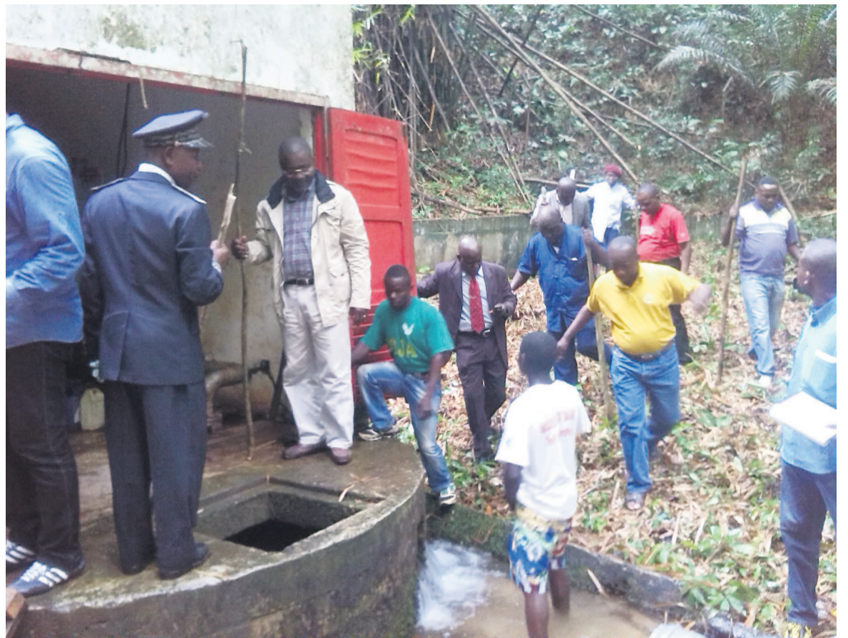
La visite des installations de la SNDE dans la partie nord du Congo

Au nombre des difficultés signalées, on note entre autres le manque des produits chimiques, assurant la potabilité de l'eau et du personnel, la pénibilité des voies d'accès au point de captage