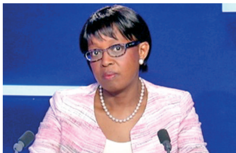
Dr Rebeca Matshidiso Moeti, Directeur régional de l'OMS Afrique