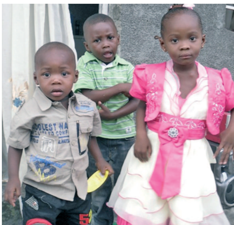
Les enfants sont l'avenir de l'humanité et méritent protection

La représentante de l'Unicef en RDC, Sylvie Fouet, dont l'institution fête également ses cinquante ans dans le pays, a également