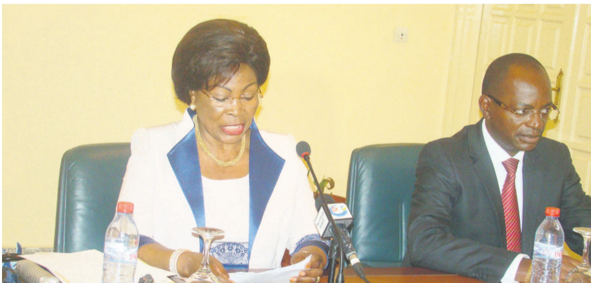
Yvonne Adélaïde Mougany et son homologue Bienvenu Okiémy à l'ouverture pendant les travaux

La MEC a tenu sa session inaugurale le 12 novembre à Brazzaville, sous la houlette du ministre des Petites, moyennes entreprises et de l'artisanat, Yvonne Adélaïde Mougany. Elle jouera dorénavant le rôle de facilitateur dans la création des entreprises au Congo. L'objectif étant d'encourager la diversification de l'économie.