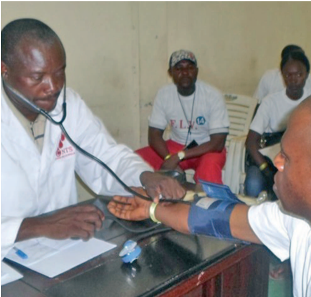
Une séance de don de sang