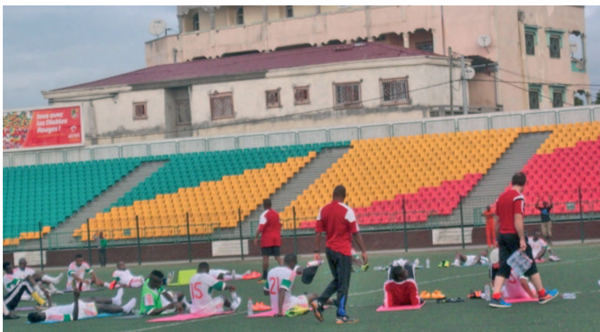
Vue des joueurs lors des entraînements