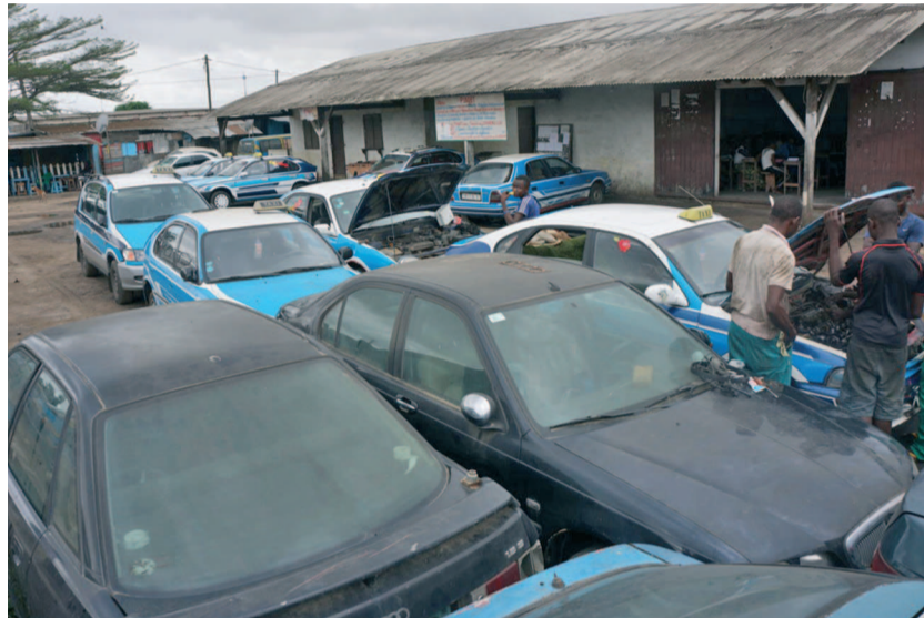
L'ancien site de Coomapon

vie chère, la transparence du marché et l'assainissement du climat des affaires, nous avons eu quelques rencontres avec les maraîchers. Avec d'autres administrations publiques compétentes, plusieurs solutions seront préconisées pour pallier cette flambée de prix des produits maraîchers dans la ville », a-t-il déclaré.