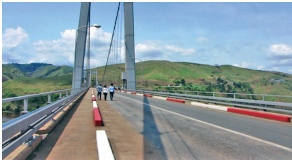
Le pont Maréchal s'étend sur plus de 700 m

Inauguré avec grande pompe en mai 1983 par l'ancien président de la République, Mobutu Sese Seko, ce gigantesque ouvrage suspendu à 53 m de hauteur du fleuve Congo et s'étendant sur plus de 700 mètres de longueur sur la partie la plus étroite du cours d'eau a permis de relier Matadi à Boma.