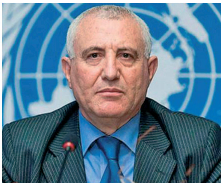
Saïd Djinnit, envoyé spécial du secrétaire général des Nations Unies pour la région des Grands lacs