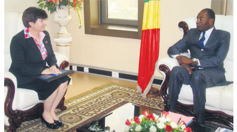
Entretien entre le ministre des Affaires foncières et l'ambassadrice des États-Unis au Congo

Le ministre des Affaires foncières et du domaine public, Pierre Mabiala, a reçu le 13 novembre à Brazzaville, l'ambassadrice des États-Unis au Congo, Stéphanie Sullivan. L'objectif visé par la diplomate américaine est de s'enquérir de la gestion foncière au Congo.