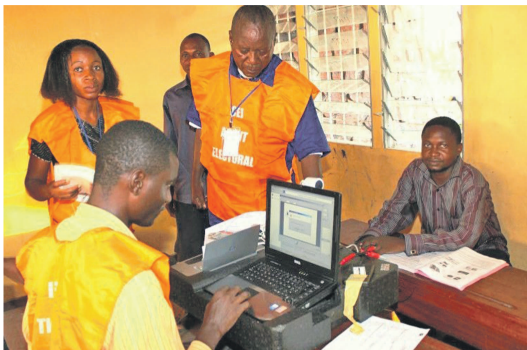
Des agents de la Ceni à pied d'oeuvre dans un centre