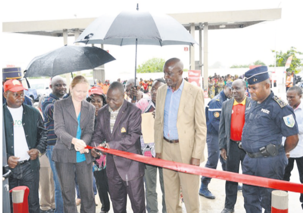
La directrice générale de Total Congo et le Maire de Ngo coupant le ruban symbolique