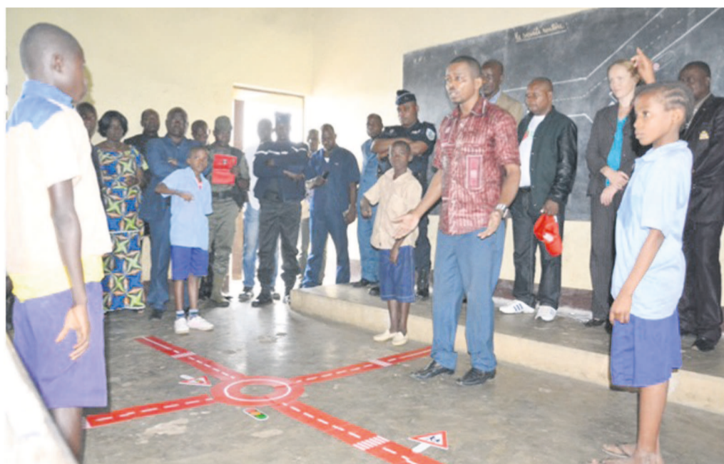
Les élèves et l'instituteur pendant l'atelier de restitution