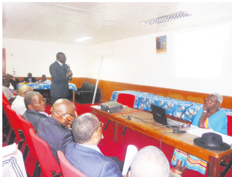
La séance de travail

Les responsables de fédérations sportives nationales doivent inclure dans leurs textes fondamentaux, l'existence de la Chambre de conciliation et d'arbitrage du sport (CCAS).