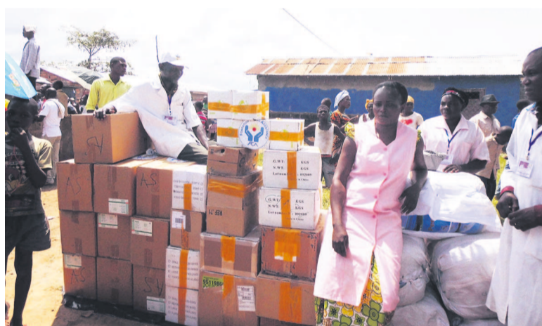
Un échantillon des dons