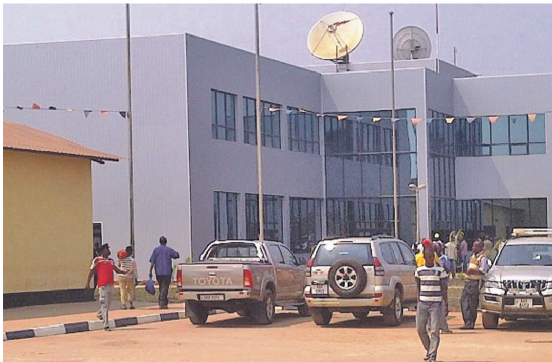
Un des bâtiments du poste frontalier de Kasumbalesa