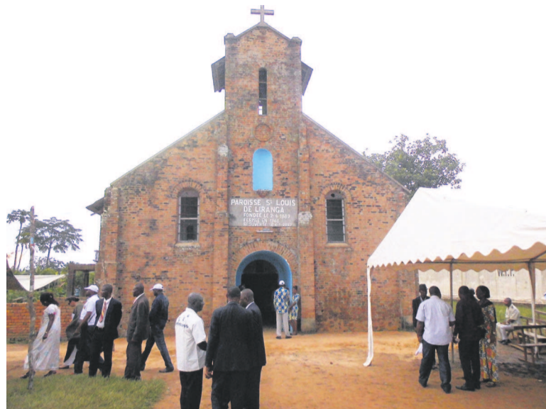
Une vue de l'église Saint Louis de Liranga

Les ressortissants du district de Liranga attendent aussi de leur marraine, Antoinette Sassou N'Gusso son appui dans la réalisation du projet de la route Liranga-Impfondo qui désenclavera davantage ce département. Pour s'être impliquée personnellement à ces célébrations, l'épouse du chef