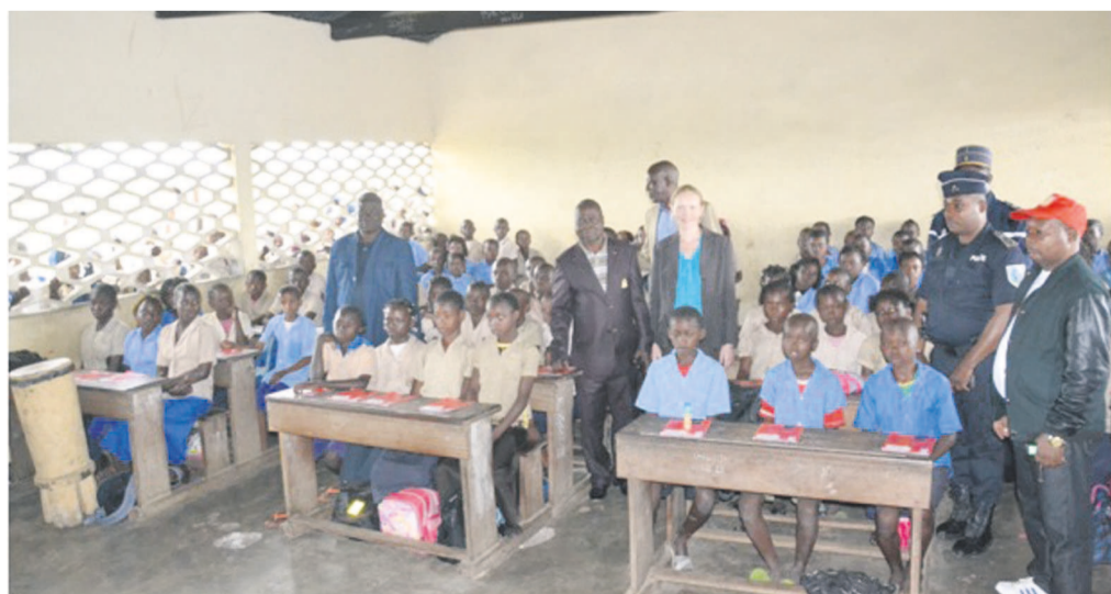
La directrice générale de Total Congo, les autorités locales et les enfants sensibilisés

Tél. BZV : 00 242 06 660 65 26 – Tél. PNR : 00 242 06 660 65 27 Raison sociale : TOTAL CONGO S.A. Société Anonyme au capital de 10 000 000 CFA Adresse du siège social : Rue de la Corniche – BRAZZAVILLE – REP. DU CONGO RCCM n° 07-B-302 – NIU : M 2005110000197159