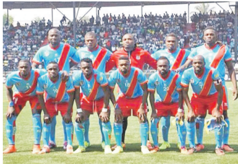
Les Léopards de la RDC

La qualification à la 30 e Coupe d'Afrique des Nations-Guinée équatoriale 2015 comme meilleur troisième de tous les sept groupes des éliminatoires fait partie des raisons de la montée de la RDC au classement Fifa du mois de novembre. Elle a quitté la 60 e position pour la 55 e place.