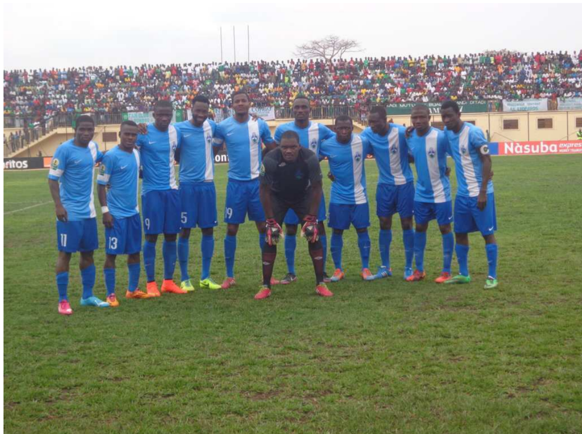
Séwé sport San Pedro

Qui de Séwé sport et d'Al Ahly va remporter la Coupe africaine de la Confédération ? Cette question trouvera sa réponse, le 6 décembre, au Caire au terme de la manche retour de la finale qui s'annonce âpre au regard du résultat de la première étape.