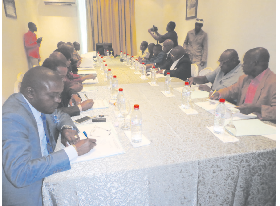
Les membres du comité exécutif de la Fécofoot en pleine session

Le comité exécutif s'est félicité des qualifications des Diabes rouges seniors et U-20 pour les Coupes d'Afrique des nations (CAN) 2015 en Guinée Equatoriale pour les seniors et au Sénégal pour les juniors. Il a également confirmé l'inscription