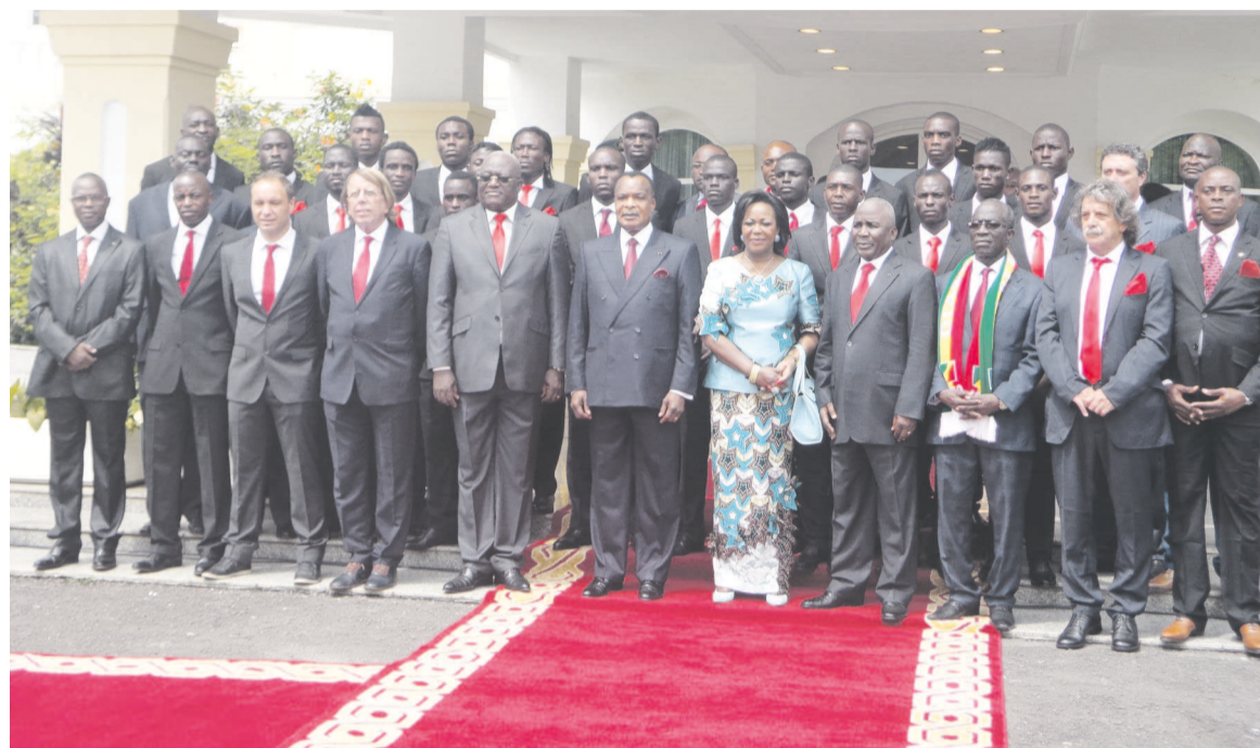
La photo de famille des Diabes rouges avec le Président de la République et son épouse