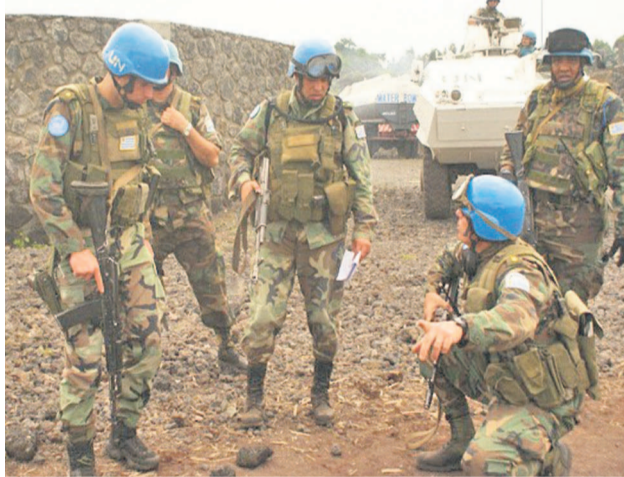
Des casques bleus dans une zone opérationnelle

Des explications qui sont loin de convaincre l'opinion publique à Goma. Cette dernière croit dur comme fer que c'est la Monusco qui entretient les groupes armés dans la région. Ces tenues militaires des Fardc qu'arboraient hier encore les rebelles du M23 semant la confusion au front avec les forces loyalistes