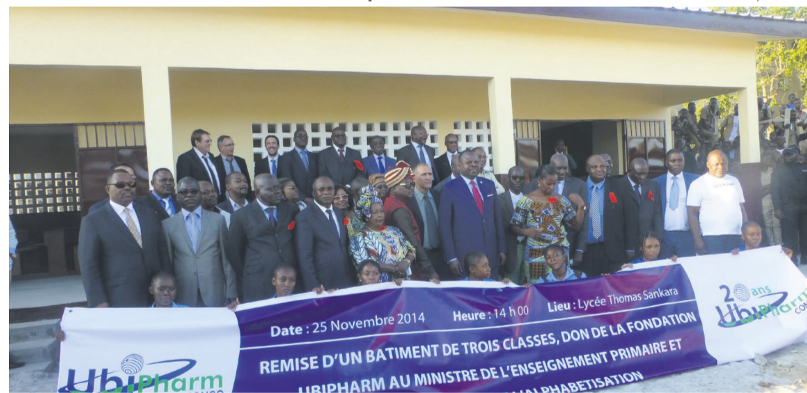
Photo de famille à côté du nouveau bâtiment

motion des activités éducatives. Elle a, en outre, saisi l'occasion pour informer l'assistance que cette Fondation, à peine créée, est à sa troisième réalisation dans les domaines précités. Il y a deux décennies qu'Ubipharm est dans le domaine du médicament.