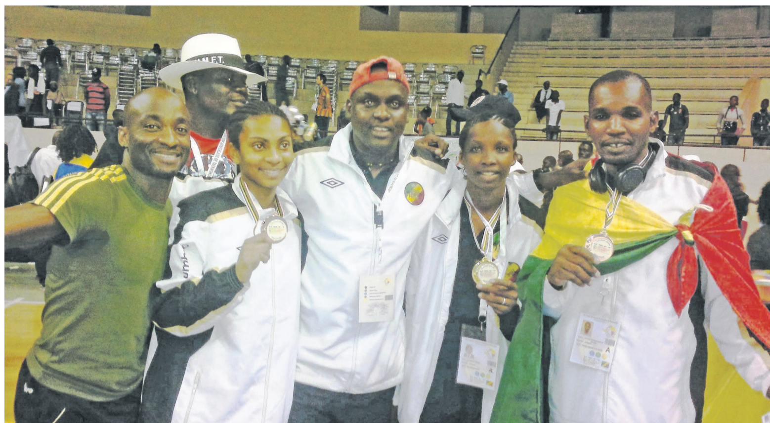
Les médaillés congolais

la compétition. Finalement, la moisson des Diables rouges est répartie en trois, selon la provenance des athlètes. Ceux venus de Brazzaville ont obtenu la médaille d'or, celle de la France et celui de la Côte d'Ivoire des médailles de bronze.