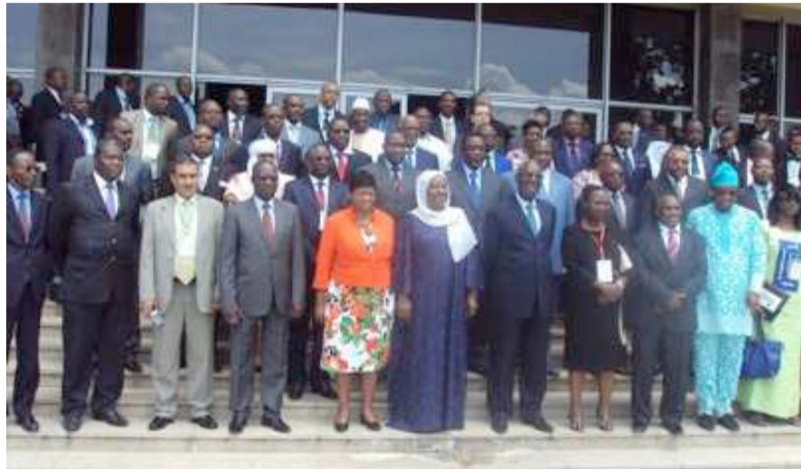
Les ministres de l'Union africaine membres du CTS n°8 et les experts

la prévention et la lutte contre la corruption et le comportement éthique, doivent impérativement s'ériger au rang de repères essentiels dans nos pays respectifs. Ceci au moment où notre cher continent œuvre, sans désemparer, pour son accession à l'émergence d'ici à l'horizon déjà si proche de 2025 », martelait le ministre du Travail