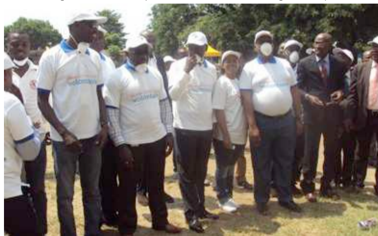
Les officiels avant de peindre le bâtiment de l'école de la Glacière