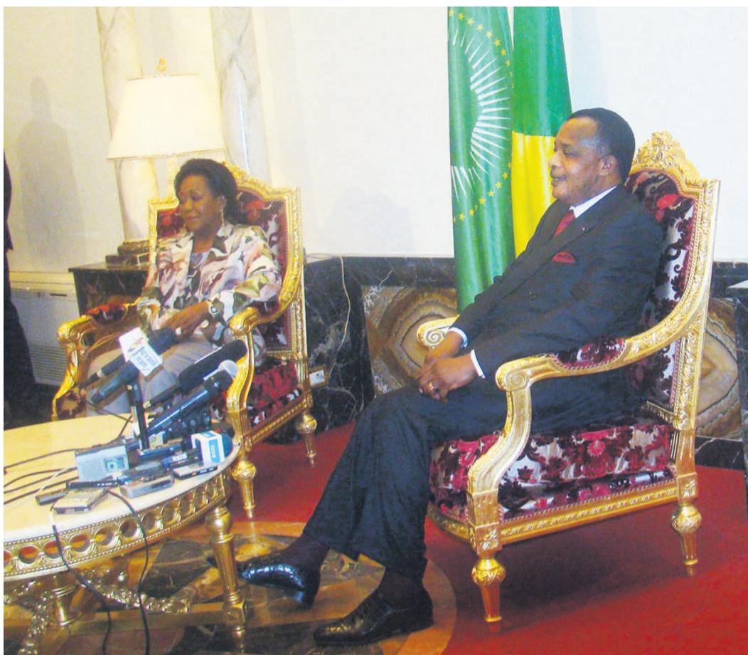
Le couple présidentiel au salon d'honneur à l'aéroport international de Maya Maya de retour à Brazzaville