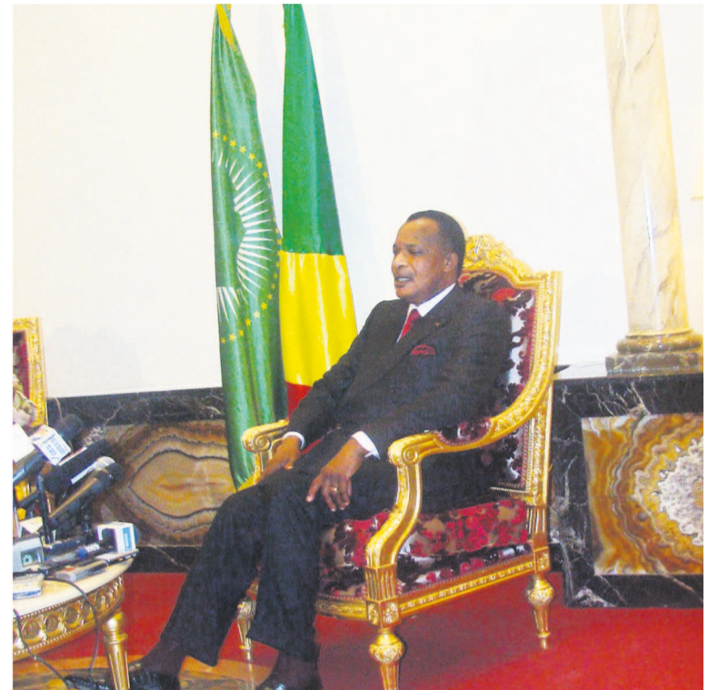
Denis Sassou N'Guesso

« C'est 50 ans de relations et de luttes diverses pour la libération des peuples. Vous avez suivi les luttes menées pour libérer l'Angola, l'Afrique