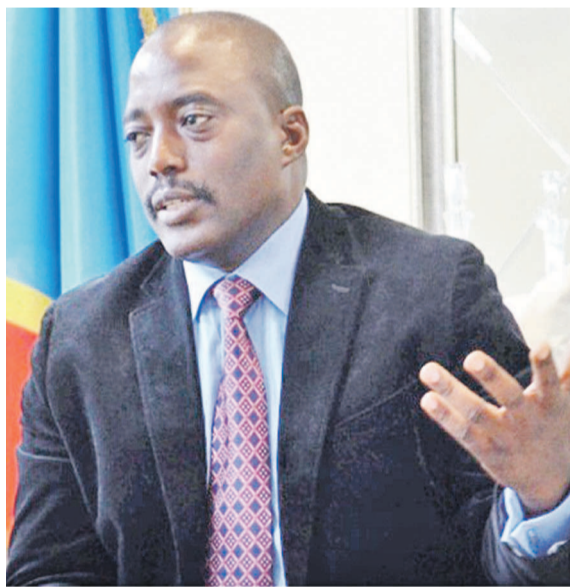
Joseph Kabila Kabange

C'est dans une atmosphère crispée que Joseph Kabila sera amené à prononcer son discours sur fond d'agitation dans la classe politique avec, à la clé, la tenue imminente d'un dialogue politique censé pallier l'échec de concertations nationales. Se présenter devant la représentation nationale sans résoudre la question épineuse du gouvernement de cohésion nationale serait suicidaire pour autant que la promesse d'exécuter les recommandations de ce forum national n'a pas été tenue. Certaines langues président la publication de cette équipe gouvernementale dans les heures qui viennent avant que le chef de l'État ne fasse son rituel au Palais du peuple. Au niveau de l'opposition, l'indifférence est perceptible. Les opposants disent ne rien attendre de ce discours qui risque de ressembler aux précédents, sans réelle incidence sur la vie de la Nation.