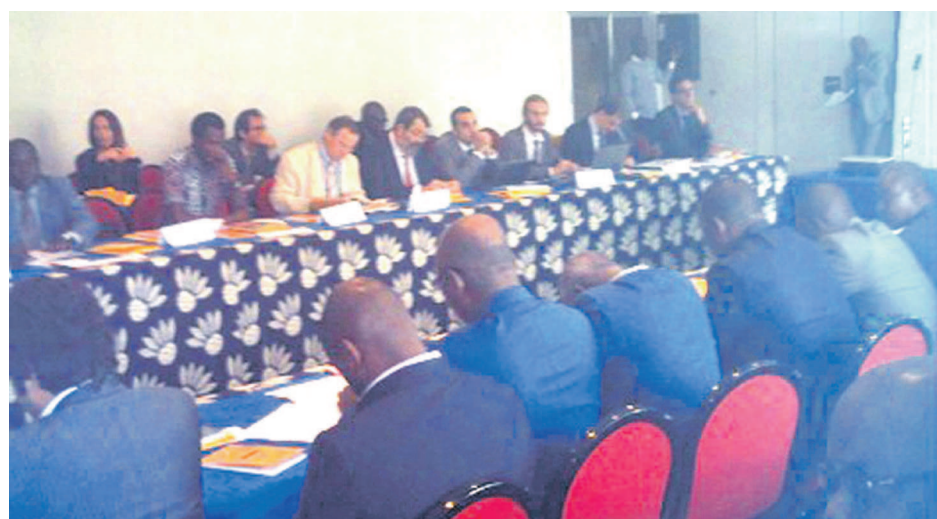
Une vue des participants

Cinq ans après sa mise en place, le projet d'appui à la gestion durable des forêts (Pagef) arrive à son échéance le 28 février de cette année. Et le Centre national d'inventaire et d'aménagement des ressources forestières et fauniques (Cniac) a été choisi le 06 février lors de la dixième session du comité de pilotage du Pagef qui s'est déroulée à Pointe-Noire pour perpétuer la gestion durable des forêts.