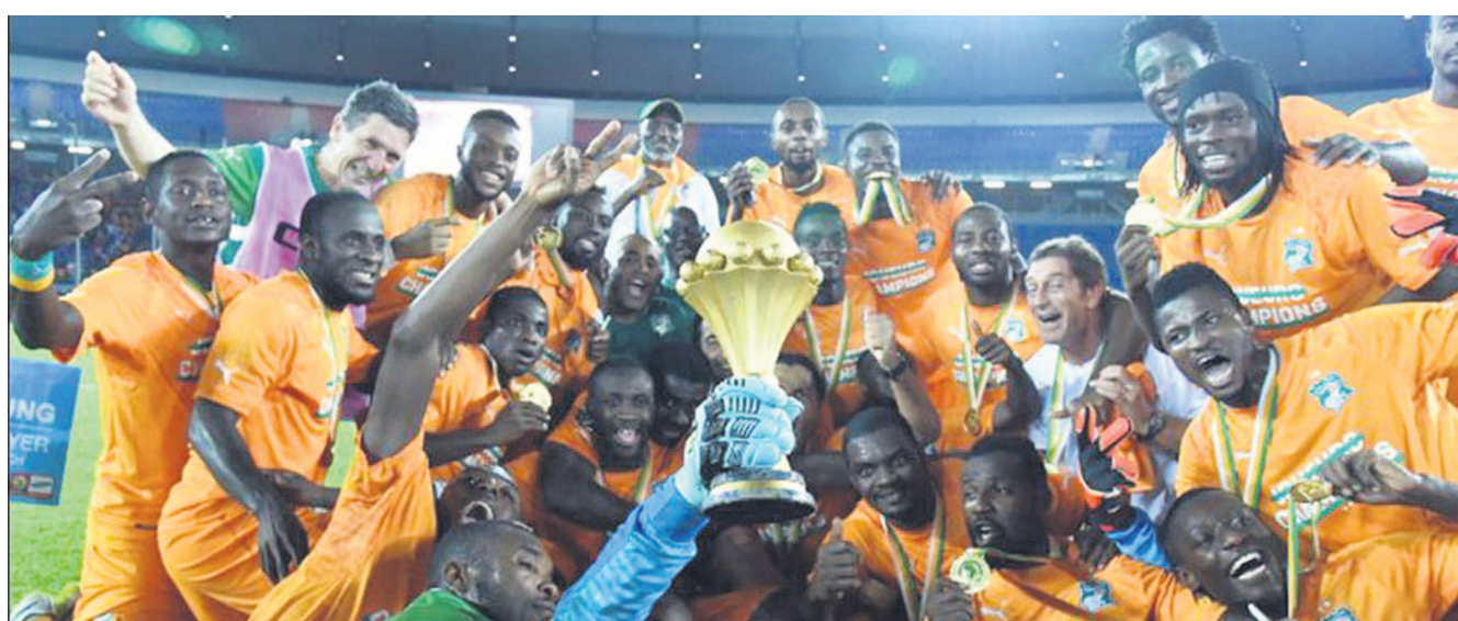
La jubilation des Ivoiriens

Les Éléphants de la Côte d'Ivoire ont remporté, après une finale âprement disputée pendant les 120 minutes de temps réglementaire, la trentième édition de la Coupe d'Afrique des nations en s'imposant aux tirs au but (9-8) face au Ghana. La sélection ivoirienne met ainsi fin à la malédiction qui la poursuivait depuis 2006 avec pour conséquence deux finales perdues (en 2006 et 2012). Elle doit son salut grâce à un entraîneur français : Hervé Renard qui rentre dans la légende en étant le seul à avoir remporté la CAN avec deux sélections différentes dont la Zambie, en 2012, puis la Côte d'Ivoire cette année. Retour également gagnant du gardien Barry Copa. Mis sur le banc durant toute la compétition, il a profité de la blessure du gardien Sylvain Gbohobo pour se montrer très décisif lors des tirs au but en enrayant deux sur les onze avant de marquer celui de la victoire. Page 24