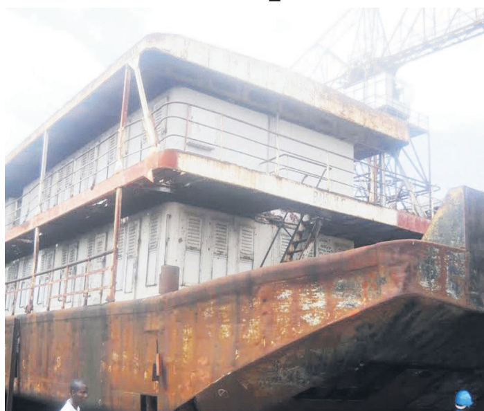
L'ITB Kokolo

La cérémonie d'inauguration du bateau récemment réhabilité dans sa totalité, de la fondation à la tôlerie, a eu lieu le 7 février au port de Kinshasa, en présence du président de la République, Joseph Kabila. Actuellement, c'est le plus gros bateau de la Société commerciales des transports et des ports (SCPT) avec huit barges dont cinq passagers et trois cargos.