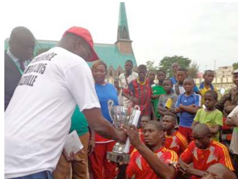
La remise des trophée

« En marge de cette conférence, nous avons voulu faire participer ceux qu'on estime « handicapés » mais qui participent à la vie sportive. Le terme handicapé, je ne l'aime pas. Je ne le supporte pas parce qu'il fixe les