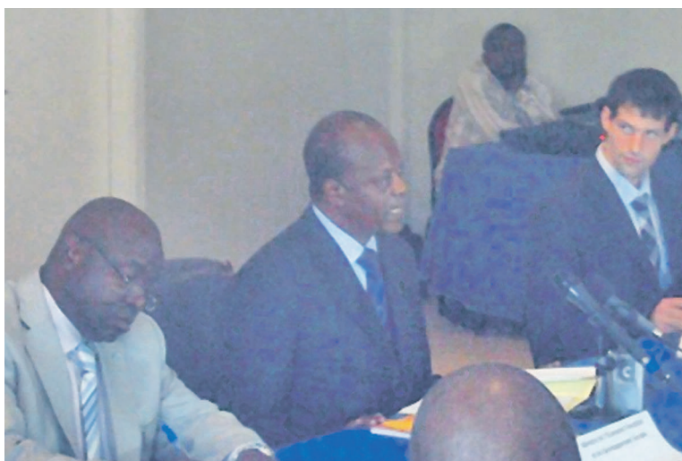
La tribune officielle lors du séminaire de capitalisation du PAGEF

Les participants ont demandé entre autres, la poursuite du Programme d'aménagement des forêts du sud-Congo afin d'atteindre l'objectif d'achever l'ensemble des