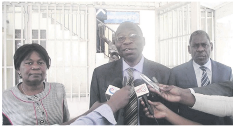
Le DG du Ciciba répondant aux questions de la presse, assisté de la DAF

Sortant droit de Kinshasa, capitale de la RDC, ces deux personnalités qui sont en tournée se rendront par la suite à Yaoundé, au Cameroun, après l'étape de Brazzaville. Dans ce pays, ils échangeront aussi avec le ministre de la Culture, avant de retourner à Libreville. Les prochaines étapes de cette mission, ce seront l'Angola, la Guinée Équatoriale, la Zambie, le Rwan-