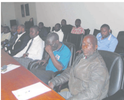
Une vue des acteurs