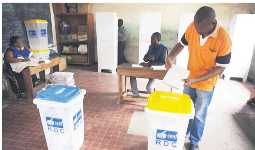
Un citoyen accomplissant son devoir civique dans un centre de vote

La Commission électorale nationale indépendante (Céni) a publié hier le calendrier des élections générales couvrant tous les niveaux des scrutins jusqu'aux législatives et la présidentielle. Ce calendrier qui tend à répondre aux exigences de la communauté internationale se veut conforme à la Constitution et à la loi électorale. Il intègre tous les détails inhérents à la tenue des élections crédibles et transparentes assorties des dates précises. L'on retiendra que le 13 juillet 2016, la Céni procédera à la publication des listes définitives des candidats aux élections législatives et présidentielle. Les Congolais accompliront leur devoir civique de vote le 27 novembre 2016, date arrêtée pour la tenue des législatives et de la présidentielle. Les résultats définitifs seront annoncés le 17 décembre de la même année. Par ailleurs, la Céni a annoncé que les élections provinciales, municipales, urbaines et locales auront lieu le 25 octobre 2015. Les résultats seront annoncés le 10 décembre. Les sénateurs seront élus le 17 janvier 2016 alors que l'élection des gouverneurs et vice-gouverneurs aura lieu le 31 janvier 2016. Page 13