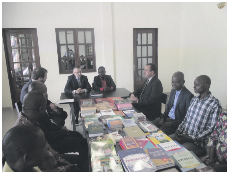
Les livres russes remis à la Bibliothèque nationale exposés sur la table

En ce qui concerne les autres axes de la coopération entre les deux pays, l'ambassadeur de la Fédération de Russie au Congo pense que les perspectives sont immenses et qu'il faut prévoir l'organisation des différentes activités conjointes avec la Bibliothèque nationale et le Centre culturel russe, sur