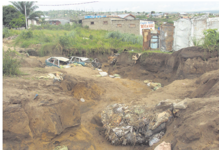
Les poteaux rasés par la pluie puis réinstallés par les jeunes ; une vue de l'érosion

Rappelons que Le Bled n'est pas le seul quartier de Brazzaville qui est actuellement