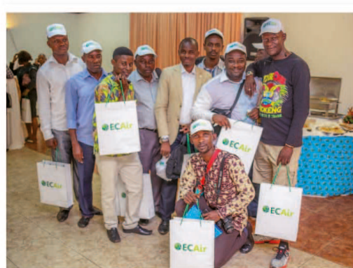
Des journalistes gabonais