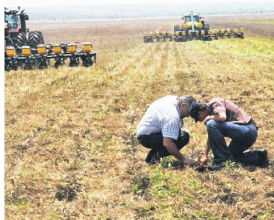
Une vue du Parc agro-industriel de Bukanga Lonzo

La septième réunion de la Troïka stratégique de l'exercice 2015, le 16 février, a eu comme point crucial l'instruction faite au ministère de l'Économie d'impliquer les opérateurs économiques désireux de développer des petites industries capables de s'intégrer dans les chaînes de valeur prévues.