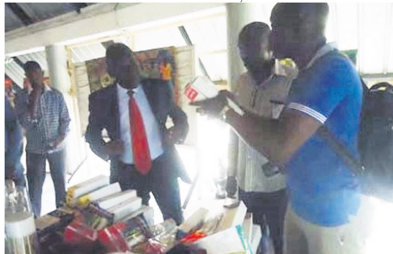
Le matériel de peinture remis aux peintres de Poto-Poto

association, a dit qu'ils ont voulu répondre au cri de