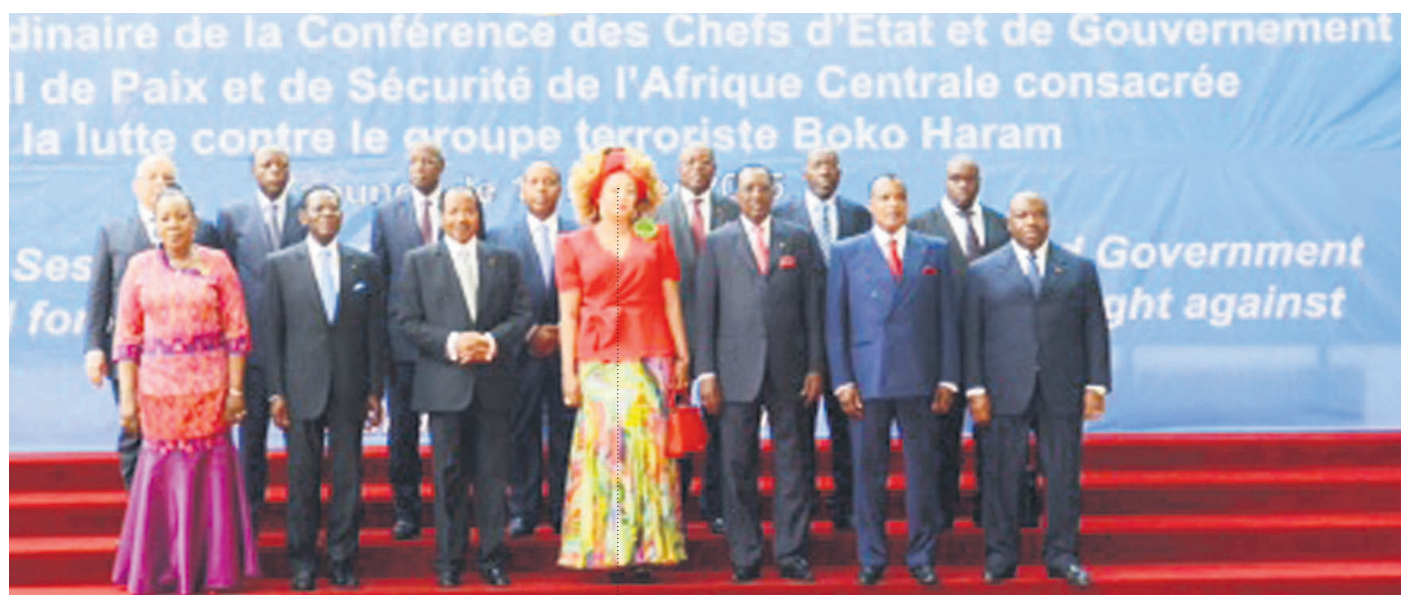
La photo de famille des chefs d'État lors du sommet