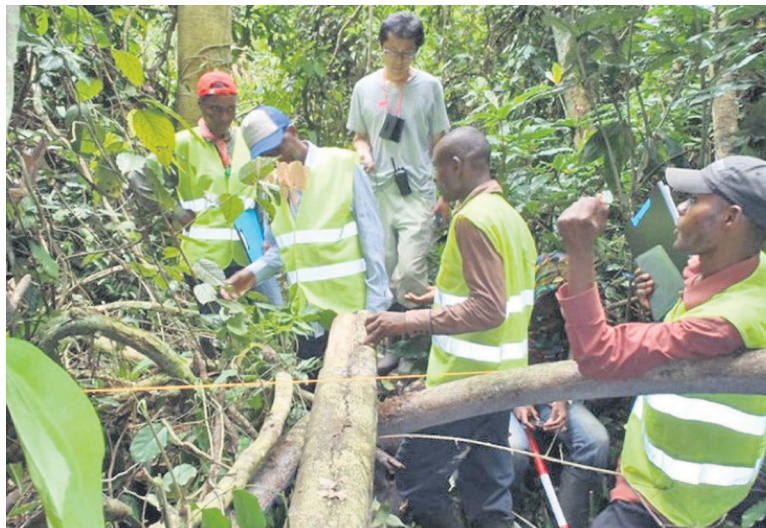
Des équipes de la Diaf en pleine campagne dans le Bandundu

Soulignant l'importance de cet exercice qui rentre dans le cadre de la préservation des forêts ou de la gestion durable des écosystèmes forestiers, André Kodjo a indiqué, à l'issue de l'audience accordée à cette équipe par le gouverneur intérimaire de la province de l'Équateur, Sébastien Impeto Pengo, que tout arbre qui tombe pourrit ou brûle, dégage un gaz dénommé dioxyde de carbone.