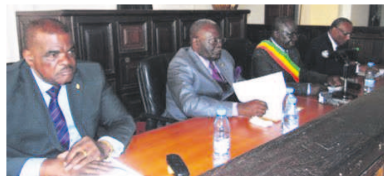
Le collectif des sénateurs lors de leur descente parlementaire