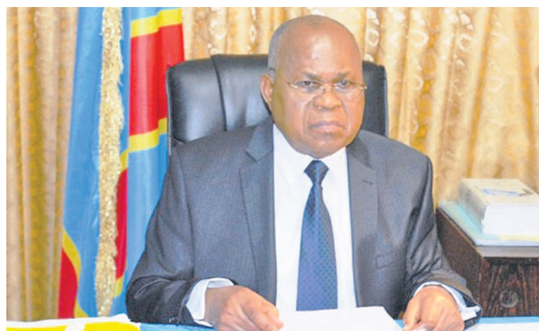
Le président de l'UDPS, Étienne Tshisekedi

Pour le parti d'Étienne Tshisekedi, l'agencement de ce calendrier ne tient pas compte des préalables requis pour l'organisation des élections locales, municipales et urbaines crédibles et transparentes dans le délai requis. L'UDPS voit également en la priorité accordée à l'organisation de ces élections à la base, contrairement aux précédentes éditions de 2006 et 2001, « un agenda caché et une tentative de déboucher sur un cas de force majeure qui