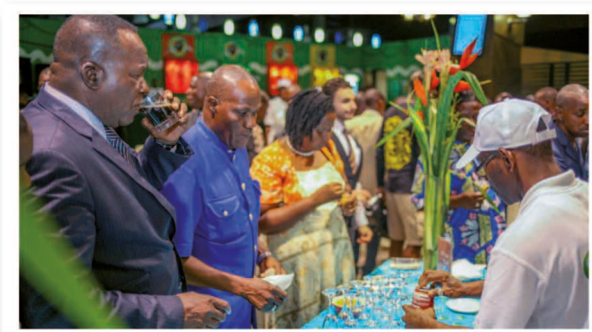
Après l'atterrissage du Boeing 737-700 d'ECAir à l'Aéroport Léon-Mba de Libreville, les invités ont pris part au cocktail