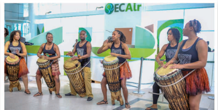
Les danseuses et musiciennes de la troupe Bichini Bia Congo devant la nouvelle agence d'ECAir à l'Aéroport de Maya-Maya