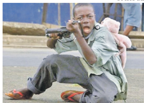
La place d'un enfant n'est pas dans les forces ou groupes armés

enfants qui sont parvenus à sortir des groupes armés. Ensemble, ils assurent la vérification des enfants et leur prise en charge dans les centres de transit et d'orientation ou dans les familles d'accueil transitoire avec des activités récréatives et psychosociales. L'Unicef participe enfin à la recherche familiale ainsi qu'à la réinsertion des enfants dans la société à travers des programmes de rattrapage scolaire ou de formation professionnelle. Dans le cadre du processus de démobilisation et réinsertion des enfants associés aux forces et groupes armés,