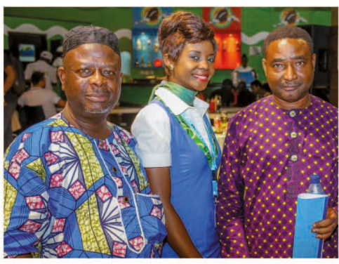
Une PNC d'ECAir en compagnie de deux dirigeants d'agences de voyage à Libreville

La compagnie aérienne nationale de la République du Congo, ECAir, Equatorial Congo Airlines, poursuit sa croissance. Après l'arrivée de son premier Boeing 767, le Mont Nabemba, début Février; la mise en place d'un vol quotidien sur Paris et Dubaï et l'annonce de l'ouverture de 10 destinations dont 2 intercontinentales cette année, ECAir développe son réseau. Libreville, la capitale gabonaise, est désormais desservie par ECAir, à raison de 3 fréquences par semaine. Le vol inaugural a eu lieu le lundi 9 Février. Cette nouvelle route est la 8e ville desservie par Equatorial Congo Airlines au départ de Brazzaville, après Pointe-Noire, Ollombo, Kinshasa, Cotonou, Douala, Paris, Dubaï. Ces annonces confirment l'engagement et la volonté d'ECAir de transformer l'Aéroport de Maya-Maya en un hub en Afrique centrale.