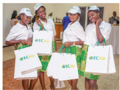
Les charmantes hôteses d'ECAir distribuent des cadeaux aux invités