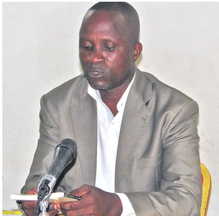
Éta lors de la présentation du livre au centre culturel JBTL

« Visiter les écoles aujourd'hui fait prendre conscience de l'état de santé et du devenir du pays. C'est aussi comprendre la direction vers laquelle roule, à tombeau ouvert, le véhicule de la Nation. Les élèves s'affectionnent pour la pacotille. Ils aiment la facilité et ont la boulimie des héritages mal façonnés », peut-on lire à la page 35. comme certains de ses collègues, Ékabela censé transmettre le savoir, éduquer et encadrer la jeunesse a cessé d'être un modèle. « L'enseignant inspirait le respect.