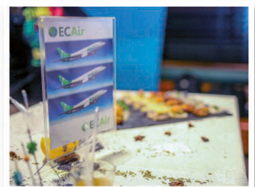
La compagnie aérienne nationale du Congo envisage d'ouvrir à Dakar, Bamako et Abidjan, dans les semaines à venir