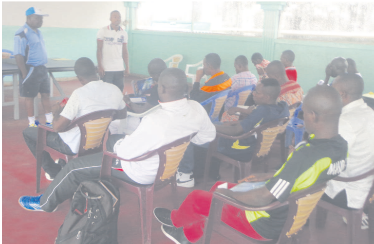
Une vue des stagiaires

En organisant ce stage d'entraîneurs de niveau 1, la Fédération congolaise de tennis de table (FCTT) a un but à atteindre : se doter des ressources humaines compétentes en vue de concrétiser le projet de création des centres de formation de tennis de table dans les 9 arrondissements de Brazzaville ainsi que dans tous les départements.