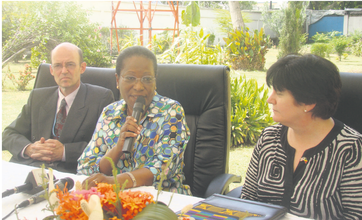
La ministre Emilienne Raoul, au centre, lors de sa plaidoirie

depuis 1954. « Le Haut-commissariat des Nations unies pour les réfugiés (HCR) et le PAM en collaboration avec le ministre des Affaires sociales,