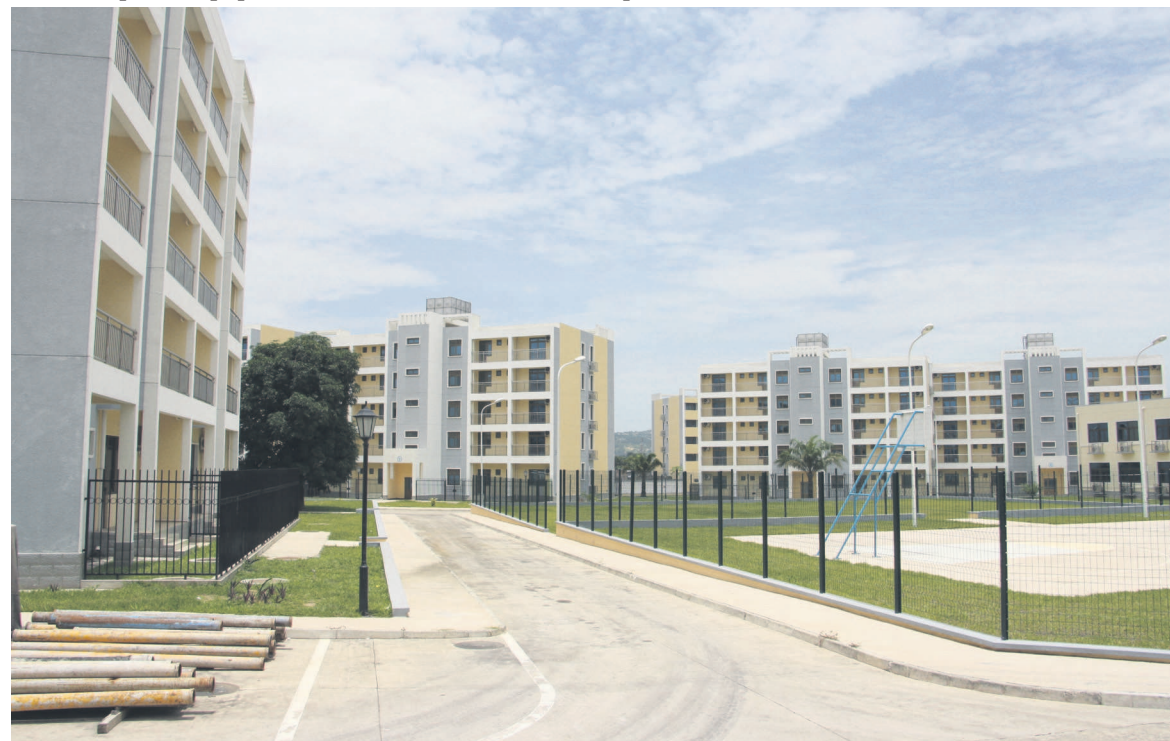
Les logements sociaux de Mpila

Dans la zone dite rouge, celle voisine de l'épicentre des explosions, il est envisagé la construction des logements modernes. Au total, 48 logements témoins sont en voie d'être érigés par l'entreprise Sinohydro qui a reçu une avance de démarrage des travaux exceptionnelle d'environ 50% du montant du marché. Mais le démarrage effectif des travaux dépend d'une procédure d'expropriation menée en concertation avec les autorités des quartiers et les propriétaires de parcelles.