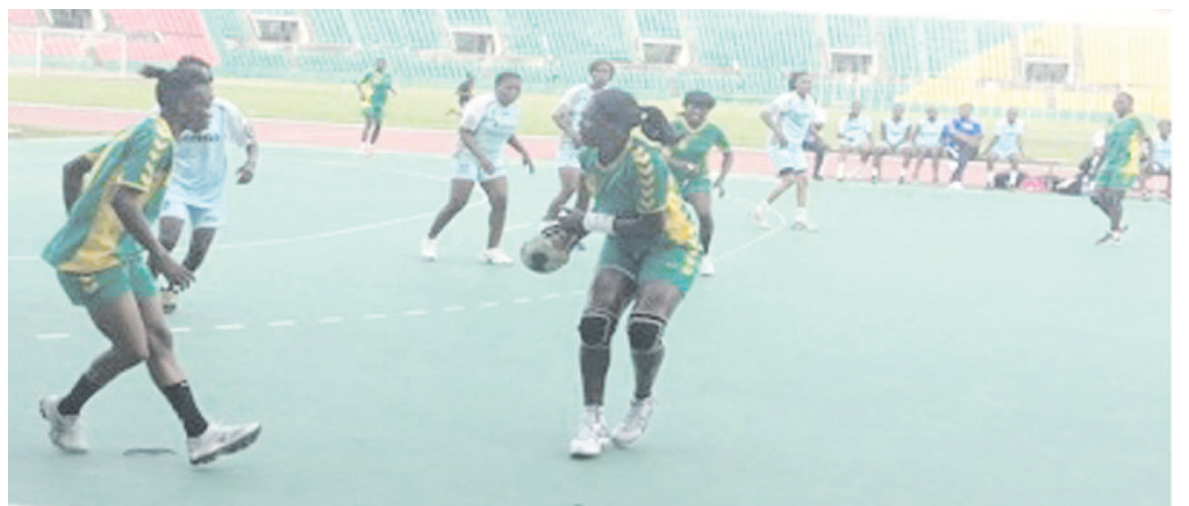
Un match de handball

Diabls noirs 53 à 16. Dans la catégorie hommes, Inter l'a également emporté 44 à 26, face à ASB. Par ailleurs, Caïman chez les juniors hommes a vaincu Club 57, 47 à 20. Diabls noirs s'est incliné devant ASB 34 contre 44. Les juniors dames de Cara ont battu celles d'Asel 26 à 23. Abo-Sport a infligé une