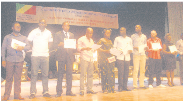
Dix jeunes sélectionnés dans le cadre de l'entrepreneuriat juvénile