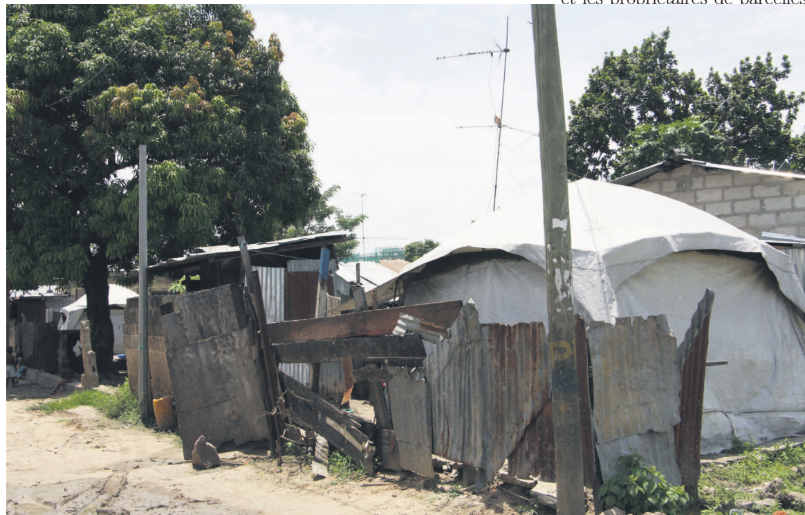
Plusieurs familles attendent encore dans des abris de fortune

Depuis 2013, le gouvernement avait entamé la réhabilitation des maisons endommagées. « Cette opération est menée par phase. La première phase concerne au total 821 parcelles que 17 entre-