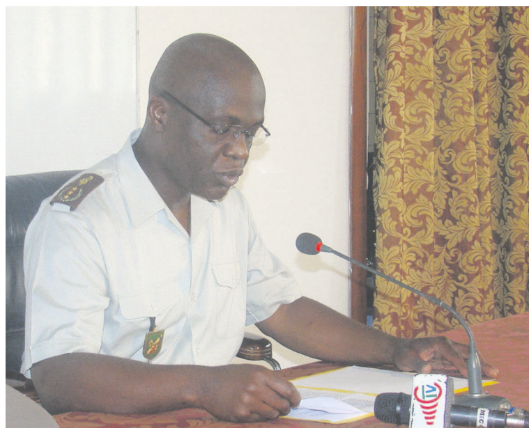
Le chef d'état-major général des FAC