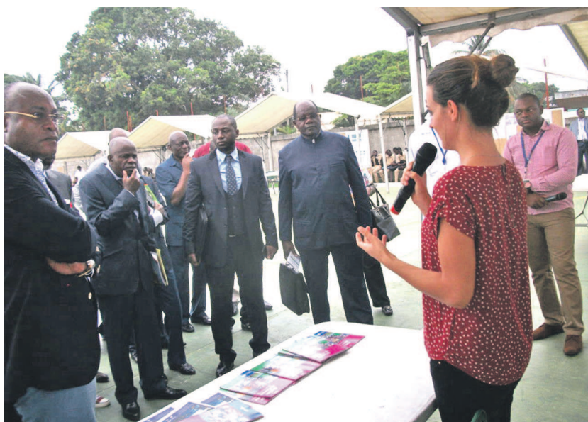
Le stand de Campus France

Ce partenariat existe aussi depuis 2009 entre l'entreprise et le ministère de l'Enseignement primaire et secondaire. Il permet de soutenir le dispositif des classes renforcées de la Seconde à la Terminale scientifiques au lycée Victor Augagneur. Ce programme vise les candidats ayant réussi au Bac, au concours d'entrée à un enseignement gratuit de qualité dans les filières scientifiques sanctionné par le passage de deux bac, le bac C congolais et le Bac S français. Avec ce forum de l'orientation, ces candidats et tous les élèves des séries scientifique et technique de Pointe-Noire peuvent désormais s'informer sur les cursus post-bac, les conditions d'octroi de la bourse nationale et les opportunités de carrière disponibles au Congo et dans la sous région.