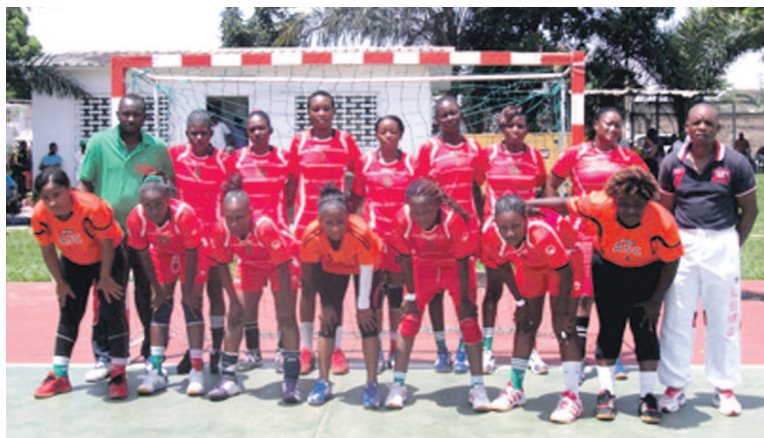
L'AS Cheminots dames «adiac»

Dévoués dès le début de la compétition afin de reconquérir le podium du championnat communal après plusieurs années d'hibernation, l'AS Cheminots qui a refait peau neuve cette année, grâce au renfort des joueuses venues de Brazzaville, a regagné la confiance de ses supporters du quartier Kilomètre 4, qui étaient harassés d'essayer des défaites, chaque fois dans leurs propres installations. Ge-