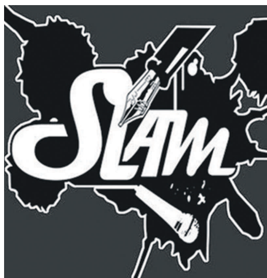
La quatrième scène ouverte de slam se prépare à la Halle de la Gombe

Les inscriptions en cours jusque l'après-midi du 10 mars est une opportunité offerte à une quinzaine de slameurs de faire partager leur amour des mots et leur art oratoire sous la grande halle à l'occasion de la célébration de la Journée internationale de la poésie, la soirée du 21 mars.