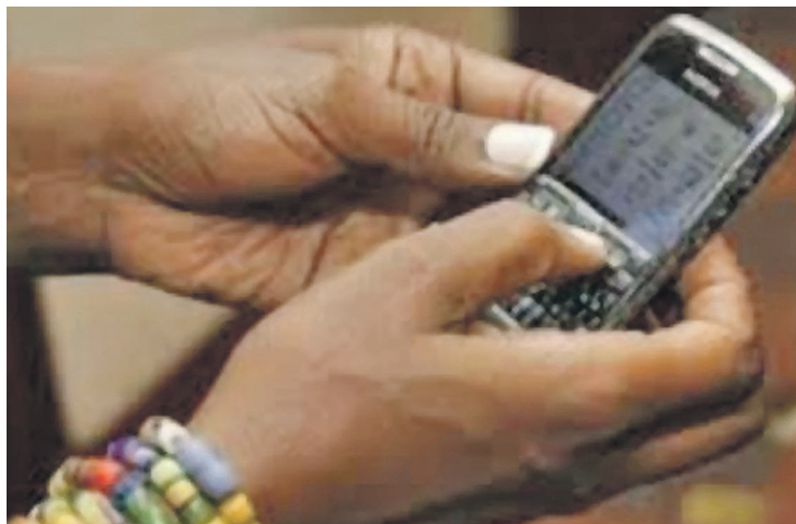
La communication coûte cher

Pour les consommateurs de ces services, cette décision n'est pas la bienvenue quand on sait pertinemment bien que le vécu quotidien de bien des Congolais pose problème, quand déjà on a du mal à nouer les deux