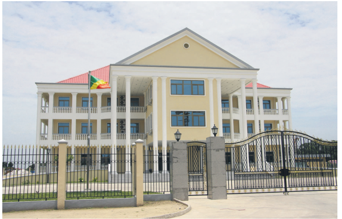
Le futur siège de la mairie de Talangaï, à Mpila

Au nombre des actions post-urgence programmées par le gouvernement afin de reconstruire les zones détruites de Ouenzé et Talangaï, les établissements scolaires laissent une bonne impression. Pierre Ntsiété, Fleuve Congo, Trois Martyrs, Nkombo, A.A Néto, Thomas Sankara et Liberté ont vu leurs capacités d'accueil se décupler et les conditions de travail s'améliorer qualitativement. Le lycée de la Révolution et le collège Gampo Olilou promettent, eux aussi, de bons lendemains avec d'impressionnants