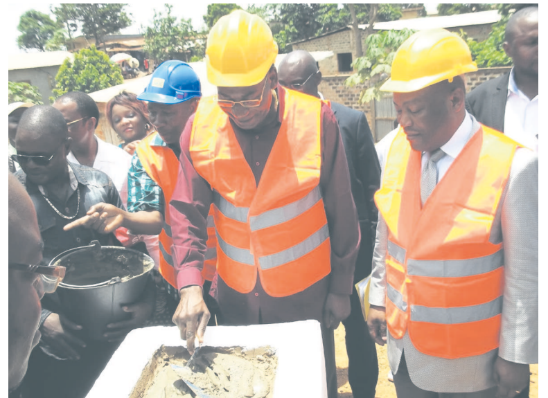
Le ministre Pierre Mabiala posant la première pierre de l'ouvrage

Le ministre des Affaires foncières et du domaine public a procédé le 28 février dernier à Dolisie, dans le département du Niari, à la pose de la première pierre en vue des travaux du pont « Ngouma Joseph » situé au quartier Gaya. Pierre Mabiala agit ici en sa qualité de président d'honneur de la Dynamique pour la paix.