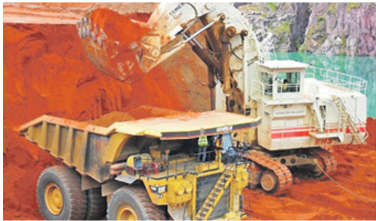
Chargement des minerais dans un camion benne

Dans leur plaidoyer, ces associations ont dénoncé le fait que depuis le début de la production des métaux, une part très importante de la redevance minière est retenue à Kinshasa en violation de l'article 242 du Code minier,