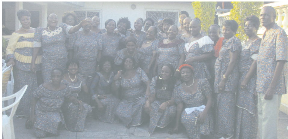
Les membres de la Mutrasb

Il a enfin placé les treize ans d'existence de cette association sous le signe de solidarité, de la fraternité au regard des prestations