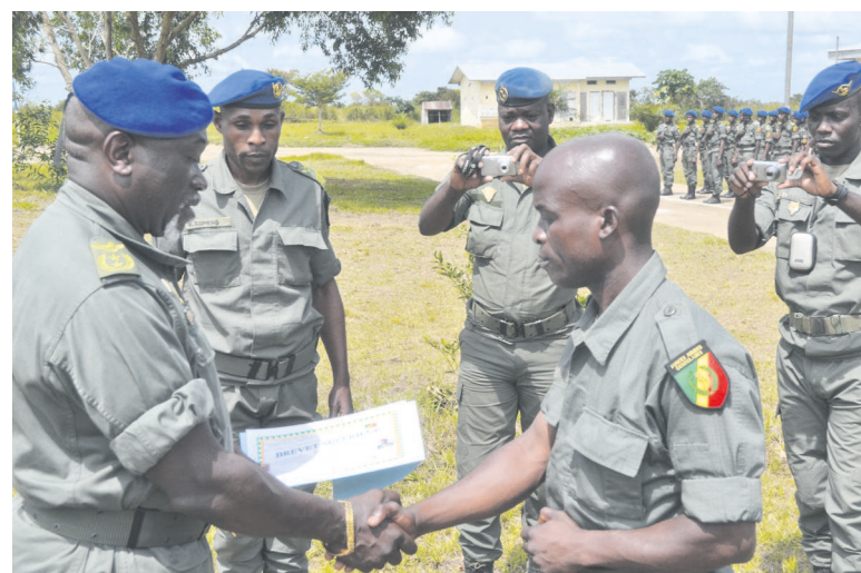
La remise des diplômes

Le deuxième temps fort était la remise des diplômes et le port d'insignes de brevet supérieur fusco-air par les autorités militaires et les autorités administratives de la sous-préfecture de Makoua. La cérémonie s'est achevée par un défilé militaire, le tout couronné à la fin par un apéritif.