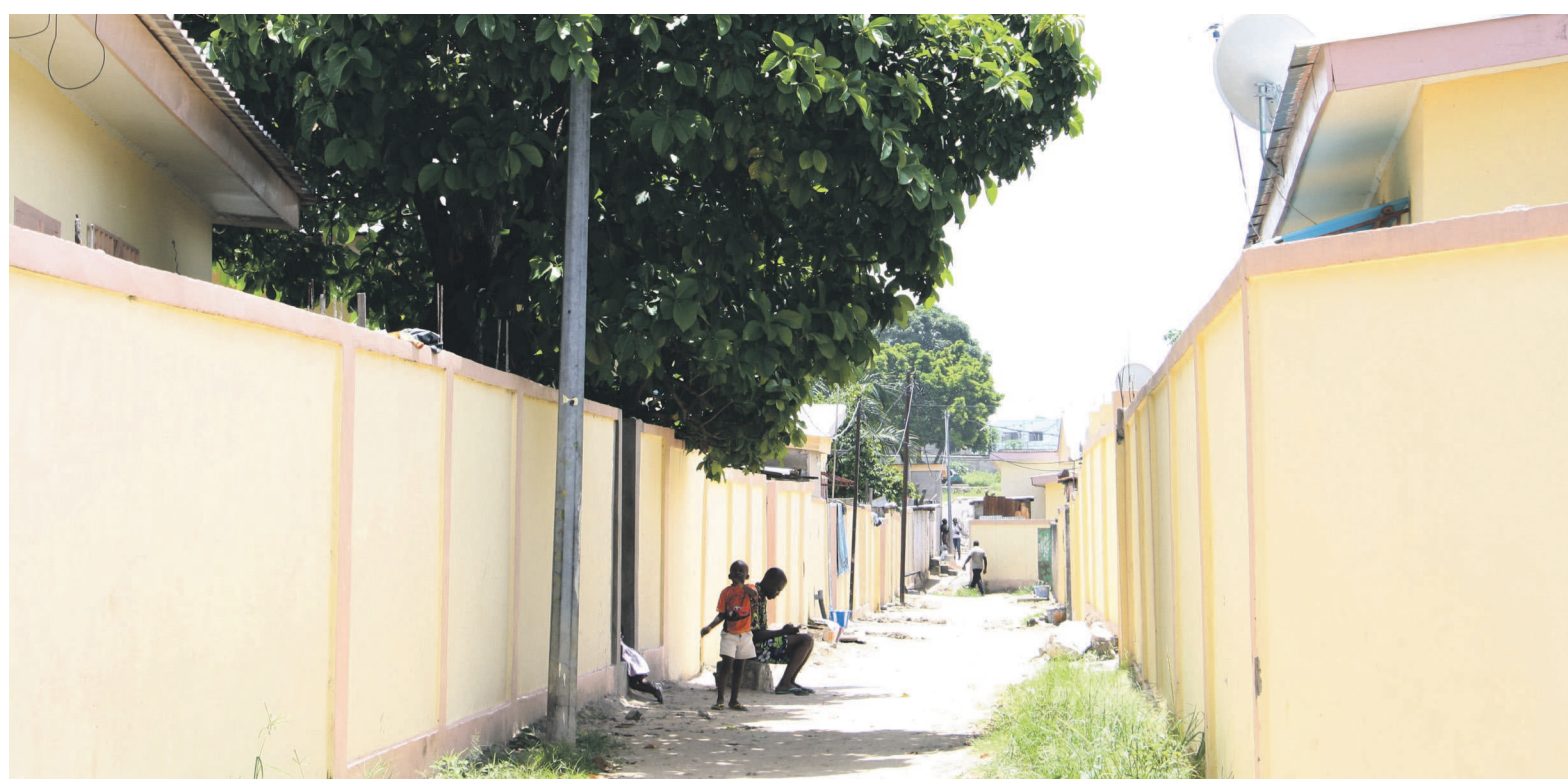
Les maisons des particuliers réhabilitées par l'État