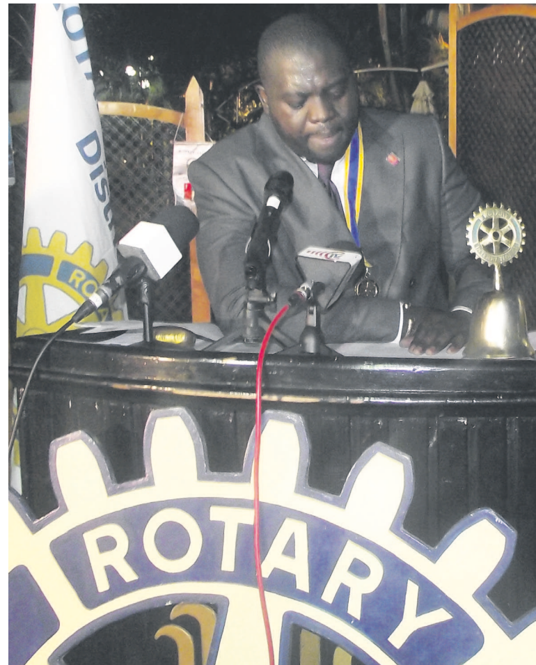
Le président Césaire Kouka prononçant son mot

À titre de rappel, en 2014, à l'occasion du 109 e anniversaire du Rotary international et de la célébration de la journée de l'Entente, les Rotariens de Brazzaville avaient choisi de soutenir la communauté centrafricaine. Au cours de cette soirée plusieurs voix s'étaient élevées pour exiger de la communauté internationale que la crise en République Centrafricaine (RCA) devienne une préoccupation quotidienne pour tous. Les Rotariens de Brazzaville s'étaient engagés pour s'associer à la dynamique de tous ceux qui voulaient du retour de la paix en RCA. Toujours dans ce cadre, à la conférence du