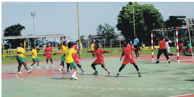
La photo du match As Cheminots/TiéTié