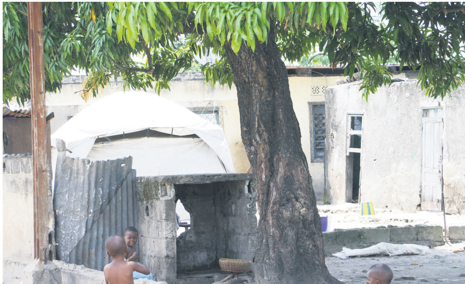
Des parcelles arborent encore des tentes en plein air

Mpila, le décor est quelque peu singulier. Des maisons de particuliers sont effectivement en construction. Dans la rue Yoro par exemple, des parcelles font peau neuve avec des murs peints. On peut aussi observer des travaux suffisamment avancés dans la rue Étoumba et Chacona. Ces maisons de quatre pièces, pour la plupart, font partie de la première phase d'un projet estimé à 40 milliards de FCFA pour