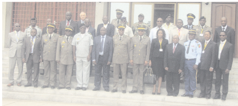
La photo de famille des membres des différentes délégations

Organisée du 2 au 6 mars à l'Ecole de génie travaux (EGT) de l'Académie militaire Marien-Ngouabi, la première réunion de la commission pédagogique du Conseil de paix et de sécurité de l'Afrique centrale (Copax) vise à former les professionnels dans les domaines de la prévention et celui de la gestion des conflits.