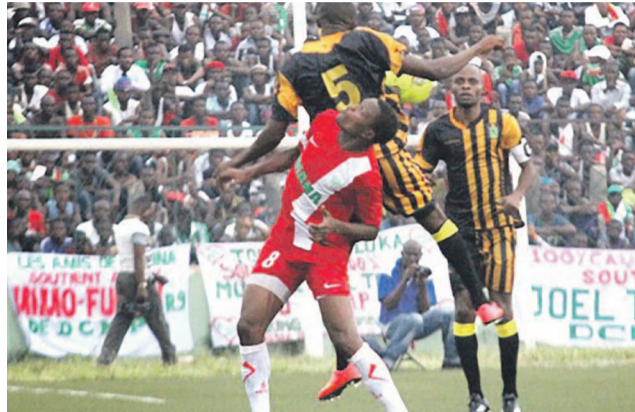
Vue d'une action lors du derby entre V.Club et DCMP au stade Tata-Raphaël à la Division 1