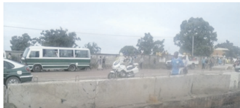
Ambiance devant l'entrée du lycée Thomas Sankara

Non contents de l'attitude de la force publique, les jeunes ont voulu opposer un bras de fer. Jets de pierres et de bouteilles, course-poursuite, sauts de murs, bombes lacrymogènes, etc., le spectacle a déteint sur l'ambiance