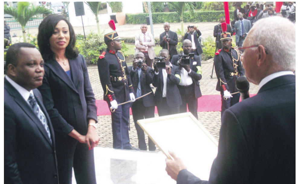
Henri Lopes remettant un échantillon des correspondances à Jean Claude Gakosso