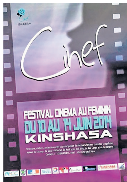
L'affiche de la première édition du festival Cinéma au féminin

En ce qui concerne les critères de sélection des films, l'AFCC en énonce trois. En premier lieu, il est exigé que le film proposé soit « réalisé par une femme congolaise ». Ce, avec l'option que dans le cas où s'agirait d'une œuvre réalisée par un homme, néanmoins « le sujet doit traiter des problématiques de la femme ». Ce serait dans ce cas le duo réalisateur-film à propos féminin qui pourrait s'avérer une chance de sélection dans ce cas. Quant à la dernière exi-