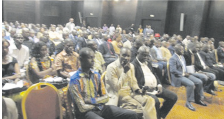
Une vue des participants

Face aux journalistes, Pierre Ngolo a porté un regard critique sur la Constitution du 20 janvier 2002. Il a ainsi démontré les limites de la loi fondamentale de 2002. Pour lui, le vrai problème de la Constitution découle de l'article 185 qui fixe la durée et le nombre de mandats à deux et la limitation d'âge. « La Constitution a été expérimentée pendant le premier septennat. On l'a mise en œuvre pendant un deuxième septennat. Treize ans après, on a saisi ses vraies limites. L'option d'une révision totale ou du changement de la Constitution en vue de l'instauration d'une nouvelle politique n'a aucun rapport avec le faux procès fait aux partisans du changement de vouloir instituer au Congo une monarchie, ou d'assurer à Denis Sassou N'Guesso la présidence à vie. Ce que le peuple a fait peut être défait par le peuple lui-même. Il ne peut être prisonnier d'une époque », a-t-il fait savoir, avant de s'étendre