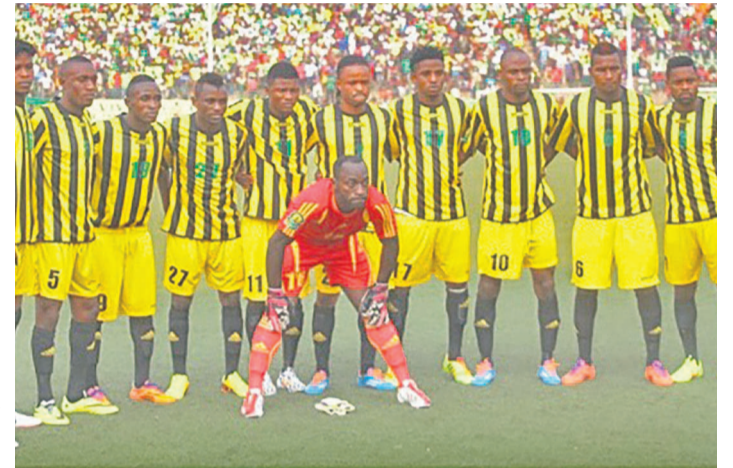
V.Club de Kinshasa

de la Confédération à l'équipe de Ferroviario de Beira de Mozambique. Le match aller est programmé au week-end du 13, 14 et 15 mars au stade Tata-Raphaël de Kinshasa, et avant que les deux équipes se retrouvent à nouveau à Beira pour le match retour le week-end du 3, 4 et 5