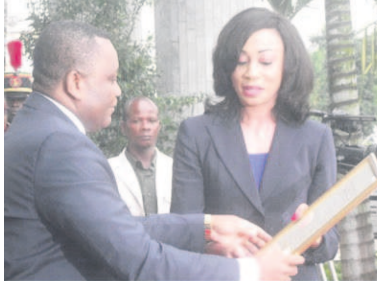
Le ministre remettant l'échantillon à la directrice des lieux

mesuré la portée pour la mémoire collective de générations de congolais. Et vous avez admis qu'il n'était pas juste que la figure tutélaire du fondateur de notre ville capitale restât enfouie dans l'obscurité des conflits de mémoires. Ce chemin tracé par vous nous lie au passé ; il ouvre inexorablement vers cet avenir porté par le désir de connaissance de notre histoire