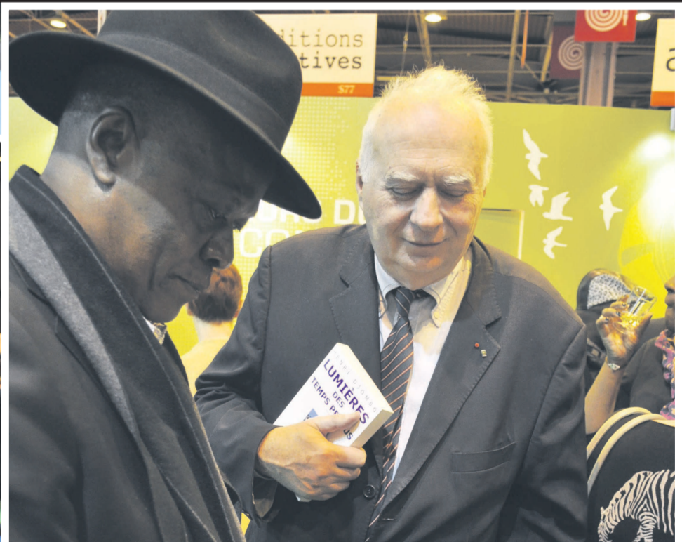
Lors de sa visite de courtoisie, samedi après-midi, Henri Djombo s'est livré à une séance de dédicace improvisée. Lundi, le Ministre de l'Economie forestière, de l'environnement et du développement durable prendra part, avec Henri Lopes, à une passionnante rencontre sur le Projet d'électrification lancé par Jean-Louis Borloo