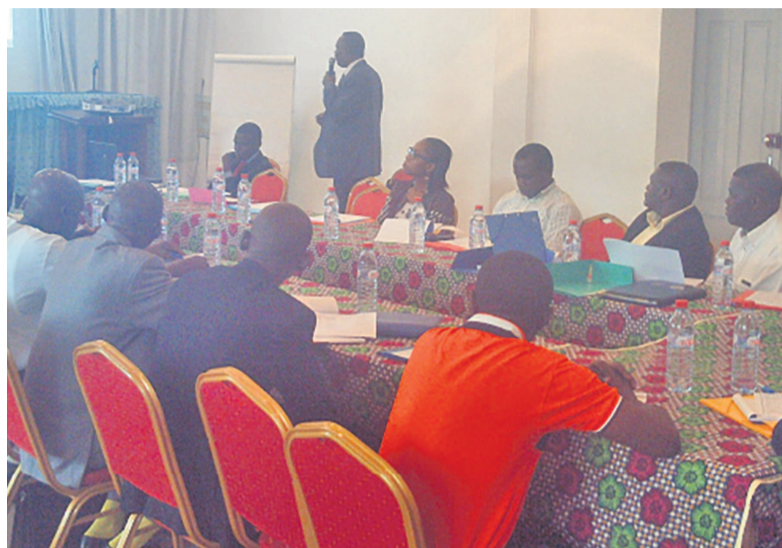
Une vue de la salle à la formation PRCCE-UE

la composante 3, appui au développement durable des PME/TPE « Beaucoup de responsables des PME/TPE ont des difficultés pour monter un dossier d'appels d'offres afin de soumissionner aux marchés publics. Quand ils arrivent à le constituer tant bien que mal, celui-ci n'est pas toujours conforme aux normes établies. Aussi n'ont-ils pas toujours de moyens d'introduire des recours en cas de besoin. Ces raisons justifient cette formation initiée à leur intention », a dit Aurelien Evariste Babingui, chargé des opérations du PRCCE à l'ouverture du séminaire.