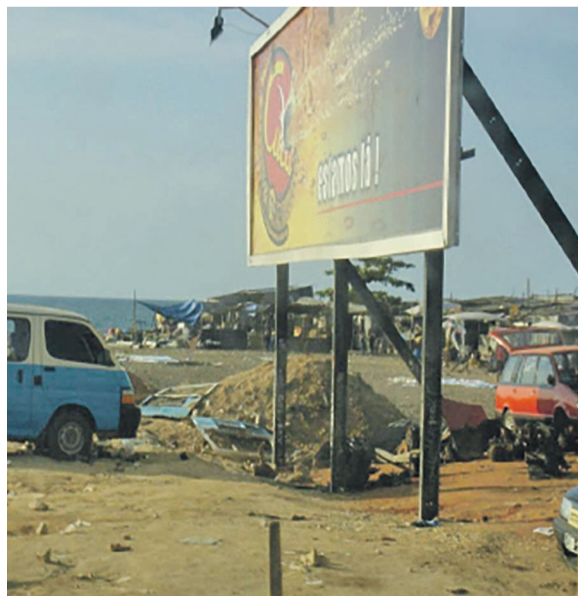
Un panneau publicitaire

Le constat a été fait, le 19 mars, sur l'avenue Marien-Ngouabi, non loin de l'arrêt de bus « Bolé bantou » où un panneau publicitaire est tombé de son support.