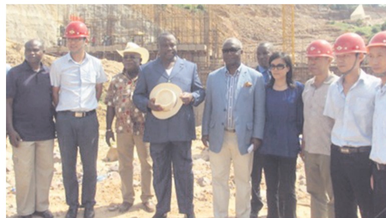
Les deux ministres posant avec les responsables de l'entreprise

relief, on se retrouve au niveau des roches avec une grande nappe d'argile presque sur 100m et des profondeurs qui dépassent même 20m, sur lesquels il faut purger. Ce sont parfois des choses inattendues qui peuvent grever sur le coût du barrage qui est estimé à 55 milliards FCFA, mais avec tous ces aléas, c'est sûr que nous aurons quelques coûts supplémentaires pour finaliser ce barrage », a avancé le ministre.