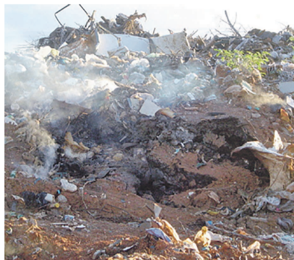
La gestion des déchets dans les pays en développement préoccupe aussi bien les gouvernants et les cinéastes

La 25 e édition du Festival du cinéma africain, asiatique et latino américain qui a lieu à Milan en Italie du 4 au 10 mai va accorder une place de choix aux problèmes de la sécurité alimentaire et ceux liés à l'environnement dans les différents pays en voie de développement.