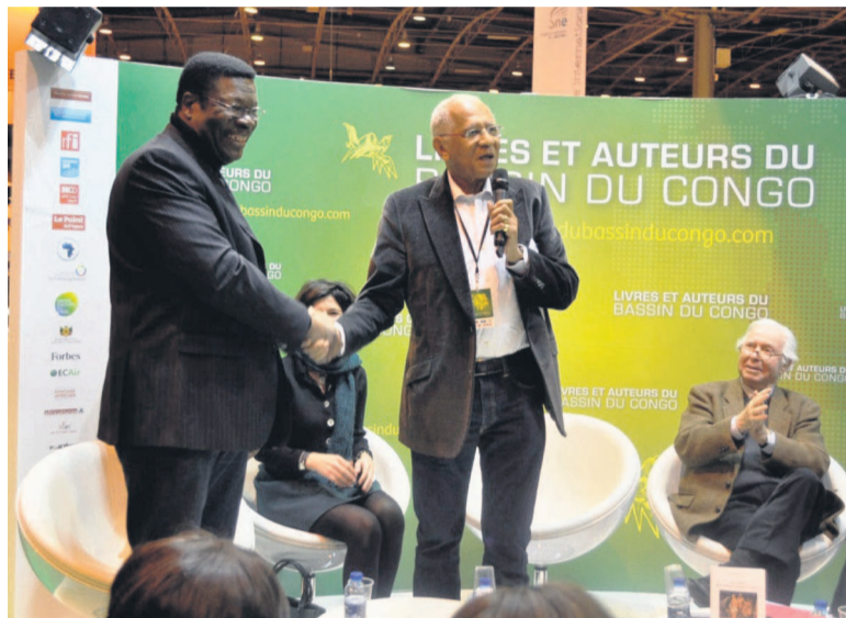
Président du Jury, Henri Lopes annonce à Koffi Kwahulé qu'il est le lauréat du Prix Mokanda 2015

Le romancier et dramaturge ivoirien, Koffi Kwahulé, rejoint ainsi d'autres éminentes figures de la littérature africaine. Le Prix couronne l'ensemble de son œuvre.