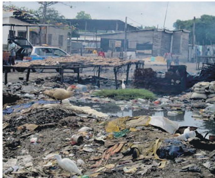
Tas d'immondices à proximité du marché à Pointe-Noire

On ne le dira jamais assez, cette insalubrité notoire existant dans les marchés de la ville océane dérange tout le monde. Encore que l'on va au marché pour s'approvisionner en aliments sains et non pour respirer de la pourriture des tas d'immondices trouvés dans lesdits marchés.