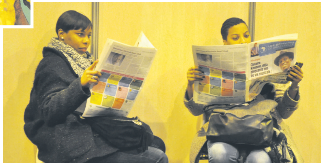
Exceptionnellement imprimées à Paris et distribué sur le stand Livres et Auteurs du Bassin du Congo, Les Dépêches de Brazzaville sont devenues la lecture officielle des visiteurs, à l'image de ces deux jeunes femmes, ici en pause dans les coulisses du Parc des expositions de la Porte de Versailles