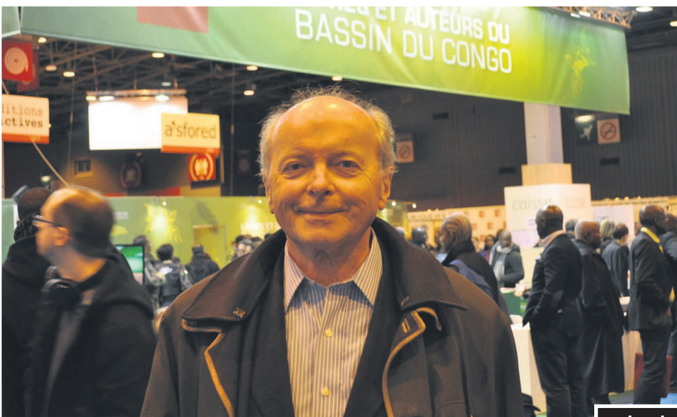
Intervenant en 2011, Jacques Toubon, le Défenseur des Droits, est passé saluer l'équipe du Stand Livres et Auteurs du Bassin du Congo