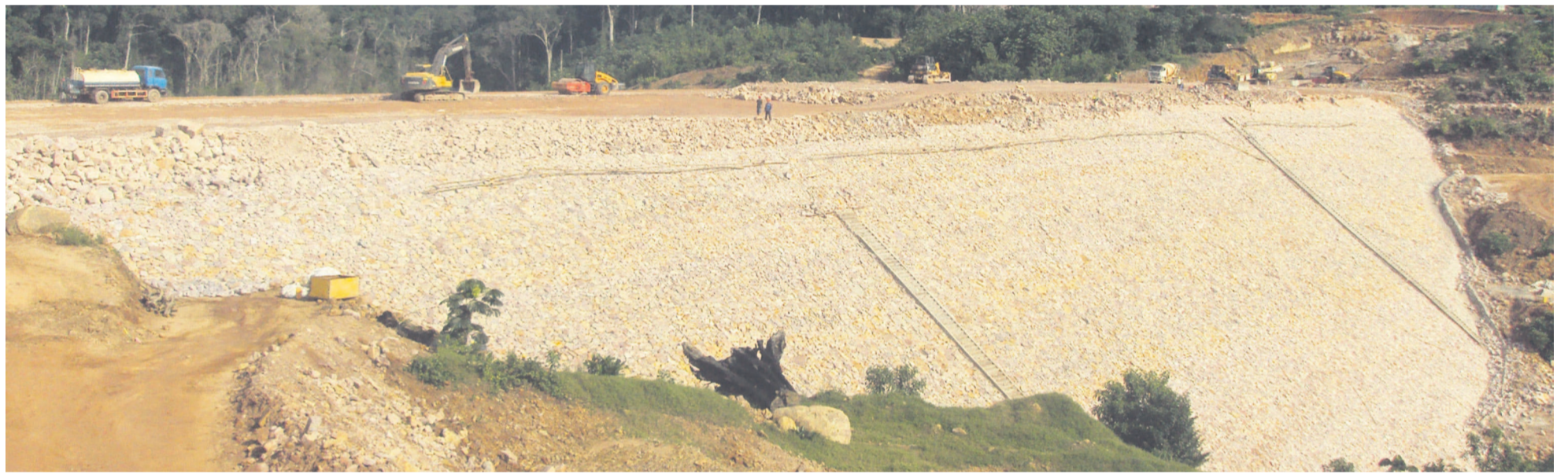
La digue du barrage de Liouesso

Les travaux de la centrale hydroélectrique de Liouesso avancent normalement et devraient voir leur terme courant mai-juin 2016. Une délégation conduite par les ministres Jean Jacques Bouya et Henri Ossebi en charge, res-