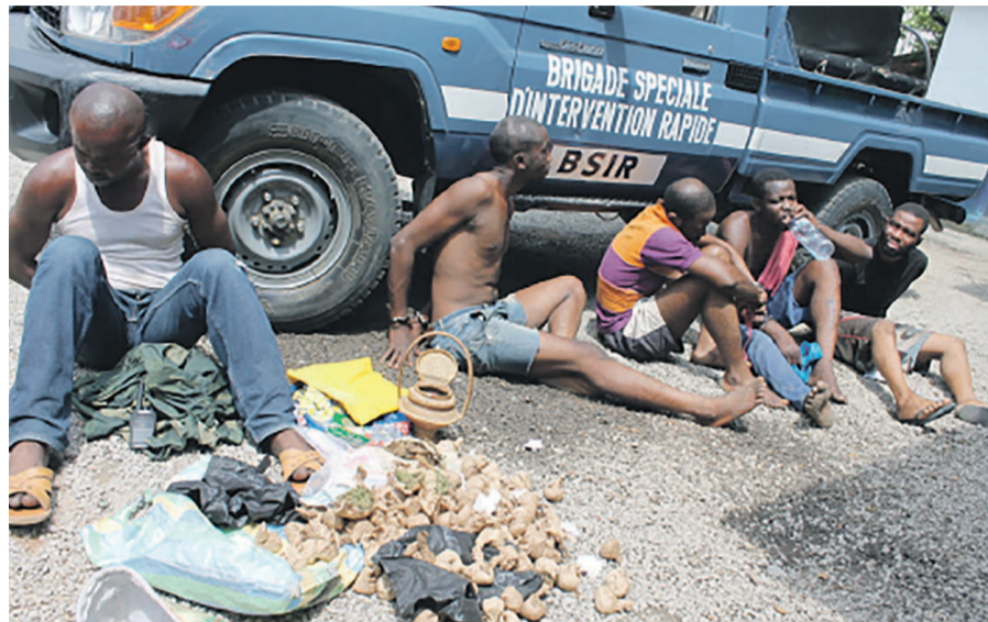
Les braqueurs entre les mains de la police

Les malfaiteurs ont été présentés le 20 mars à la presse au siège de la Direction départementale de la police du Kouilou.