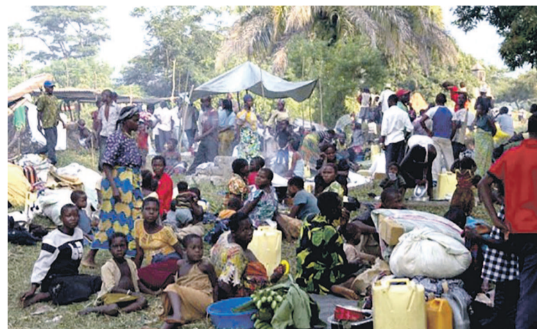
Des réfugiés dans un camp, dans l'est de la RDC