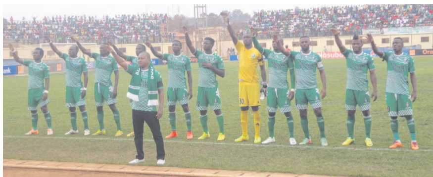
Les Léopards au stade de Dolisie

Avant de rentrer en lice en compétition africaine, l'AC Léopards de Dolisie a bénéficié d'une mise au vert de quelques jours au Cameroun. Pour le match retour des seizièmes de finale, le 5 avril à Dolisie contre Gor Mahia du Kenya, il n'en sera pas question.