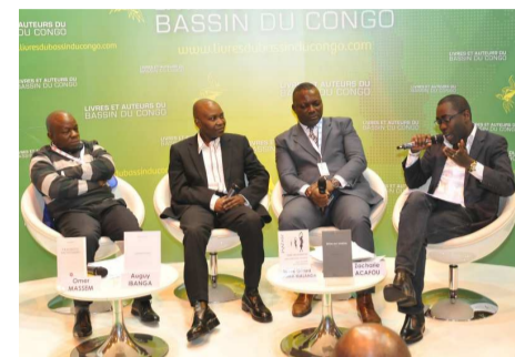
Les grands noms d'aujourd'hui ont parlé des grands noms d'hier lors de la table ronde Soixante ans de poésie congolaise

Pour les trois poètes, réunis sur le Stand Livres et auteurs du Bassin du Congo, la poésie congolaise reflète l'identité du pays, entre tradition, enracinement et ouverture au monde. Elle s'inspire des éléments qui