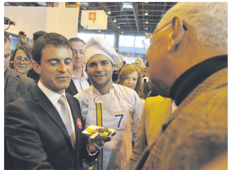
Manuel Valls reçu par Henri Lopes sur le Stand Livres et Auteurs du Bassin du Congo

Le week-end a connu plusieurs événements marquants, dont la remise du Prix Mokanda et la visite du Premier ministre français, Manuel Valls. Cette trentième édition du Salon du