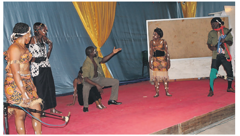
La troupe théâtrale Les Pétroliers sur scène

À Brazzaville, deux groupes de théâtre vont se démarquer des autres : le Théâtre d'Union Congolais (T.U.C) et l'ASTHECO (As-