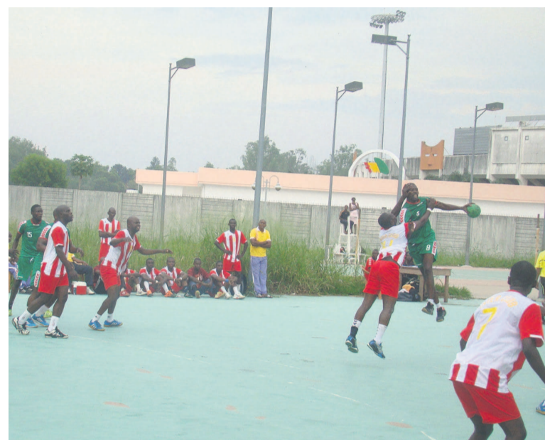
Une offensive de Caïman stoppée

dames de Patronage, quant à elles, ont courbé l'échine devant ASEL 26 contre 46. Toujours dans cette version et catégorie, Abo-Sport a pris le dessus sur Cara. Le jeudi 26 mars, le tour reviendra à AVR et Diabes noirs d'en découdre, dans la version des séniors hommes pour le pre-