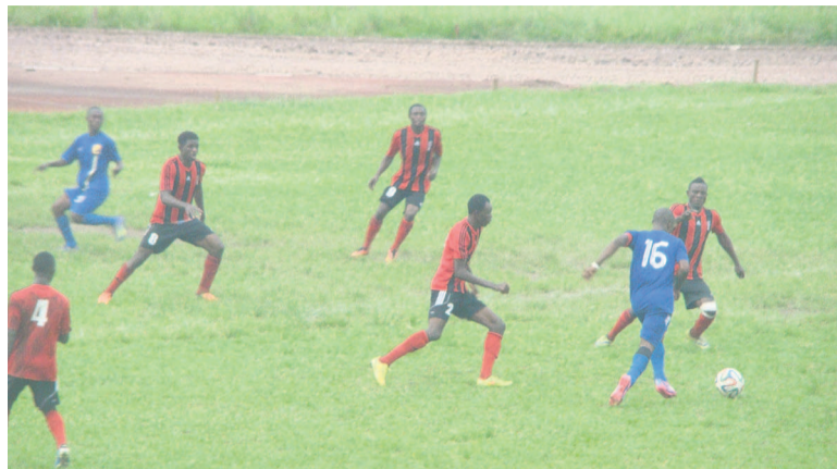
Une phase de jeu JST-CARA

La Jeunesse Sportive de Talangaï (JST) a pris le dessus sur le Club Athlétique Renaissance Aiglons (Cara), 1-0, en clôture de la 16ème journée de la compétition.