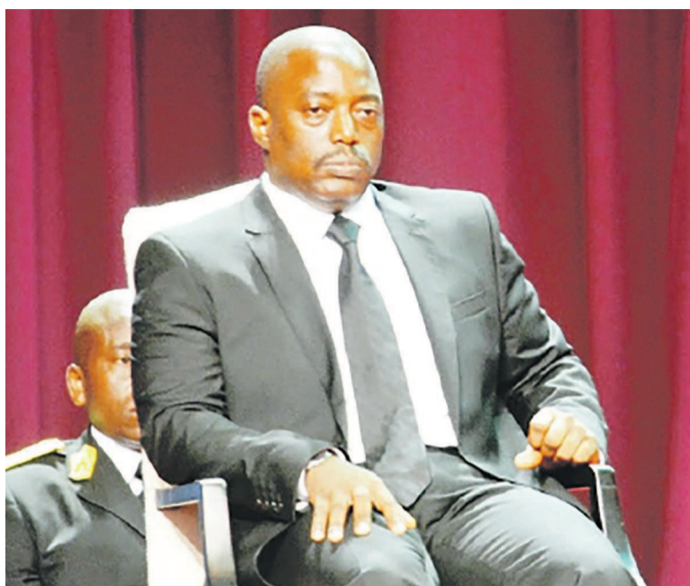
Le président Joseph Kabila

Certaines sources allèguent que Joseph Kabila - donné pour non partant à la présidentielle de 2016 au regard de la Constitution qui limite à deux le mandat présidentiel - se préparerait finalement à lever un coin de voile sur le choix de son dauphin en perspective de