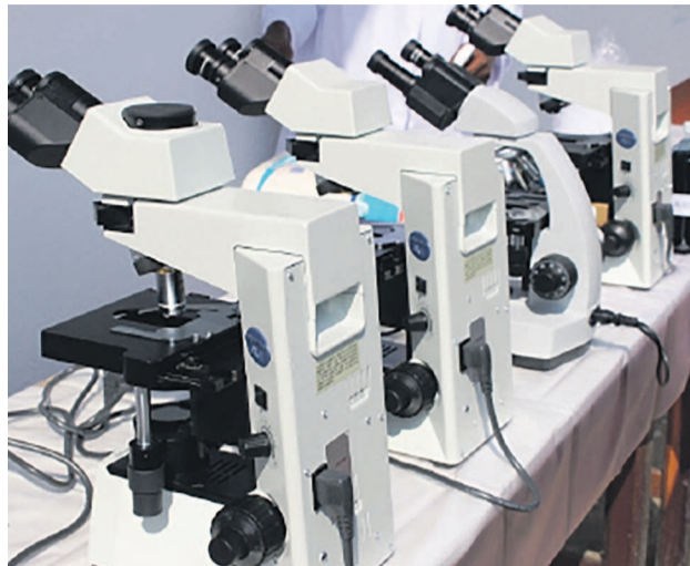
Des équipements du centre CPRK 2

Toutefois, fait savoir le ministre de la Santé publique, malgré les efforts fournis par le gouvernement dans la lutte contre cette maladie qui se manifeste par la gratuité des soins pour quiconque est dépisté tuberculeux et ce, depuis 2002; la déclaration de la tuberculose comme urgence nationale en 2006 et le décaissement des fonds en contrepartie pour l'achat