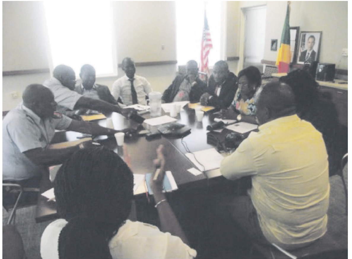
Des journalistes congolais participant à la conférence téléphonique à l'ambassade des USA au Congo