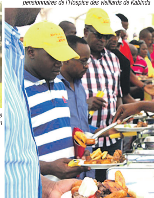
L'ambiance a été festive lors de l'activité de DHL Africa As One

L'équipe du projet « DHL Africa As One » effectue un séjour d'une semaine à Kinshasa en RDC, dans le cadre du grand et ambitieux voyage que les sept membres de cette équipe ont entrepris pour faire découvrir le rugby sur le continent africain. Partenaire logistique officiel de la Coupe du monde de rugby 2015 en Angleterre, le géant de l'expédition des colis dans le monde, à travers le projet Africa As One, parcourt quarante-cinq pays pour faire la promotion du rugby en Afrique, et pour apporter toute la splendeur de l'Afrique. Tout a débuté en octobre 2014 à Cape Town en Afrique du Sud, pays de la balle ovale, et s'achèvera en septembre 2015 en Angleterre.