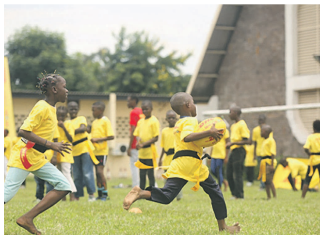
Les enfants s'initient au rugby à Kinshasa grâce à DHL Africa As One