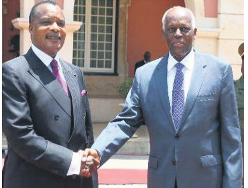
Denis Sassou N'Gusso et José Edouardo Do Santos

Parallèlement, les délégations ministérielles des deux pays ont examiné, au cours d'un conclave, des accords envisagés pour donner un nouveau souffle à la coopération bilatérale. Page 3