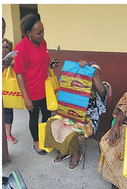
Agent de DHL remettant un pagne à une pensionnaire de l'Hospice de Kabinda