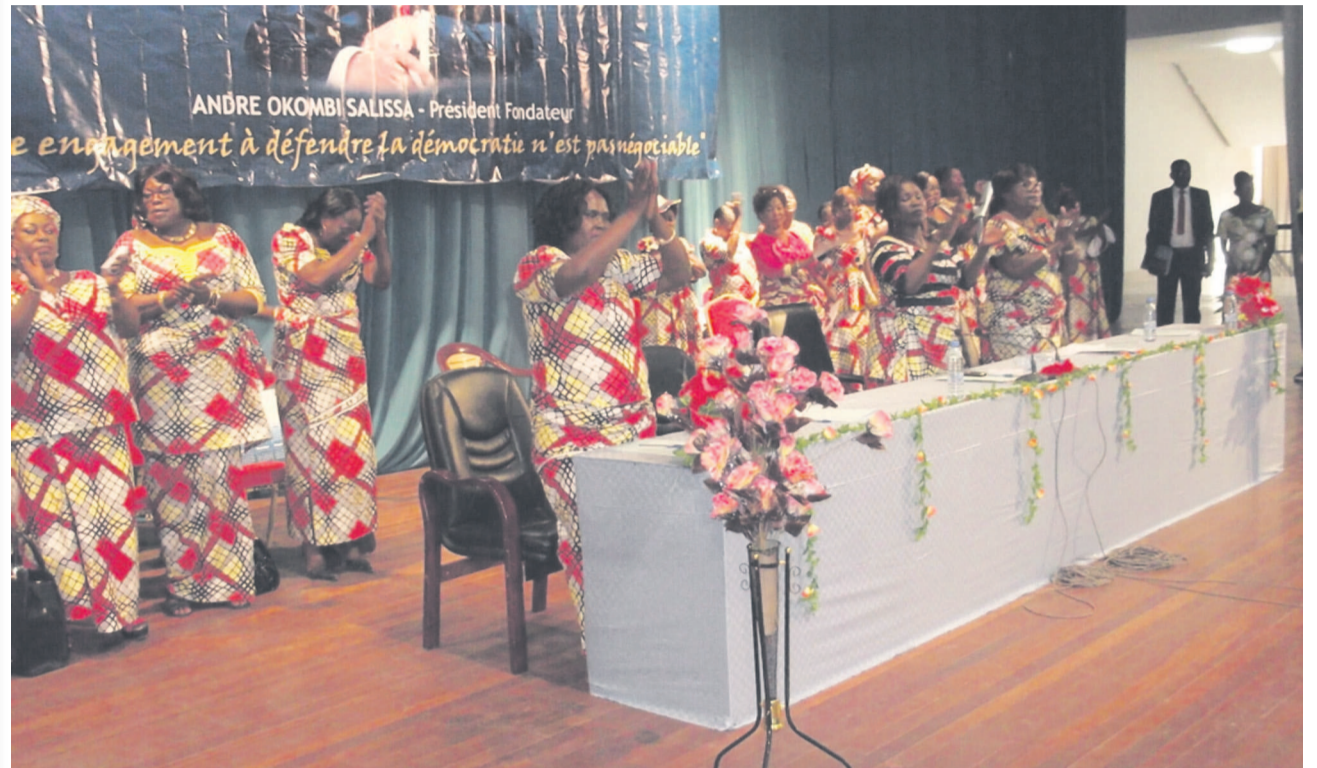
Une vue des membres du comité national de la CADD

Le comité féminin de la Convention pour l'action, la démocratie et le développement (CADD) s'est réuni le 29 mars à Brazzaville. Les femmes ont échangé sur le thème « l'Alternance politique, une exigence démocratique ».