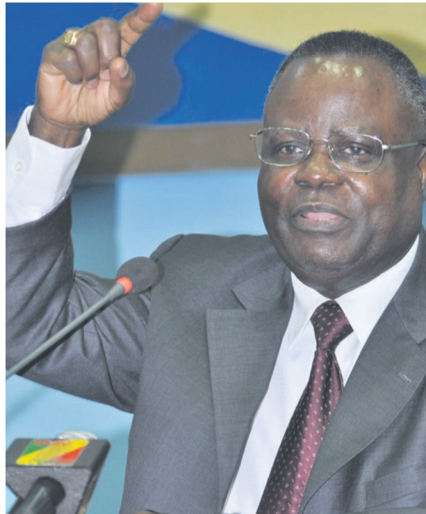
Mathias Dzon (Président de l'ARD)

Il y a quelques semaines, l'opposition invitait instamment le président de la République à convoquer pour le mois de mars passé, le dialogue tant espéré. Elle en fixait aussi l'ordre du