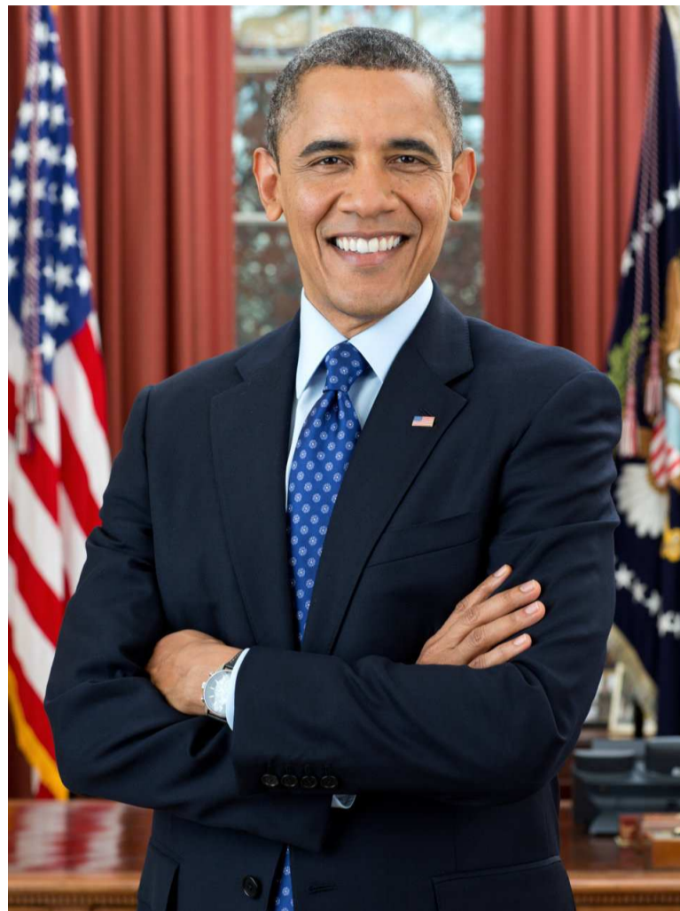
Le président américain Barack Obama

politique et l'économie ou bien la sécurité dans la région, des observateurs projettent une vive déclaration version président Obama sur la situation des droits de l'homme. Déjà en 2006, Barack Obama alors sénateur de l'Illinois, s'était rendu au Kenya. À cette occasion, dans un discours tenu devant les étudiants à Nairobi, il avait décrié la corruption régnant comme « monnaie courante » dans le pays. Le gouvernement de l'époque, dirigé par Mwai Kibaki, avait mal apprécié ses propos, indiquant que le sénateur démocrate « avait insulté les Kényans sur des sujets sur lesquels il était très mal informé ». Cette visite permettra en effet au dirigeant noir américain, de renouer les contacts avec ses frères kényans. Interrogé à ce propos, l'exécutif américain a assuré que ce déplacement serait « une nouvelle occasion de dialoguer avec le gouvernement et la société civile », rapporté par l'AFP. Pour cela, la Maison blanche n'exclut pas des éventuelles rencontres entre Obama avec les membres de sa famille. Il rendra une visite symbolique à « Mama Sarah », qui fut la troisième femme d'Hussein Onyango Obama, grand-père paternel