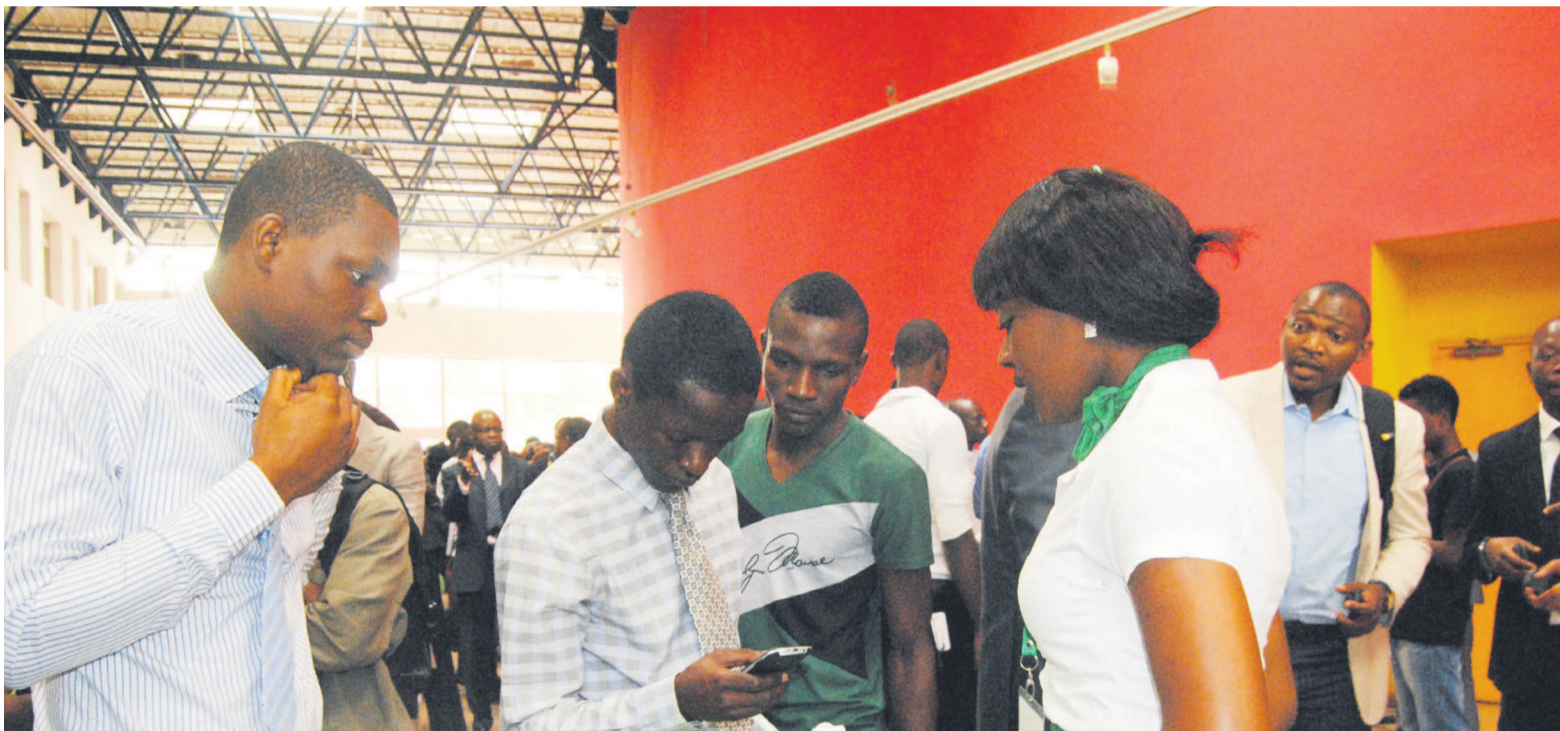
Les réflexions autour des droits des consommateurs dans le secteur des TIC battent leur plein