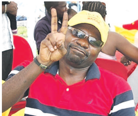
Client satisfait de l'action de DHL