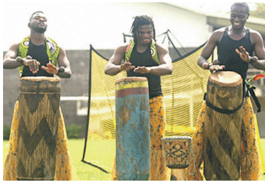
Batteurs de tam-tam du groupe de danse qui a presté à la manifestation