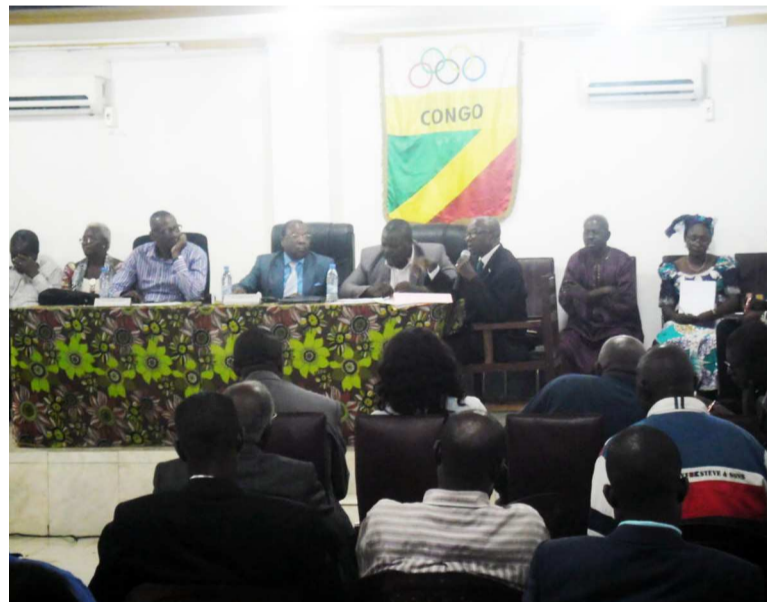
Les membres du CNOSC analysant le programme d'activités

Par ailleurs, en vue de la célébration de la journée olympique 2015, en juin prochain, le comité prévoit une série de manifestations de masse. L'objectif visé est de vulgariser les idéaux du mouvement olympique. Cette journée sera célébrée à Ouesso, chef-lieu du département de la Sangha. Administrativement, le CNOSC prendra part à plusieurs forums pour apporter sa pierre à l'édification de la concertation mondiale et continentale sur le mouvement olympique. S'agissant du fonctionnement de ses commissions spécialisées, le comité envisage rationaliser leur animation en les redynamisant et en redéfinissant