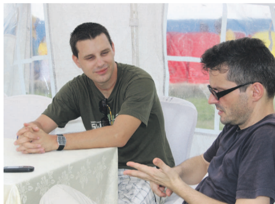
Les partenaires de DHL invités à l'action d'Africa As One