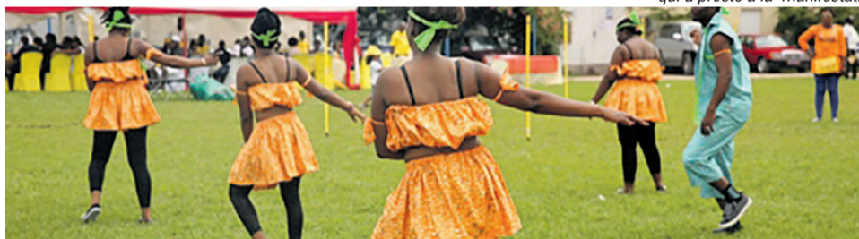
Groupe de Danse du personnel de DHL a agrémenté l'événement