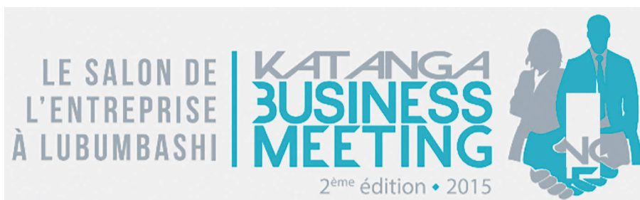
Le logo de l'événement

Le Katanga Business Meeting (KBM) est considéré comme la plus importante rencontre d'affaires de la région. Cet événement, soulignent les organisateurs, a pour objectif d'offrir un espace de rencontre pour les petites et moyennes entreprises et celles de grande taille afin d'engendrer des opportunités concrètes d'affaires et de favoriser l'émergence d'un réseau professionnel polyvalent et complémentaire. Les neuf secteurs d'activités les plus émergents de la région sont représentés, à savoir agriculture, automobile et équipement, banques et finance, infrastructure et construction, IT et télécoms, mines et industries, services aux particuliers, services