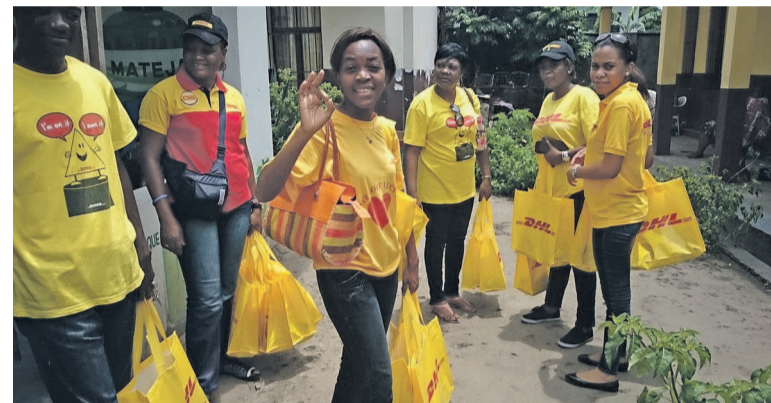
Agents féminins de DHL remettant des pagnes aux femmes pensionnaires de l'Hospice des vieillards de Kabinda