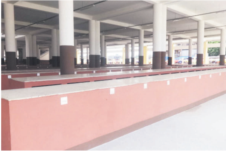
L'étal de la denrée, viande de bœuf fraîche

Le mythique marché continue à ali- celui qui avait cédé la table.