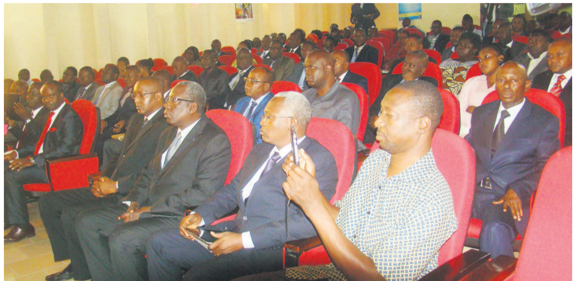
Une vue des participants à la formation sur la passation des marchés publics

L'objectif étant de leur permettre d'acquérir de nouvelles compétences techniques qui leur per-