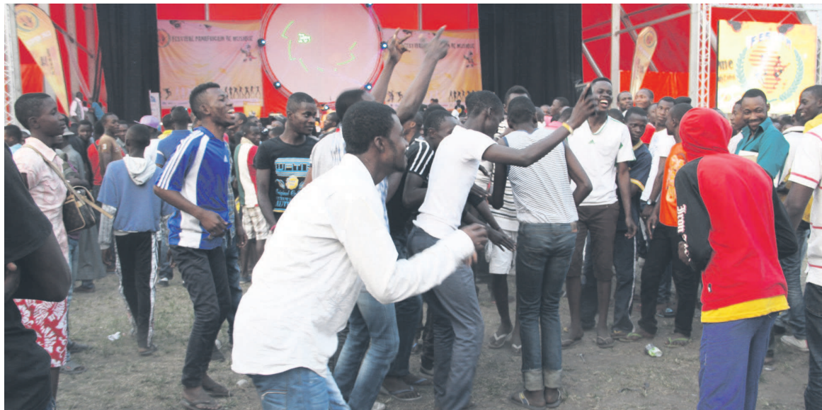
La joie des Brazzavillois lors d'une des éditions du spam