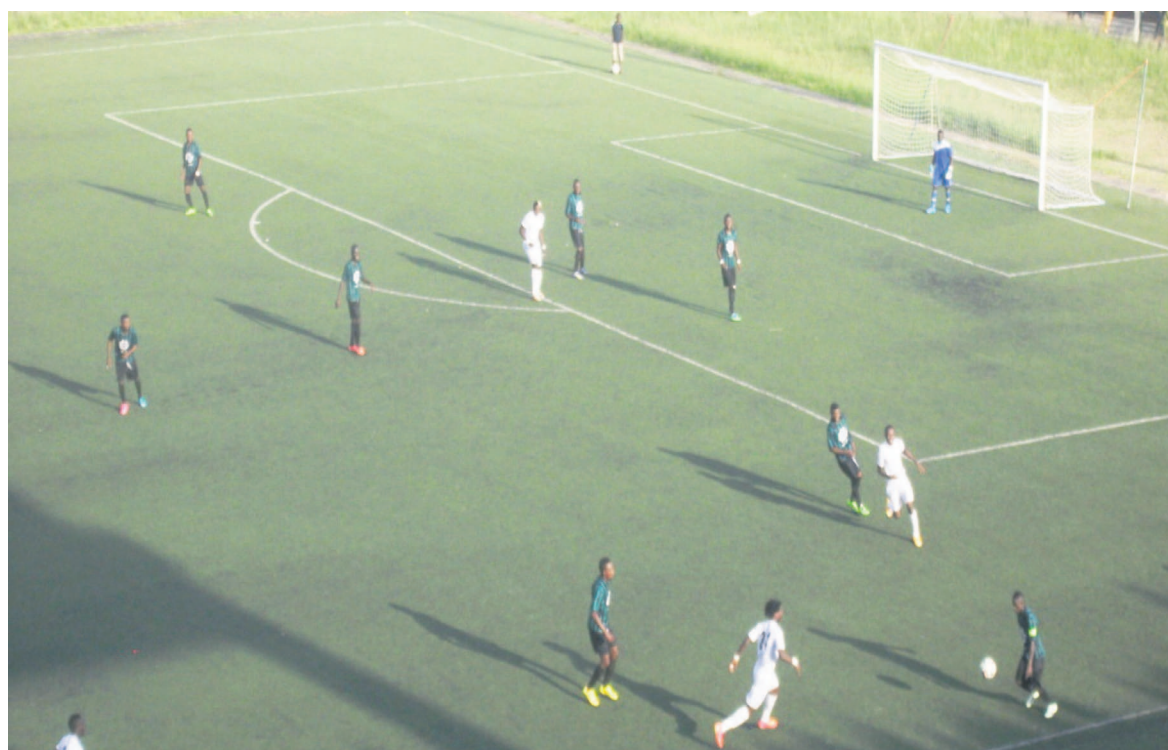
Un extrait du match Diabes noirs vêtus en blancs et VC Club Mokanda en vert noir

Battu 0 - 2 le 18 avril au Complexe sportif de Pointe-Noire par Diable noirs, V.Club Mokanda régresse d'une marche au classement provisoire du championnat national de football d'élite alors que son tombeur en a gagné trois