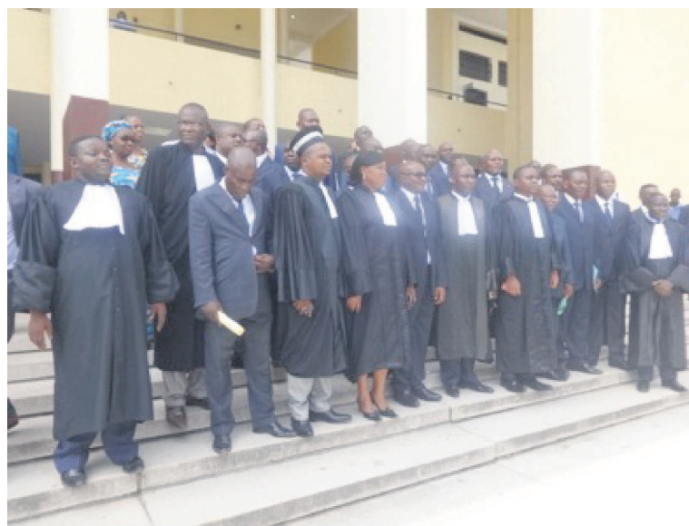
Les inspecteurs de l'Anac et les magistrats

La fonction d'inspecteur au sein de l'agence nationale de l'aviation civile (Anac) a toujours existé. Cependant, ceux qui l'exercent n'étaient pas en conformité avec le Code Cémac sur l'aviation civile, qui exigeait la prestation de serment. Le tort a été réparé avec l'acte d'engagement pris par 28 inspecteurs, dont le directeur général de l'Anac.