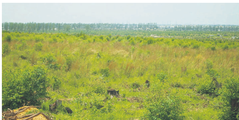
Vue d'un relief avec une petite forêt plantée et une autre poussant naturellement

En rapport avec cette journée, le secrétaire général de l'Organisation des Nations unies, Ban Ki-moon, demandait à la population mondiale en 2014 de prendre soin de notre terre nourricière : « Prenons soin de notre terre nourricière, afin qu'elle puisse continuer à prendre soin de nous, comme elle l'a fait pendant des millénaires ». Et de son côté, en mars 2005, l'Unesco publiait la première évaluation des écosystèmes pour le millénaire, un rapport accablant sur l'impact de l'homme sur la planète. Car il