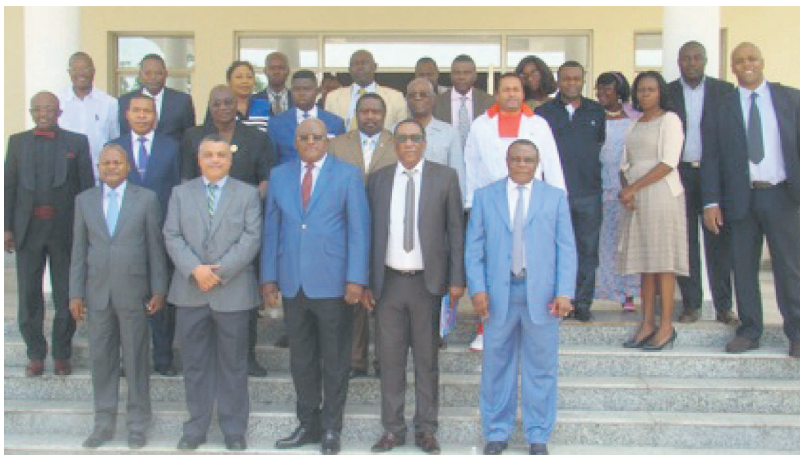
Les membres de l'ORAD, de l'AMA, du COJA en compagnie du ministre des Sports

de l'ORAD se poursuivent à Brazzaville. C'est le 22 avril que les conclusions desdits travaux