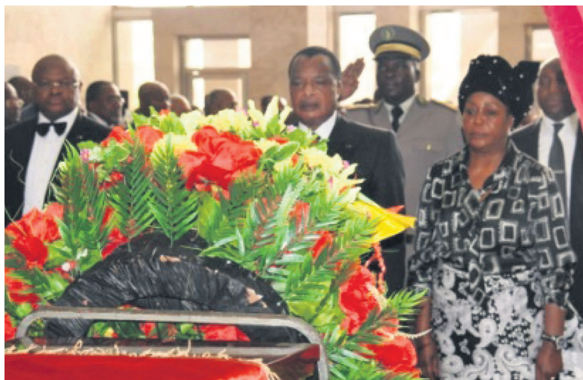
Le chef de l'État et son épouse se recueillent sur la dépouille au Palais des congrès