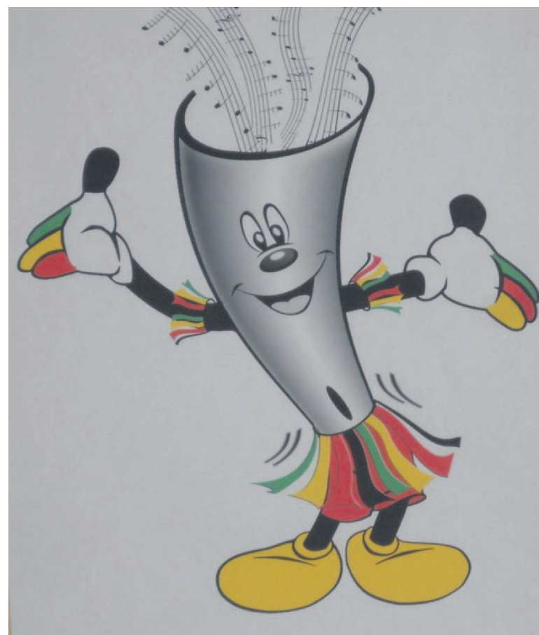
La mascotte du Fespam 2015