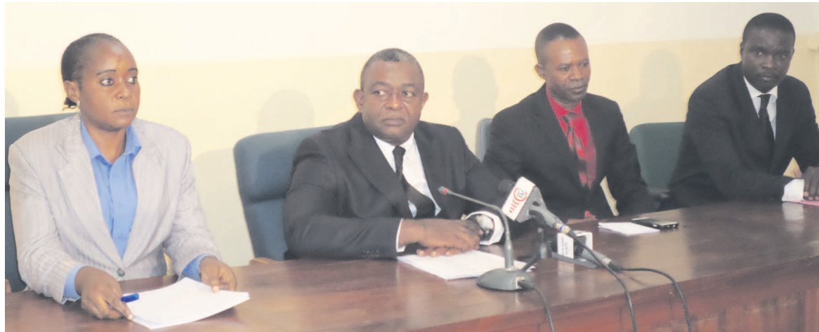
Le présidium des travaux

Selon les participants à cette rencontre qui s'est déroulée au Centre d'informations des Nations unies, le dialogue permettrait de trouver un compromis national sur les problématiques liées à la réforme constitutionnelle et institutionnelle ainsi qu'à la gouvernance électorale et démocratique. « La société civile a relevé qu'en cette phase