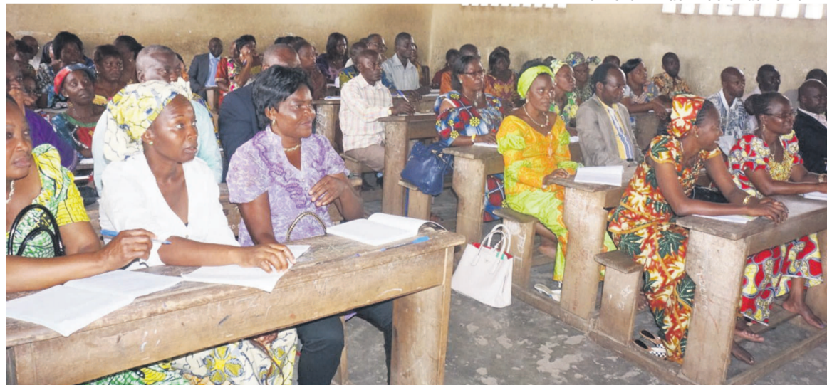
Les participants au séminaire

n'est pas frappé par la fièvre à virus Ebola, les connaissances acquises pendant ce séminaire