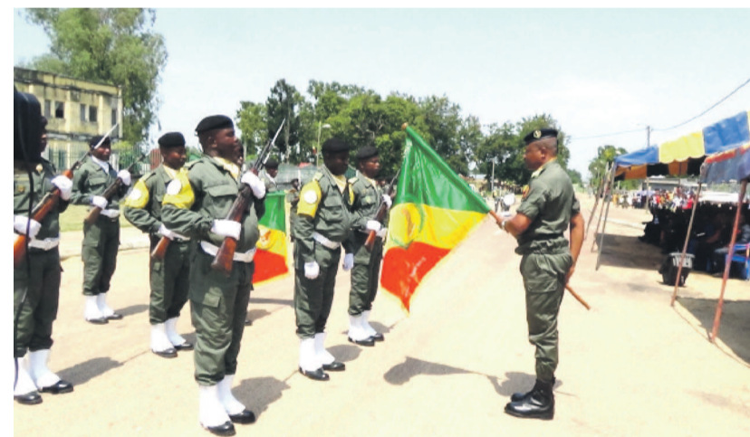
Vue de la remise du fanion de la zone au nouveau commandant