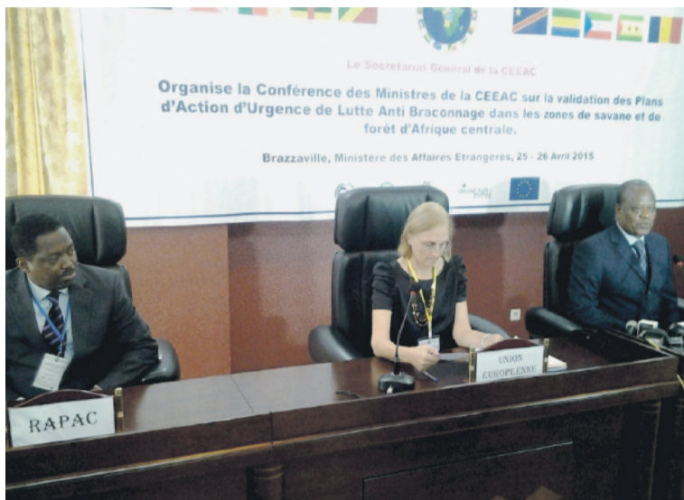
Le présidium lors des travaux

Parmi ceux-ci on note, un important réseau d'aires protégées couvrant 37 millions d'hectares créé dont, 4,5 millions d'hectares de nouvelles zones