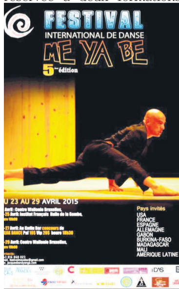
L'affiche de la 5e édition du Festival international de danse Me Ya Be

Le centre culturel belge qui va servir de cadre à l'ouverture et à la fermeture de l'événement de la Compagnie Jacques Bana Yanga, le 29 avril, accueillera en tout sept spectacles répartis en trois soirées d'entrée libre. À savoir que celle du 28 avril, la seconde du CWB est réservée à deux formations