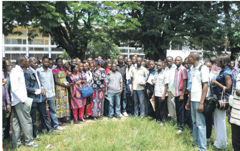
Les diplômés des écoles professionnelles menacent

« Le cas contraire nous contraindra à des manifestations et cortèges à l'endroit des ministères de l'Économie et des finances, de la Fonction publique, et de l'Enseignement primaire et secondaire, conformément à l'article 16 de la Charte des droits et libertés du 29 mai 1991, issue de la Conférence nationale souveraine. Nos manifestations ne cesseront que si le dernier des diplômés est recruté et affecté », ont-ils menacé, espérant sur l'implication du chef de l'État ainsi que du gouvernement. Rappelons que le problème de recrutement à la Fonction publique se pose avec acuité ces derniers temps. Des dossiers sont bloqués à certains endroits. Des finalistes et décisionnaires de certaines administrations publiques ne cessent de faire de l'agitation au niveau