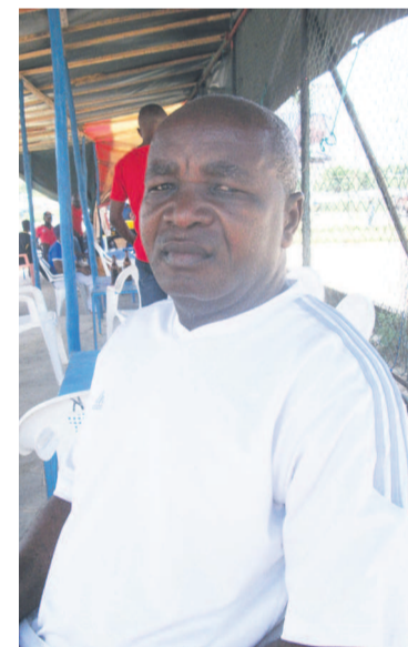
René Mampassi

À la différence des autres disciplines où la qualification des clubs au championnat national dépend des résultats du championnat départemental, à la pétanque tous les clubs, malgré le classement du championnat départemental, présentent une triplette. Pour le cas de Pointe-Noire, les six clubs présenteront chacun une triplette au championnat national. René Mampassi a, en effet, souligné le bon niveau des boulistes ponténégrins. Ces derniers avaient remporté le concours des meilleurs tireurs lors de la dernière édition du championnat national à Brazzaville en occupant les deux premières