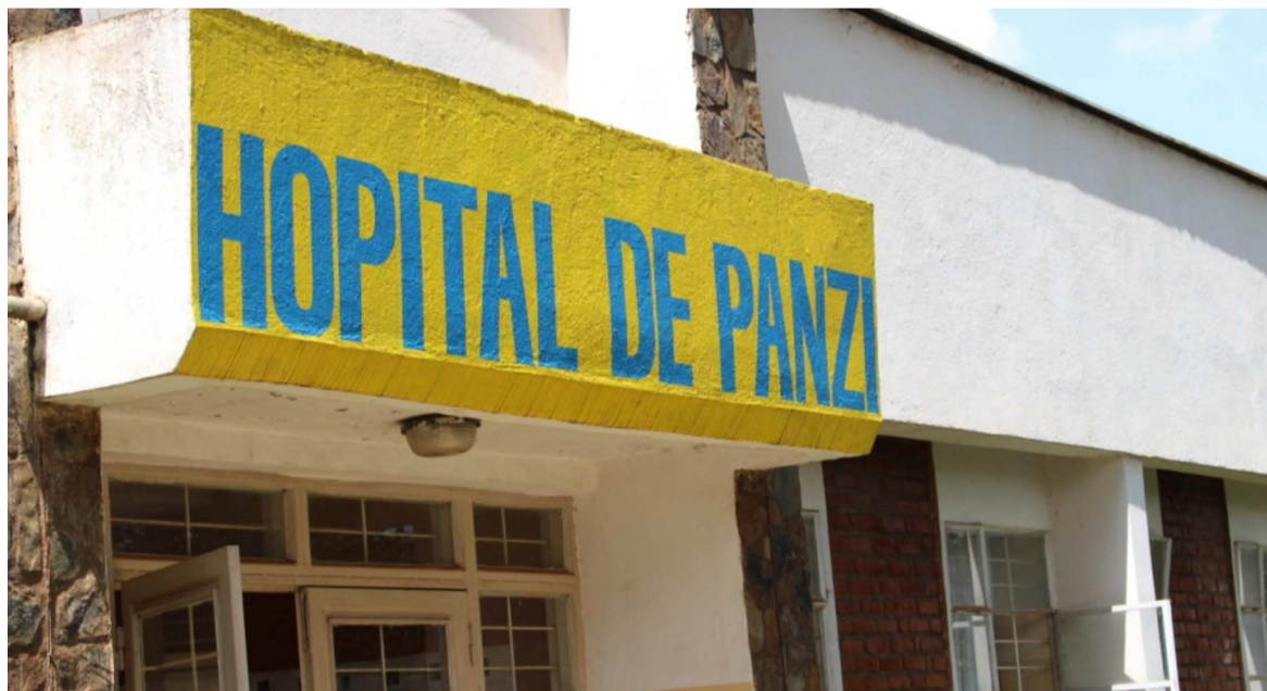
L'entrée principale de l'Hôpital général de référence de Panzi

nancière a dit avoir procédé légalement à un recouvrement forcé de l'impôt professionnel sur la rémunération que cet hôpital devait au Trésor public. Des actions du personnel de cet hôpital, des