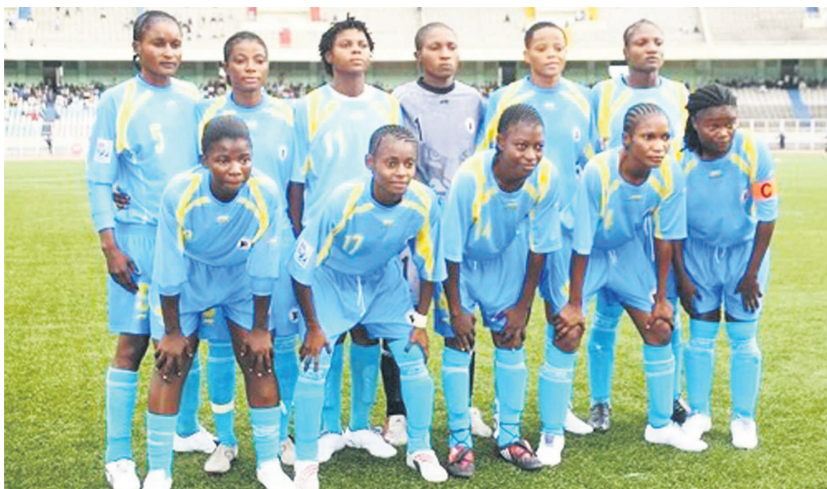
Léopards dames U20 à l'entraînement au stade Tata-Raphaël de Kinshasa

avec ces dames des moins de 20 ans depuis le 20 avril avec la première séance d'entraînement de la sélection féminine U20, enclenchant la préparation des éliminatoires. Pour la première séance des entraînements organisée au Centre technique Kurara Mpova de la Fécifa située dans la périphérie de la capitale sur la Nationale 2 allant vers la province du Bandundu, trente-six joueuses ont répondu présentes à la convocation du sélectionneur. En attendant les joueuses présélectionnées en provenance des provinces, la deuxième séance s'est déroulée le mardi au stade Tata-Raphaël. « Nous avons commencé les séances pratiques depuis lundi. Compte tenu du temps, nous organisons trois journées de présélection parce qu'il y a un noyau ici à Kinshasa. Il y a d'autres joueuses qui doivent venir de Mbuji-Mayi, Lubumbashi et Goma. On fait des oppositions entre elles. Après, on fera des oppositions avec des équipes