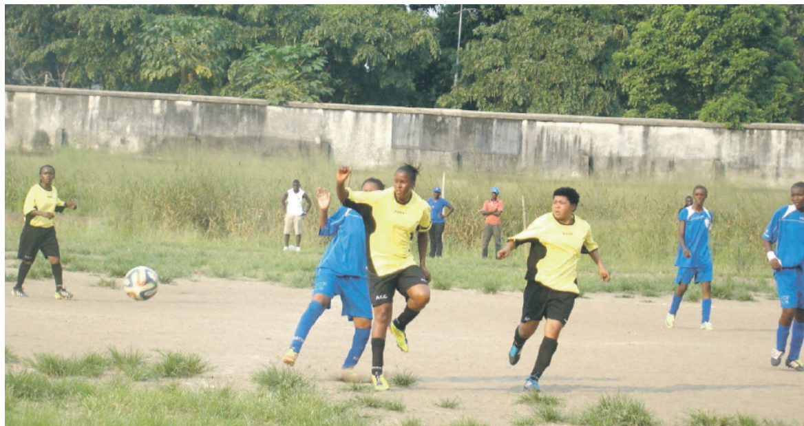
Une phase de jeu de la rencontre / crédit photo Adiac

Les Colombes l'ont emporté en match d'ouverture 1-0 devant FC La Source.