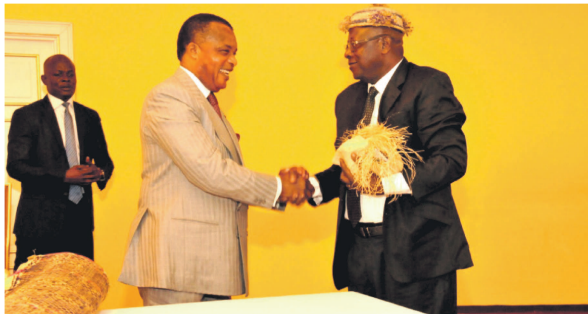
Le chef de l'État saluant un membre de la délégation

Dans le rapport des travaux rendu par le ministre Anatole Collinet Makosso, il en est ressorti la position des Kouilois et Ponténégrins sur le débat relatif au changement ou non de la Constitution du 20 janvier 2002,