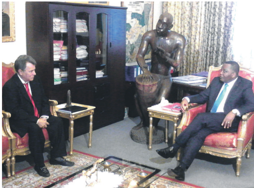
Le ministre congolais de la Culture et l'ambassadeur de Cuba en République du Congo

noncer que la troisième mission d'expertise se rend à Mbé ce 25 avril pour voir les conditions du lancement national à Mbé. Ce n'est qu'après cette visite d'expertise que sera fixée la date du lancement national de