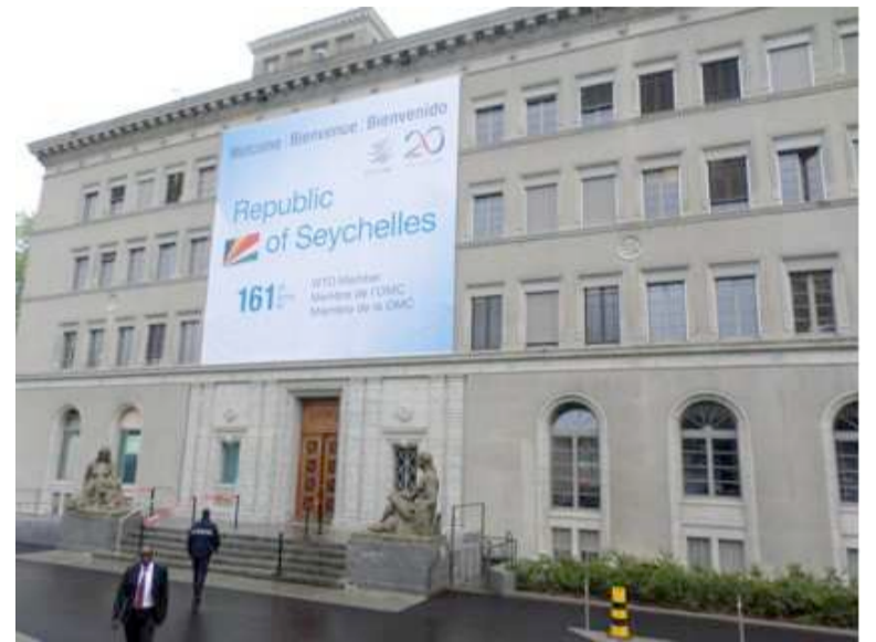
Vue du siège de l'Omc à Genève

jour du programme. Il s'agit, entre autres du programme de renforcement des capacités des institutions d'appui au commerce des États membres, du programme femmes et commerce conçu pour améliorer les perfor-