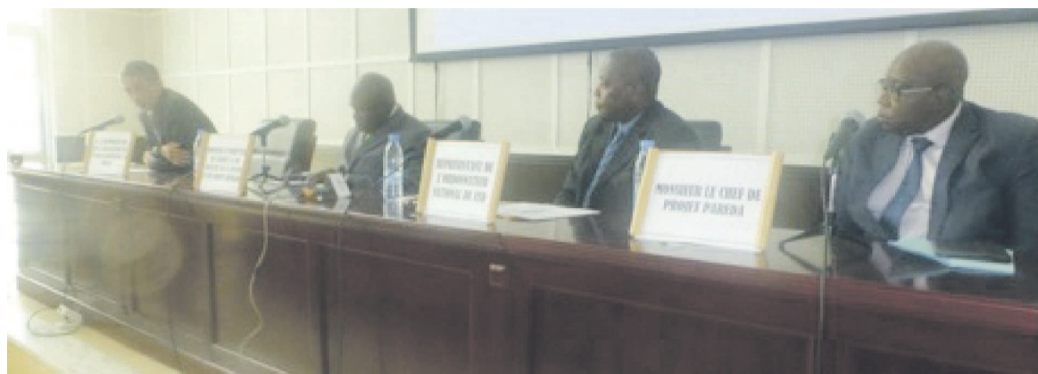
Le Présidium des travaux

La deuxième phase du Projet d'action pour le renforcement de l'État de droit et des associations (Pareda) démarre ses activités dans quelques jours. L'information a été donnée le 4 mai à Brazzaville à l'occasion de la cérémonie de clôture de la première phase de ce projet qui avait été pilotée par M. Mahamad Saleh Ben Biang.