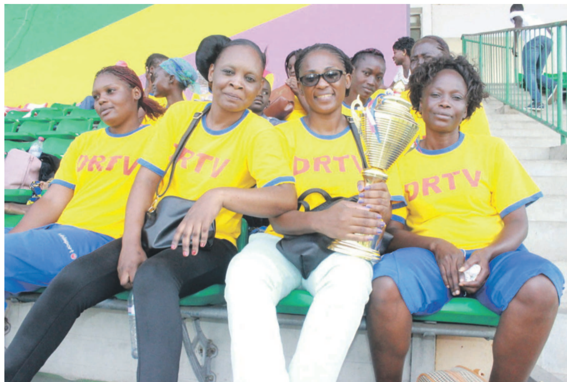
L'équipe de la DRTV après la réception du trophée

Les six équipes engagées au football à savoir: Soco, Congo Terminal, Ilogs, Solidera, LCB toutes de Pointe-Noire et la CNSS de Brazzaville étaient réparties dans deux groupes de trois. Soco a pu tirer son épingle de jeu dans le groupe A en s'imposant tour à tour, face à Ilogs, 5-1 et la LCB, 2-1 tandis que son adversaire, la CNSS s'est qualifiée après son match nul contre Solidera, 1but partout et le forfait contre Congo Terminal qui ne s'est pas présenté 3-0. à l'issue de ces matches de poule les deux équipes du groupe B avaient 4points chacune. Mais la balance a pesé du côté des brazzavillois qui jouaient à l'ex-