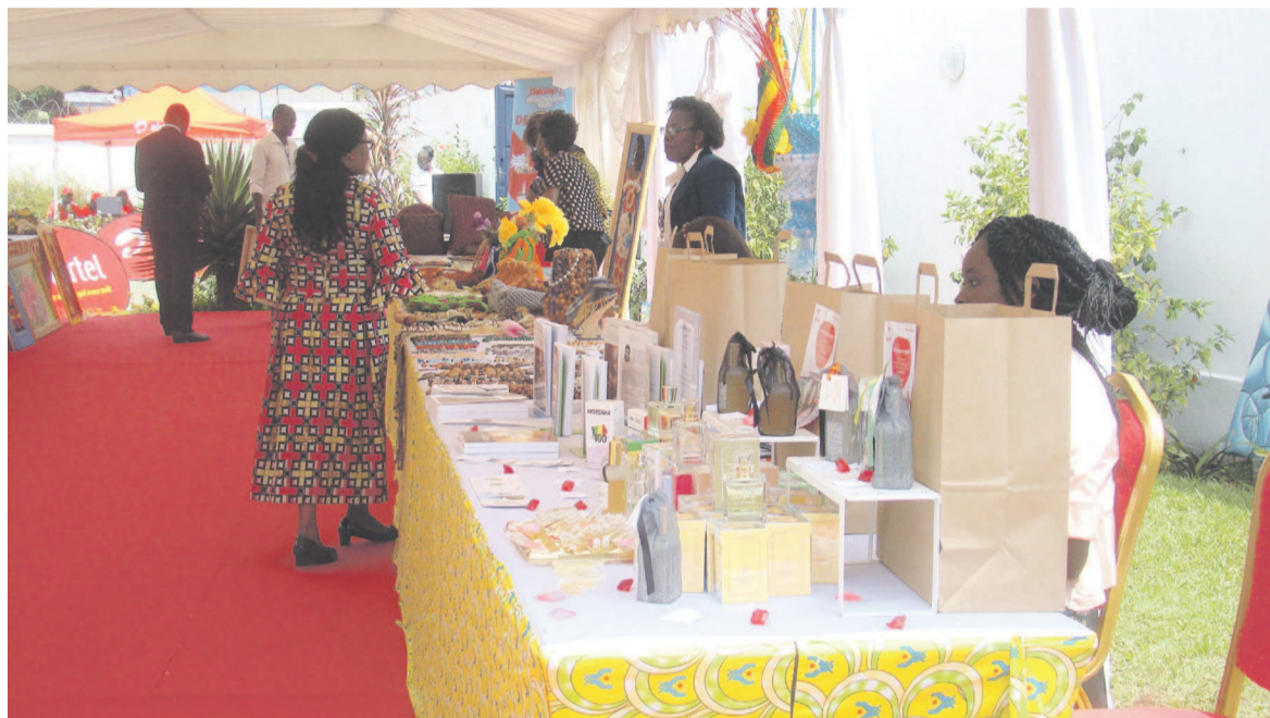
Une vue de l'exposition vente

exposants étalent leurs produits, parmi lesquels des artisans étrangers dont un