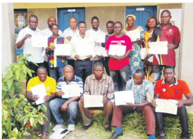
Les participants à l'atelier organisé par BPT