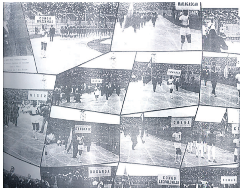
Le défilé des délégations en images

« La participation de tous les pays indépendants d'Afrique, à l'exception d'une ou deux Nations, reflète l'immense intérêt que porte au mouvement olympique ce continent en marche. Une réunion fut organisée entre Comités nationaux au cours de laquelle les participants firent preuve d'un savoir remarquable. Les dirigeants sportifs africains ne sont plus des débutants, tant s'en faut et les règles de l'olympisme et de l'amateurisme leur sont familières. Nous évoquâmes ensemble des questions fondamentales et je ne serais pas surpris qu'étant plus accordés avec la nature et ainsi encore préservés des préoccupations commerciales, les Africains ne nous aident à nous libérer des excroissances parasitaires qui se sont développés autour du sport en cet âge matérialiste que nous vivons. De l'autre côté du fleuve, on voyait les bâtiments de