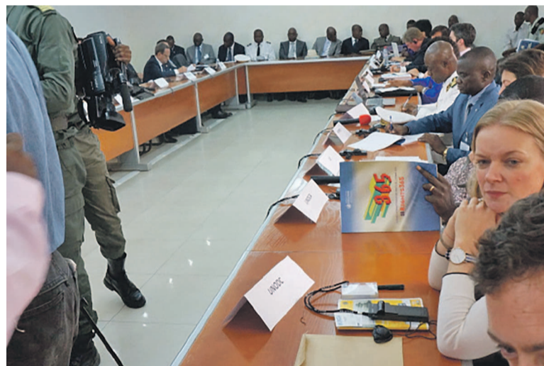
Vue des participants à la réunion

Au cours de cette réunion, les participants planchent sur certains points comme, le potentiel de coordination navale et d'échange d'informations maritimes, la coopération policière, judiciaire et dans le domaine du renseignement, échange d'informations, les présentations par des représentants volontaires des pays du golfe de Guinée. Cette rencontre se fixe divers objectifs notamment le programme du G7++FOGG pour l'année 2015 qui comprendra tous les points énoncés par le sommet de Yaoundé et dans ses trois documents principaux, à savoir : la déclaration des chefs d'Etat et de gouvernement, le mémorandum d'entente et le code de conduite entériné par la CEDEAO, la CEEAC et la CGG. L'objectif sera de soutenir les quatre priorités identifiées dans ces documents notamment les aspects maritimes et navals, la police et justice, les renforcements des capacités, le développement.