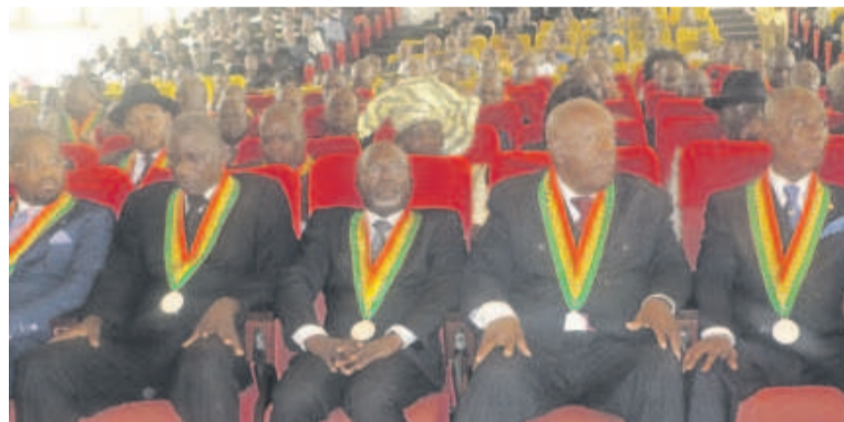
Une vue des conseillers

Ici, les conseillers ont retenu pour leurs débats : la reconnaissance, l'actualisation, le duplicatum, le transfert pour cause de mort, le transfert-donation et le transfert-location-vente ; le projet de