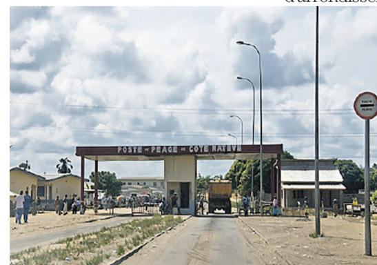
Le poste de péage de Côte Matève

Ainsi, pour les besoins d'élaboration de ce PDL, il était exigé à toutes les collectivités de faire une collecte de données issues de l'état des lieux. Pour ce faire, une commission d'organisation de l'état des lieux a été mise en place et elle a travaillé du 31 mars au 7 mai. Cette démarche participative des conseillers départementaux et municipaux, des maires d'arrondissements et des chefs