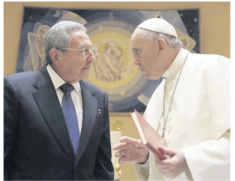
Le pape François s'est entretenu avec le dirigeant cubain Raul Castro