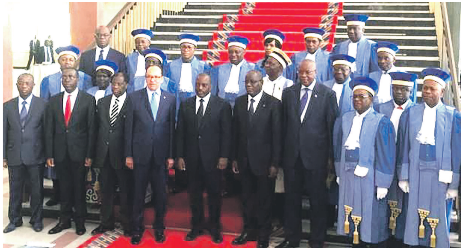
Joseph Kabila posant avec les membres de la Cour constitutionnelle