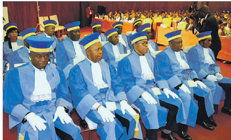
Les membres de la Cour constitutionnelle

Human Rescue a, en effet, relevé l'insistance du législateur sur l'apolitisme de la CNDH ainsi que sur le fait qu'aucun organe national, étranger ou international ne peut lui donner injonction en vue de préserver son indépendance et sa crédibilité. Par cette volonté du législateur congolais, a expliqué cette ONG, la CNDH ne devrait obéir qu'à l'autorité de la loi et œuvrer dans l'objectif d'aider les pouvoirs publics de la RDC à assumer correctement leurs obligations constitutionnelles et conventionnelles en la matière. « Il apparaît donc opportunément impérieux à notre organisation des droits de l'Homme (légalement constituée), de saisir par la présente la plus haute instance judiciaire de notre pays dont la direction vous est confiée, en vue d'obtenir de votre haute juridiction l'annulation pure et simple des élections des membres du Bureau définitif de la CNDH, tenues précipitamment à Kinshasa en