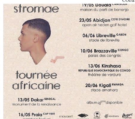
L'affiche de la tournée

bute le 13 mai à Dakar au Sénégal et se terminera le 20 juin prochain à Kigali. Le passage à Kinshasa est prévu pour le 13 juin au théâtre de verdure. Le groupe international de logistique Necotrans s'est engagé aux côtés de Stromae pour assurer les aspects logistiques de la toute première tournée africaine du chanteur, qui se produira dans huit capitales du continent. « Le groupe Necotrans est particulièrement fier de contribuer au succès de cette formidable aventure